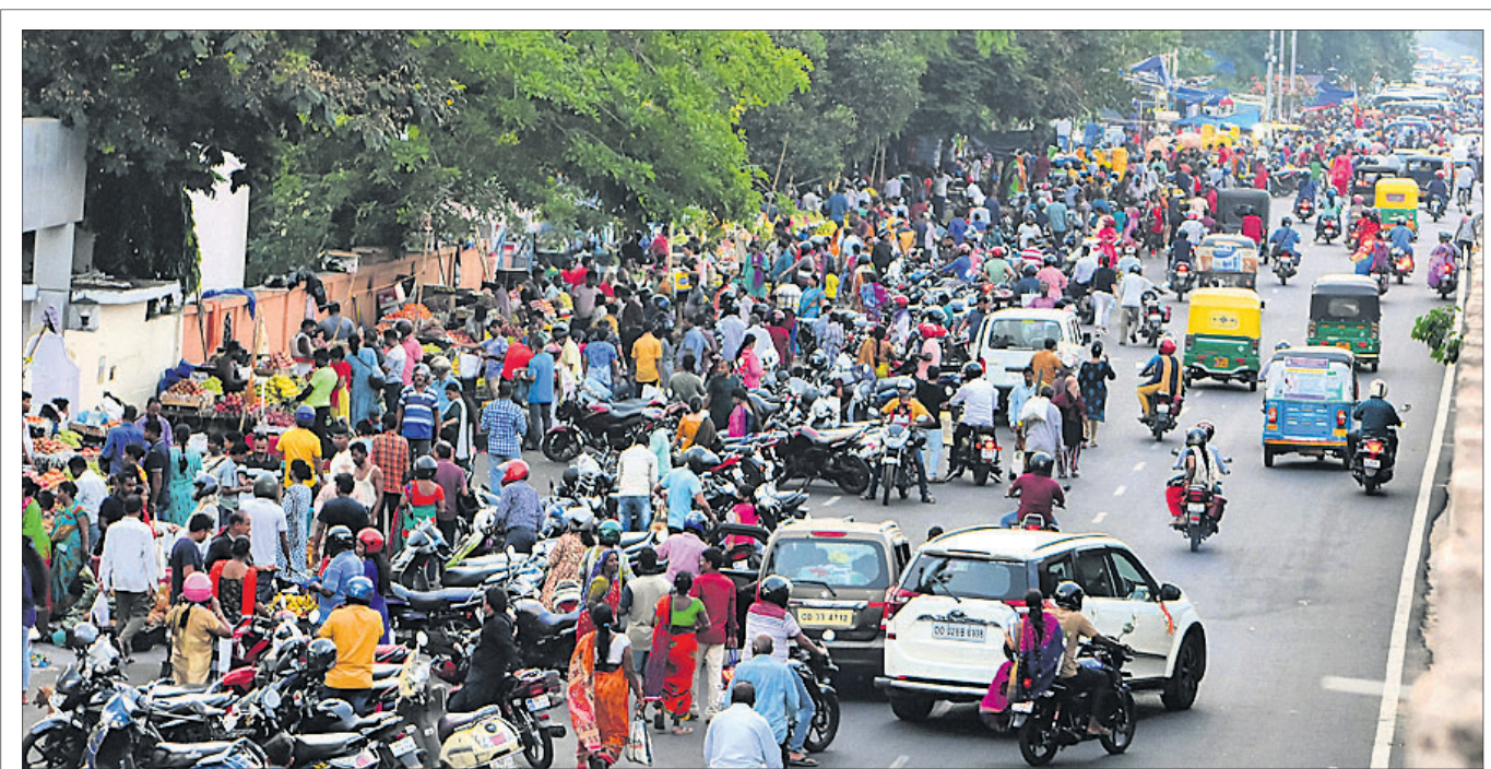
ସାବିତ୍ରୀ ବ୍ରତ ପାଇଁ ରବିବାର ଭୁବନେଶ୍ଵର ଯୁନିଟ୍-୧ ମାର୍କେଟ ସମ୍ମୁଖ ରାସ୍ତା (ବାକମହଲରୁ ଏକି ହଲ)ରେ ଲାଗି ରହିଥିବା ଭିଡ଼।

ନନ୍ଦନକାନନ ପ୍ରାଣାଭିଷେକରେ କୁମ୍ଭୀର ପଶିବା ଚର୍ଚ୍ଚା