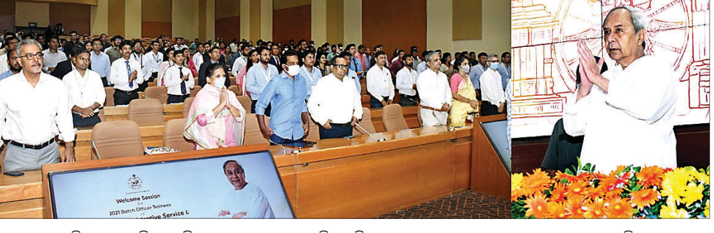
ଶ୍ରୀ ଚନ୍ଦ୍ରରେ ଓଡ଼ିଶା ଆସିଥିବା ୧୮୧ ଆଇଏଏସ୍ ଶିକ୍ଷାନବିସକ୍ଷ ମୁଖ୍ୟମନ୍ତ୍ରୀ ନବୀନ ପଟ୍ଟନାୟକ ସାଗର କରୁଛନ୍ତି।