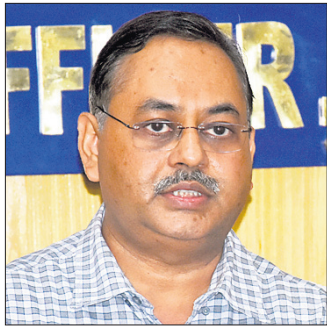
ରାଜ୍ୟ ମୁଖ୍ୟ ନିର୍ବାଚନ ଅଧିକାରୀ ପୁଣ୍ଡାଳ କୁମାର ଲୋହାନୀ