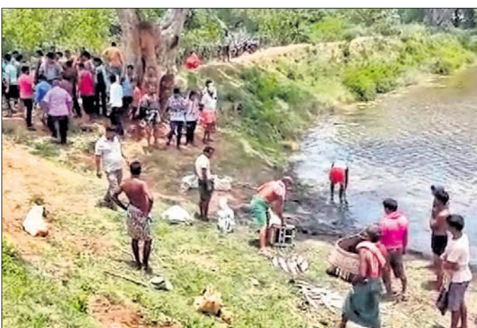
ପୋଖରୀରୁ ମାଛ ମରାଯାଇଛି।