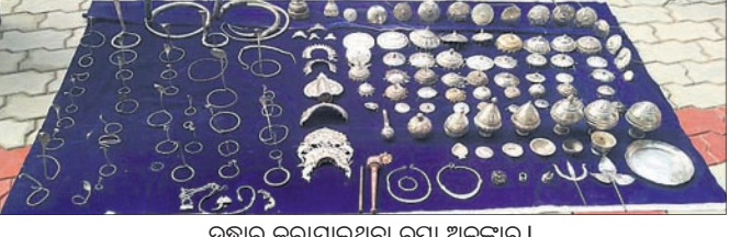
ଉଦ୍ଧାର କରାଯାଇଥିବା ରୁପା ଅଳଙ୍କାର। ବୌଦ୍ଧ, ୨୯।୫ (ସ୍ଵ.ପ୍ର.)

ବୌଦ୍ଧ ସୌନ୍ଦର୍ଯ୍ୟ ଲିମି. ସଂଗ୍ରହାଳୟ ମଧ୍ୟରେ ଖୋଲା ଆକାଶ ତଳେ ପଡ଼ିଥିବା ଏକ ଲୁହାସିନ୍ଦୂକରୁ ୧୩ କିଲୋ ୨୨୨ ଗ୍ରାମ ରୁପା ଏବଂ ୮ ଗ୍ରାମ ଓଜନର ଅଷ୍ଟଧାତୁ ଅଳଙ୍କାର ଓ ସାମଗ୍ରୀ ରବିବାର ଉଦ୍ଧାର କରାଯାଇଥିବା ଜଣାଯାଇଛି। ଏହି ରୁପା ସାମଗ୍ରୀରାଜ୍ୟ ସମୟରେ ପ୍ରାୟ ୫୦୦ ଟଙ୍କା ପର୍ଯ୍ୟନ୍ତ ମୂଲ୍ୟରେ ଖୋଲା ଆକାଶ ତଳେ ପଡ଼ିଥିବା ବୋଲି ଜଣାଯାଇଛି। ହେଲେ ଏହାର ଉଦ୍ଧାର ପ୍ରକଳ୍ପ ନିର୍ବାହୀ କର୍ମୀଙ୍କୁ ସାମଗ୍ରୀର ଉଦ୍ଧାର ପାଇଁ ଚାହୁଁଥିବା ବେଳେ ରୁପା ଖାସ୍ତାରେ ନ ଥିବା ସମସ୍ତଙ୍କୁ ବିସ୍ମିତ କରିଛି। ସୂଚନା ମୁତାବକ, ଗତ ଦୁଇବର୍ଷ ତଳେ ବୌଦ୍ଧ ଟ୍ରେକ୍ସରେ କାର୍ଯ୍ୟାଳୟ ପରିଦର୍ଶନ ସମୟରେ ଲିମିଟେଡ୍ ଲାଇଟ୍‌ହୋମ୍ ମିଶ୍ର ଟ୍ରେକ୍ସର ନିକଟରେ ତିନୋଟି ଲୁହାସିନ୍ଦୂକ ପରିତ୍ୟକ୍ତ ଅବସ୍ଥାରେ ପଡ଼ିଥିବା ବେଳେ ରୁପା ପାଇଥିଲେ। ସେହି ସମୟରେ ଲିମିଟେଡ୍ ସଂଗ୍ରହାଳୟ ପ୍ରତିଷ୍ଠା ପାଇଁ ଯୋଜନା ରାଜିଥିଲା। ଏହି ଶାସକ ରାଜ୍ୟ ସମ୍ପତ୍ତି ହିସାବରେ ଉଚ୍ଚ ଲୁହାସିନ୍ଦୂକ ତିନୋଟିକୁ ସଂଗ୍ରହାଳୟ ମଧ୍ୟରେ ରଖିବାର ନିଷ୍ପତ୍ତି ନେଇ ଲିମିଟେଡ୍ ମିଶ୍ର ଟ୍ରେକ୍ସର ଉଦ୍ଧାର କରି ସଂଗ୍ରହାଳୟ ମଧ୍ୟକୁ ଆଣିଥିଲେ। ସେତେବେଳେ ତିନୋଟି ସିନ୍ଦୂକ ମଧ୍ୟରୁ ଗୋଟିଏ ସିନ୍ଦୂକରେ ଚାଲି ପଡ଼ିଥିବା ବେଳେ ଗୋଟିଏ ଖାଲି ଥିଲା ଏବଂ