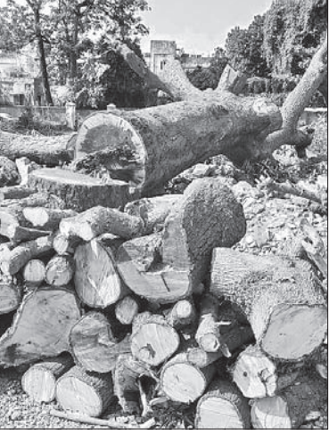
ନାହିଁ । ଜଳବାୟୁ ପରିବର୍ତ୍ତନ ଓ ବିଷ୍ଣୁତାପନ ଯୋଗୁ ପୃଥିବୀବ୍ୟାପୀ ଲୋକେ ପ୍ରଭାବିତ ହେଉଛନ୍ତି । ଓଡ଼ିଶାରେ ବିଷ୍ଣୁତାପନର ପ୍ରଭାବ କିଭଳି ରହିଛି ଚଳିତ ସମୟରେ କାହାରିକୁ ବୁଝାଇବା ଦରକାର ନାହିଁ । ଯଦି ସରକାର ଚାହୁଁଛନ୍ତି ସବୁ ବିଧାୟକ ଗୋଟିଏ ଜାଗାରେ ରହିବେ, ତେବେ ଯେଉଁ ପାଟ୍ଟପଡ଼ା ଅଞ୍ଚଳରେ ୧୨ ହଜାର ଚାରା ଲଗାଯିବା ଲାଗି ଯୋଜନା କରାଯାଇଛି, ସେହି ସ୍ଥାନରେ ସେମାନଙ୍କ ଲାଗି ଆବାସ ନିର୍ମାଣ କରାଯାଇପାରିଥାଆନ୍ତା । ସେଠାରେ ଅତି ସୁନ୍ଦର ଭାବେ ବିଧାୟକମାନଙ୍କ ବାସଭବନ ନିର୍ମାଣରେ ନୂତନ ପ୍ରକାରର ଚାରା ରୋପଣ କରାଯାଇ ଉତ୍ପାଦନ ମଧ୍ୟ ସୃଷ୍ଟି କରାଯାଇପାରିଥାଆନ୍ତା । ସବୁଜ ବଳୟ ମଧ୍ୟରେ ରହିଥିଲେ ସରକାରୀ ଦଳର ବିଧାୟକ ଅତ୍ୟଧିକ ଅନୁଜ୍ଞାନ ପାଇ ରାଜ୍ୟକୁ ପ୍ରଗତି ପଥରେ ଚାଣି ନେଇଥାଆନ୍ତେ । ସେହିଭଳି ବିନୋଧୀ ଦଳର ବିଧାୟକମାନେ ଏବେ ଯେଉଁଭଳି ଭାବେ ଧରାପଡ଼ିଯାଉଛନ୍ତି ତାହା ନ ହୋଇ ଭଲ ଭାବେ ନିଜର ବିରୋଧୀ ମନ୍ତ୍ରଣାକୁ ପ୍ରକାଶ କରିପାରିଥାଆନ୍ତେ । ଏହା କହିବା ପଛରେ ବୈଜ୍ଞାନିକ ପ୍ରମାଣ ରହିଛି । ଚାରା ଲଗାଇଲେ ଅଳ୍ପ ଅନୁଜ୍ଞାନ ସୃଷ୍ଟି ହୁଏ । ଅନ୍ୟପଟେ ଅତି ପୁରୁଣା ବୃକ୍ଷରୁ ଅନୁଜ୍ଞାନ କ୍ଷୀଣ ହୋଇଥାଏ । ମଧ୍ୟ ବୟସର ସବୁ ଗଛରୁ ଅନୁଜ୍ଞାନ ପରିମାଣ ଅଧିକ ରହିଥାଏ । ବିଧାନସଭା ସମ୍ମୁଖରେ କଟାଯାଇଥିବା ଗଛରୁ ମଧ୍ୟ ବୟସରେ ପୋଷ୍ଟୁଥିଲା । ଏବେ ସେହି ସ୍ଥାନରୁ ଅନୁଜ୍ଞାନର ଘୋର ଅଭାବ ଘଟିପାରେ । ସେଠାରେ ଯଦି ମାନ୍ୟବର ବିଧାୟକମାନଙ୍କୁ ରହିବାର ସୁବିଧା ଦିଆଯାଏ, ତେବେ ସେମାନଙ୍କର ଶାରୀରିକ ଓ ମାନସିକ ସ୍ୱାସ୍ଥ୍ୟ କିଭଳି ଭାବେ ପ୍ରଭାବିତ ହେବ ତାହା ଭବିଷ୍ୟତ କହିବ ।

ଯଦି ସରକାର ଚାହୁଁଛନ୍ତି ସବୁ ବିଧାୟକ ଗୋଟିଏ ଜାଗାରେ ରହିବେ, ତେବେ ଯେଉଁ ପାଟ୍ଟପଡ଼ା ଅଞ୍ଚଳରେ ୧୨ ହଜାର ଚାରା ଲଗାଯିବା ଲାଗି ଯୋଜନା କରାଯାଇଛି, ସେହି ସ୍ଥାନରେ ସେମାନଙ୍କ ଲାଗି ଆବାସ ନିର୍ମାଣ କରାଯାଇ ପାରିଥାଆନ୍ତା ।