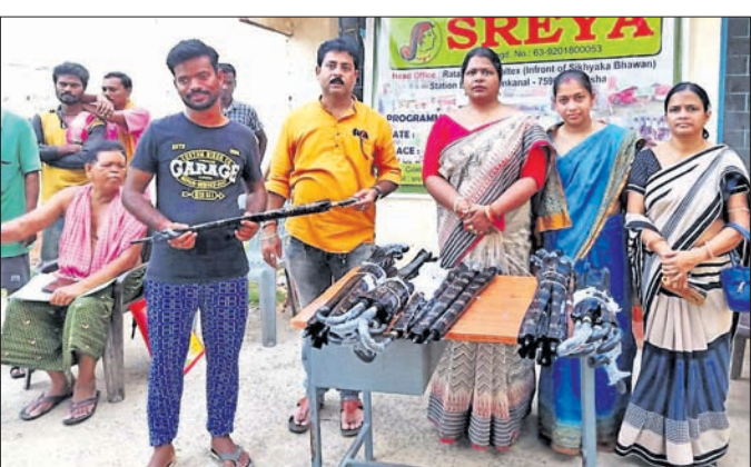
ସଞ୍ଜିୟ କଲୋନୀରେ ଛତା ବନ୍ଧନ କରାଯାଇଛି।