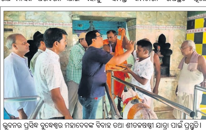
ଭୁବନର ପ୍ରସିଦ୍ଧ ବୁଦ୍ଧଶ୍ୱର ମହାବେଦ୍ୟ ବିବାହ ତଥା ଶାତକ୍ଷଣୀ ସାଗ୍ରୀ ପାଇଁ ପ୍ରସ୍ତୁତି।