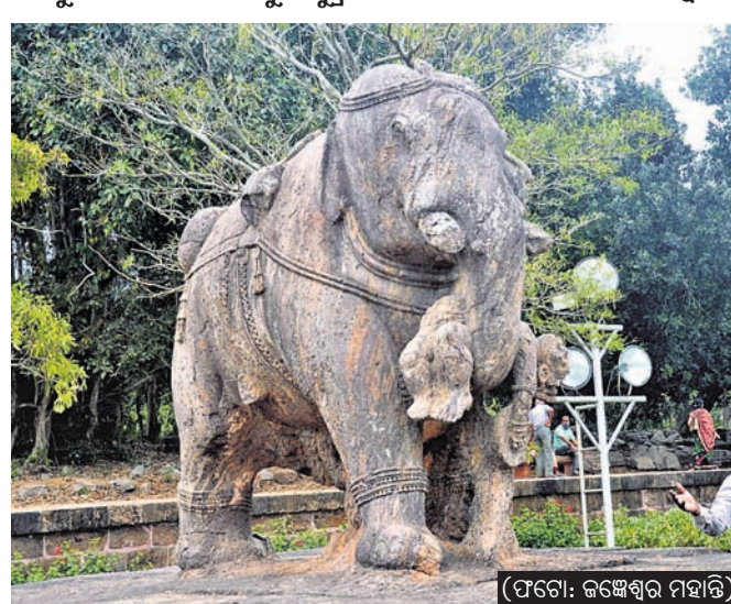
କୋଣାର୍କ ଶ୍ରୀ ପଦ୍ମକେଶର ମନ୍ଦିରର ଉତ୍ତର ପାର୍ଶ୍ଵରେ ଥିବା ହାତୀ ସୁଦେହିକାର ପ୍ରତିମାକୁ।