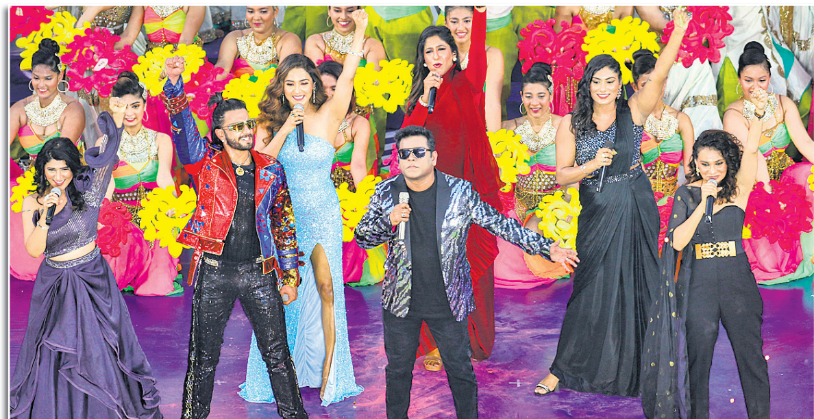
ବିଶିଷ୍ଟ ସଙ୍ଗୀତଜ୍ଞ ଏ.ଆର୍. ରହମାନ କାର୍ଯ୍ୟକ୍ରମ ପରିବେଷଣ କରୁଛନ୍ତି।