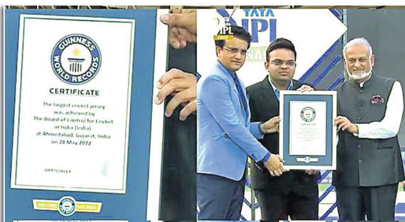
ସର୍ବବୃହତ୍ ଜର୍ସି ପାଇଁ ଗିନିଜ୍ ପୁସ୍ତକରେ ପ୍ରମାଣପତ୍ର ସହ ସୌରଭ ଗାଙ୍ଗୁଲି ଓ ଜୟ ଶାହା।

ଇଣ୍ଡିଆନ ପ୍ରିମିୟର ଲିଗ୍‌ର ୧୫ତମ ସଂସ୍କରଣ ରବିବାର ଉଦ୍‌ଯାପିତ ହୋଇଛି। ଅହମଦାବାଦର ନରେନ୍ଦ୍ର ମୋଦି ଷ୍ଟାଡ଼ିୟମରେ ୧୦ ଦଳ ବିଶିଷ୍ଟ ଏହି ବ୍ୟୟବହୁଳ ଲିଗ୍‌ର ଉଦ୍‌ଯାପନୀ ଉତ୍ସବରେ ଦର୍ଶକଙ୍କ ମନ ମୋହିତ କରି ବିଶିଷ୍ଟ ସଙ୍ଗୀତଜ୍ଞ ଏ.ଆର୍. ରହମାନ ଓ ବଲିଉଡ୍ ଷ୍ଟାର ରଣବୀର ସିଂ