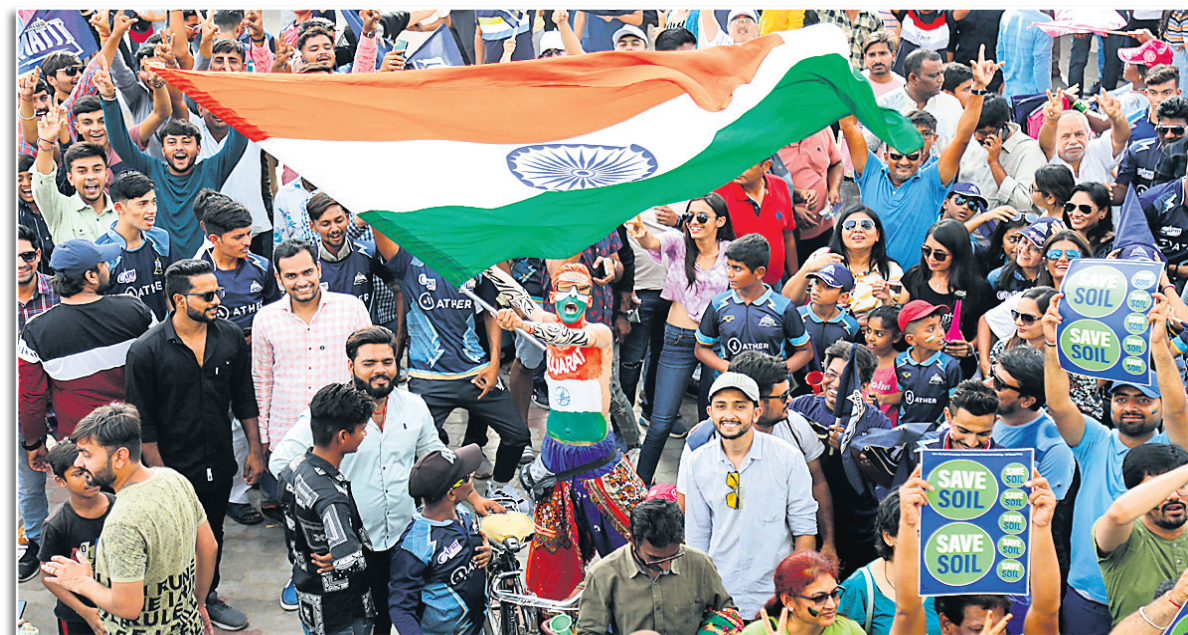
ଅହମଦାବାଦର ନରେନ୍ଦ୍ର ମୋଦି ଷ୍ଟାଡ଼ିୟମ ବାହାରେ ଉପସ୍ଥିତ କ୍ରିକେଟ ପ୍ରଶଂସକ।