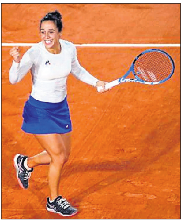
ମାର୍ଟିନା ଟ୍ରେଜିସାନ୍ ସହିତ ଖେଳ ଆରମ୍ଭ କରିଥିଲେ। ଦ୍ଵିତୀୟ ସେଟ୍‌ରେ ଫର୍ନାଣ୍ଡେଜ୍ ଏକ ମ୍ୟାଚ୍ ପଏଣ୍ଟ ସେଭ୍ କରିବା

ପ୍ୟାରିସ୍, ୩୧।୫: କାନାଡାରେ ଲେଲୋ ଫର୍ନାଣ୍ଡେଜ୍ ୬-୨, ୬-୧ (୩-୧), ୬-୩ରେ ପରାସ୍ତ କରି ଇଟାଲୀର ମାର୍ଟିନା ଟ୍ରେଜିସାନ୍ ପ୍ରଥମ ଥର ଏକ ଗ୍ରାଣ୍ଡସ୍ଲାମ ଚୁନାମେଣ୍ଟର ସେମିଫାଇନାଲରେ ପ୍ରବେଶ କରିଛନ୍ତି। ପାଦରେ ଯନ୍ତ୍ରଣା ପାଇଁ ସଂଘର୍ଷ କରୁଥିବା ୧୯ ବର୍ଷୀୟା ୨୦୨୧ ମୁସ୍‌ସ୍ ଓପନ ଫାଇନାଲିଷ୍ଟଙ୍କ ବିପକ୍ଷରେ ଟ୍ରେଜିସାନ୍ ଦୃଢ଼ ଆତ୍ମବିଶ୍ଵାସର