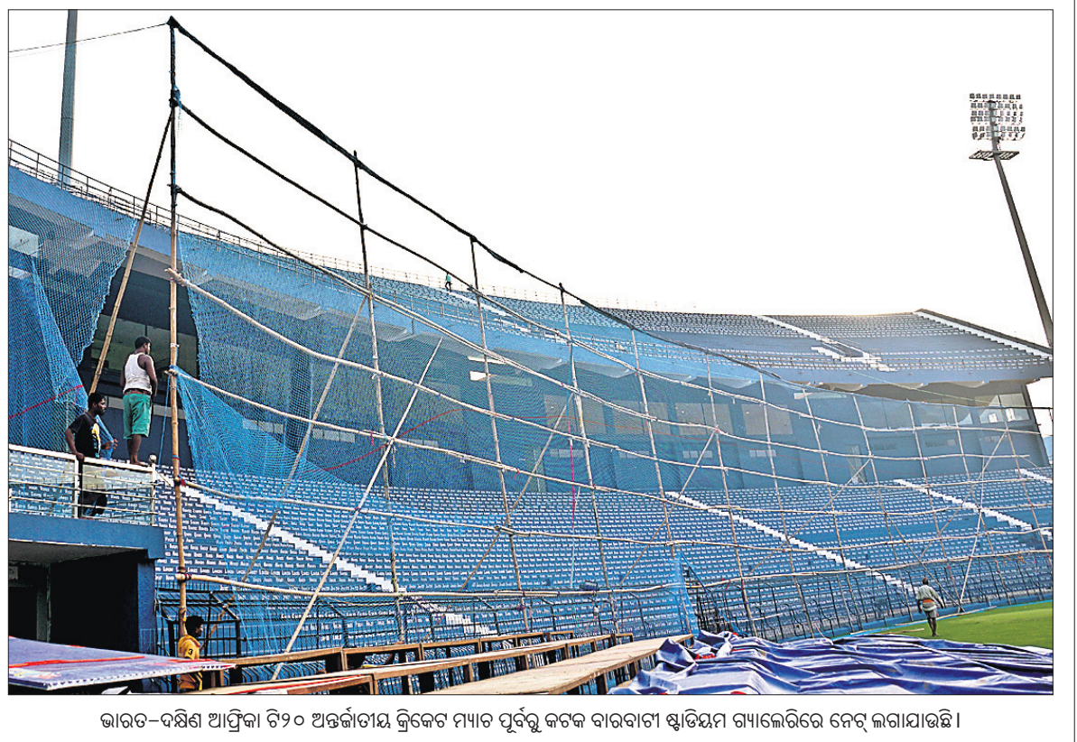
ଭାରତ-ଦକ୍ଷିଣ ଆଫ୍ରିକା ୧୨୦ ଅଇର୍‌କ୍ରାୟ କ୍ରିକେଟ୍ ମ୍ୟାଚ୍ ପୂର୍ବରୁ କଟକ ବାରବାଟୀ ଷ୍ଟାଡିୟମ ଗ୍ୟାଲେରିରେ ନେଟ୍ ଲଗାଯାଇଛି।