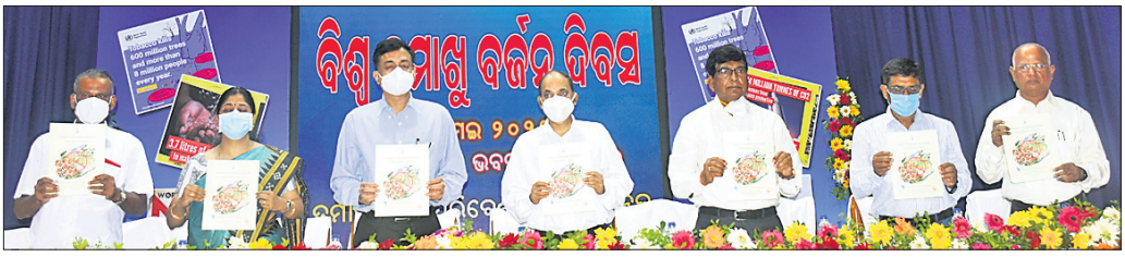
କାର୍ଯ୍ୟକ୍ରମରେ ତମାଖୁ ନିୟନ୍ତ୍ରଣ ସମ୍ପର୍କିତ ଏକ ଭିଡିଓକୁ ଅତିଥି ଭବ୍ୱାବନାରେ କରୁଛନ୍ତି ।