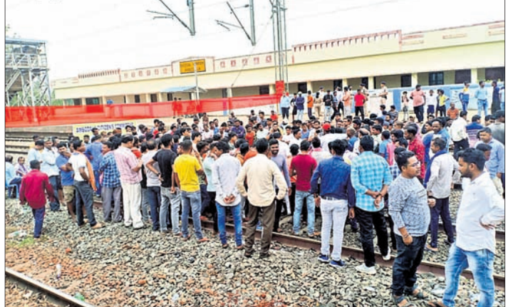
ରାୟଗଡ଼ା ଜିଲ୍ଲାର ଅଧ୍ୟାପକ ଷ୍ଟେଶନରେ ଧାରଣା ଦେଇଥିବା ଅଞ୍ଚଳବାସୀ।

ରାୟଗଡ଼ା ଜିଲ୍ଲା ଅଧ୍ୟାପକମାନଙ୍କୁ ଏ ଏକ୍ସପ୍ରେସ୍ ଟ୍ରେନ୍ ରହଣି ନିମନ୍ତେ କରୋନା ପରୀକ୍ଷା ଦାବି ହୋଇଆସୁଛି। ଏ ନେଇ ନାଗରିକ ମଞ୍ଚ ଓ ଅଧ୍ୟାପକ ବିଭାଗ କମିଟି ପକ୍ଷରୁ ଲଢ଼େଇ କାରି ରହିଛି। ଦାବି ପୂରଣ ନେଇ କୌଣସି ପଦକ୍ଷେପ ନିଆଯାଇ ନ ଥିବାରୁ ପୂର୍ବ ନିଷ୍ପତ୍ତି ଅନୁଯାୟୀ, ମଙ୍ଗଳବାର ୬ ଘଣ୍ଟା ଧରି ରେଳରୋକ୍ କରାଯାଇଥିଲା। ଏହାପରେ ବିଭିନ୍ନ ଏକ୍ସପ୍ରେସ୍ ଟ୍ରେନ୍ ଚଳାଚଳରେ ବିଳମ୍ବ ଘଟିଥିଲା। ରେଳଡେ ଅଧିକାରୀମାନେ ପହଞ୍ଚି ଆଲୋଚନା କରିବା ସହ ତିଆରିବନ୍ଦ ଏବଂ ଅନ୍ୟ ଉଚ୍ଚ କର୍ତ୍ତୃପକ୍ଷଙ୍କୁ ଅବଗତ କରାଯିବ ବୋଲି ଲିଖିତ ପ୍ରତିଶ୍ରୁତି ଦେଇଛନ୍ତି। ମାସେ ମଧ୍ୟରେ ଟ୍ରେନ୍ ରହଣି ନିମନ୍ତେ ପ୍ରତିଶ୍ରୁତି ଦେବାପରେ ରେଳରୋକ୍ ବନ୍ଦ କରାଯାଇଛି। ଜୁଲାଇ ୧୬ ରୁ ଦାବି ପୂରଣ ନ ହେଲେ