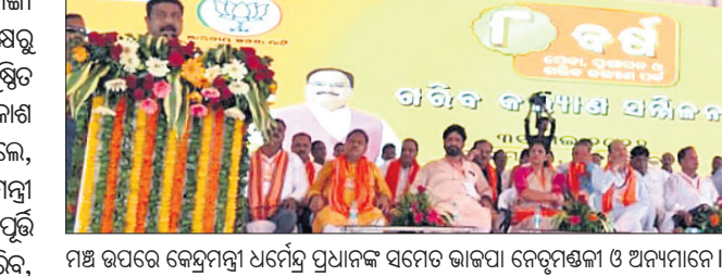
ମନ୍ତ୍ରୀ ଧର୍ମେନ୍ଦ୍ର ପ୍ରଧାନଙ୍କ ସମେତ ଭାଜପା ନେତୃମଣ୍ଡଳୀ ଓ ଅନ୍ୟମାନେ।

କଟକ ଜିଲ୍ଲା ମାହାଙ୍ଗା ବ୍ଲକ୍ ଅନ୍ତର୍ଗତ ବରାହପୁରଠାରେ ଭାଜପା ପକ୍ଷରୁ ଗରିବ କଲ୍ୟାଣ ସମ୍ମିଳନୀ ଉଦ୍ଦେଶ୍ୟରେ ଅନୁଷ୍ଠିତ ହୋଇଯାଇଛି। ଏଥିରେ କେନ୍ଦ୍ର ଶିକ୍ଷା ଓ ଦକ୍ଷତାବିକାଶ ମନ୍ତ୍ରୀ ଧର୍ମେନ୍ଦ୍ର ପ୍ରଧାନ ଯୋଗଦେଇ କହିଥିଲେ, ଗରିବ ଲୋକଙ୍କ ଆଶୀର୍ବାଦରେ ପ୍ରଧାନମନ୍ତ୍ରୀ ନରେନ୍ଦ୍ର ମୋଦିଙ୍କ ସରକାର ଅଷ୍ଟମ ବର୍ଷ ପୂର୍ତ୍ତି ପାଳନ କରୁଛନ୍ତି। କେନ୍ଦ୍ର ସରକାର ଦେଶର ଗରିବ, ମହିଳା, ଦଳିତ, ପଞ୍ଚୁଆବର୍ଣ୍ଣ ଓ ଯୁବକଙ୍କ ବିକାଶ ପାଇଁ ସଂକଳ୍ପବଦ୍ଧ। କୃଷକଙ୍କ ପାଇଁ ସରକାର ପିଏପି ନିୟମ ଯୋଜନାରେ ପ୍ରତିବର୍ଷ ୬୫୦୦ କୋଟି ଲକ୍ଷ୍ୟରେ ୧୦ କିଲୋଟନ ଧାନ ଲକ୍ଷ୍ୟ ପ୍ରଦାନ କରିଛନ୍ତି। ସାଧାରଣତଃ ୬୫୦୦ ଟନ ଧାନ ପ୍ରଦାନ କରିଛନ୍ତି। ସାଧାରଣତଃ ୬୫୦୦ ଟନ ଧାନ ପ୍ରଦାନ କରିଛନ୍ତି। ସାଧାରଣତଃ ୬୫୦୦ ଟନ ଧାନ ପ୍ରଦାନ କରିଛନ୍ତି।