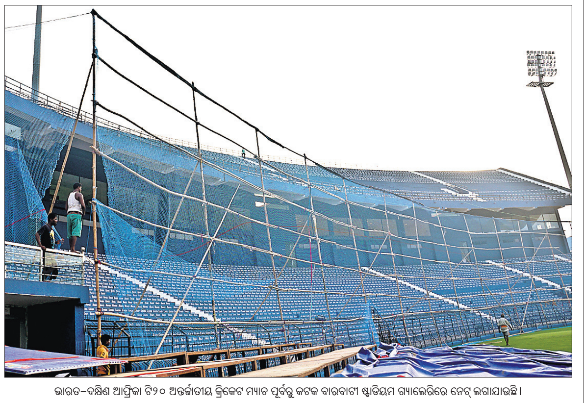
ଭାରତ-ଦକ୍ଷିଣ ଆଫ୍ରିକା ୧୨୦ ଅଇର୍‌କୋଣ୍ଡାୟ କ୍ରିକେଟ ମ୍ୟାଚ ପୂର୍ବରୁ କରାଯିବା ପାଇଁ ଶୁଭିକ୍ଷମ ଗ୍ୟାଲେରିରେ ନେଟ୍ ଲଗାଯାଇଛି।

ତାଙ୍କ ସହିତ ରହିପାରିବ। ଏ ନେଇ ମାଜିକ୍‌ବାର ଦେଶର କ୍ରିକେଟ ବୋର୍ଡ ପକ୍ଷରୁ କୁହାଯାଇଛି। ଝିଅଙ୍କୁ ଆକ୍ରେଡିଟେସନ ଦିଆଯିବାକୁ ମନା କରାଯିବ ପରେ ରାଜ୍ୟଗୋଷ୍ଠୀ କ୍ରୀଡ଼ା ଫେଡେରେସନକୁ ସମାଲୋଚନାର ସମ୍ମୁଖୀନ ହେବାକୁ ପଡ଼ିଥିଲା। ଆକ୍ରେଡିଟେସନ ନ ମିଳିଥିଲେ