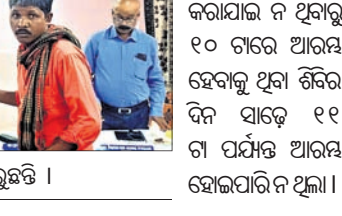
ଜଣେ ବ୍ୟକ୍ତିଙ୍କୁ ଜିଲ୍ଲାପାଳ ସହାୟତା ପ୍ରଦାନ କରୁଛନ୍ତି।