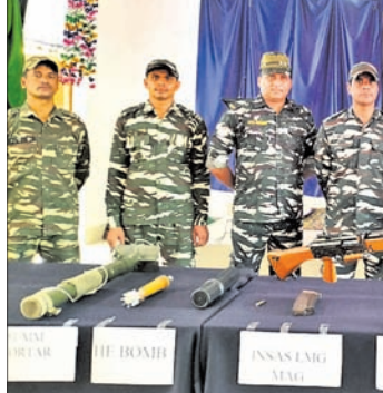
ଯବାନମାନେ ଅସ୍ତ୍ରଶସ୍ତ୍ର ବ୍ୟବହାର ବିଷୟରେ କ୍ୟାଡେଟ ଏବଂ ଛାତ୍ରାଛାତ୍ରୀଙ୍କୁ ସୂଚାଉଛନ୍ତି।

ମେଳାରେ ଏଲ୍ଏମ୍ଆର୍, ଇନ୍ସାୟ୍, ସିଏନ୍ସି, ୫୧ମୋଟାର, ବମ୍, ଏ ଏମ୍ଏମ୍ ପିପ୍ରିଲ ଏବଂ ଅନ୍ୟ ଅସ୍ତ୍ରଶସ୍ତ୍ର