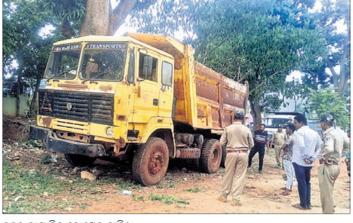
ଜବତ ମାଜାନିଜ୍ ବୋଝେଇ ଗାଡ଼ି।