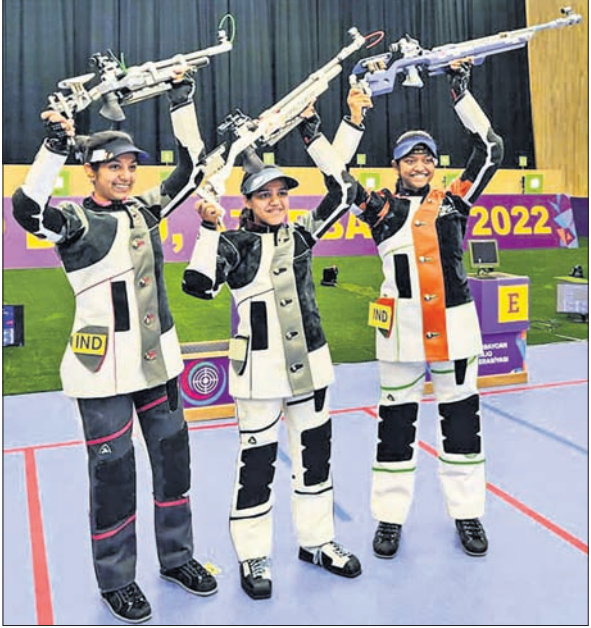
ସର୍ବ ଉତ୍ତମ ହାସଲ କରିଥିବା ଭାରତୀୟ ଶୁଟରମାନେ ସୁସି ପୂର୍ବରେ।