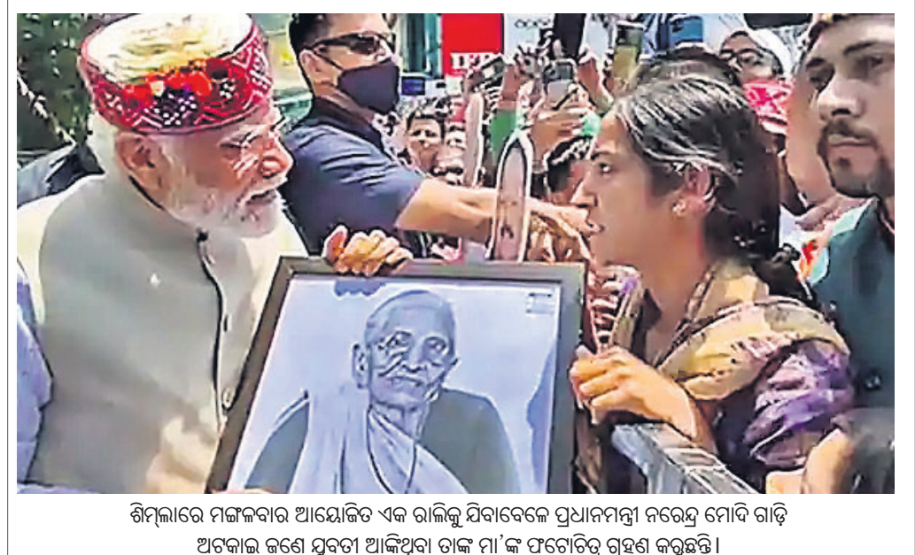
ଶିମ୍ଲୀରେ ମଙ୍ଗଳବାର ଆୟୋଜିତ ଏକ ରାଜକୁ ଯିବାବେଳେ ପ୍ରଧାନମନ୍ତ୍ରୀ ନରେନ୍ଦ୍ର ମୋଦି ଗାଡ଼ି ଅଟକାଇ ଜଣେ ମୂର୍ତ୍ତୀ ଆଜିଥିବା ତାଙ୍କ ମା'ଙ୍କ ଫଟୋଟିକୁ ଗ୍ରହଣ କରୁଛନ୍ତି।

ମନିଲଣ୍ଡରିଂ ମାମଲାରେ ଗିରଫ ହୋଇଥିବା ଦିଲ୍ଲୀ ସ୍ୱାସ୍ଥ୍ୟମନ୍ତ୍ରୀ ସତ୍ୟେନ୍ଦ୍ର ଜୈନଙ୍କୁ କ୍ଷୁଦ୍ର ୯ ପର୍ଯ୍ୟନ୍ତ ପ୍ରବର୍ତ୍ତନ ନିର୍ଦ୍ଦେଶାଳୟ (ଇଡି) ହାଜତକୁ ପଠାଇ ଦିଆଯାଇଛି। ଏହି ଦୁର୍ଗତି ପଛରେ ରହିଥିବା ବଡ଼ ସ୍ୱତନ୍ତ୍ର ମୁକ୍ତ ଅପରାଧ ଆଣିବାକୁ ହେଲେ ଜୈନଙ୍କୁ ହାଜତ କେରାର ଆବଶ୍ୟକତା ରହିଛି ବୋଲି ଦିଲ୍ଲୀ ଅଦାଲତ ଅନୁଭବ କରିଥିଲେ। ମନିଲଣ୍ଡରିଂ ମାମଲାର ତଦନ୍ତକ ବିଭାଗ କରୁଥିବା ଅଭିଯୋଗରେ ଜୈନଙ୍କୁ ସୋମବାର ଇଡି ଗିରଫ କରିଥିଲା। ୨୦୧୭ରେ ସତ୍ୟେନ୍ଦ୍ର ଜୈନଙ୍କ ବିରୋଧରେ ପିଏମ୍‌ଏଲ୍‌ଏସ୍‌ରେ ମାମଲା ରୁଜୁ ହୋଇଥିବାବେଳେ ଗତ ଏପ୍ରିଲ ୫ରେ ତାଙ୍କର ତଥା ତାଙ୍କ ପରିବାର ସଦସ୍ୟଙ୍କର ପ୍ରାୟ ୫ କୋଟି ଟଙ୍କାର ସମ୍ପତ୍ତି ବାଖ୍ୟାସ୍ତ କରାଯାଇଥିଲା। ସରକାରୀ ଚାକିରି କରିବା ପୂର୍ବରୁ ୨୦୧୦-୧୨ରେ ସେ ୧୧ କୋଟିରୁ ଊର୍ଦ୍ଧ୍ୱ ଟଙ୍କା ମନିଲଣ୍ଡରିଂରେ ସମ୍ପୃକ୍ତ ଥିବା ସିଡିଆଇ ଅଭିଯୋଗ କରିଥିଲା। ଅନ୍ୟ ପକ୍ଷରେ ସତ୍ୟେନ୍ଦ୍ର ଜୈନଙ୍କ ଗିରଫଦାରିକୁ ନେଇ ଦିଲ୍ଲୀ ମୁଖ୍ୟମନ୍ତ୍ରୀ ଅରବିନ୍ଦ କେଜ୍‌ରିୱାଲ୍ କ୍ଲେନ୍ଦ ସରକାରଙ୍କୁ ସମାଲୋଚନା କରିଛନ୍ତି। ଜୈନଙ୍କ ବିରୋଧରେ ମାମଲା ସମ୍ପୂର୍ଣ୍ଣ ମିଥ୍ୟା ଓ ରାଜନୈତିକ ଉଦ୍ଦେଶ୍ୟ ପ୍ରଶୋଧିତ ବୋଲି ସେ କହିଛନ୍ତି।