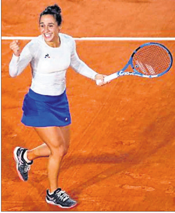
ମାର୍ଟିନା ଟ୍ରେଜିସାନ୍ ସହିତ ଖେଳ ଆରମ୍ଭ କରିଥିଲେ। ଦ୍ୱିତୀୟ ସେଟ୍ରେ ଫର୍ମାସିଜ ଏକ ମ୍ୟାଚ ପଏଣ୍ଟ ସେଭ୍ କରିବା

ପ୍ୟାରିସ୍, ୩୧।୫ (ପି.ଟି.): କାନାଡାରେ ଲେଲୋ ଫର୍ମାସିଜକୁ ୬-୨, ୬-୬ (୩-୬), ୬-୩ରେ ପରାସ୍ତ କରି ଇଟାଲୀର ମାର୍ଟିନା ଟ୍ରେଜିସାନ୍ ପ୍ରଥମ ଥର ଏକ ଗ୍ରାଣ୍ଡସ୍ଲାମ ଚୁନାମେଣ୍ଟର ସେମିଫାଇନାଲରେ ପ୍ରବେଶ କରିଛନ୍ତି। ପାଦରେ ଯନ୍ତ୍ରଣା ପାଇଁ ସଂଘର୍ଷ କରୁଥିବା ୧୯ ବର୍ଷୀୟା ୨୦୨୧ ସୁଧାସ୍ତ ଓପନ ଫାଇନାଲିଷ୍ଟଙ୍କ ବିପକ୍ଷରେ ଟ୍ରେଜିସାନ୍ ଦୃଢ଼ ଆତ୍ମବିଶ୍ୱାସର