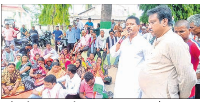
ତହସିଲ ଅଫିସ ଘେରାଉରେ ସାମିଲ ହୋଇଥିବା କଂଗ୍ରେସ ନେତା ଓ କର୍ମୀ।

ସମସ୍ୟା ସମାଧାନ ଲାଗି ସର୍ବଦଳୀୟ ବୈଠକ ଡକାଇବାକୁ ପ୍ରସ୍ତାବ ବାସୁଦେବପୁର, ୧୬ (ଡି.ଏନ.ଏ.) ଭଦ୍ରକ ଜିଲ୍ଲା ବାସୁଦେବପୁର ବ୍ଲକ ଓ ନଗର କଂଗ୍ରେସ କମିଟିର ମିଳିତ ସହଯୋଗରେ ଅଞ୍ଚଳର ୬ ପ୍ରମୁଖ ଦାବିକୁ ନେଇ ଦଳ ପକ୍ଷରୁ ବୁଧବାର ତହସିଲ କାର୍ଯ୍ୟାଳୟ ଘେରାଉ କରାଯାଇଥିଲା। ଏନେଇ ତହସିଲଦାରଙ୍କୁ ଏକ ଦାବିପତ୍ର ପ୍ରଦାନ କରାଯିବା ସହ ସମସ୍ୟା ସମାଧାନ ପାଇଁ ସର୍ବଦଳୀୟ ବୈଠକ ଡକାଇବାକୁ ପ୍ରସ୍ତାବ ଦିଆଯାଇଛି। ଧାମରା-ବାସୁଦେବପୁର ରାସ୍ତା ପ୍ରଶିଷ୍ଟାକରଣ କାର୍ଯ୍ୟର ଅବଧି ଶେଷ ହୋଇଥିଲେ ମଧ୍ୟ ନିର୍ବାଣ କାର୍ଯ୍ୟ ମନ୍ତବ୍ୟ ଗତିରେ ଚାଲୁଥିବା ସହ ରାସ୍ତା କାମ ନିମ୍ନମାନର ହେଉଥିବା ଅଭିଯୋଗ ହୋଇଛି। ସହର ମଧ୍ୟରେ ଡ୍ରେନ୍ କାର୍ଯ୍ୟ ଅଧ୍ୟାପନ୍ନଥିବା ହୋଇ ରହିଛି। ସେହିପରି ଅସମ୍ପୂର୍ଣ୍ଣ ରାସ୍ତା ଓ ଡ୍ରେନ୍ ପାଇଁ ସହର ମଧ୍ୟରେ ଗୁରୁତର ଗ୍ରାମିକ ସମସ୍ୟା ଦେଖାଦେଉଥିବା କଂଗ୍ରେସ ପକ୍ଷରୁ କୁହାଯାଇଛି। ହାଇସ୍କୁଲ ଛକଠାରେ କାଟାୟ କବି ବାସ୍ତାନିଧି ମହାଡ଼ିକ ପ୍ରତିମୂର୍ତ୍ତି ସ୍ଥାପନ,