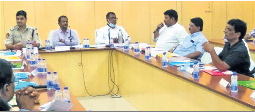
ଅନ୍ତର୍ଜାତୀୟ ଟି୨୦ କ୍ରିକେଟ ମ୍ୟାଚ ପାଇଁ ରୁଧିର ଅନୁଷ୍ଠିତ କେନ୍ଦ୍ରାଞ୍ଚଳ ରାଜ୍ୟ ଆୟୁର୍ ସମ୍ମିଳନୀ କକ୍ଷରେ ଅନୁଷ୍ଠିତ ପ୍ରସ୍ତୁତି ବୈଠକ।

ଅର୍ଥାତ୍ ଅପରାହ୍ଣ ୧୩ ୪୫ରେ ଟିକେଟ ବିକ୍ରି ଆରମ୍ଭ ହୋଇଥିଲା। ତେବେ ମାତ୍ର ୧ ଘଣ୍ଟା ୧୫ ମିନିଟରେ ଉପଲବ୍ଧ ଥିବା ସମସ୍ତ ୫୦୦୦ଟି ଟିକେଟ ବିକ୍ରି ହୋଇ ଯାଇଥିବା ଓଡ଼ିଶା କ୍ରିକେଟ ଆସୋସିଏସନ (ଓସିଏ) ପକ୍ଷରୁ ସୂଚନା ଦିଆଯାଇଛି। ଏଥିରୁ ଆଗାମୀ ମ୍ୟାଚ ଦେଖିବା ପାଇଁ ରାଜ୍ୟ କ୍ରିକେଟ୍‌ପ୍ରେମୀମାନେ ବିକ୍ରିର ଉତ୍ସୁକତା ସହ ଅପେକ୍ଷା କରିଛନ୍ତି ତାହା ସ୍ପଷ୍ଟ ହୋଇଛି।