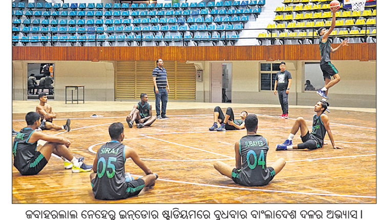
ଜବାହରଲାଲ ନେହେରୁ ଇନ୍‌ଡୋର ଷ୍ଟାଡ଼ିୟମରେ ଗୁରୁବାର ବାସ୍କାବେଶ ଦଳର ଅଭ୍ୟାସ।

ରାଜ୍ୟ ସରକାରଙ୍କ କ୍ରୀଡ଼ା ବିଭାଗ ସହଯୋଗରେ ଓଡ଼ିଶା ବାସ୍କେଟବଲ ଆସୋସିଏସନ ଆନୁକୂଲ୍ୟରେ କଟକର ଜବାହରଲାଲ ନେହେରୁ ଇନ୍‌ଡୋର ଷ୍ଟାଡ଼ିୟମରେ ଅନ୍ତର୍ଜାତୀୟ ବାସ୍କେଟବଲ ଫେଡେରେଶନ (ଏଫଆଇଏସିଏ)ର ୧୮ ବର୍ଷରୁ କମ୍ ଏସିଆନ ଚାମ୍ପିୟନସିପ୍ ଗୁରୁବାର ଆରମ୍ଭ ହେବ। ଏହା ସାଥୀରେ ଏସିଆନ ବାସ୍କେଟବଲ ଆସୋସିଏସନ (ଏସିଆଇଏସିଏ) କ୍ୱାଲିଫାୟର ଭାବେ ମଧ୍ୟ ବିବେଚିତ ହେଉଛି। ୪ ତାରିଖ ପର୍ଯ୍ୟନ୍ତ ପ୍ରତିପକ୍ଷକୁ ଟ୍ରେନିଂ ଦେବେ ବୋଲି ସେମାନେ ଆମଠାରୁ ସ୍ୱାଭାବିକଭାବେ ଉତ୍ତମ ସହଯୋଗ ପାଇବେ। ମ୍ୟାଚ ପୂର୍ବରୁ କଭର ସମ୍ପର୍କରେ ବିଶେଷ ଧ୍ୟାନ