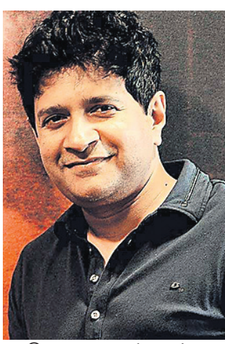
କ୍ରିଷ୍ଣକୁମାର କୁନ୍ଦଥ (କେକେ)

କୋଲକାତା, ୧।୬ ବିଶିଷ୍ଟ କଣ୍ଠଶିଳ୍ପୀ କ୍ରିଷ୍ଣକୁମାର କୁନ୍ଦଥ ଓରଫ୍ କେକେଙ୍କ ମୃତ୍ୟୁକୁ ନେଇ ବିଭିନ୍ନ ପ୍ରକାର ଚର୍ଚ୍ଚା ଆରମ୍ଭ ହୋଇଯାଇଛି। ମଙ୍ଗଳବାର ଦକ୍ଷିଣ କୋଲକାତାର ନକରୁଲ୍ ମଞ୍ଚରେ ସେ ସଙ୍ଗୀତ ପରିବେଷଣ କରିଥିବାବେଳେ ସେଠାରେ ତାଙ୍କ ପାଇଁ ଉପଯୁକ୍ତ ବ୍ୟବସ୍ଥା କରାଯାଇ ନ ଥିବା ଅଭିଯୋଗ ଆସିଛି। ଏଥିସହ କେକେଙ୍କ ମୃତ୍ୟୁରେ ଆଘାତ ଲାଗିଥିବା ନେଇ ପ୍ରଥମେ ଜଣାପଡ଼ିବା ପରେ କୋଲକାତାର ନ୍ୟୁ ମାର୍କେଟ ଆନାରେ ଏହାକୁ ଅସ୍ୱାଭାବିକ ମୃତ୍ୟୁ ବର୍ଣ୍ଣାଯାଇ ଅପମୃତ୍ୟୁ ମାମଲା ରୁଜୁ କରାଯାଇଥିଲା। ତେବେ ରୁଧ୍ରବାର ଅପରାହ୍ନରେ ଆସିଥିବା ପୋଷ୍ଟମର୍ତ୍ତମ ପ୍ରାଥମିକ ରିପୋର୍ଟରେ ତାହା ଅସ୍ୱାଭାବିକ ମୃତ୍ୟୁ ନୁହେଁ ବୋଲି ■ ଗାୟକଙ୍କ ପରଲୋକକୁ ନେଇ ରାଜନୀତି ■ କୋଲକାତା ବିମାନବନ୍ଦରରେ ତୋପ ସମାପି ■ ଆଜି ମୁମ୍ବାଇରେ ଶେଷକୃତ୍ୟ ବର୍ଣ୍ଣାଯାଇଥିବା ଜଣାପଡ଼ିଛି। କେକେଙ୍କୁ ହୃଦ୍‌ଘାତ ହୋଇଥିବା ଏବଂ ଯକୃତ ଓ ପୁସ୍ତକୃତନିତ ରୋଗରେ ପୀଡ଼ିତ ଥିଲେ ବୋଲି ଏଥିରେ କୁହାଯାଇଛି। ଅପରପକ୍ଷେ କେକେଙ୍କ ମୃତ୍ୟୁକୁ ନେଇ ରାଜନୀତି ଆରମ୍ଭ ହୋଇଯାଇଛି। କୋଲକାତା ପ୍ରଶାସନ କାର୍ଯ୍ୟକ୍ରମ ଆୟୋଜନ ସ୍ଥଳରେ ଉଚିତ ବ୍ୟବସ୍ଥା କରି ନ ଥିବାରୁ ଜଣେ କଳାକାରଙ୍କ