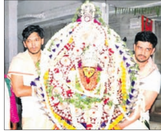
ନୃସିଂହ ମହାପ୍ରଭୁ ଦେବାଦେବଙ୍କୁ ନିଉତା ଦେବାପାଇଁ ବାହାରୁଛନ୍ତି।