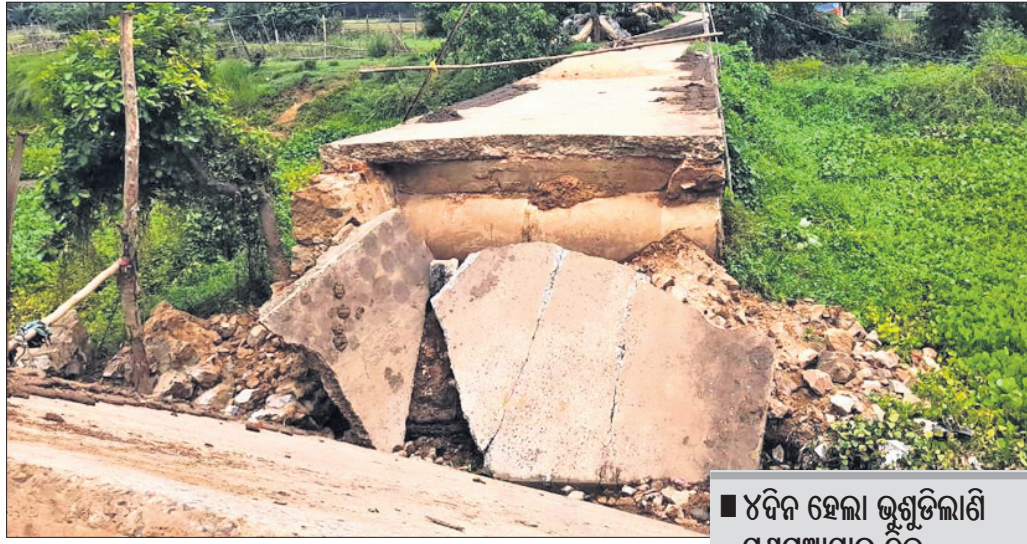
୪୮ଦିନ ହେଲା ଭୁବୁଡ଼ିଲୀଣୀ ପଶୁଆପାଳ ବ୍ଳକ ସ୍ୱାସ୍ଥ୍ୟସେବା ପାଇଁ ଚିତ୍ତାରେ ଅଞ୍ଚଳବାସୀ

ଯୋଗାଯୋଗ ପ୍ରମୁଖ ମାଧ୍ୟମ ହେଉଛି ସଡ଼କ ପଥ। ଏହି କ୍ରମରେ ନଦୀନାଳ ଭରା ଯାଜପୁର ଜିଲାର ଗମନାଗମନ କ୍ଷେତ୍ରକୁ ଅଧିକ ସୁବୁଦ୍ଧ ଏବଂ ସହଜ କରିବା ଲକ୍ଷ୍ୟରେ ଶତାଧିକ ବ୍ଳକ ନିର୍ମାଣ କରାଯାଇଛି। ହେଲେ ଠିକାକାମକୁ ଅଧିକ ଗୁରୁତ୍ୱ ଦିଆଯାଇଛି। ଜିଲାର ଯେ କୌଣସି ବ୍ଳକ କାର୍ଯ୍ୟକୁ ଦେଖିଲେ ସ୍ୱାଭାବିକ ଭାବେ ଏହି ଯୋଜନାର ସଫଳତା ନିରୂପିତ କରି ହେବ। ବଡ଼ତରା ଓ ବରାଣ୍ଡା ସଂଯୋଗକରଣ କରୁଥିବା ନାଳ ଉପରେ ନିର୍ମିତ ବ୍ଳକ ଧରି ପଡ଼ିବା ଯୋଗୁ ଯାତାୟତ