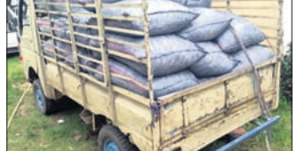
ଜବତ କାଠକୋଇଲା ବୋଝେଇ ଗାଡ଼ି

ଚଢ଼ିଖୋଳ ବନ ବିଭାଗ ପକ୍ଷରୁ ଚଢ଼ାଉ କରାଯାଇ ରୁଧିର କାଠକୋଇଲା ବୋଝେଇ ଏକ ଗାଡ଼ି ଜବତ କରାଯାଇଛି। କେନ୍ଦୁଝର ଅଞ୍ଚଳରୁ ଗାଟା ଏସିଇ ୩ କୁଜୁଣ୍ଡାକୁ ଉର୍ଦ୍ଧ୍ୱ କାଠ କୋଇଲା ବୋଝେଇ କରି ଆସୁଥିଲା। କୌଣସି ସୁତରୁ ଖବର ପାଇଚଢ଼ିଖୋଳ ବନାଞ୍ଚଳ ଅଧିକାରୀ ଶଶୀକାନ୍ତ ବେହେରା