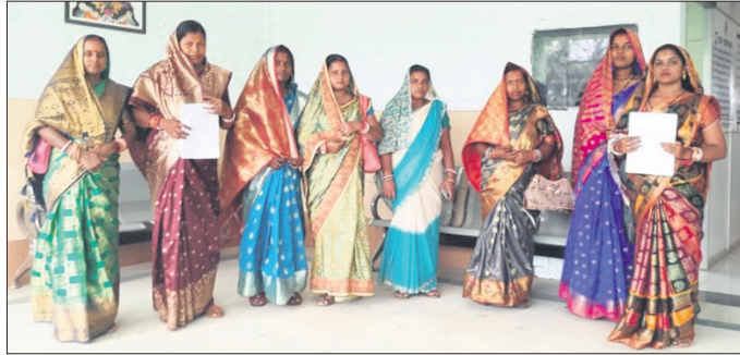
ଜିଲ୍ଲାପାଳଙ୍କୁ ଅଭିଯୋଗ ଦେବାକୁ ଆସିଥିବା ଏମ୍ବିବିଜେ ଓ ସିଆର୍ପିର କର୍ମକର୍ତ୍ତା

ଜିଲ୍ଲାପାଳଙ୍କୁ ଭେଟି ତଦନ୍ତ ଦାବି କଲେ ଏମ୍ବିବିଜେ ଓ ସିଆର୍ପି