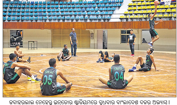
ଜବାହରଲାଲ ନେହେରୁ ଇନ୍‌ଡୋର ଷ୍ଟାଡ଼ିୟମରେ ଗୁରୁବାର ବାଙ୍ଗାଦେଶ ଦଳର ଅଭ୍ୟାସ ।

ରାଜ୍ୟ ସରକାରଙ୍କ କ୍ରୀଡ଼ା ବିଭାଗ ସହଯୋଗରେ ଓଡ଼ିଶା ବାସ୍କେଟବଲ ଆସୋସିଏସନ ଆନୁକୁଲ୍ୟରେ କଟକର ଜବାହରଲାଲ ନେହେରୁ ଇନ୍‌ଡୋର ଷ୍ଟାଡ଼ିୟମରେ ଅନ୍ତର୍ଜାତୀୟ ବାସ୍କେଟବଲ ଫେଡେରେଶନ (ଏଫଆଇବିଏ)ର ୧୮ ବର୍ଷରୁ କମ୍ ଏସିଆନ ଚାମ୍ପିୟନସିପ୍ ଗୁରୁବାର ଆରମ୍ଭ ହେବ । ଏହା ସାଥୀରେ ଏସିଆନ ବାସ୍କେଟବଲ ଆସୋସିଏସନ (ଏସିଏସିଏ) କ୍ୱାଲିଫାୟର ଭାବେ ମଧ୍ୟ ବିବେଚିତ ହେଉଛି । ୪ ତାରିଖ ପର୍ଯ୍ୟନ୍ତ ଚାଲିବାରୁ ଥିବା ପ୍ରତିଯୋଗିତାରେ ୩ଟି ଦଳ ଭାରତ, ବାଙ୍ଗାଦେଶ ଓ ମାଲଦ୍ୱୀପ ଅଂଶଗ୍ରହଣ କରୁଛନ୍ତି । ଗୁରୁବାର ବାଙ୍ଗାଦେଶ ଓ ମାଲଦ୍ୱୀପ ମଧ୍ୟରେ ମ୍ୟାଚ ଅନୁଷ୍ଠିତ ହେବ ।