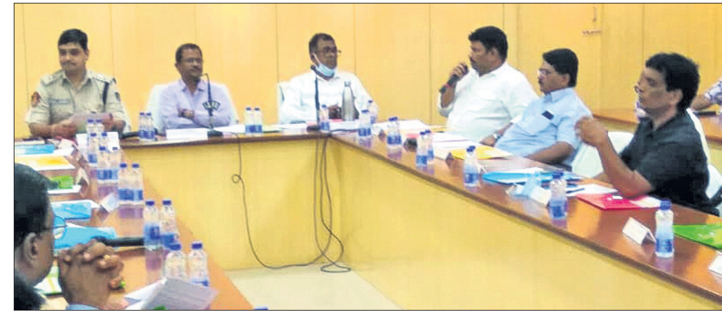
ଅନ୍ତର୍ଜାତୀୟ ଚିନ୍ତା କ୍ରମେ ମ୍ୟାଚ୍ ପାଇଁ ଗୁରୁବାର କେନ୍ଦ୍ରାଞ୍ଚଳ ରାଜ୍ୟ ଆୟୁର୍ଜନିକ ସମ୍ମିଳନୀ କକ୍ଷରେ ଅନୁଷ୍ଠିତ ପ୍ରସ୍ତୁତି ବୈଠକ ।

ଅର୍ଥାତ୍ ଅପରାହ୍ଣ ୧୩ ୪୫ରେ ଟିକେଟ ବିକ୍ରି ଆରମ୍ଭ ହୋଇଥିଲା । ତେବେ ମାତ୍ର ୧ ଘଣ୍ଟା ୧୫ ମିନିଟ୍‌ରେ ଉପଲବ୍ଧ ଥିବା ସମସ୍ତ ୫୦୦୦ଟି ଟିକେଟ ବିକ୍ରି ହୋଇ ଯାଇଥିବା ଓଡ଼ିଶା କ୍ରିକେଟ ଆସୋସିଏସନ (ଓସିଏ) ପକ୍ଷରୁ ସୂଚନା ଦିଆଯାଇଛି । ଏଥିରୁ ଆଗାମୀ ମ୍ୟାଚ୍ ଦେଖିବା ପାଇଁ ରାଜ୍ୟ କ୍ରିକେଟ୍‌ପ୍ରେମୀମାନେ ବିକ୍ରି ଉତ୍ସୁକତାର ସହ ଅପେକ୍ଷା କରିଛନ୍ତି ତାହା ସ୍ପଷ୍ଟ ହୋଇଛି ।