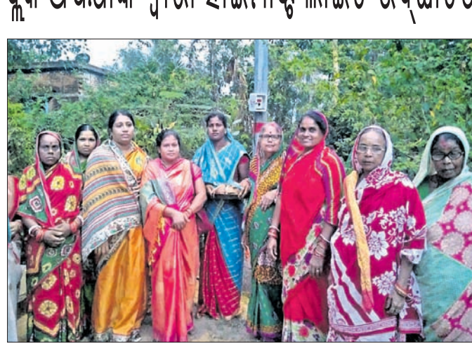
ଅଧିକାରୀ ଦ୍ୱାରା ହାଇମାଷ୍ଟ୍ର ଲାଇଟରୁ ଉଦ୍‌ଘାଟନ କରାଯାଇଛି।