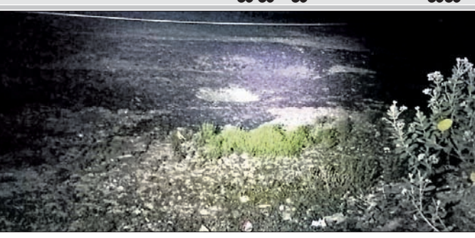
ପୋଖରୀ ଶୁଖିଲା ପଡ଼ିଛି।

ଜଳାଶୟର ଭଲ ସ୍ଥିତିରେ ରହିଛି। ଏହି ଜଳାଶୟର ଗୋପାଳଜୀଉଳ ନାମରେ ରହିଛି। ଏଥିରେ ପାଣି ଅଛି। କିନ୍ତୁ ଏହା ପୋତି ହୋଇ ଚାଲିଛି। ଏହାର ପୁନରୁଦ୍ଧାର ସହ ପାର୍ଶ୍ୱରେ ପ୍ରାଚୀର ଆଦି କରାଯିବାର ଆବଶ୍ୟକତା ରହିଛି। ଏହାବାଦ ଏକାଧିକ ଜଳାଶୟ ରହିଛି ଯାହାର ପୁନରୁଦ୍ଧାର ନ ହୋଇ ପୋତି ହୋଇଗଲାଣି। ସିପି ମକୁନ୍ଦପୁରସ୍ଥିତ ବିଧେଇ ପୋଖରୀ ଜବରଦଖଲ ପୁଞ୍ଜ ହୋଇଥିଲେ ସୁଦ୍ଧା ଏହାର ପୁନରୁଦ୍ଧାର ହୋଇପାରିନାହିଁ। ଖେରସମ୍ପତ୍ତି କମିଶନ ପୋଖରୀରେ ପାଣି ନାହିଁ। ୧୮ ନଂ. ଖାର୍ଡ ବେହେରା