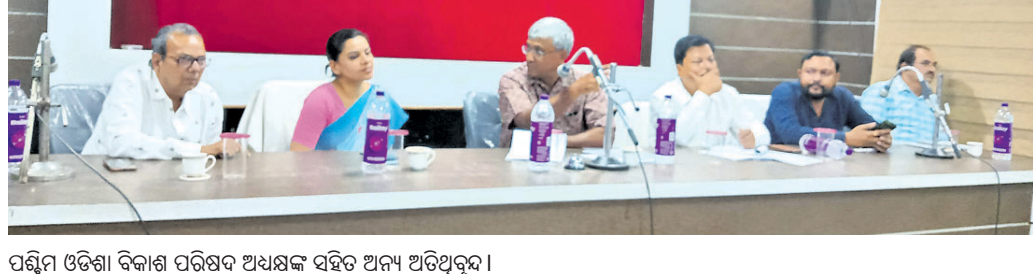
ପଶ୍ଚିମ ଓଡ଼ିଶା ବିକାଶ ପରିଷଦ ଅଧ୍ୟକ୍ଷଙ୍କ ସହିତ ଅନ୍ୟ ଅତିଥିମାନଙ୍କ

ନୂଆପତା ଅପିସ, ୧୬ ତନ୍ତୁପତା ଅଧ୍ୟକ୍ଷଙ୍କ ନୂଆପତା ଗସ୍ତ କରୁଥିବା ସମ୍ପ୍ରଦାୟ, ଜିଲ୍ଲା ମୁଖ୍ୟ ଅଧିକାରୀଙ୍କୁ ନୂଆପତା ଅପିସରେ ଭେଟାଯାଇଥିଲା। ଏହି ଭେଟାଯାମରେ ନୂଆପତା ଅପିସରେ ଭେଟାଯାଇଥିଲା। ଏହି ଭେଟାଯାମରେ ନୂଆପତା ଅପିସରେ ଭେଟାଯାଇଥିଲା।