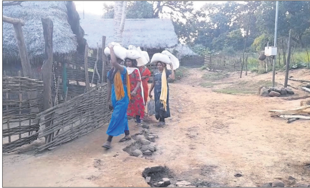
ଗାଁର ଯୁବତୀମାନେ ରାଶନ ସାମଗ୍ରୀ ମୁଣ୍ଡରେ ଧରି ଘରକୁ ଫେରୁଛନ୍ତି ।

ବିଦ୍ୟୁତ୍ ବ୍ୟବସ୍ଥା ପାଇଁ ସୋଲାର ଲାଇଟ୍ ଆଉ କାମ କରୁନି । ୨୦ ବର୍ଷ ହେଲା ଚାଲୁ ଥିବା ସୋଲାର ବ୍ୟବସ୍ଥା ନଷ୍ଟ ହୋଇ ଗଲାଣି । ସରକାର ନୂଆ ସୋଲାର ଡିଲ୍ ସେଟ୍ ନାହାନ୍ତି । ଲାଇଟ୍ ସମସ୍ୟା ଯୋଗୁଁ ବନ୍ୟ ପ୍ରାଣୀ ଭୟ ରହିଛି । ଗାଁ ଭିତରକୁ ହାତୀ, ବାରହା ଆସୁଥିଲେ ମଧ୍ୟ କାହାରି କ୍ଷତି କରୁ ନ ଥିବା ଗ୍ରାମବାସୀ କହିଛନ୍ତି । ଗାଁରେ କେବଳ ଗୋଟିଏ କୁଅ ଅଛି । ନକଲ୍ ପକେଟ ଯୋଖିବା ନାହିଁ । ହେଲେ ସେହି କୁଅ ସବୁ ଲୋକଙ୍କୁ ପାଣି ଯୋଗାଇ ପାରୁନାହିଁ । ଏଣୁ ଆଦିବାସୀ ଝରଣା ପାଣି ପିଇଛନ୍ତି । ଗାଁରେ କାହାର ପାଲଖାନା କି ଆବାସ ଯୋଜନାରେ ଘର ନାହିଁ । ସବୁ ଘର ଝାଟିମାଟିରେ ନିର୍ମିତ । ତେବେ ବାହ୍ୟ ମନୁଷ୍ୟର ଗାଁର ଫଳକ ୫ କି.ମି.ଦୂର ପଞ୍ଚାୟତରେ ଝୁଲୁଛି । ଅଜ୍ଞାନଖିତି, ଆଶା, ଏବଂ ଏକ ଦିନ ପାଇଁ ପାଦ ୧ ଗାଁରେ ପଡ଼େନି । ପୁଣି ଲୋକ ପ୍ରତିନିଧିଙ୍କୁ ଏହି ଗାଁର ଆଦିବାସୀମାନେ ଦେଖିବା ସ୍ୱପ୍ନ ହୋଇଛି ।