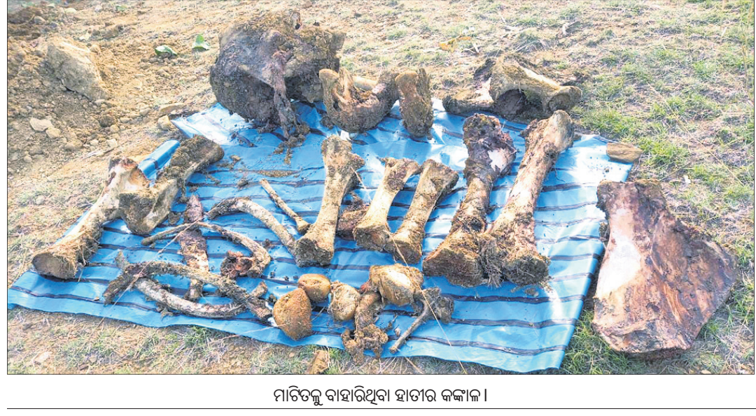
ମାଟିତଳୁ ବାହାରିଥିବା ହାତୀର କଙ୍କାଳ ।