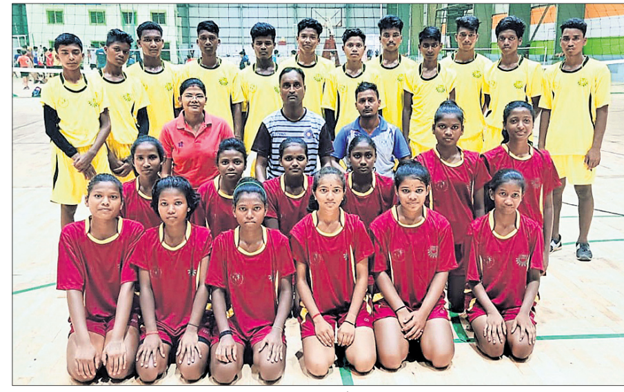
ଆଇଏସ୍ଏପ୍ ଖ୍ରୀଷ୍ଟ ଭଲିବଲ ଚାମ୍ପିୟନଶିପ୍ ପାଇଁ ମନୋନୀତ କିଏ ବାଲିକା ଓ ବାଳକ ଦଳ ।

ଭୁବନେଶ୍ୱର, ୨୧ (ବ୍ରାହ୍ମ ପ୍ରତିନିଧି) ଇଣ୍ଡିଆନ୍‌ସ୍କାଲ ସ୍କୁଲ ଶ୍ରେଣୀ ଫେଡେରେଶନ (ଆଇଏସ୍ଏପ୍) ଆହୁକୁଲ୍ୟରେ ବ୍ରାଜିଲର ଫୋର୍ ୟୁ ଭଲିବଲ ଦଳ (୧୮ ବର୍ଷରୁ କମ୍ ବାଲିକା, ବାଳକ) ଚାମ୍ପିୟନଶିପ୍ରେ ଭାରତରୁ ଏକମାତ୍ର ସ୍କୁଲଭାବେ ଭାରତ ନେବାକୁ ମନୋନୀତ ହୋଇଥିବା କିଏ ଦଳର ଖେଳାଳି ତାଳିକା ଗୁରୁବାର ଘୋଷଣା କରାଯାଇଛି । ଉଭୟ ବାଲିକା ଓ ବାଳକ ଦଳରେ ୧୨ ଜଣ ଲେଖାଏଁ ଖେଳାଳି ସ୍ଥାନ ପାଇଛନ୍ତି । ପ୍ରତିଯୋଗିତା ଚଳିତ