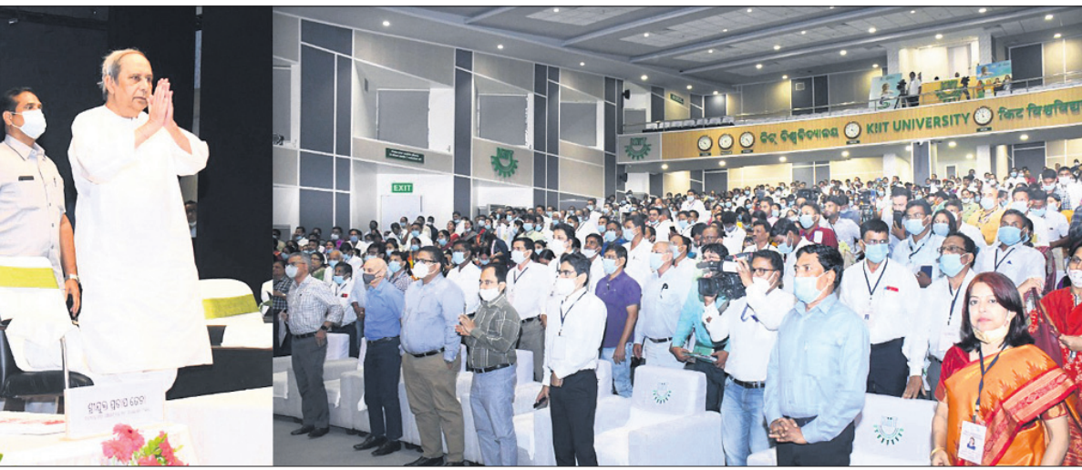
କିଏ ପରିସରରେ ରୁରୁମନ୍ତ୍ର ରାଜ୍ୟପ୍ରଧାନ ପ୍ରଶିକ୍ଷଣ କାର୍ଯ୍ୟକ୍ରମରେ ନବ ନିର୍ବାଚିତ ପଞ୍ଚାୟତ ଜନପ୍ରତିନିଧିମାନଙ୍କ ସହ ମୁଖ୍ୟମନ୍ତ୍ରୀ ନବୀନ ପଟ୍ଟନାୟକ ଓ ଅଧିକାରୀମାନେ।

ସରିଲା କଂଗ୍ରେସ ଚିତ୍ତନ ଶିବିର, ୨୦୨୪ ଲାଗି ରଣନୀତି ପ୍ରସ୍ତୁତ କରିବାକୁ ଲକ୍ଷ୍ୟ