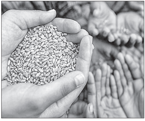
ଏଭଳି ଗହମ ରଖିବା ଧାରା ବିଶ୍ୱରେ କୋଭିଡ୍-୧୯ ଚିକା ପାଇବାପରେ ଅସମାଧାନତାକୁ ଦର୍ଶାଇଛି । ଏଭଳି କାର୍ଯ୍ୟକଳାପର ଅତି ଆବଶ୍ୟକତା ଥିଲେ ଅଭାବ ଦୂର କରିବା ଲାଗି ଆମେ ସମ୍ମିଳିତ ପଦକ୍ଷେପ ମାଧ୍ୟମରେ ବହୁତ କିଛି କରିପାରିବା, ଯାହା ମାର୍କେଟ କରିପାରିବ ନାହିଁ । ଅଭାବ ସମୟରେ ବିଶ୍ୱରେ ବଳକା ବ୍ୟବସ୍ଥା ଯୋଗାଣ ପଦକ୍ଷେପ କିମ୍ବା ବଳକା ଖାଦ୍ୟ ଥିବା ଦେଶମାନଙ୍କ ମଧ୍ୟରେ ଅଭିଯାନ ରୁଦ୍ଧି ନିଶ୍ଚିତ ଭାବେ ଅନ୍ୟମାନଙ୍କୁ ସାହାଯ୍ୟ କରିବ । ଏହା ମଧ୍ୟ ଦୀର୍ଘମିଆଦୀ ସ୍ତରରେ ସମସ୍ୟାର ସମାଧାନ କରିପାରିବ । ଏହି ପଦକ୍ଷେପକୁ ବଦଳାଇଦେବାପାଇଁ ସାହାଯ୍ୟ କରିବ ବୋଲି ବିଶ୍ୱାସ ହେଲେ ଅଧିକାଂଶ ଲୋକ ଗହମ ପ୍ରକ୍ରିୟା ବନ୍ଦ କରିଦେବେ ।

ଯଦି ବିଚାର ଆଧାରରେ ଏହା ବିଶ୍ୱାସଯୋଗ୍ୟ ବୋଲି ଲାଗୁଛି ତେବେ ଖାଦ୍ୟାଭାବ ଏବଂ ଗହମ ପ୍ରତିରକ୍ଷା ଉପରେ ଧ୍ୟାନ ଦେବାକୁ ଆମକୁ ଆବଶ୍ୟକ । ୧୯୯୨ରେ ଏକ ଜାତୀୟ ସାବିକାଳୀନ ଖାଦ୍ୟ ଯୋଗାଣ ପଦକ୍ଷେପ ଗ୍ରହଣ କରିବା ପାଇଁ ଘୋଷଣା କରାଯାଇଥିଲା । ଏହା ୨୦୧୩ରେ ଜାତୀୟ ଖାଦ୍ୟ ସୁରକ୍ଷା ଆଇନରେ ଶେଷ ହୋଇଗଲା । ତିନି ଦଶନ୍ଧିର ପଦକ୍ଷେପ ବଦଳରେ ସର୍ବନିମ୍ନ ଖାଦ୍ୟ ନିଶ୍ଚିତତାର ଏକ ଉତ୍ତମ ବ୍ୟବସ୍ଥା ହାତୀ ପରିବାର ଘୃଷ୍ଣରେ ଗହମ କିଣିବା ପାଇଁ ଆମକୁ ଆବଶ୍ୟକ । ଗହମ ପ୍ରକାର ବ୍ୟବସ୍ଥା ଘଟିବା ପର୍ଯ୍ୟନ୍ତ ଏହା କ୍ଷମତାର ବାହାରେ ଥିଲା ବୋଲି ବିଚାର କରାଯାଉଥିଲା । ଏହିପରି ଭାବେ ଆମେ ବିକା ଭଳି ବଡ଼ ଗଣତାନ୍ତ୍ରିକ ଦେଶରେ ଆମେ ବିକାରେ ସାମାଜିକ ରୁଦ୍ଧି ବା ଆଇନ ନ ହେବା ପର୍ଯ୍ୟନ୍ତ ଅସମ୍ଭବ ଲାଗୁଥିଲା । ଘଟଣା ହେଉଛି, ଏକ ସଫଳ ବୈଶ୍ୱିକ ଏବଂ ଜାତୀୟ ବଳକା ଯୋଗାଣ ବ୍ୟବସ୍ଥା କିମ୍ବା ବଳକା ବ୍ୟବସ୍ଥା ରୁଦ୍ଧି ଆଣିବା ନ ଥିଲେ ମଧ୍ୟ ଆମେ ଆଶା ହରାଇବା ଠିକ୍ ନୁହେଁ । ଆମେ ଆଶା ବାନ୍ଧିବାକୁ ହେବ । ଏହି ରୁଦ୍ଧି ଖାଦ୍ୟକୁ ଅନ୍ୟ ଆର୍ଥିକ ଏବଂ ସାମାଜିକ କ୍ଷେତ୍ରରେ ଗ୍ରହଣ କରାଯାଇପାରେ । ଏବେକାର ସମସ୍ୟାଗୁଡ଼ିକ ସତ୍ତ୍ୱେ, ଜଗତୀୟତାର ଅଭିଯାନ ବନ୍ଦ ହେବ ନାହିଁ । ଏହି ଜଗତୀୟତାର ଅଭିଯାନକୁ ସମାପ୍ତ କରିବାକୁ ରକ୍ଷା କରିବା ଲାଗି ଆମେ ଅତି କମ୍ରେ ବିଶ୍ୱସ୍ତରାୟ ସମ୍ମିଳନୀ ଏବଂ ରୁଦ୍ଧିଗୁଡ଼ିକ କରିବା ଲାଗି ଚେଷ୍ଟିତ ହେବା ଦରକାର, ଯାହାଦ୍ୱାରା ବୈଶ୍ୱିକ ଅଭାବର ସମାଧାନ କରାଯାଇପାରିବ ।