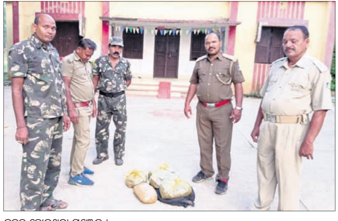
ଜବତ ହୋଇଥିବା ଗଞ୍ଜେଇ ।