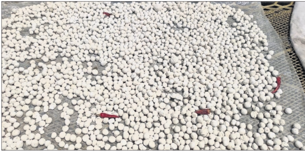
ରକ୍ଷା ମଦ ପ୍ରସ୍ତୁତ ପାଇଁ ଖରାରେ ବାଖରାକୁ ଶୁଖାଯାଇଛି ।

ରାଜନଗର, ୨୬(ଡି.ଏନ.ଏ.) ରାଜନଗର ବ୍ଲକ ମୁଖ୍ୟାଳୟରେ ଅବସ୍ଥିତ ପ୍ରସିଦ୍ଧ ଶୈବପୀଠ ଶ୍ରୀ ଶ୍ରୀଗର୍ଭେଶ୍ୱର ମନ୍ଦିର ପରିସରରେ ପବିତ୍ର ଶୀତଳକ୍ଷ୍ମା ଉତ୍ସବ ଉତ୍ସାହରେ ପାଳନ ହୋଇଛି।