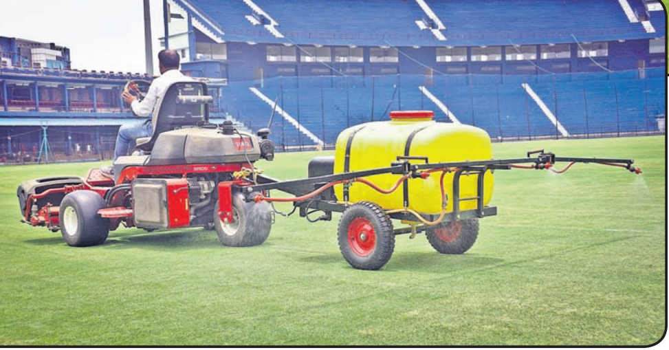
ବାରବାଟୀ ଷ୍ଟାଡ଼ିୟମ ପଡ଼ିଆରେ କେମିକାଲ ସିଞ୍ଚନ କରାଯାଉଛି।

ପ୍ରଥମ ମ୍ୟାଚ: ଭାରତ ବନାମ ଦକ୍ଷିଣ ଆଫ୍ରିକା, ୨୦୧୫ ଅକ୍ଟୋବର ୫ ଦକ୍ଷିଣ ଆଫ୍ରିକା ୬ ଘଣ୍ଟାକେତରେ ବିଜୟ। ଭାରତ ୧୭.୨ ଓଭରରେ ୯୨/ଅଲଆଉଟ (ରୋହିତ ଶର୍ମା-୨୨, ସୁରେଶ ରାଜନା-୨୨, ଆଲ୍‌ବି ମୋକେଲ-୩/୧୨, କ୍ରିସ୍ ମୋରିସ-୨/୧୬, ଇମ୍ରାନ ତାହିର-୨/୨୪, କାରିଶୋ ରାବାଡ଼ା-୧/୧୮)। ଦକ୍ଷିଣ ଆଫ୍ରିକା ୧୭.୧ ଓଭରରେ ୯୬/୪ (ଜେ-ପଲ୍ ଡୁମିନି-୩୦*, ଏବି ଡି'ଭିଲର୍ସ-୧୯, ରବିନ୍ଦ୍ରନ ଅଶ୍ୱିନ-୩/୨୪, ଅକ୍ଷୟ ପଟେଲ-୧/୧୬)। ଦ୍ୱିତୀୟ ମ୍ୟାଚ: ଭାରତ ବନାମ ଶ୍ରୀଲଙ୍କା, ୨୦୧୬, ଡିସେମ୍ବର ୨୦ ଭାରତ ୯୩ ରନରେ ବିଜୟ। ଭାରତ ୨୦ ଓଭରରେ ୧୮୦/୩ (ଲୋକେଶ ରାହୁଲ-୬୧, ମହେନ୍ଦ୍ର ସିଂ ଘୋନା-୩୯*, ମନାଷ ପାଣ୍ଡେ-୩୨, ଶ୍ରେୟାସ ଆୟର-୨୪, ଅକ୍ଷେଲୋ ମାଥ୍ୟୁସ-୧/୧୯, ଥିସାରା ପେରେରା-୧/୩୬, ରୁହାନ ପ୍ରଦୀପ-୧/୩୮)। ଶ୍ରୀଲଙ୍କା ୧୬ ଓଭରରେ ୮୭/ଅଲଆଉଟ (ଉପୁଲ ଥରଙ୍ଗା-୨୩, ସୁଜେନ୍ଦ୍ର ଚନ୍ଦ୍ର-୪/୨୩, ହାର୍ଦ୍ଦିକ ପାଣ୍ଡା-୩/୨୯, କୁଲଦୀପ ଯାଦବ-୨/୧୮, ଜୟଦେବ ଉନାଡକ-୧/୬)।