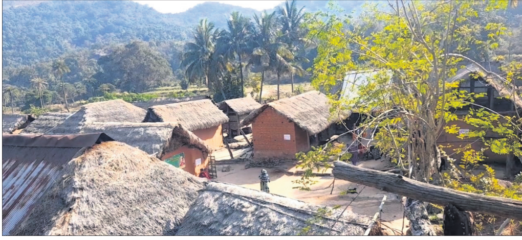
ତାମୁଣ୍ଡି ଗାଁ ଆଦିବାସୀ ପରିବାରର ଚାଳକପତର ଘର ।

ଲୋକନାଥ ମିଶ୍ର ନୟାଗଡ଼ ଅଫିସ, ୨୧୬ ସରକାର ଆଦିବାସୀଙ୍କ ବିକାଶ ପାଇଁ କିପରି କାମ କରୁଛନ୍ତି ପାହାଡ଼ ଉପର ଗାଁ ତାମୁଣ୍ଡି ହିଁ ତାର ନଜିର । ନୟାଗଡ଼ ଜିଲ୍ଲା ଦଶପଲ୍ଲୀ ବ୍ଲକ୍ ଚତୁର୍ଥାଂଶକାଳୀ ପଞ୍ଚାୟତରେ ଥିବା ଏହି ଗାଁରେ ବିକାଶର ନାମଗ୍ରହ ନାହିଁ । ଦେଶ ସ୍ୱାଧୀନ ହେବାର ୭୫ ବର୍ଷ ପରେ ବି ଉଠାଣି ଗଢାଣିଆ ୫ କି.ମି. ଘାଟି ରାସ୍ତାର ଚୁପ୍ ବଦଳି ନାହିଁ । ପୁଣି ଏହି ଗାଁରେ ବର୍ଷ ତମାମ ପାନୀୟ ଜଳ ସମସ୍ୟା ଲାଗି ରହିଛି । ବାରମ୍ବାର ଅଭିଯୋଗ କରାଗଲେ ମଧ୍ୟ ନିରାକରଣ ପାଇଁ ପଦକ୍ଷେପ ନାହିଁ । ବନ୍ୟପ୍ରାଣୀଙ୍କ ଭୟରେ ରହୁଥିବା ଏହି ଆଦିବାସୀ ଗାଁରେ ବିଦ୍ୟୁତ୍ ସଂଯୋଗ ନାହିଁ । ସୋଲାର ଲାଇଟ୍ ଏଠାରେ ଠିକ୍ରେ କାମ କରୁନି । ସର୍ବନିମ୍ନ ସୁବିଧା ଯୋଗାଇବାରେ ସରକାର ବିଫଳ ହୋଇଥିବା ଅଭିଯୋଗ ହୋଇଛି । ନାନା ଅବ୍ୟବସ୍ଥା ମଧ୍ୟରେ ଅଭିଶପ୍ତ ଜୀବନଯାପନ କରୁଛନ୍ତି ତାମୁଣ୍ଡି ଗାଁର ୧୬ ପରିବାରର ୧୦୨ ଆଦିବାସୀ । ସେଠାରେ ଶିକ୍ଷା ବ୍ୟବସ୍ଥା ଆଣିବା ନାହିଁ । ଦଶପଲ୍ଲୀ ବ୍ଲକ୍ ଅଞ୍ଚଳରେ ଥିବା ଆଶ୍ରମ ସ୍କୁଲରେ ଆଦିବାସୀ ଛାତ୍ରଛାତ୍ରୀଙ୍କ ଗଢ଼ାଣୁ ଭବିଷ୍ୟତ । ଗାଁରେ ମାଟ୍ରିକ୍, ମୁକ୍ତ ୨ ଓ ମୁକ୍ତ ୩ ପାଠ ପଢ଼ୁଥିବା ଅନେକ ଯୁବକ ଥିଲେ ହେଁ କେହି ଚାକିରୀ ପାଇ ନାହାନ୍ତି । ଗାଁର କୌଣସି ଲୋକ ରୋଗରେ ପଡ଼ିଲେ ଦୋଳା ଅଥବା ଖଟିଆ ଭରସା । ପାହାଡ଼ିଆ ରାସ୍ତା ଯୋଗୁଁ ଗାଁକୁ ୧୦୮ ଓ ୧୦୨ ଆମ୍ବୁଲାନ୍ସ ଆସି ପାରନାହିଁ । ପଞ୍ଚାୟତ କାର୍ଯ୍ୟାଳୟ ପର୍ଯ୍ୟନ୍ତ ରୋଗୀଙ୍କୁ ଦୋଳା ବା ଖଟିଆରେ ନେବା ପରେ