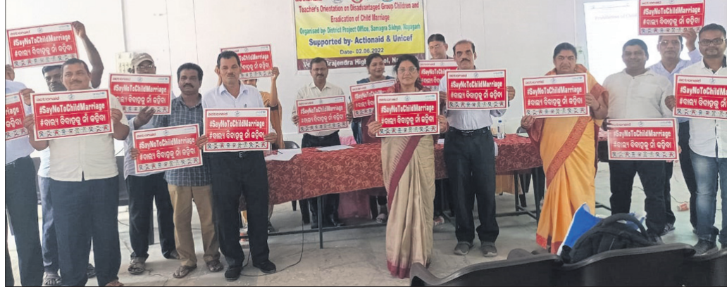
ଶିବିରରେ ଯୋଗଦେବାକୁ ଅତିଥି ଓ ଅନ୍ୟମାନେ ସଚେତନତା ପୋଷ୍ଟର ପ୍ରଦର୍ଶନ କରୁଛନ୍ତି ।

ସମ୍ପର୍କରେ ପ୍ରଶ୍ନ ଉତ୍ତରାପନ କରି ସମାଧାନ ପାଇଁ ଜିଲ୍ଲା ଶିକ୍ଷା ଅଧିକାରୀଙ୍କ ଦୃଷ୍ଟି ଆକର୍ଷଣ କରିଥିଲେ । ଶେଷରେ ଶିକ୍ଷକମାନେ ବାଲ୍ୟ ବିବାହକୁ ନିଷେଧ କରି ଶିଶୁମାନଙ୍କ ସାମଗ୍ରିକ ବିକାଶ ପାଇଁ ଶପଥ ନେଇଥିଲେ ।