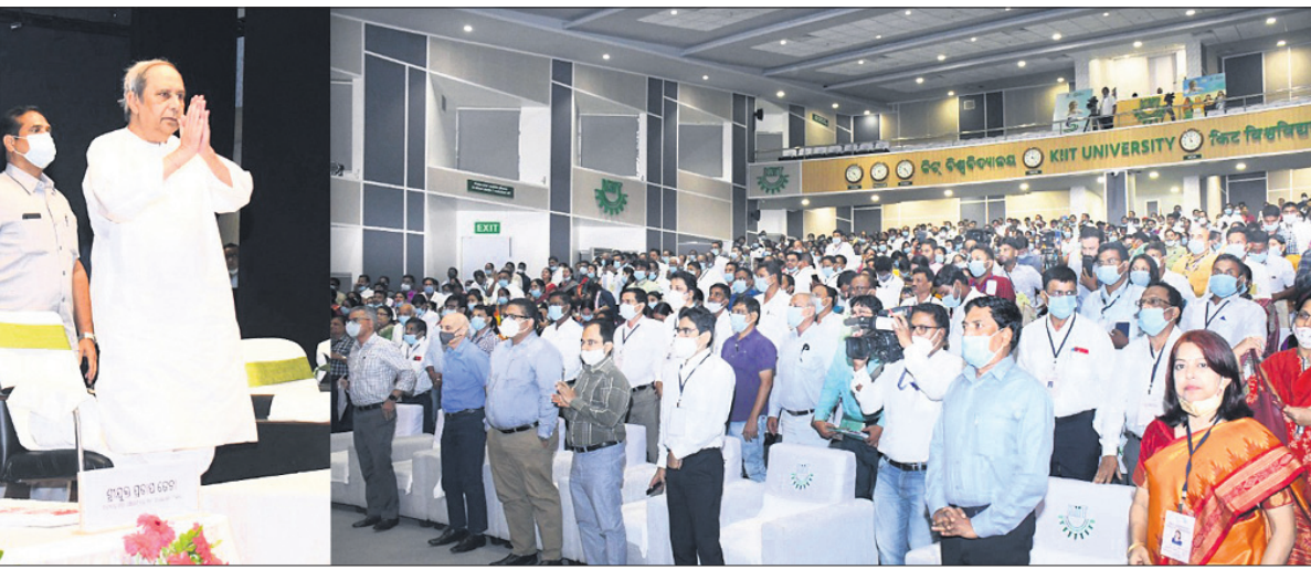
କିଏ ପରିସରରେ ରୁରୁମନ୍ତ୍ର ଅନୁଷ୍ଠିତ ରାଜ୍ୟପ୍ରଗତି ପ୍ରଶିକ୍ଷଣ କାର୍ଯ୍ୟକ୍ରମରେ ନବ ନିର୍ବାଚିତ ପଞ୍ଚାୟତ ଜନପ୍ରତିନିଧିମାନଙ୍କ ସହ ମୁଖ୍ୟମନ୍ତ୍ରୀ ନବୀନ ପଟ୍ଟନାୟକ ଓ ଅଧିକାରୀମାନେ।

ସରିଲା କଂଗ୍ରେସ ଚିତ୍ତନ ଶିବିର, ୨୦୨୪ ଲାଗି ରଣନୀତି ପ୍ରସ୍ତୁତ କରିବାକୁ ଲକ୍ଷ୍ୟ