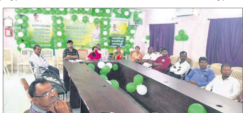
ବୈଠକରେ ଉପସ୍ଥିତ ପଞ୍ଚାୟତ ରାଜସଭା ସଭ୍ୟ।

ପାପଡ଼ାହାଣ୍ଡି ବ୍ଲକ ଅଧୀନ ଗୃହରେ ଅନୁଷ୍ଠିତ ଏକ କାର୍ଯ୍ୟକ୍ରମରେ ଭାର୍ତୀୟ ମାଧ୍ୟମରେ ନବନିର୍ବାଚିତ ପଞ୍ଚାୟତ ଜନପ୍ରତିନିଧିଙ୍କୁ ପୁଞ୍ଜୀମଣ୍ଡଳ ନବୀନ ପଦନାୟକ ଗୁରୁବାର ଗୁରୁମୁଖ ଦେଇଛନ୍ତି। ବ୍ଲକର ପଞ୍ଚାୟତ ରାଜ ଜନପ୍ରତିନିଧିମାନଙ୍କ