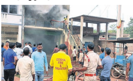
ଅଗ୍ନିଶମ ବାହିନୀ ନିଆଁ ଆୟତ୍ତ କରୁଛି।

ରାୟଗଡ଼ା ଜିଲା ପୁନିଗୁଡ଼ା ହରମୁଖୀ ବାଟିକା ନିକଟସ୍ଥ ଉମା ପେଟ୍ରୋଲ ସମ୍ମୁଖରେ ଥିବା ନଷ୍ଟ ଗ୍ୟାରେଜର ଉପର ଷ୍ଟୋର ରୁମ୍‌ରେ ଗୁରୁବାର ଅପରାହ୍ନରେ ଅଗ୍ନିକାଣ୍ଡ ଘଟିଛି। ଏଥିରେ ଲକ୍ଷାଧିକ ଟଙ୍କାର ସାମଗ୍ରୀ ନଷ୍ଟ ହୋଇଛି। ସୂଚନା ଅନୁଯାୟୀ, ପାଠ ଅଗ୍ନିଶମ ବିଭାଗର ଅଧିକାରୀ ଓ କର୍ମଚାରୀ ପହଞ୍ଚି ନିଆଁ ଆୟତ୍ତ କରିଥିଲେ। ତେବେ କେଉଁ ବେଳେ ଉପରେ ମହଲାରେ ରହିଥିବା ଷ୍ଟୋର କାରଖାନା ନିଆଁ ଲାଗିଲା ତାହା ଅସ୍ପଷ୍ଟ ରହିଛି। ରୁମ୍‌ରେ ହାତ ନିଆଁ ଲାଗିଯାଇଥିଲା। ଖବର ଶରସ୍ୱର୍ଗଚରୁ ନିଆଁ ଲାଗିଥିବା ଅନୁମାନ କରାଯାଉଛି।