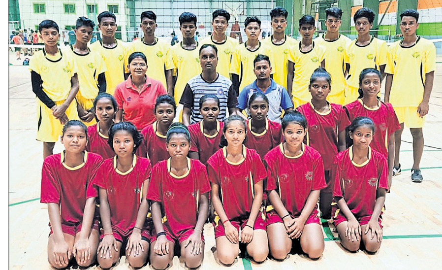
ଆଇଏସ୍ଏସ୍ ଖୁଲ୍ଲୁ ଭଲିବଲ୍ ଚାମ୍ପିୟନଶିପ୍ ପାଇଁ ମନୋନୀତ କିସ୍ ବାଳିକା ଓ ବାଳକ ଦଳ ।

ଭୁବନେଶ୍ୱର, ୨୬ (କ୍ରୀଡ଼ା ପ୍ରତିନିଧି) ଇଣ୍ଡୋନେସିଆର ଖୁଲ୍ଲୁ ଘୋଷ୍ଟ ଫେଡେରେଶନ (ଆଇଏସ୍ଏସ୍) ଆନୁକୁଲ୍ୟରେ ବ୍ରାଜିଲର ଫୋର୍ ଡୁ ଇଣ୍ଡୋନେସିଆରେ ହେବାକୁଥିବା ଖୁଲ୍ଲୁ ଭଲିବଲ୍ (୧୮ ବର୍ଷରୁ କମ୍ ବାଳିକା, ବାଳକ) ଚାମ୍ପିୟନଶିପ୍ରେ ଭାରତରୁ ଏକମାତ୍ର ଖୁଲ୍ଲୁଭାବେ ଭାରତ ନେବାକୁ ମନୋନୀତ ହୋଇଥିବା କିସ୍ ଦଳର ଖେଳାଳି ତାଲିକା ଗୁରୁବାର ଘୋଷଣା କରାଯାଇଛି । ଉଭୟ ବାଳିକା ଓ ବାଳକ ଦଳରେ ୧୨ ଜଣ ଲେଖାଏ ଖେଳାଳି ସ୍ଥାନ ପାଇଛନ୍ତି । ପ୍ରତିଯୋଗିତା ଚଳିତ