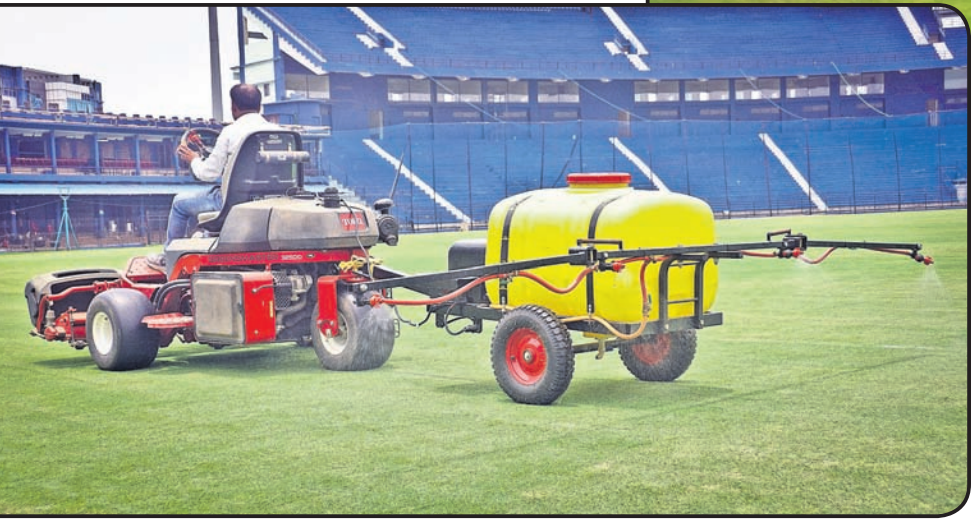
ବାରବାଟୀ ଷ୍ଟାଡ଼ିୟମ ପଡ଼ିଆରେ କେମିକାଲ ସିସ୍ଟମ କରାଯାଉଛି।