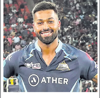
କ୍ୟାପଟେନ ହାର୍ଦ୍ଦିକ ବିଜୟ ବଧାଇ ମାନ ରଖି ମାଲେମାଲ ଗୁଜୁରାଟ ଚାଲଟକ୍ସ ପ୍ରଥମ ଆଇପିଏଲ ଚାଲଟଲ ଉକ୍ତ ଆଶା ଦିଏ ଗୋଲ ବଡି ଲାଙ୍ଗୁଏକ୍ସ ଲୋକଙ୍କୁ ଚିହ୍ନିବା ମୁସିଲ କାଣିଆ ଖୁଲ।

ମେଗା ଅକ୍ସନ ପରେ ଷ୍ଟାର ଶୂନ୍ୟ ଥିଲା ଦିନେ ଗୁଜୁରାଟ ଦମ୍ ରଖି ଟିମ୍ ପାଖ୍ୟା ପଣ କରି ଦେଖାଇଲା ସବୁ ବାଟ ଖାଇ ଶାହା, ଖାନ୍ ଛାଟ ଦଳକୁ ପ୍ୟାସ ଶୀର୍ଷରେ ରଖି କହେ ଫାଇନାଲ ନାଟ।