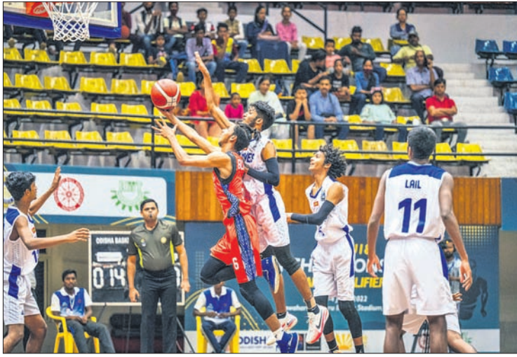
୧୮ ବର୍ଷରୁ କମ୍ ଏସିଆନ ବାସ୍‌କେଟ୍‌ବଲ୍ ଚାମ୍ପିୟନସ୍‌ସ୍‌ପର୍ ଉଦ୍‌ଘାଟନ ପରେ ଖେଳାଳିଙ୍କ ସହ ପରିଚୟ ହେଉଛନ୍ତି କ୍ରୀଡ଼ାମନ୍ତ୍ରୀ ରୁଷ୍‌ୟରକାନ୍ତି ବେହେରା । ବାଂଲାଦେଶ-ମାଳଦୀପ ମଧ୍ୟରେ ଅନୁଷ୍ଠିତ ମ୍ୟାଚ୍ ।