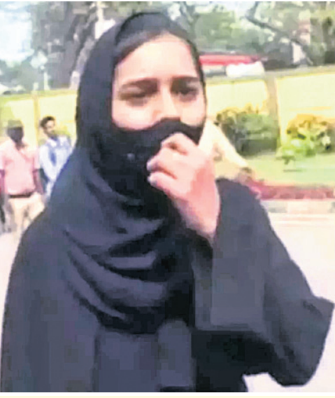
କର୍ମଚରୀ ହିଜାବ ଗଲି ମୁଖ୍ୟମନ୍ତ୍ରୀ

୨୦୧୪ରେ ନରେନ୍ଦ୍ର ମୋଦିଙ୍କ ନେତୃତ୍ୱାଧୀନ ଭାଜପା ସରକାର କେନ୍ଦ୍ରରେ କ୍ଷମତାସୀନ ହେବା ପରେ ଭାରତରେ ସଂଖ୍ୟାଲଘୁ ସୁଧାକରମାନ ଓ ଆଦିବାସୀ ସମୁଦାୟ ବିରୋଧରେ ହିଂସା ବଢ଼ିବାରେ ଲାଗିଥିବା ୨୦୨୧ରେ ଆମେରିକା ଏକ ମାନବାଧିକାର ରିପୋର୍ଟରେ ଦର୍ଶାଇଥିଲା। ସେହିପରି ଯୁଏସ୍ କମିଶନ ଅଫ୍ ଇଣ୍ଟରନାଶନାଲ ରିଲିଜିଅସ୍ ଫ୍ରିଡମ୍ ପକ୍ଷରୁ ଚଳିତ ବର୍ଷ ପ୍ରକାଶିତ ରିପୋର୍ଟରେ ମଧ୍ୟ ଭାରତରେ ଜାତି ଓ ଧର୍ମ ଭିତ୍ତିକ ସାଧାରଣତା ନଷ୍ଟ ହେବାରେ ଲାଗିଥିବା କୁହାଯାଇଛି।