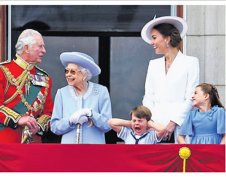
କ୍ରିବେନ ମହାରାଣୀ ଏଲିଜାବେଥ୍ ଦ୍ୱିତୀୟଙ୍କ ଶାସନକୁ ୭୦ ବର୍ଷ ପୂରିଛି। ପ୍ଲାଟିନମ ଜୁବିଲି ପାଳନ ଅବସରରେ ଗୁରୁବାର ଲଣ୍ଡନର ବକିଂହାମ୍ ପ୍ୟାଲେସ୍ ବାଲକୋନିରେ ମହାରାଣୀ ଅଭିବାଦନ ଗ୍ରହଣ କରୁଥିବାବେଳେ ତାଙ୍କ ସହ ପ୍ରିନ୍ସ ଚାର୍ଲସ୍, କେମ୍ବ୍ରିଜ୍ ଡଚେସ୍ କ୍ୟାଥରୀନ୍, ପ୍ରିନ୍ସସେସ୍ ଚାରଲୋଟ ଏବଂ ପ୍ରିନ୍ସ ଲୁଇସ୍।