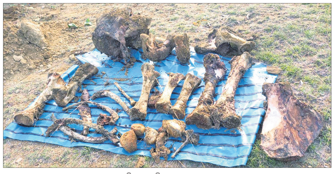
ମାଟିତଳୁ ବାହାରିଥିବା ହାତୀର କଙ୍କାଳ ।