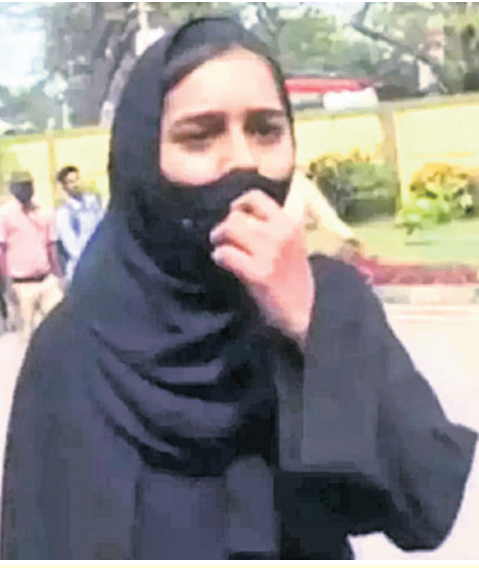
କର୍ମଚକର ହିଜାବ ଗଲି ମୁଖ୍ୟମନ୍ତ୍ରୀଙ୍କୁ

୨୦୧୪ରେ ନରେନ୍ଦ୍ର ମୋଦିଙ୍କ ନେତୃତ୍ୱାଧୀନ ଭାଜପା ସରକାର କେନ୍ଦ୍ରରେ କ୍ଷମତାସାଧନ ହେବା ପରେ ଭାରତରେ ସଂଖ୍ୟାଲଘୁ ମୁସଲମାନ ଓ ଆଦିବାସୀ ସମୁଦାୟ ବିରୋଧରେ ହିଂସା ବଢ଼ିବାରେ ଲାଗିଥିବା ୨୦୨୧ରେ ଆମେରିକା ଏକ ମାନବାଧିକାର ରିପୋର୍ଟରେ ଦର୍ଶାଇଥିଲା। ସେହିପରି ଯୁଏସ୍ କମିଶନ ଅଫ୍ ଇଣ୍ଟରନାଶନାଲ ରିଲିଜିଅସ୍ ଫ୍ରିଡମ୍ ପକ୍ଷରୁ ଚଳିତ ବର୍ଷ ପ୍ରକାଶିତ ରିପୋର୍ଟରେ ମଧ୍ୟ ଭାରତରେ ଜାତି ଓ ଧର୍ମ ଭିତ୍ତିକ ସ୍ୱାଧୀନତା ନଷ୍ଟ ହେବାରେ ଲାଗିଥିବା କୁହାଯାଇଛି। ଗତ ଏପ୍ରିଲ ୧୬ରେ ଉତ୍ତର-ପଶ୍ଚିମ ଦିଲ୍ଲୀର ଭାଜପାପୁରୀରେ ହନୁମାନ ଜୟନ୍ତୀ ପାଳନ ଉପଲକ୍ଷେ ଶୋଭାଯାତ୍ରା ଚାଲିଥିବାବେଳେ ଏକ ମସ୍ଜିଦ୍ ନିକଟରେ ଲୋକଙ୍କ ଉପରକୁ ଟେକାମାଡ଼ ହୋଇଥିଲା। ଏହି ସାମ୍ପ୍ରଦାୟିକ ଦଙ୍ଗା ପରେ ମୁସଲମାନମାନଙ୍କ ଘରଗୁଡ଼ିକୁ ବୁଲିଦେଖିବା ମଡ଼ାକ ଭାଙ୍ଗି ଦିଆଯାଇଥିଲା। ୨୦ ତାରିଖରେ ଉଚ୍ଚେଦ