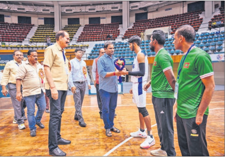
୧୮ ବର୍ଷରୁ କମ୍ ଏସିଆନ୍ ବାସ୍‌କେଟବଲ ଚାମ୍ପିୟନସ୍‌ଟ୍ରୀପ୍‌ସ୍‌ ଉଦ୍‌ଘାଟନ ପରେ ଖେଳାଳିଙ୍କ ସହ ପରିଚୟ ହେଉଛନ୍ତି କ୍ରୀଡ଼ାମନ୍ତ୍ରୀ ରୁଷ୍‌ୟାକାନ୍ତି ବେହେରା । ବାଲ୍‌କାଦେଶ-ମାଳଦୀପ ମଧ୍ୟରେ ଅନୁଷ୍ଠିତ ମ୍ୟାଚ୍ ।