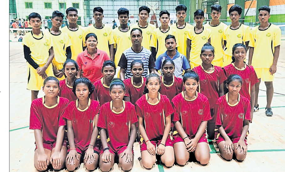
ଆଇଏସ୍ଏସ୍ ଖୁଲ୍ଲୁ ଭଲିବଲ ଚାମ୍ପିୟନଶିପ୍ ପାଇଁ ମନୋନୀତ କିଏ ବାଳିକା ଓ ବାଳକ ଦଳ ।

ଭୁବନେଶ୍ୱର, ୨୬ (କ୍ରୀଡ଼ା ପ୍ରତିନିଧି) ଇଣ୍ଡୋନେସିଆର ଖୁଲ୍ଲୁ ଘୋଷ୍ଟ ଫେଡେରେଶନ (ଆଇଏସ୍ଏସ୍ଏସ୍) ଆନୁକୁଲ୍ୟରେ ବ୍ରାଜିଲର ଫୋର୍ ଡୁ ଇଣ୍ଡୋନେସିଆରେ ହେବାକୁଥିବା ଖୁଲ୍ଲୁ ଭଲିବଲ (୧୮ ବର୍ଷରୁ କମ୍ ବାଳିକା, ବାଳକ) ଚାମ୍ପିୟନଶିପ୍ରେ ଭାରତରୁ ଏକମାତ୍ର ସ୍କୁଲଭାବେ ଭାରତ ନେବାକୁ ମନୋନୀତ ହୋଇଥିବା କିଏ ଦଳର ଖେଳାଳି ତାଲିକା ଗୁରୁବାର ଘୋଷଣା କରାଯାଇଛି । ଉଭୟ ବାଳିକା ଓ ବାଳକ ଦଳରେ ୧୨ ଜଣ ଲେଖାଏ ଖେଳାଳି ସ୍ଥାନ ପାଇଛନ୍ତି । ପ୍ରତିଯୋଗିତା ଚଳିତ