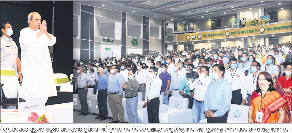
କିମ୍ବଦନ୍ତୀ ପରିସରରେ ରୁରୁମନ୍ତ୍ର ଭୁବନେଶ୍ୱର ରାଜ୍ୟପ୍ରଧାନ ପ୍ରଶିକ୍ଷଣ କାର୍ଯ୍ୟକ୍ରମରେ ନବ ନିର୍ବାଚିତ ପଞ୍ଚାୟତ ଜନପ୍ରତିନିଧିମାନଙ୍କ ସହ ମୁଖ୍ୟମନ୍ତ୍ରୀ ନବୀନ ପଟ୍ଟନାୟକ ଓ ଅଧିକାରୀମାନେ।

ଭୁବନେଶ୍ୱର, ୨୬(ବ୍ୟୁରୋ) ଗାଁର ସମସ୍ୟାକୁ ନିଜ ସମସ୍ୟା ଭାବେ ଗ୍ରହଣ କରି ଏହାର ସମାଧାନ ପାଇଁ ନିଷ୍ଠାପର ଉଦ୍ୟମ କରିବାକୁ ରାଜ୍ୟର ନବ ନିର୍ବାଚିତ ପଞ୍ଚାୟତ ପ୍ରତିନିଧିମାନଙ୍କୁ ମୁଖ୍ୟମନ୍ତ୍ରୀ ନବୀନ ପଟ୍ଟନାୟକ ପରାମର୍ଶ ଦେଇଛନ୍ତି। ରୁରୁମନ୍ତ୍ର ଭୁବନେଶ୍ୱର କିମ୍ବଦନ୍ତୀ ପରିସରରେ ଅନୁଷ୍ଠିତ ପଞ୍ଚାୟତ ପ୍ରତିନିଧିଙ୍କୁ ପ୍ରଶିକ୍ଷଣ କାର୍ଯ୍ୟକ୍ରମରେ ଯୋଗଦେଇ ମୁଖ୍ୟମନ୍ତ୍ରୀ କହିଛନ୍ତି ଯେ ଏଥର ପଞ୍ଚାୟତମାନେ ବହୁ ସଂଖ୍ୟାରେ ଜିତି ପଞ୍ଚାୟତର ମଙ୍ଗ ଧରିଛନ୍ତି। ଏହାଦ୍ୱାରା ବିଭିନ୍ନପ୍ରକାର ମହିଳା ସଶକ୍ତୀକରଣର ସ୍ୱପ୍ନ ସାକାର ହୋଇଛି। ଶାସନ ବ୍ୟବସ୍ଥା ଓ ବିକାଶ ଯୋଜନାରେ ପଞ୍ଚାୟତର ରୁରୁତ୍ୱପୂର୍ଣ୍ଣ ଭୂମିକା ରହିଛି। ପଞ୍ଚାୟତ ହେଉଛି ସେବାର କେନ୍ଦ୍ର। ସାଧାରଣ ଲୋକ ଯେପରି ସରକାରୀ ସେବାକୁ ବଞ୍ଚିତ ନ ହୁଏ, ସରକାରୀ ସେବା ପାଇବାରେ ହଇଜା ନ ହୁଏ, ସେଥିପ୍ରତି ଧ୍ୟାନ ଦେବାକୁ ମୁଖ୍ୟମନ୍ତ୍ରୀ ପରାମର୍ଶ ଦେଇଛନ୍ତି। ଗରିବ ଲୋକ, ମହିଳା ତଥା ଦୁର୍ବଳ ଶ୍ରେଣୀର ଲୋକଙ୍କ ଅଧିକାରକୁ ସୁରକ୍ଷା ଦେବା ସହ ଲୋକଙ୍କ ପୁଞ୍ଜି ଖୁଣ୍ଟରେ ସାମିଲ ହେବାକୁ ପରାମର୍ଶ ଦେଇଥିଲେ।