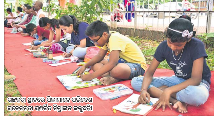
ଗଛକଟା ଘାତରେ ପିଲାମାନେ ପରିବେଶ ସୁରକ୍ଷା ପ୍ରତିରୋଧ କରିବା ପାଇଁ ଚିତ୍ରାଙ୍କନ କରୁଛନ୍ତି।

ରାଜଧାନୀରେ ବିଧାୟକଙ୍କ ପାଇଁ ଗଛକଟି ଅତ୍ୟାଧୁନିକ କ୍ୱାର୍ଟର୍ସ ନିର୍ମାଣ ପ୍ରସଙ୍ଗ ଦିନକୁ ଦିନ ନୂଆ ମୋଡ଼ ନେବାରେ ଲାଗିଛି। ହାଇକୋର୍ଟରେ ହୋଇଥିବା ଜନସ୍ୱାର୍ଥ ମାମଲା ଉପରେ ଗୁରୁବାର ଶୁଣାଣି କରି ସତ୍ୟପାଠ ମାଧ୍ୟମରେ ତଥ୍ୟ ରଖିବା ପାଇଁ ସରକାରଙ୍କୁ ନିର୍ଦ୍ଦେଶ ଦିଆଯାଇଛି। ଏଥିସହ ଗଛକଟାକୁ ପରବର୍ତ୍ତୀ ଆବେଶ ପର୍ଯ୍ୟନ୍ତ ବନ୍ଦ ରଖିବାକୁ ହାଇକୋର୍ଟ ନିର୍ଦ୍ଦେଶ ଦେଇଛନ୍ତି। ଅନ୍ୟପକ୍ଷରେ ଘଟଣାସ୍ଥଳରେ ଗୁରୁବାର ମହାନଦୀ ବଞ୍ଚାଅ ଆନ୍ଦୋଳନ ପକ୍ଷରୁ ଶୁଣାଣି ପାଇଁ ନେଇ 'ଗଛ ହିଁ ଜୀବନ' ଶୀର୍ଷକ ଚିତ୍ରାଙ୍କନ ପ୍ରତିଯୋଗିତା ମାଧ୍ୟମରେ ଗଛକଟାକୁ ବିରୋଧ କରାଯାଇଛି।