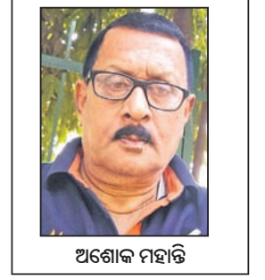
ଦକ୍ଷ ପ୍ରଶାସକ, ଖ୍ୟାତନାମା କ୍ରିକେଟର