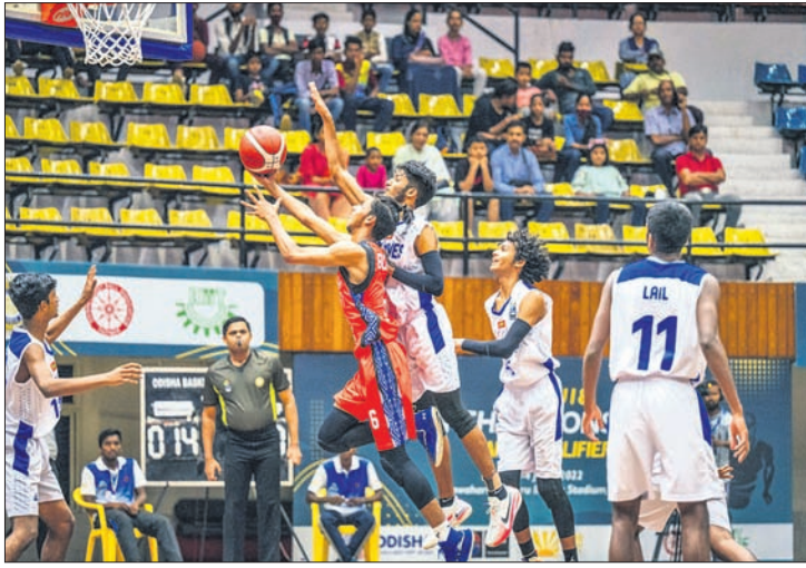
୧୮ ବର୍ଷରୁ କମ୍ ଏସିଆନ୍ ବାସ୍‌କେଟବଲ ଚାମ୍ପିୟନସ୍‌ଟ୍ରୀପ୍‌ସ୍‌ ଉଦ୍‌ଘାଟନ ପରେ ଖେଳାଳିଙ୍କ ସହ ପରିଚୟ ହେଉଛନ୍ତି କ୍ରୀଡ଼ାମନ୍ତ୍ରୀ ରୁଷ୍‌ୟାକାନ୍ତି ବେହେରା । ବାଲ୍‌କାଦେଶ-ମାଳଦୀପ ମଧ୍ୟରେ ଅନୁଷ୍ଠିତ ମ୍ୟାଚ୍ ।