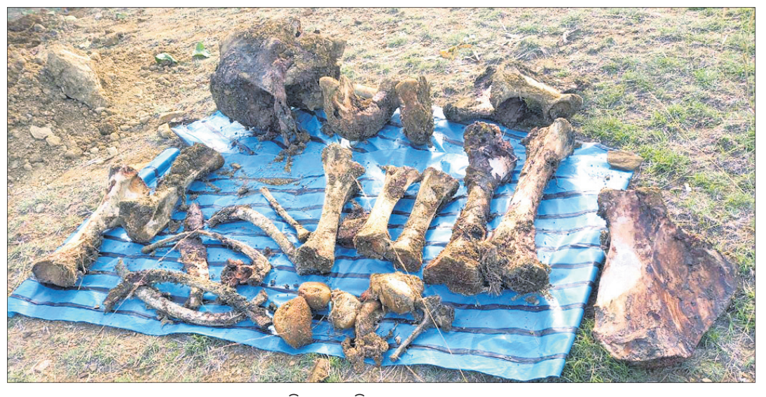
ମାଟିତଳୁ ବାହାରିଥିବା ହାତୀର କଙ୍କାଳ ।