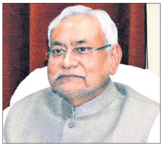
ବିହାର ମୁଖ୍ୟମନ୍ତ୍ରୀ ନୀତୀଶ କୁମାର

ପାଟନା, ୨୧: ବିହାରରେ ଜାତିଭିତ୍ତିକ ଜନଗଣନାକୁ ରାଜ୍ୟ ମନ୍ତ୍ରିମଣ୍ଡଳ ଗୁରୁବାର ମଞ୍ଜୁରୀ ପ୍ରଦାନ କରିଛି। ଧାର୍ଯ୍ୟ ସମୟସୀମା ମଧ୍ୟରେ ଏହି ଜନଗଣନା ହେବ ବୋଲି ବିହାର ମୁଖ୍ୟମନ୍ତ୍ରୀ ନୀତୀଶ କୁମାର କହିଛନ୍ତି। ଆସନ୍ତା ବର୍ଷ ଫେବୃଆରୀ ୨୩ରେ ସର୍ବେ ଶେଷ ହେବ। ସାଧାରଣ ପ୍ରଶାସନ ବିଭାଗ ବିଜ୍ଞପ୍ତି ପ୍ରକାଶ କରିବା ପରେ କାର୍ଯ୍ୟ ଆରମ୍ଭ ହୋଇଯିବ ବୋଲି ମୁଖ୍ୟ ସଚିବ ଅମିତ୍ ଶୁଭାନି କହିଛନ୍ତି। ରାଜ୍ୟ ସରକାରଙ୍କ ଉଦ୍ଦେଶ୍ୟକାମନା ପାଣ୍ଡୁ ଏଥିପାଇଁ ୫୦୦ କୋଟି ଟଙ୍କା ବ୍ୟୟ କରାଯିବ। ଗୁପ୍ତତା ସର୍ବଦା ରଖି ଦେଖି ନିର୍ଦ୍ଦେଶ ଦିଆଯାଇଛି।