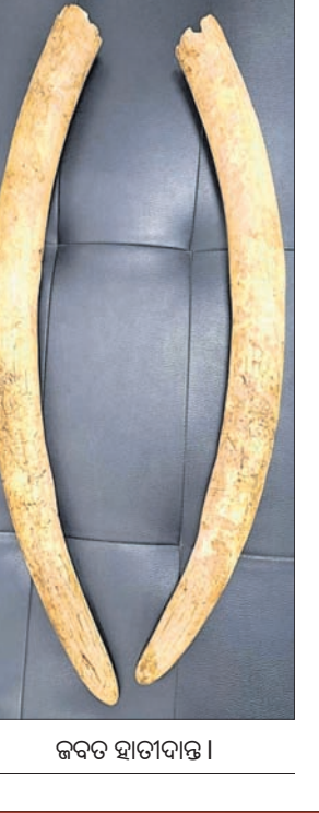
ଜବତ ହାତୀଦାନ୍ତ ।

ଭୁବନେଶ୍ୱର, ୨୬ (ସ୍ପୋର୍ଟ୍ସ୍ ଡେସ୍କ) କ୍ରାଇମ୍‌ସ୍ଟାଫ୍ ରେଞ୍ଜର ଗାନ୍ଧୀ ଫୋର୍ସ (ଏସ୍‌ଟିଏଫ୍) ଅନୁଗୋଳ ଜିଲା ପୁରୁଣାକୋଟ ଥାନା ଅଞ୍ଚଳରେ ଚଢ଼ାଉ କରି ଜଣେ ବନ୍ୟପ୍ରାଣୀ ଚାଲାଣକାରୀଙ୍କୁ ଗିରଫ କରିଛି । ସେ ହେଲେ କନ୍ଧକୋଇଲି ଗ୍ରାମର ବୁର୍ଯ୍ୟୋଧନ ପ୍ରଧାନ । ତାଙ୍କଠାରୁ ୪ କେଜି ୫୦୦ ଗ୍ରାମର ୨ଟି ହାତୀଦାନ୍ତ ଜବତ କରାଯାଇଛି । ସେ ହାତୀ ଦାନ୍ତ ରଖିବା ସଂକ୍ରାନ୍ତ କୌଣସି ବିଧି କାରକପତ୍ର ଦେଖାଇ ପାରି ନ ଥିଲେ । ତେଣୁ ତାଙ୍କୁ ଗିରଫ ପରେ ଆଇନଗତ କାର୍ଯ୍ୟାନୁଷ୍ଠାନ ଗ୍ରହଣ କରିବାକୁ ଅନୁଗୋଳ ବନ ବିଭାଗକୁ ହସ୍ତାନ୍ତର କରାଯାଇଛି । ତେବେ ସେ କୌଣସି ହାତୀକୁ ଶିକାର କରିଥିଲେ କି, ଉଚ୍ଚ ଦାନ୍ତ କାହାକୁ ଦେଇଥାନ୍ତେ, ଏଥିରେ ଆଉ କେଉଁମାନେ ସମ୍ପୃକ୍ତ ଅଛନ୍ତି ଏଭଳି ବିଭିନ୍ନ ଦିଗକୁ ନେଇ ଏସ୍‌ଟିଏଫ୍