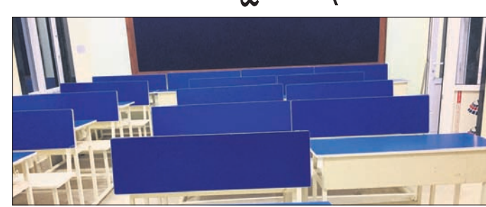
ରଘୁତରାକରଣ ଲାଞ୍ଜିପଲୀ ସ୍କୁଲ। ବ୍ରହ୍ମପୁର ଅଫିସ, ୨୬