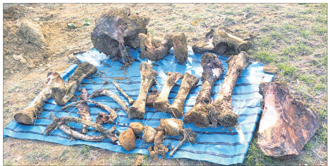
ମାଟିତଳୁ ବାହାରିଥିବା ହାତୀର କଙ୍କାଳ ।