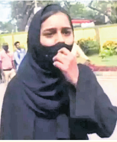
କର୍ମଚରୀ ହିଜାବ ଗଳ୍ପ ମୁଖ୍ୟମନ୍ତ୍ରୀ

୨୦୧୪ରେ ନରେନ୍ଦ୍ର ମୋଦିଙ୍କ ନେତୃତ୍ୱାଧୀନ ଭାଜପା ସରକାର କେନ୍ଦ୍ରରେ କ୍ଷମତାସୀନ ହେବା ପରେ ଭାରତରେ ସଂଖ୍ୟାଲଘୁ ସୁଧାକରମାନ ଓ ଆଦିବାସୀ ସମୁଦାୟ ବିରୋଧରେ ହିଂସା ବଢ଼ିବାରେ ଲାଗିଥିବା ୨୦୨୧ରେ ଆମେରିକା ଏକ ମାନବାଧିକାର ରିପୋର୍ଟରେ ଦର୍ଶାଇଥିଲା। ସେହିପରି ଯୁଏସ୍ କମିଶନ ଅଫ୍ ଇଣ୍ଟରନାଶନାଲ ରିଲିଜିଅସ୍ ଫ୍ରିଡମ୍ ପକ୍ଷରୁ ଚଳିତ ବର୍ଷ ପ୍ରକାଶିତ ରିପୋର୍ଟରେ ମଧ୍ୟ ଭାରତରେ ଜାତି ଓ ଧର୍ମ ଭିତ୍ତିକ ସ୍ୱାଧୀନତା ନଷ୍ଟ ହେବାରେ ଲାଗିଥିବା କୁହାଯାଇଛି।