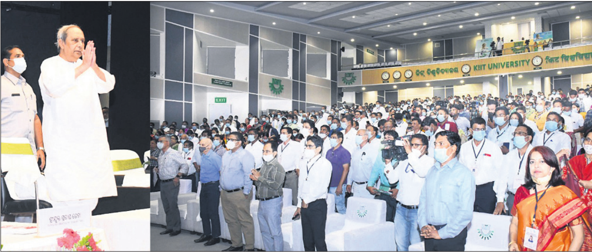
କିଏ ପରିସରରେ ରୁରୁମନ୍ତ୍ର ଅନୁଷ୍ଠିତ ରାଜ୍ୟପ୍ରଭାସ ପ୍ରଶିକ୍ଷଣ କାର୍ଯ୍ୟକ୍ରମରେ ନବ ନିର୍ବାଚିତ ପଞ୍ଚାୟତ ଜନପ୍ରତିନିଧିମାନଙ୍କ ସହ ମୁଖ୍ୟମନ୍ତ୍ରୀ ନବୀନ ପଟ୍ଟନାୟକ ଓ ଅଧିକାରୀମାନେ।

ସରିଲା କଂଗ୍ରେସ ଚିତ୍ତନ ଶିବିର, ୨୦୨୪ ଲାଗି ରଣନୀତି ପ୍ରସ୍ତୁତ କରିବାକୁ ଲକ୍ଷ୍ୟ