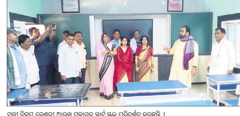
ମନ୍ତ୍ରୀ ବିକ୍ରମ କେଶରୀ ଆରୁଖ ମୁକାରତ୍ ସ୍ମାର୍ଟ ସ୍କୁଲ ପରିଦର୍ଶନ କରୁଛନ୍ତି ।