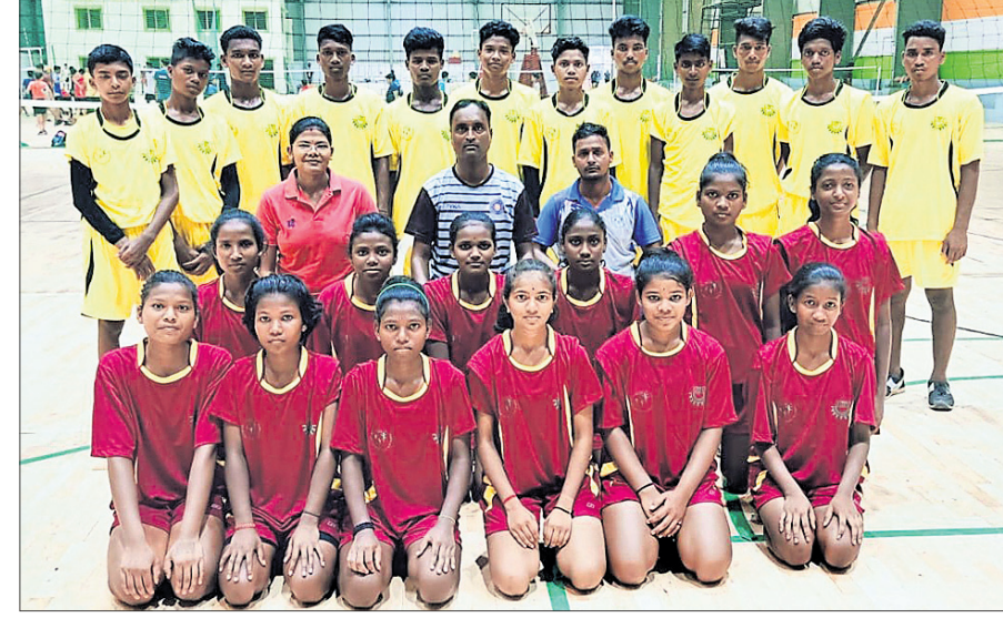
ଆଇଏସ୍ଏସ୍ ଖୁଲ୍ଲୁ ଭଲିବଲ ଚାମ୍ପିୟନଶିପ୍ ପାଇଁ ମନୋନୀତ କିସ୍ ବାଳିକା ଓ ବାଳକ ଦଳ ।

ଭୁବନେଶ୍ୱର, ୨୬ (କ୍ରୀଡ଼ା ପ୍ରତିନିଧି) ଇଣ୍ଡୋନେସିଆର ଖୁଲ୍ଲୁ ଘୋଷ୍ଟ ଫେଡେରେଶନ (ଆଇଏସ୍ଏସ୍ଏ) ଆନୁକୁଲ୍ୟରେ ବ୍ରାଜିଲର ଫୋର୍ ଡୁ ଇନ୍ଦୁଆଲ୍ରେ ହେବାକୁଥିବା ଖୁଲ୍ଲୁ ଭଲିବଲ (୧୮ ବର୍ଷରୁ କମ୍ ବାଳିକା, ବାଳକ) ଚାମ୍ପିୟନଶିପ୍ରେ ଭାରତରୁ ଏକମାତ୍ର ସ୍କୁଲଭାବେ ଭାରତ ନେବାକୁ ମନୋନୀତ ହୋଇଥିବା କିସ୍ ଦଳର ଖେଳାଳି ତାଳିକା ଗୁରୁବାର ଘୋଷଣା କରାଯାଇଛି । ଉଭୟ ବାଳିକା ଓ ବାଳକ ଦଳରେ ୧୨ ଜଣ ଲେଖାଏ ଖେଳାଳି ସ୍ଥାନ ପାଇଛନ୍ତି । ପ୍ରତିଯୋଗିତା ଚଳିତ