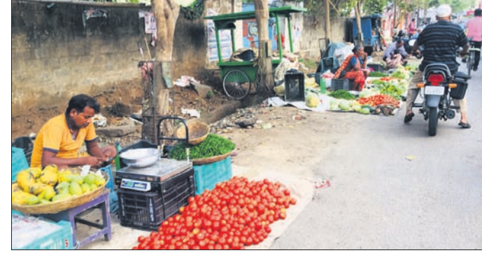
ରାସ୍ତା କଡ଼ରେ ବସିଥିବା ବ୍ୟବସାୟୀ। ବ୍ରହ୍ମପୁର ଅଫିସ, ୨୬