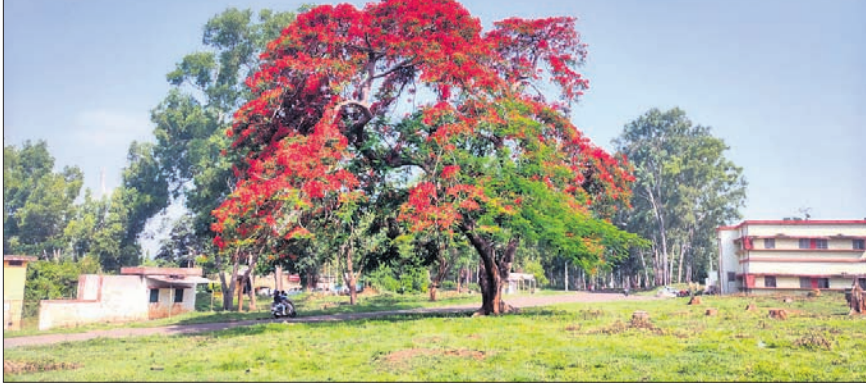
କୋରାପୁଟ ଜିଲ୍ଲା ପୁନାବେଡ଼ା ରାସ୍ତାରେ ଶୋଭାବର୍ଦ୍ଧନ କରୁଥିବା କୃଷ୍ଣଚୂଡ଼ା ଗଛ ।

ପୁନାବେଡ଼ା, ୩୬(ସ.ପ୍ର.) ଗାଉନସିପୁର ମୁଖ୍ୟ ରାସ୍ତାରେ ଏଠାରେ ଥିବା ମୁଖ୍ୟ ରାସ୍ତାକୁ ବିଭିନ୍ନ ଜାତୀୟ ଚିତ୍ର ସଂଯୋଗ କରୁଥିବା ଚିତ୍ର ଗୋଷ୍ଠିର ଉଦ୍‌ଘାଟନ ପାଇଁ ଶୁକ୍ରବାର ପାଳିତ ହୋଇଥିଲା ।