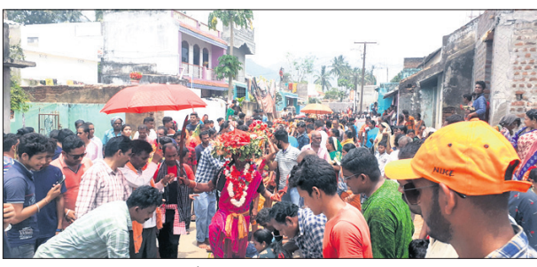
ଗାଁ ଗ୍ରାମ ପରିକ୍ରମା କରୁଛନ୍ତି ।

ଦୁର୍ଗା, ୩୬(ବି.ଏନ୍.ଏ.) ପର୍ବ ଉଦ୍‌ଯାପିତ ହୋଇଯାଇଛି । ଶୁକ୍ରବାର ବିପର୍ବନ କାର୍ଯ୍ୟକ୍ରମ ଅନୁଷ୍ଠିତ ହୋଇଥିଲା । ଠାକୁରାଣୀଙ୍କ ମନ୍ଦିରକୁ ପାଦ ଆଣି ଏ ଦିନ ଧରି ପର୍ବ ପାଳନ କରାଯାଇଥିଲା ।