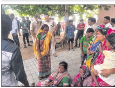
ପରିମାଣର ମଦ ଓ ମଦ ପ୍ରସ୍ତୁତି ସରଞ୍ଚାପ ଜବତ କରାଯାଇଥିଲା। ଏ ସଂକ୍ରାନ୍ତରେ ପୃଥକ ପୋଲିସ୍ ତତ୍ତ୍ୱ କରିଥିଲା। ସେଠାରୁ ବିପୁଳ