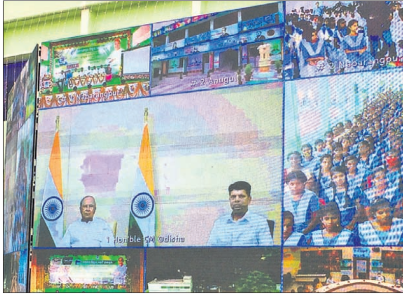
ଭରୁଆଲ ମୋଡ୍ରେ ଆୟୋଜିତ କାର୍ଯ୍ୟକ୍ରମରେ ମୁଖ୍ୟମନ୍ତ୍ରୀ ନବୀନ ପଟ୍ଟନାୟକ ଓ ୫-ଟି ସଚିବ ଭି.କେ. ପାଣ୍ଡେଆର୍।