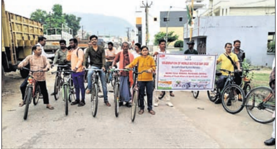
ପରିସରରୁ ଏକ ସଚେତନତା କାର୍ଯ୍ୟକ୍ରମ ବାହାରି ସହର ପରିକ୍ରମା କରିଥିଲା ।

ରାୟଗଡ଼ା ଜିଲ୍ଲା ପୁନିଗୁଡ଼ାଠାରେ ନେହେରୁ ଯୁବ କେନ୍ଦ୍ର ପକ୍ଷରୁ ବିଶ୍ଵ ସାଇକେଲ ଦିବସ ଶୁକ୍ରବାର ପାଳିତ ହୋଇଯାଇଛି । ଆଜିଦିନିଆ ଅନୁଷ୍ଠାନ ମହୋତ୍ସବ ଉପଲକ୍ଷେ ସ୍ଥାନୀୟ ଶହାଦ ଲକ୍ଷ୍ମଣ ନାୟକ ବସଷ୍ଟାଣ୍ଡ ଯାଇଥିଲା ।