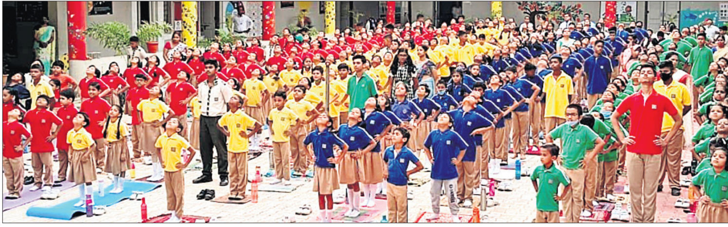
ବିଧିବଦ୍ଧ ପକ୍ଷରୁ ଆୟୋଜିତ ଯୋଗ ଶିବିରରେ ଛାତ୍ରଛାତ୍ରୀମାନେ ଯୋଗାଭ୍ୟାସ କରୁଛନ୍ତି ।

କନ୍ୟାପୁର, ୩୬(ବି.ପ୍ର.) କନ୍ୟାପୁର ହାତୀଶାଳାସ୍ଥିତ ସେଣ୍ଟ ଜାଭିୟରୀ ବିଦ୍ୟାଳୟରେ ଶୁକ୍ରବାର ଏକ ଯୋଗ ଶିବିର ଆୟୋଜିତ ହୋଇଯାଇଛି । ବିଦ୍ୟାଳୟର ବିଧିବଦ୍ଧ ପକ୍ଷରୁ ଏହା କାର୍ଯ୍ୟକ୍ରମର ଏକ ଅଂଶ ଭାବେ ଆୟୋଜିତ ହୋଇଥିଲା ।