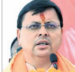
ଢେଙ୍କାନାଳ ମୁଖ୍ୟମନ୍ତ୍ରୀ ପୁଷ୍ପର ସିଂ ଧାମି