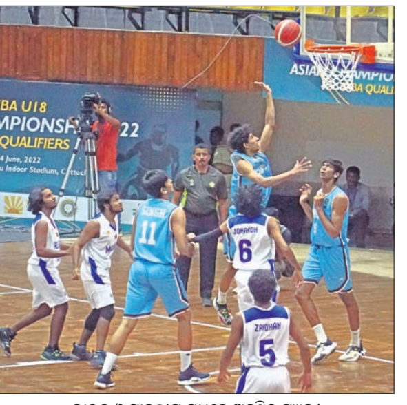
ଭାରତ ଓ ମାଳଦ୍ୱୀପ ମଧ୍ୟରେ ଅନୁଷ୍ଠିତ ମ୍ୟାଚ ।

ଭୁବନେଶ୍ୱର, ୩।୬ (କ୍ରୀଡ଼ା ପ୍ରତିନିଧି) ରାଜ୍ୟ ସରକାରଙ୍କ କ୍ରୀଡ଼ା ବିଭାଗ ସହଯୋଗରେ ଓଡ଼ିଶା ବାସ୍କେଟବଲ ଆସୋସିଏଶନ ଆନୁକୂଲ୍ୟରେ କଟକର ଜବାହରଲାଲ ନେହେରୁ ଇନ୍ଡୋର ସ୍ଥଳରେ ଅଜିତ ଭାରତୀୟ (ଏସିଆଇବିଏ)ର ୧୮ ବର୍ଷରୁ କମ୍ ଏସିଆନ ଚାମ୍ପିୟନଶିପ୍ରେ ଭାରତ ବିଜୟ ସହ ଅଭିଯାନ ୧୮ ବର୍ଷରୁ କମ୍ ଏସିଆନ ବାସ୍କେଟବଲ