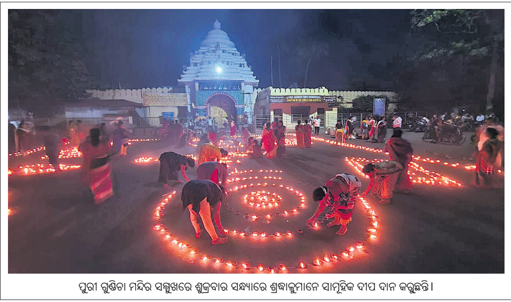
ପୁରୀ ରୁଷିଡା ମନ୍ଦିର ସମ୍ମୁଖରେ ଶୁକ୍ରବାର ସନ୍ଧ୍ୟାରେ ଶ୍ରଦ୍ଧାଳୁମାନେ ସାମୁଦ୍ରିକ ଦୀପ ଦାନ କରୁଛନ୍ତି।