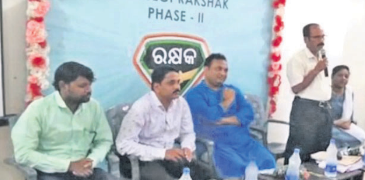
ଆଲୋଚନା କାର୍ଯ୍ୟକ୍ରମରେ ଉପସ୍ଥିତ ଅତିଥି।

ଦୁର୍ଘଟଣାଗ୍ରସ୍ତ ଆହତ ବ୍ୟକ୍ତିଙ୍କୁ ଡାକ୍ତରଖାନା ଆଣିଲେ ଏଣିକି ସରକାର ପୁରସ୍କୃତ କରିବେ। କୋର୍ଟ କ୍ରେଡିଟ୍ ଖାତାରେ ଆଉ ପଢ଼ିବେ ନାହିଁ। ସୁପ୍ରିମକୋର୍ଟ ଏହା ଉପରେ ଦେଇଥିବା ନିର୍ଦ୍ଦେଶକୁ ସରକାର କାର୍ଯ୍ୟକାରୀ କରିବାକୁ ଯାଉଛନ୍ତି। କୌଣସି ସରକାରୀ କର୍ମଚାରୀ ଆହତକୁ ଉଦ୍ଧାର କରିଥିବା ବ୍ୟକ୍ତିଙ୍କୁ ହରଜାଣା କଲେ ଦଣ୍ଡିତ ହେବେ। ଏହି ନିର୍ଦ୍ଦେଶ ଘରୋଇ ମେଡିକାଲରେ ମଧ୍ୟ ଲାଗୁ ହେବ। ଦୁର୍ଘଟଣାଗ୍ରସ୍ତ ଆହତଙ୍କୁ ସରକାରୀ ହେବ ବା ଘରୋଇ ମେଡିକାଲ ଆଣିଥିବା ବ୍ୟକ୍ତିଙ୍କୁ ବଡ଼ମୂଲ୍ୟ ବାବଦ ଟଙ୍କା ମାଗିପାରିବେ ନାହିଁ ଓ ଆହତଙ୍କୁ ମେଡିକାଲ ଆଣିଥିବା ବ୍ୟକ୍ତିଙ୍କୁ ଫୋନ ନମ୍ବର, ବ୍ୟକ୍ତିଗତ ସୂଚନା ଦେବାକୁ ବାଧ୍ୟ କରିପାରିବେ ନାହିଁ। ତାହାର ଚିକିତ୍ସା କରିବାରେ ବିଳମ୍ବ କିମ୍ବା ଅବହେଳା କଲେ କାର୍ଯ୍ୟାତ୍ମକ ଗ୍ରହଣ କରାଯିବ। ଏହି ନିର୍ଦ୍ଦେଶ ଠିକ୍ ଭାବେ କାର୍ଯ୍ୟକାରୀ ହେଉଛି ନା ନାହିଁ ସେ ନେଇ ପ୍ରତି ୩ ମାସରେ ମେଡିକାଲର ମୁଖ୍ୟ ସରକାରଙ୍କଠାରେ