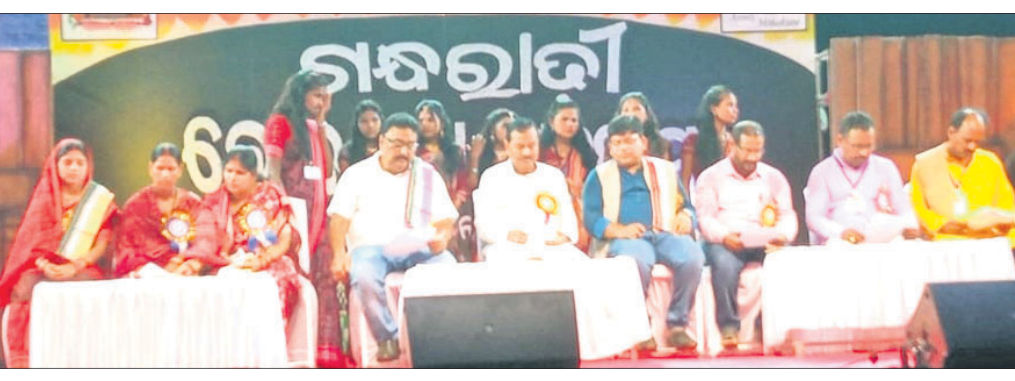
ଗନ୍ଧରାଜୀ ଲୋକକଳା ମହୋତ୍ସବର ପ୍ରଥମ ଦିବସରେ ମଞ୍ଚାସୀନ ଅତିଥି।

ବୌଦ୍ଧ ଜିଲ୍ଲାର ଐତିହାସିକସ୍ଥଳ ଗନ୍ଧରାଜୀ ପୀଠରେ ପ୍ରଥମ ଗନ୍ଧରାଜୀ ଲୋକକଳା ମହୋତ୍ସବ ଶୁକ୍ରବାର ଉଦ୍‌ଘାଟିତ ହୋଇଛି। ବୌଦ୍ଧ ବ୍ଲକର ଜଗତିଠାରେ ଥିବା ଏହି ଐତିହାସିକ ପୀଠରେ ଏହି ଲୋକକଳା ମହୋତ୍ସବ ପ୍ରଥମ ଥର ପାଇଁ ଆୟୋଜିତ ହୋଇଛି। ଉଦ୍‌ଘାଟନା ଦିବସ ସକାଳେ କଳସ ଶୋଭାଯାତ୍ରା ମହାନଦୀର କୂଳରେ ଘାଟଠାରୁ ଗନ୍ଧରାଜୀ ମନ୍ଦିରକୁ ଆସିବା ପରେ ବିଶ୍ୱଶାନ୍ତି ମଞ୍ଚପୀଠରେ ଘୁମାଦ କରାଯାଇ ହୋମଯଜ୍ଞ କରାଯାଇଥିଲା। ସନ୍ଧ୍ୟାରେ ବୌଦ୍ଧ ସହରର ମା' ଭୈରବୀ ଓ ବୌଦ୍ଧପୀଠରୁ ମଣ୍ଡଳ ଶୋଭାଯାତ୍ରା ୫୭ନମର ଜାତୀୟ ରାଜପଥ ଦେଇ ଜହ୍ନାପକଠାରେ ପହଞ୍ଚିବା ପରେ ସେଠାରୁ ଏକ ସାଂସ୍କୃତିକ ଓ ମଣ୍ଡଳ ଶୋଭାଯାତ୍ରା ମହୋତ୍ସବ ଘୁମାଦକୁ ଯାଇଥିଲା। ସାଂସ୍କୃତିକ ଶୋଭାଯାତ୍ରାରେ ବୌଦ୍ଧ ଜିଲ୍ଲାର କଳାକାରମାନେ ବିଭିନ୍ନ ଦେଶରେ ସଜିତ ହୋଇ ଜିଲ୍ଲାର ଲୋକନୃତ୍ୟ ପରିବେଷଣ କରିଥିଲେ।