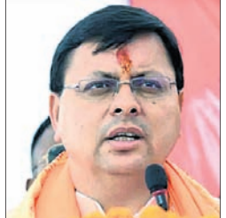
ଉତ୍ତରାଖଣ୍ଡ ମୁଖ୍ୟମନ୍ତ୍ରୀ ପୁଷ୍ପର ସିଂ ଧାମି