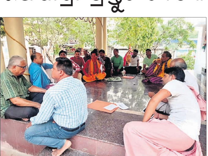
ବ୍ରାହ୍ମଣ ସମାଜର ପ୍ରସ୍ତୁତି ବୈଠକରେ ଉପସ୍ଥିତ କର୍ମକର୍ତ୍ତା।