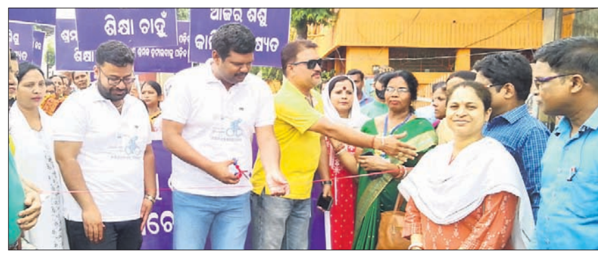
ଜିଲାପାଳ ପିତା କାଟି ପଦଯାତ୍ରା ଆରମ୍ଭ କରୁଛନ୍ତି।

ରାଉରକେଲା ଅଫିସ୍, ୩୬ (ଡି.ଏନ.ଏ.) ସୁନ୍ଦରଗଡ଼ ଜିଲା ପ୍ରଶାସନ ଓ ରାଉରକେଲା ଶ୍ରମ କାର୍ଯ୍ୟାଳୟର ମିଳିତ ଆନୁଷ୍ଠାନିକ ଶିଶୁ ଶ୍ରମିକ ନିରାକରଣ ସଚେତନତା ପଦଯାତ୍ରା ଶୁକ୍ରବାର ଅନୁଷ୍ଠିତ ହୋଇଛି।