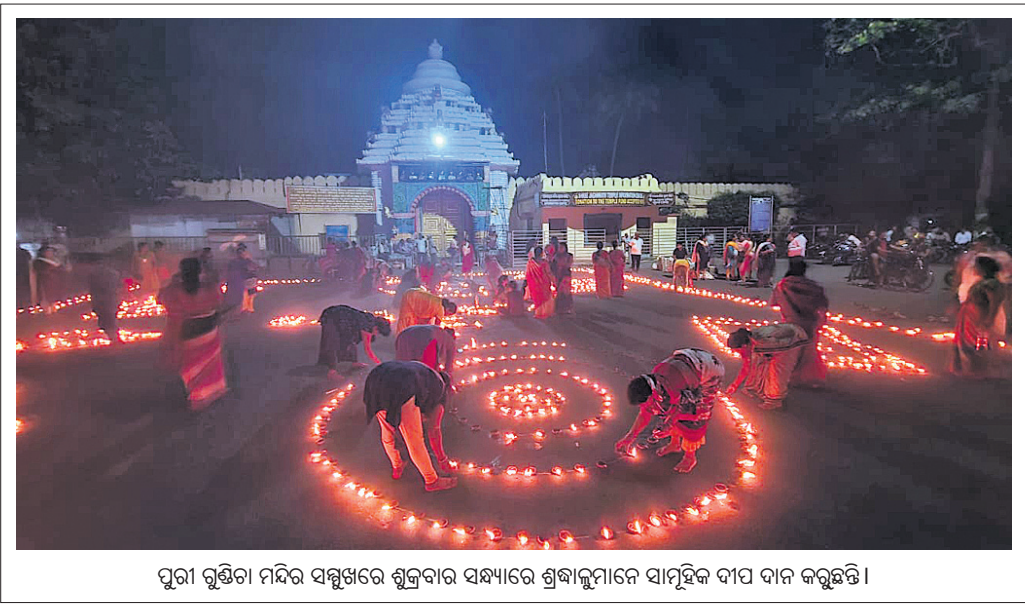
ପୁରୀ ରୁଷିଆ ମନ୍ଦିର ସମ୍ମୁଖରେ ଶୁକ୍ରବାର ସନ୍ଧ୍ୟାରେ ଶ୍ରଦ୍ଧାଳୁମାନେ ସାମୁଦ୍ରିକ ଦୀପ ଦାନ କରୁଛନ୍ତି।