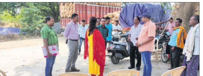
ଜିଲ୍ଲାପାଳ ପାକ୍ଷ ପରିଦର୍ଶନ କରୁଛନ୍ତି।