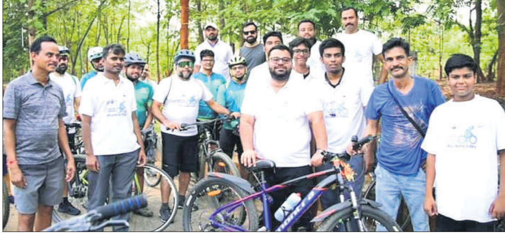
ସରକାରୀ ଅଧିକାରୀ ଓ ବିଭିନ୍ନ ଅନୁଷ୍ଠାନର କର୍ମଚାରୀ ଶୋଭାଯାତ୍ରାରେ ବାହାରିଛନ୍ତି।

ବିଶ୍ୱ ବାଇକ୍‌ଆଇଡେଲ ଦିବସ ପାଳନ ଅବସରରେ ରାଉରକେଲାରେ ଶୁକ୍ରବାର ଏକ ସାଇକେଲ ଶୋଭାଯାତ୍ରା ଆୟୋଜନ କରାଯାଇଥିଲା।