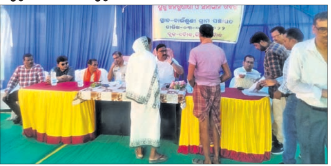
ସୁଗ୍ନ ଜନଶୁଣାଣି ଓ ସମାଧାନ ଶିବିରରେ ଉପସ୍ଥିତ ଅଧିକାରୀ।