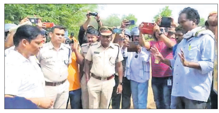
ଗ୍ରାମବାସୀଙ୍କ ସହ ପ୍ରଶ୍ନାବଳୀ ଅଧିକାରୀ, ପୋଲିସ୍ ଅଧିକାରୀ ଆଲୋଚନା କରୁଛନ୍ତି।