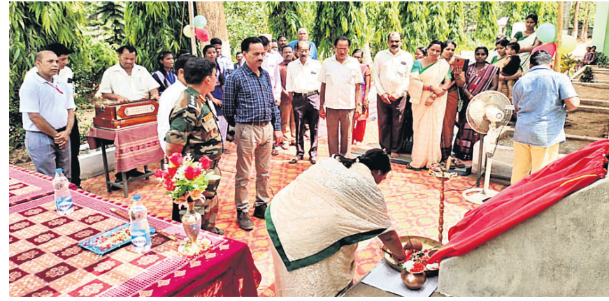
ଏନ୍‌ସିସି ଯୁନିଟ୍ ଉଦ୍ଘାଟନ କରାଯାଇଛି।

ଜନନିକା, ୩୬ (ଡି.ଏନ.ଏ.) ଜନନିକା ବ୍ଲକ୍ ଭୋକ୍ସି ପଞ୍ଚାୟତ ଏସ୍‌ଏସ୍‌ଟି ଉଚ୍ଚବିଦ୍ୟାଳୟରେ ଓଡ଼ିଶା-୪ ବାଗାଲିୟନର ଏକ ଏନ୍‌ସିସି ଯୁନିଟ୍ ଉଦ୍ଘାଟିତ ହୋଇଯାଇଛି।