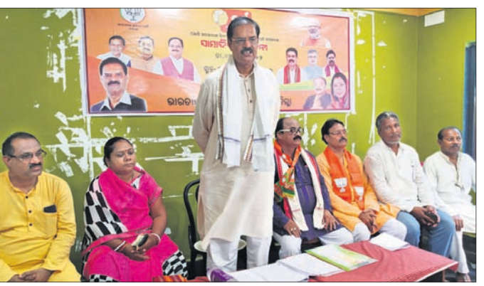
ସମ୍ମିଳନୀରେ ମଞ୍ଚାସୀନ ଭାଜପା ନେତୃବୃନ୍ଦ।