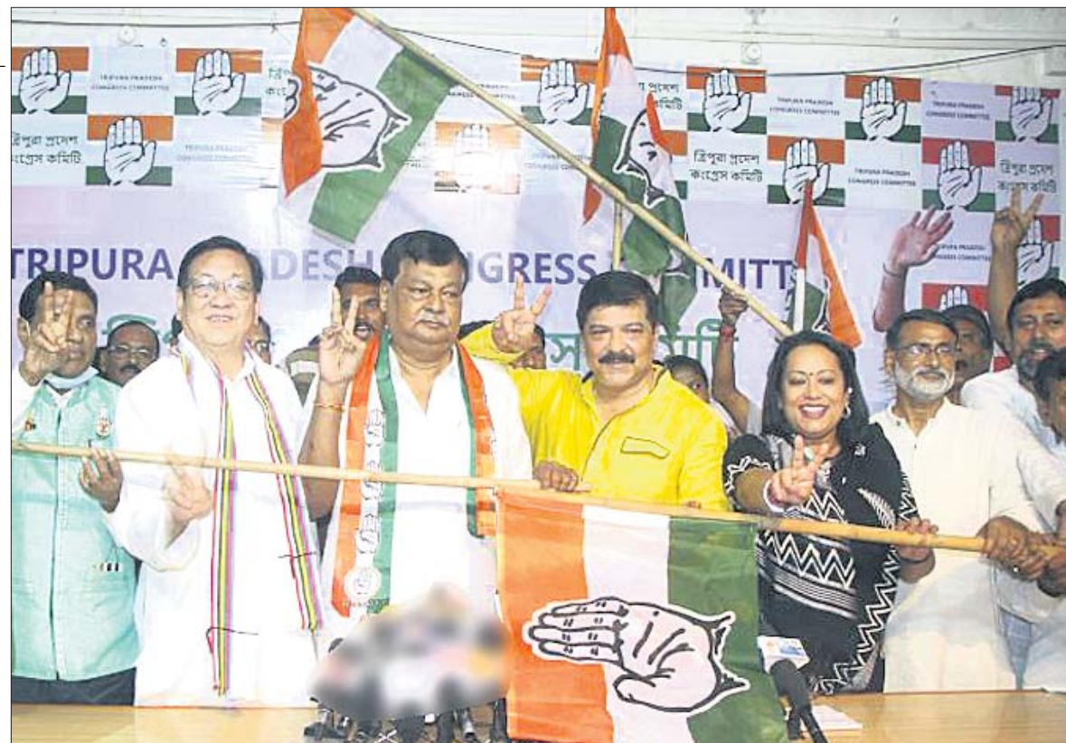
ତ୍ରିପୁରା ଉପନିର୍ବାଚନ ଲାଗି ବଳାୟ ପ୍ରାର୍ଥୀ ଯୋଗଣା ପରେ ଶନିବାର ଅନଗରାଜ୍ୟରେ ପ୍ରବେଶ କଂଗ୍ରେସ ସଭାପତି ଓ ଅନ୍ୟ ନେତୃବୃନ୍ଦ।