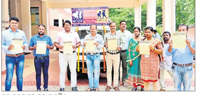
ରଥ ଉଦ୍ଘାଟନ କରାଯାଇଛି।

ପାରଳାଖେମୁଣ୍ଡି, ୪.୬ (ଡି.ଏନ୍.ଏ.) ରାଜ୍ୟ ସରକାରଙ୍କ ଶ୍ରମ ଓ କର୍ମଚାରୀ ରାଜ୍ୟ ବାମା ବିଭାଗ ତରଫରୁ ରାଜ୍ୟରେ ଶିଶୁ ଶ୍ରମିକ ଉଚ୍ଛେଦ ସମ୍ପର୍କିତ ଏକ ଓଡ଼ିଶା ସରକାରଙ୍କ କାର୍ଯ୍ୟକ୍ରମ ଆରମ୍ଭ କରାଯାଇଛି। ଏହି ଅବସରରେ ଗଜପତି ଜିଲ୍ଲା ପ୍ରଶାସନ ଓ ଜିଲ୍ଲା ଶ୍ରମ କାର୍ଯ୍ୟାଳୟ ପକ୍ଷରୁ ଶିଶୁ ଶ୍ରମିକ ନିରାକରଣ ସଚେତନତା ରଥକୁ ଅତିରିକ୍ତ ଜିଲ୍ଲାପାଳ ସଂଗ୍ରାମ ଶେଖର ପଣ୍ଡା ସବୁଜ ପତାକା ଦେଖାଇ ଶୁଭ ଉଦ୍ଘାଟନ କରିଛନ୍ତି। ଏହି ସଚେତନତା ରଥ ଜିଲ୍ଲାପାଳଙ୍କ କାର୍ଯ୍ୟାଳୟଠାରୁ ବାହାରି ପାରଳାଖେମୁଣ୍ଡି ପୌରାଞ୍ଚଳର