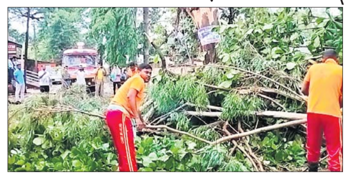
ଗଛ ପଡ଼ି ରାସ୍ତା ଅବରୋଧ ହୋଇଛି।

ପାରଳାଖେମୁଣ୍ଡି, ୪.୬ (ଡି.ଏନ୍.ଏ.) ମୋହନାରେ ଶୁକ୍ରବାର ସନ୍ଧ୍ୟାରେ କାଳବୈଶାଖୀ ପ୍ରଭାବରେ ବର୍ଷା ପବନ ହେବାରୁ ବହୁ ବଡ଼ ଗଛ ଭାଙ୍ଗିଯିବା ସହ ବିଭିନ୍ନ ସ୍ଥାନରେ ବିଦ୍ୟୁତ୍ ତାର ଛିଣ୍ଡିଯାଇଛି। ଏହାର ପ୍ରଭାବରେ ମୋହନା ଥାନା, ରାଜ୍ୟ ନିରୀକ୍ଷକଙ୍କ କାର୍ଯ୍ୟାଳୟ, ବ୍ଲକ ରାସ୍ତା, ଅଗ୍ନିଶମ କାର୍ଯ୍ୟାଳୟ, ବନ ବିଭାଗ କାର୍ଯ୍ୟାଳୟ ଭଳି ବିଭିନ୍ନ ସ୍ଥାନରେ ଗଛ ଭାଙ୍ଗିପଡ଼ିବା ଯୋଗୁଁ ବିଭିନ୍ନ କାର୍ଯ୍ୟାଳୟକୁ ଯାତାୟାତ କରାଯିବା ଠିକ୍ ହୋଇନାହିଁ। ଏ ସମ୍ପର୍କରେ ବ୍ଲକ କୃଷି ସହକାରୀଙ୍କ ସହ ଯୋଗାଯୋଗ ସମ୍ଭବ ହୋଇପାରିନାହିଁ।