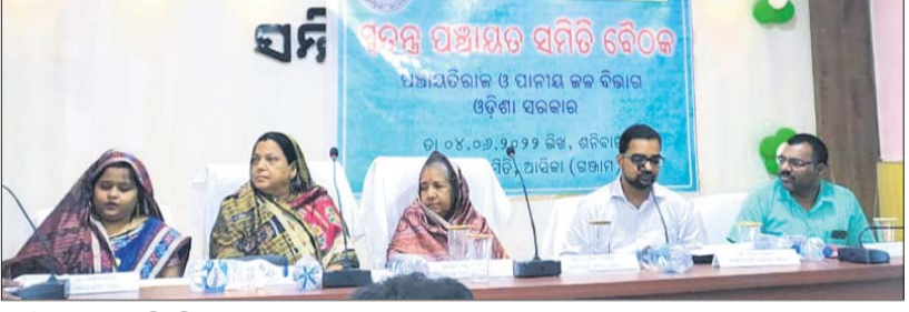
ବୈଠକରେ ଏମ୍.ପି. ବିଧାୟକ ଓ ଅନ୍ୟମାନେ।