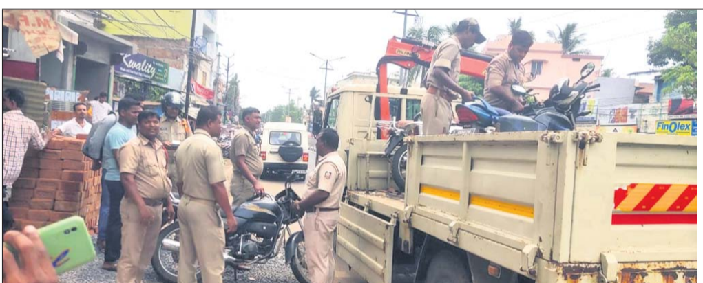
ନୋ-ପାର୍କିଂ ସ୍ଥଳକୁ ଗାଡ଼ି ଉଠାଇ ନେଇଛି ପୋଲିସ୍।

ବ୍ରହ୍ମପୁର ସହରର ବିଭିନ୍ନ ଥାନା ଅଞ୍ଚଳର ନୋ-ପାର୍କିଂରେ ରଖାଯାଉଥିବା ଗାଡ଼ି ହଟାଇବା ଅଭିଯାନ ଗ୍ରାଫିକ୍ ପୋଲିସ୍ ଆରମ୍ଭ କରିଛି। ଏଣୁ ଗ୍ରାଫିକ୍ ପୋଲିସ୍ ନୋ-ପାର୍କିଂରେ ଥିବା ଗାଡ଼ି ଉଠାଇବା ସହ ଖୁଲାପକାରୀ ମାନଙ୍କଠାରୁ ଜରିମାନା ଆଦାୟ କରିଛି। ନିର୍ଦ୍ଧାରିତ ପାର୍କିଂସ୍ଥଳରେ ଗାଡ଼ି ନ ରଖି ରାସ୍ତାକଡ଼ରେ ଯେ କୌଣସି ସ୍ଥାନରେ ପାର୍କିଂ କରିଥିବା ୨୦୮ ଗାଡ଼ି ଚାକକଙ୍କଠାରୁ ୫୦୦ ଟଙ୍କା ଜୁରାଦିନରେ ଜରିମାନା ଆଦାୟ କରିଛି। ଭୁଇଁଦିନରେ ଗ୍ରାଫିକ୍ ପୋଲିସ୍ ୧ ଲକ୍ଷ ୪ ହଜାର ଟଙ୍କା ଆଦାୟ କରିଥିବା ସୂଚନା ମିଳିଛି। ନେଇ ଗୁରୁବାରଠାରୁ ଗ୍ରାଫିକ୍ ପୋଲିସ୍ ବ୍ରହ୍ମପୁର ସହରରେ ଦୂର ଦୂର ନୋ-ପାର୍କିଂସ୍ଥଳକୁ ଗାଡ଼ି ଉଠାଇବା ସହ ଚାକକଙ୍କଠାରୁ ଜରିମାନା ଆଦାୟ କରୁଛି। ଗୁରୁବାର ୧୦୩ ଗାଡ଼ି ନୋ-ପାର୍କିଂସ୍ଥଳକୁ