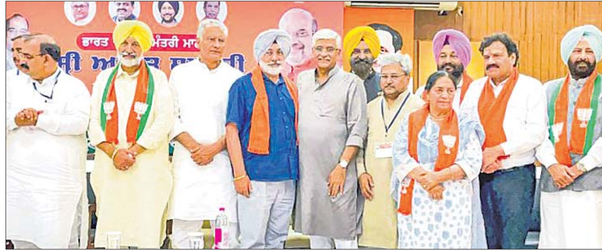
କେନ୍ଦ୍ରମନ୍ତ୍ରୀ ରଞ୍ଜେନ୍ଦ୍ର ଶେଖାଡ଼ିତଙ୍କ ଉପସ୍ଥିତିରେ କଂଗ୍ରେସରୁ ଆସି ଭାଜପାରେ ଯୋଗଦେଇଥିବା ନେତାମାନେ।