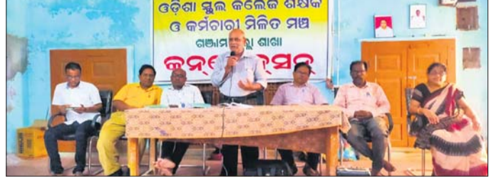
ବୈଠକରେ ମଞ୍ଚାସୀନ ସଂଘ କର୍ମକର୍ତ୍ତା।