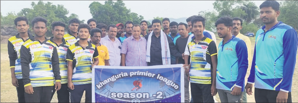
କେପିଏଲ୍ କ୍ରିକେଟ ଚୁନାମେଣ୍ଟ ଉଦ୍‌ଘାଟନ ଅବସରରେ ଅତିଥି ଓ ଖେଳାଳିମାନେ।

ଏହି ଚୁନାମେଣ୍ଟର ଉଦ୍‌ଘାଟନା ମ୍ୟାଚ୍‌ରେ ଖୁଲିୟାପୀଠରୁ ହରାଇ ଟ୍ରଫି ଫାଇଟର ଟିମ୍ ପ୍ରଥମେ ବୋଲି ନିଷ୍ପତ୍ତି ନେବା ସହ ଖୁଲିୟାପୀଠ ନିର୍ବାଚିତ ୧୦ ଓଭରରେ ୬ ରନରୁ ଚୁନାମେଣ୍ଟ ଲିଗ୍ ଆୟୋଜିତ ହେବ।