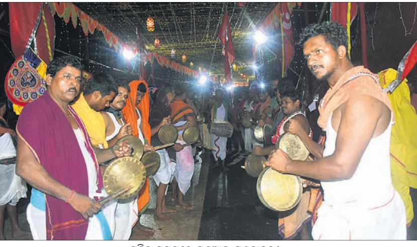
ମନ୍ଦିର ସମ୍ମୁଖରେ ଘଣ୍ଟାଧିକ ଘଣ୍ଟବାଦନ।

ମାଘସାନ ଦିଆଯାଇ ମଙ୍ଗଳଆକତି, ଅବକାଶ, ରୋଷହୋମ, ଛାମୁ ନ ଥିଲା। ଶନିବାର ମଧ୍ୟ ଠାକୁରଙ୍କ ନାତି ସମ୍ପନ୍ନା ଚଳା ପୁଜା ବନ୍ଦ ରହିବାରୁ ଶ୍ରୀଲିଙ୍ଗରାଜଙ୍କ ବିବାହ ଉତ୍ସବ ଓ ଶୀତଳ ସ୍ତମ୍ଭ ପ୍ରଦର୍ଶନା ଭଙ୍ଗ ନେଇ ଆଶଙ୍କା ଦେଖାଦେଇଥିଲା। ତେବେ ରାତି ୮ଟା ୩୦ରେ ଅତିରିକ୍ତ ଜିଲାପାଳ ପ୍ରଫୁଲ୍ଲ