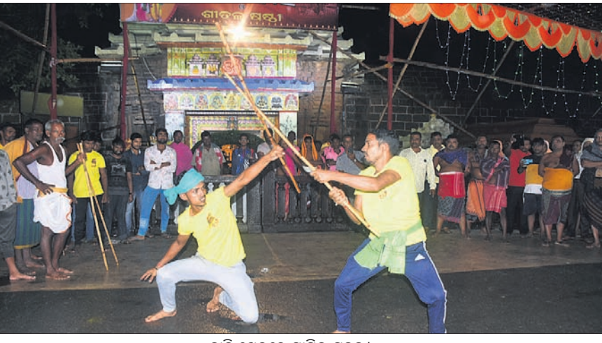
ବାଡ଼ି ଖେଳରେ ସାମିଲ ଯୁବକ।