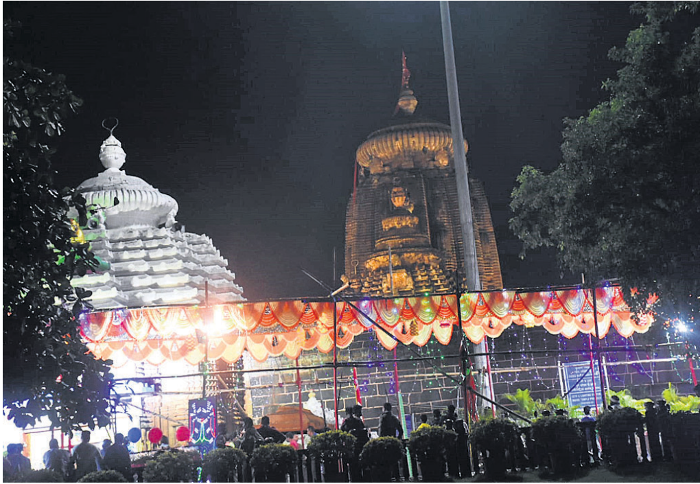
ଠାକୁରାଣୀ ବିପ୍ରହର ଧୂପ କରାଯାଇଥିଲା।