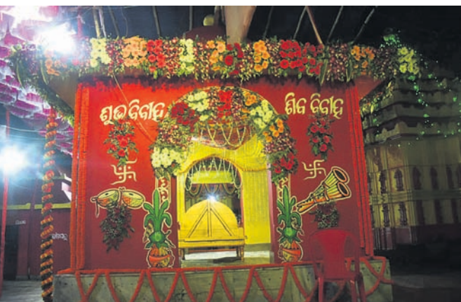
କେଦାରଗୌରୀ ମନ୍ଦିର ପରିସରରେ ପ୍ରସ୍ତୁତ ବିବାହବେଦି।

ଦେଶର ଅନ୍ୟତମ ବୃହତ୍ ତଥା ଅଗ୍ରଣୀ ଖଣିଜ ଉତ୍ପାଦନକାରୀ ସଂସ୍ଥା ଓଡ଼ିଶା ମାଇନିଂ କର୍ପୋରେଶନ (ଓଏମ୍‌ସି)କୁ ଏହାର କର୍ପୋରେଟ ସାମାଜିକ ଦାୟିତ୍ୱ ଓଏମ୍‌ସିର ପରିଚାଳନା ନିର୍ଦ୍ଦେଶକ ବା ସିଏସ୍‌ଆର୍ କାର୍ଯ୍ୟକ୍ରମ ପାଇଁ ସମ୍ମାନଜନକ 'ଗୋଲଡେନ ପିକ୍ସ ଆୱାର୍ଡ' ପୁରସ୍କାର ଜାତୀୟ ବିକେତା ଭାବରେ ସମ୍ମାନିତ କରାଯାଇଛି। ନୂଆଦିଲ୍ଲୀରେ ଶୁକ୍ରବାର ଇନ୍‌ଷ୍ଟିଚ୍ୟୁଟ୍ ଅଫ୍ ଡାଇରେକ୍ଟ୍ ସ୍ୱାରା ଆୟୋଜିତ କର୍ପୋରେଟ ସାମାଜିକ ଦାୟିତ୍ୱ ସମ୍ମାନ, ୧୬ତମ ଅନ୍ତର୍ଜାତୀୟ ସମ୍ମାନମାନେ ଓଏମ୍‌ସିକୁ ଏହି ପୁରସ୍କାର ପ୍ରଦାନ କରାଯାଇଛି। ଓଏମ୍‌ସି ପରିଚାଳିତ ବିଭିନ୍ନ ଖଣି ତଥା ଏହାର ପାର୍ଶ୍ୱବର୍ତ୍ତୀ ଅଞ୍ଚଳରେ ବସବାସ କରୁଥିବା ଲୋକମାନଙ୍କ ବିକାଶ ଲାଗି ନିରନ୍ତର ପ୍ରୟାସ କରୁଥିବା ଯୋଗୁଁ ସଂସ୍ଥାକୁ ଏହି ଜାତୀୟ ପୁରସ୍କାରରେ ସମ୍ମାନିତ କରାଯାଇଛି।