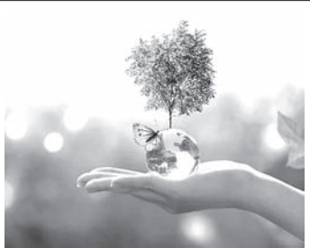
ବିଶ୍ୱ ପରିବେଶ ଦିବସ ଉପଲକ୍ଷେ

ସମୂହ ପ୍ରଣୀତ ହେଲା । ବିଚାରାଳୟମାନେ ଏଥିରେ ପ୍ରମୁଖ ଭୂମିକା ନେଇ ନିର୍ଦ୍ଦେଶମାନ ଦେଇଛନ୍ତି । ମାତ୍ରାଏ ଉଚ୍ଚ ନ୍ୟାୟାଳୟର ରାୟ ହେଲା ଚନ୍ଦ୍ରଧର ସଦ୍ୟତମ । 'ପ୍ରକୃତି ଅଧିକାର'କୁ ନେଇ ବିକଶିତ ହୋଇଥିବା ଧାରଣା ଅନୁସାରେ ପରିସଂହାର ଆଇନତଃ ବ୍ୟକ୍ତିତ୍ୱଲ୍ୟ ମର୍ଯ୍ୟାଦା ଲାଭ କରିବା ଉଚିତ । ଯେପରିକି ଏହାକୁ କେହି କେହି ପହଞ୍ଚାଇ ପାରିଲେ ଏହା ବିଚାରାଳୟର ଆଶ୍ଚର୍ଯ୍ୟ ନେଇପାରିବ । ଅତଏବ କୌଣସି ତଥାକଥିତ ବିକାଶମୂଳକ ଯୋଜନା କିମ୍ବା ଜଳବାୟୁ ପରିବର୍ତ୍ତନ ହେଉ ପରିବେଶର ଅବସ୍ଥା ଯତ୍ନ ସହିତ ଏହା ନିଜ 'ଅଭିଭାବନା' (ବ୍ୟକ୍ତି କିମ୍ବା ସଂସ୍ଥା) ମାଧ୍ୟମରେ ତାହା କରିପାରିବ । ଏଥିରେ ସ୍ୱୀକାର କରାଯାଇଛି