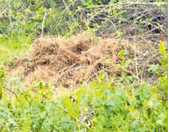
ମହାକାଳପଡ଼ାରେ ରେଖି ଥିବା କୁମ୍ଭୀର ଉପକୂଳରେ ବରଜା କୁମ୍ଭୀର ବସା ଠାର।

କେନ୍ଦ୍ରାପଡ଼ା ଜିଲ୍ଲା ମହାକାଳପଡ଼ା କୁଳ ଉପକୂଳ ଅଞ୍ଚଳର ନଦୀନାଳରେ ବରଜା କୁମ୍ଭୀରଙ୍କ ସଂଖ୍ୟା ବୃଦ୍ଧି ପାଇଛି। ଏମାନେ ସାଧାରଣତଃ ନେ, କୁଳ ମାସରେ ଅଣ୍ଡାଦାନ କରିଥାନ୍ତି।