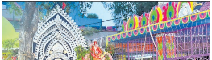
ପୂର୍ବପଡ଼ା କାରୋଶ୍ୱର ବାବାଙ୍କ ମନ୍ଦିର ପ୍ରବେଶ।

୬ ଦିନ ଧରି ଚାଲିଥିବା ସମ୍ବଲପୁର ପ୍ରଦିକ ଶୀତଳେଶ୍ୱରୀ ଯାତ୍ରା ସୋମବାର ଉଦ୍‌ଯାପିତ ହୋଇଛି। ମାତା ପାର୍ବତୀ ଓ ଦେବ ଦେବ ମହାଦେବ ନଗର ପରିକ୍ରମାକୁ ଫେରି ସନ୍ଧ୍ୟାରେ ଗୋଧୂଳି ଲଘୁରେ ମନ୍ଦିର ପ୍ରବେଶ କରିଛନ୍ତି।