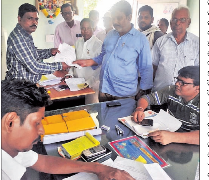
ନିର୍ବାଚନ ଅଧିକାରୀଙ୍କ ପାଖରେ ପ୍ରାର୍ଥୀମାନେ ନାମାଙ୍କନ ପତ୍ର ଦାଖଲ କରୁଛନ୍ତି।

ସମବାୟ ନିର୍ବାଚନ ପାଇଁ ନାମାଙ୍କନ ପ୍ରକ୍ରିୟା ଶେଷ ହୋଇଛି। କୁଳ ୨୭ରେ ହେବାକୁ ଥିବା ରାଜନଗର, ଭାଙ୍ଗପଡା, ତେରା, କୁରୁଣ୍ଡି, ଡାଙ୍ଗମାଳ, ଗୋପାଳପୁର, ଫିରିକିବାଣ୍ଡି ପ୍ରଭୃତି ୭ଟି ସେବା ସମବାୟ ସମିତି ପାଇଁ ସାମାଜିକ ସେବା ସମାଧାନ କର୍ମୀମାନଙ୍କୁ ନିର୍ବାଚନ କରାଯାଇଛି।