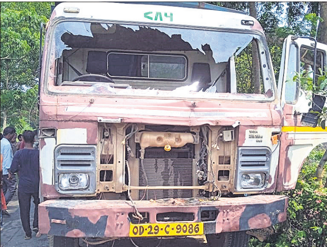
ଦୁର୍ଘଟଣା ଘଟାଇଥିବା ହାଇଡ୍ରୋଲୋକ୍ ଭେଲୋ