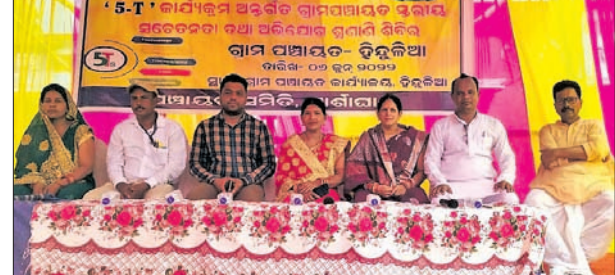
ଅଭିଯୋଗ ଶୁଣାଣି ଶିବିରରେ ଉପସ୍ଥିତ ପ୍ରଶାସନିକ ଅଧିକାରୀ ଓ ଅନ୍ୟମାନେ।

ସମସ୍ତ କାର୍ଯ୍ୟ ପାଇଁ ନବ୍ଯା ପ୍ରସ୍ତୁତ ହେବ। ନୂତନ ଗୃହ ନିର୍ମାଣ ପାଇଁ ପ୍ରଶାସନିକ ଅଧିକାରୀମାନେ ସ୍ଥାନ ନିରୂପଣ କରୁଛନ୍ତି।