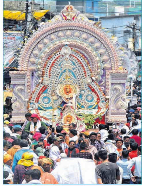
ଚାନ୍ଦିମେଢ଼ରେ ମାତା ପାର୍ବତୀ ଓ ଲୋକନାଥ ବାବା ।