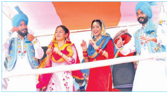
କଳାକାରଙ୍କ ଭାଙ୍ଗତା ନୁତ୍ୟ ।