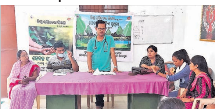
କାର୍ଯ୍ୟକ୍ରମରେ ଯୋଗଦେଇଥିବା ଅତିଥି।

କମଳକିରୀ ବ୍ଲକ୍ ଭୋଜପୁର ସ୍ଵାସ୍ଥ୍ୟ ଆରୋଗ୍ୟ କେନ୍ଦ୍ରରେ ଯୋଗାବାର ବିଶ୍ଵ ପରିବେଶ ଦିବସ ପାଳିତ ହୋଇଯାଇଛି।