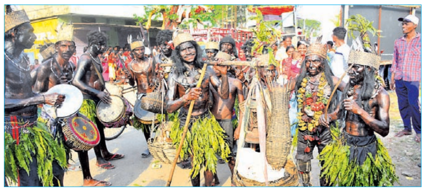
କଳାକାରଙ୍କ ଆଦିବାସୀ ନୁତ୍ୟ ।