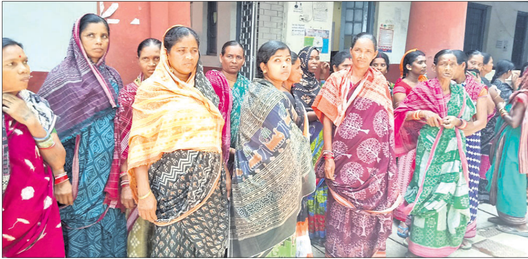
ମହିଳାମାନେ ମଦ ବିରୋଧରେ ଜିଲ୍ଲାପାଳଙ୍କ ଦ୍ଵାରସ୍ଥ ହୋଇଛନ୍ତି।

ବଲାଙ୍ଗୀର ଅଫିସ, ୬୬ ବଲାଙ୍ଗୀର ଜିଲ୍ଲା ପୁଲିଠିଲ୍ଲା ବ୍ଲକ୍ ଅଧିକାରୀପଦର ଗ୍ରାମରେ ମଦ ପ୍ରାଦୁର୍ଭାବ ସାମାଜିକ କାର୍ଯ୍ୟକ୍ରମ ଯୋଗାଯୋଗ କରିଛି।