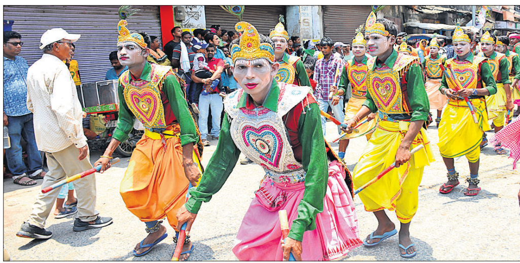
କଳାକାରଙ୍କ ଗଉଡ଼ବାଡ଼ି ନୁତ୍ୟ ପରିବେଷଣ ।