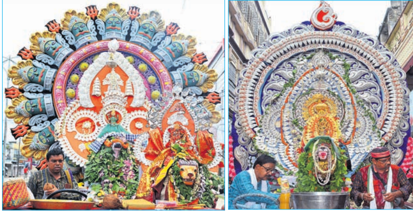
ମାତା ପାର୍ବତୀ ଓ ଗୁପ୍ତେଶ୍ଵର ବାବା ।