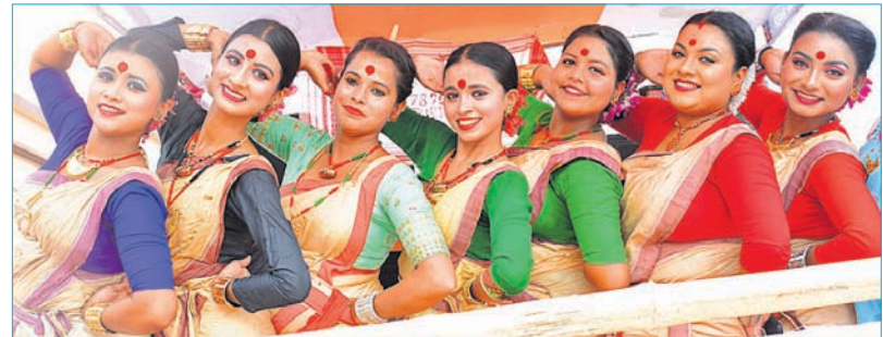
କଳାକାରଙ୍କ ଦ୍ଵାରା ବିନ୍ଦୁ ନୁତ୍ୟ ପରିବେଷଣ ।