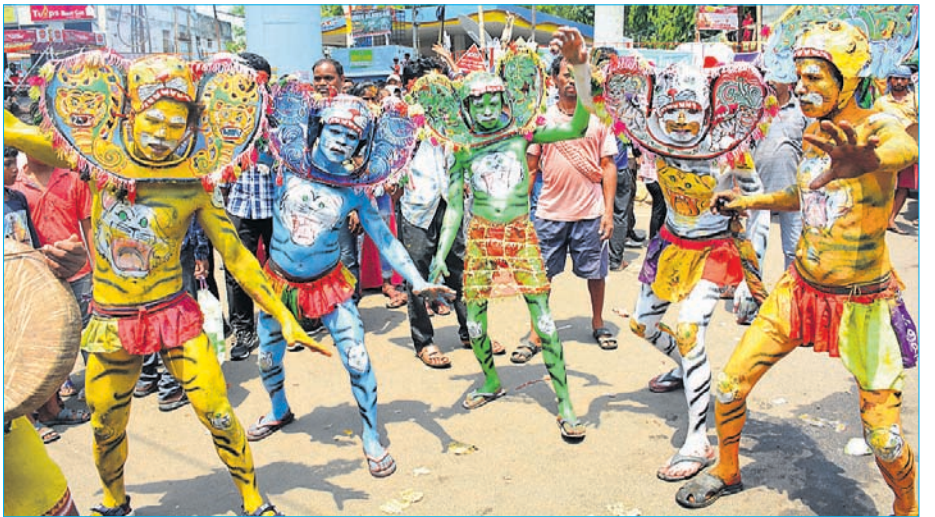
କଳାକାରଙ୍କ ବାଘ ନୁତ୍ୟ ।