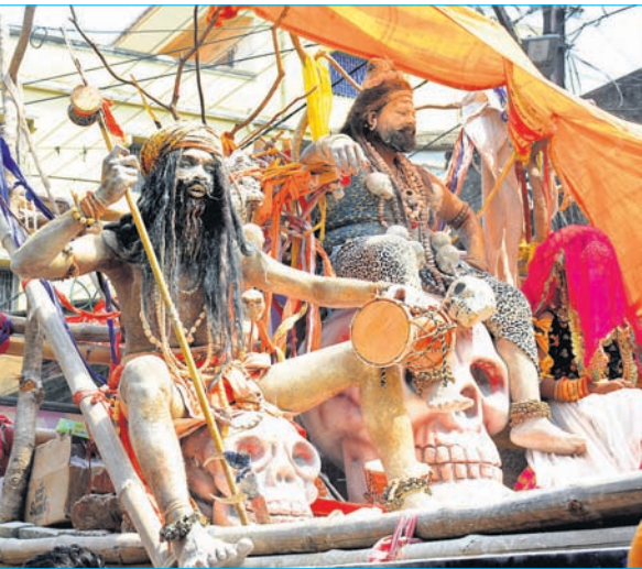
କଳାକାରଙ୍କ ଅଘୋରୀ ନୁତ୍ୟ ।