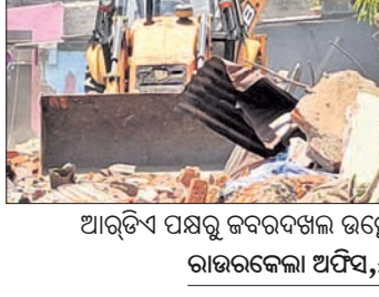
ଆରଡିଏ ପକ୍ଷରୁ ଜବରଦଖଲ ଉଚ୍ଛେଦ କରାଯାଇଛି।

ରାଉରକେଲା ସହରରେ ଦିନକୁ ଦିନ ଜବରଦଖଲ ବଢ଼ିବାରେ ଲାଗିଛି। ରଘୁନାଥପାଲି ଥାନା ଅନ୍ତର୍ଗତ ସଞ୍ଜୟ ମାର୍କେଟ ଅଞ୍ଚଳରେ ସରକାରୀ ଜମିକୁ ଜବରଦଖଲ କରି ନିର୍ମାଣ କରାଯାଇଥିବା ଘରଗୁଡ଼ିକୁ ରାଉରକେଲା ତେଲପମେଣ୍ଟ ଅଧିକାରୀ (ଆରଡିଏ) ପକ୍ଷରୁ ଭାଙ୍ଗି ଦିଆଯାଇଛି।