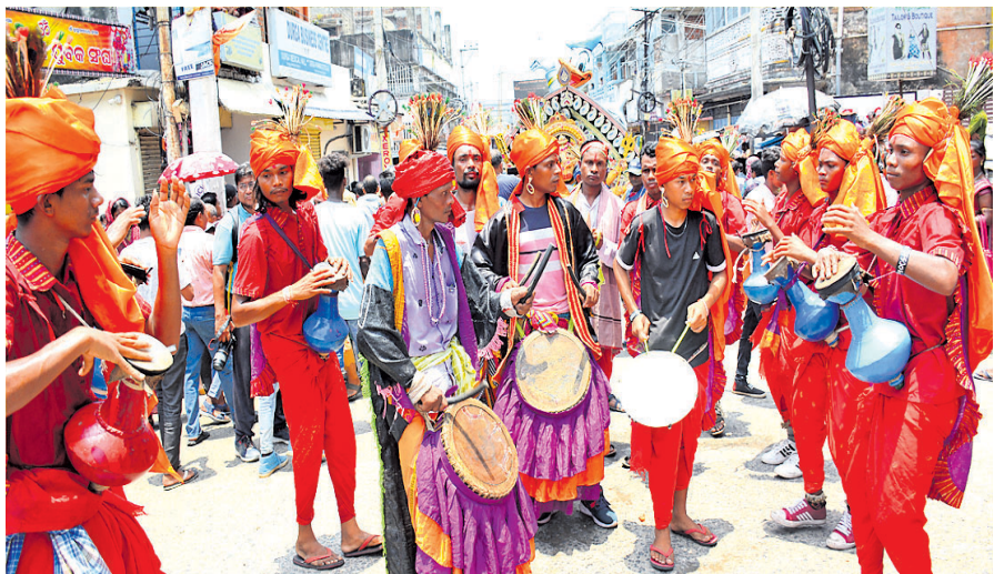
କଳାକାରଙ୍କ ଘୁମୁରା ନୁତ୍ୟ ପରିବେଷଣ ।