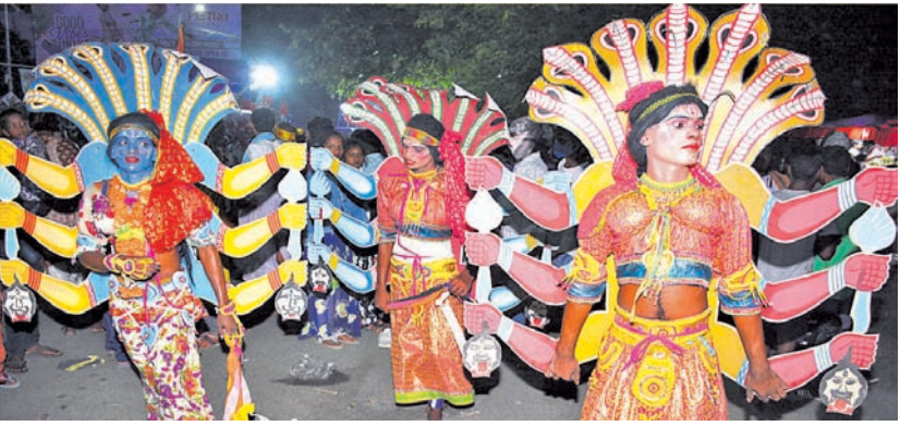
କଳାକାରଙ୍କ ସପ୍ତପେଶୀ ନୁତ୍ୟ ।