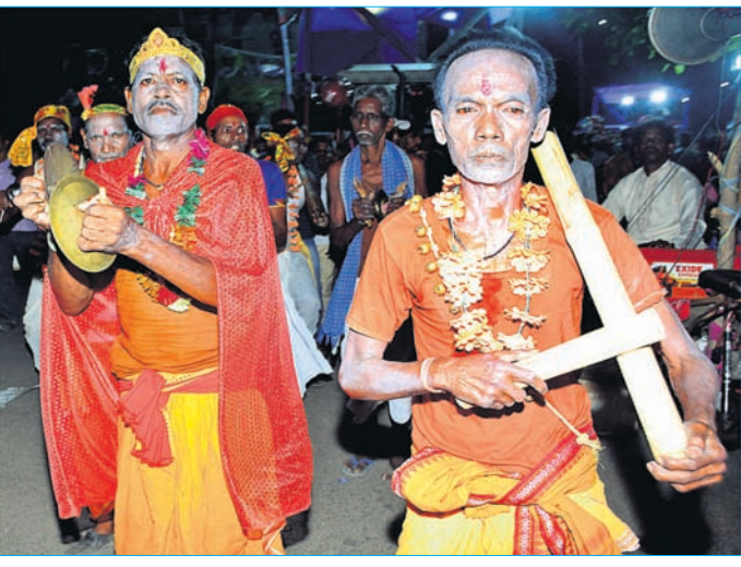
କଳାକାରଙ୍କ ରାତ୍ରି ବାନ୍ଧ୍ୟ ଓ ନୁତ୍ୟ ।