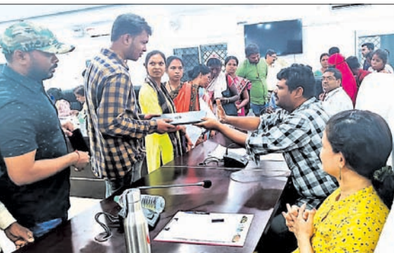
ଅଭିଯୋଗ ଶୁଣାଣିରେ ଜିଲ୍ଲାପାଳ ଓ ଅନୁପାଳନେ।

ସୁନ୍ଦରଗଡ଼, ୬୬(ଡି.ଏନ.ଏ.): ଗ୍ରାମ୍ୟ ପୋଖରୀ ପୁନରୁଦ୍ଧାର, ରାସ୍ତା ନିର୍ମାଣ, ସ୍କୁଲ ଓ ଅଙ୍ଗନାଠି ନିର୍ମାଣ ଆଦି ସମସ୍ୟାର ସମାଧାନ ପାଇଁ ଲୋକେ ଜିଲ୍ଲାପାଳଙ୍କ ଦୃଷ୍ଟି ଆକର୍ଷଣ କରିଥିଲେ।