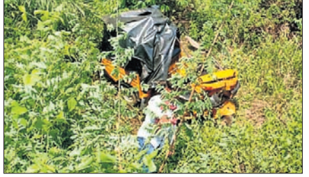
ପୋଲ ତଳକୁ ଖସିପଡ଼ିଥିବା ଅଟୋ।