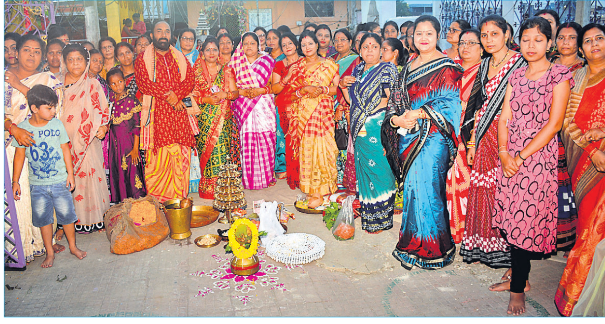
ଦେବଦମ୍ପତିଙ୍କ ମନ୍ଦିର ପ୍ରବେଶ ପାଇଁ ଭକ୍ତମାନେ ଅପେକ୍ଷା କରିଛନ୍ତି ।