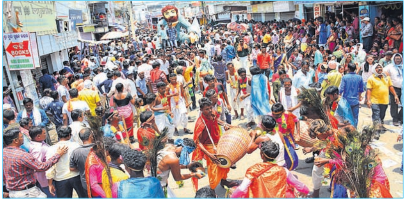
ଦର୍ଶନ ପାଇଁ ଭକ୍ତଙ୍କ ଭିଡ଼ ।