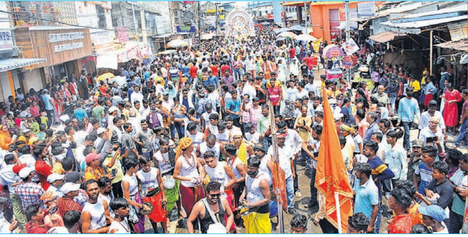
ଯାତ୍ରା ପଥରେ ଯୁଗଳ ମୂର୍ତ୍ତି ଦର୍ଶନ କରିବାକୁ ଭକ୍ତଙ୍କ ଭିଡ଼ ।