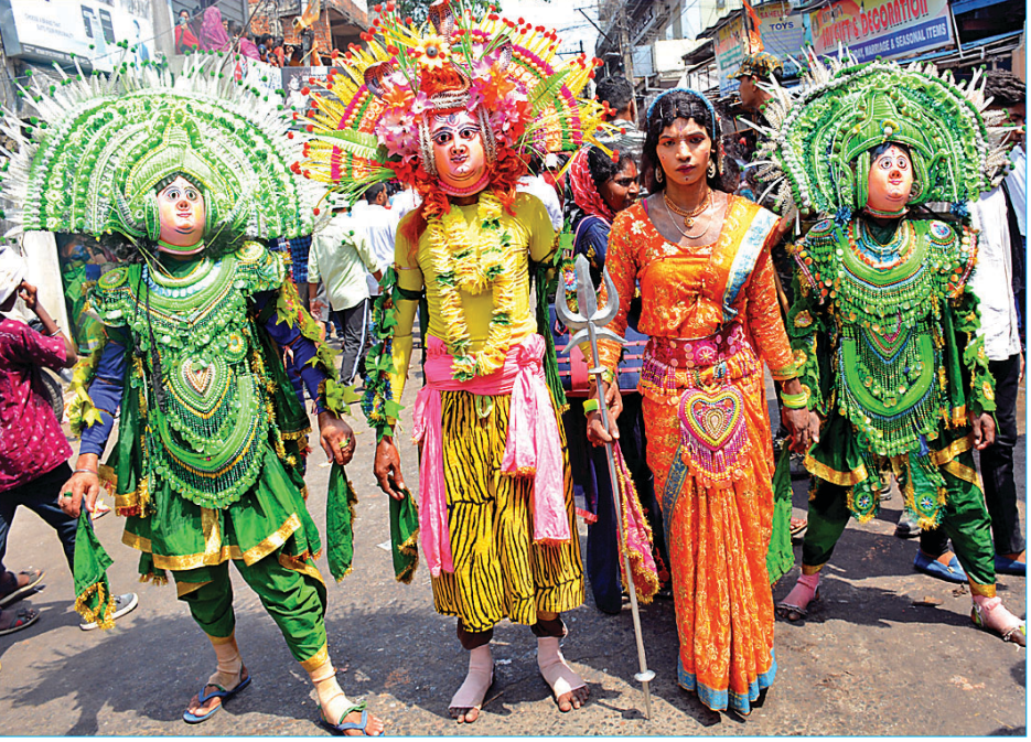
କଳାକାରଙ୍କ ଛନ୍ଦନୁତ୍ୟ ପରିବେଷଣ ।