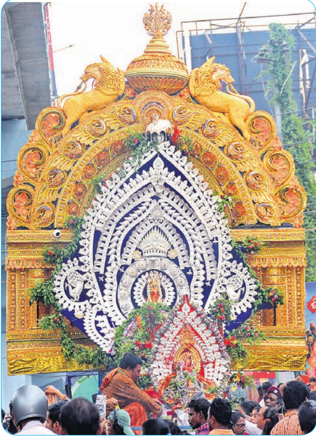
ସୁସଜ୍ଜିତ ମେଢ଼ରେ ମାତା ପାର୍ବତୀ ଓ ଲାଗେଶ୍ଵର ବାବା ।