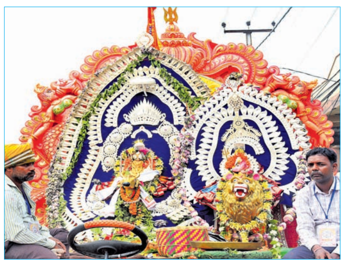
ସୁସଜ୍ଜିତ ମେଢ଼ରେ ମାତା ପାର୍ବତୀ ଓ ବୁଢ଼ାଉଜା ମହାଦେବ ।