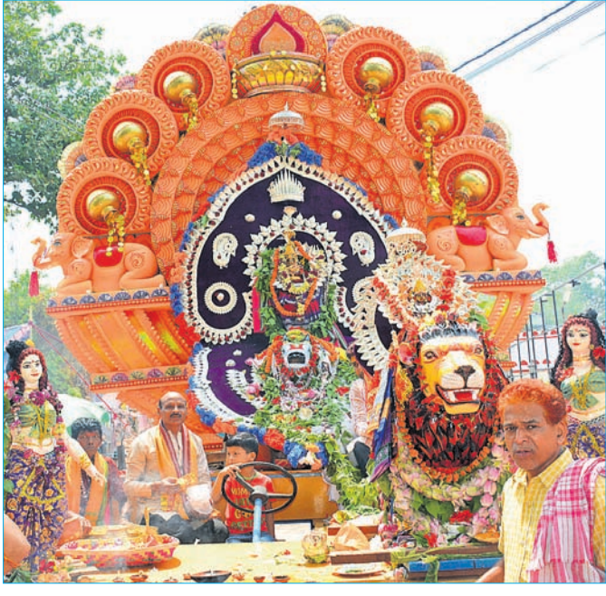
ସୁସଜ୍ଜିତ ମେଢ଼ରେ ମାତା ପାର୍ବତୀ ଓ ଶୀତଳେଶ୍ଵର ବାବା ।