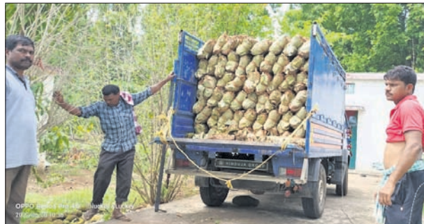
ଜବତ କେନ୍ଦ୍ରପଡ଼ ବୋଝେଇ ଟ୍ରକ୍।

ନାକଟିବେଉଳ ବନବିଭାଗ ପକ୍ଷରୁ ଚଢ଼ାଇ କରାଯାଇ କେନ୍ଦ୍ରପଡ଼ ବୋଝେ ମିନିଟ୍ରକ୍ (ନଂ.୭୫୧୧୯-୨୭୨୦) ଜବତ କରାଯାଇଛି। ଏଥିରେ ସମ୍ପୃକ୍ତ ୩ ଅଭିଯୁକ୍ତଙ୍କୁ ଗିରଫ କରାଯାଇଛି।