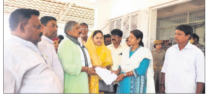
ବିଧାୟକ ସୁରେଶ କୁମାର ରାଉତରାୟ ଦାବିପତ୍ର ପ୍ରଦାନ କରୁଛନ୍ତି।