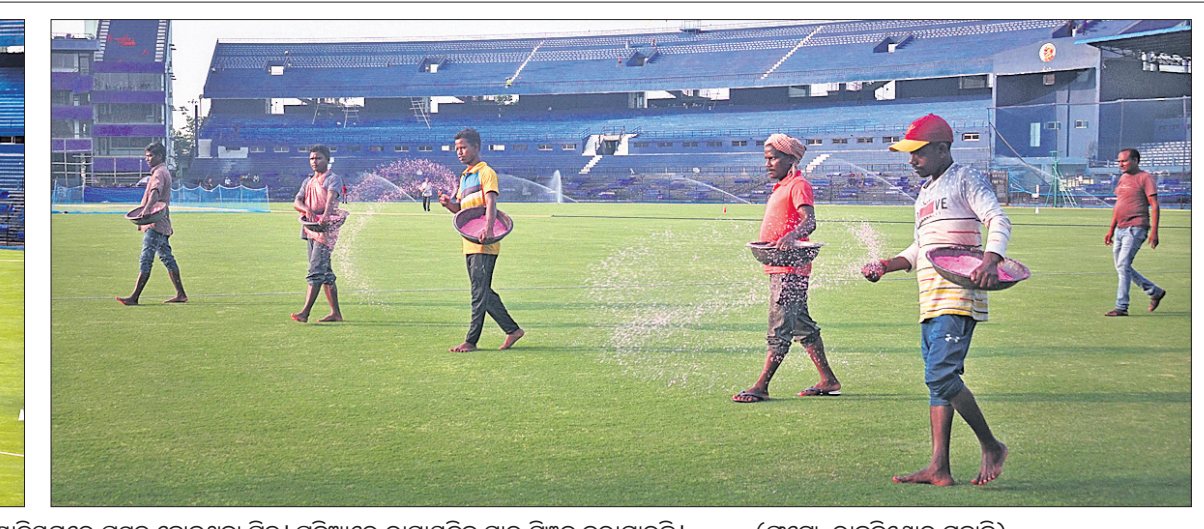
ଜୁନ ୧୨ ତାରିଖରେ ଭାରତ ଓ ଦକ୍ଷିଣ ଆଫ୍ରିକା ମଧ୍ୟରେ ହେବାକୁଥିବା ଅନ୍ତର୍ଜାତୀୟ ଟି୨୦ କ୍ରିକେଟ ମ୍ୟାଚ ପାଇଁ କଟକ ବାରବାଟୀ ଷ୍ଟାଡ଼ିୟମରେ ପ୍ରସ୍ତୁତ ହୋଇଥିବା ପିଠ୍ । ପଡ଼ିଆରେ ରାସାୟନିକ ସାର ସିଞ୍ଚନ କରାଯାଇଛି ।