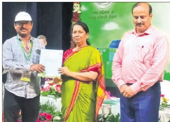
ଭୁବନେଶ୍ୱରଠାରେ ଆୟୋଜିତ ରାଜ୍ୟସ୍ତରୀୟ ବିଶ୍ୱ ପରିବେଶ ଦିବସ ସମାବେଶରେ କଳକ, ପରିବେଶ ଓ ଜଳବାୟୁ ପରିବର୍ତ୍ତନ ବିଭାଗ ପକ୍ଷରୁ ଗରିବଙ୍କ ପ୍ରେସ୍ କ୍ଲବ୍ ପ୍ରକୃତି ମିତ୍ର ସମ୍ମାନ ପ୍ରଦାନ କରାଯାଇଛି ।