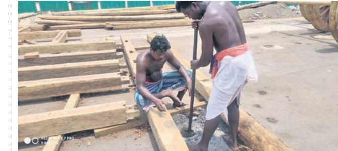
ରଥର ମୁହାଁଟ ଲଗାଯାଉଛି ।