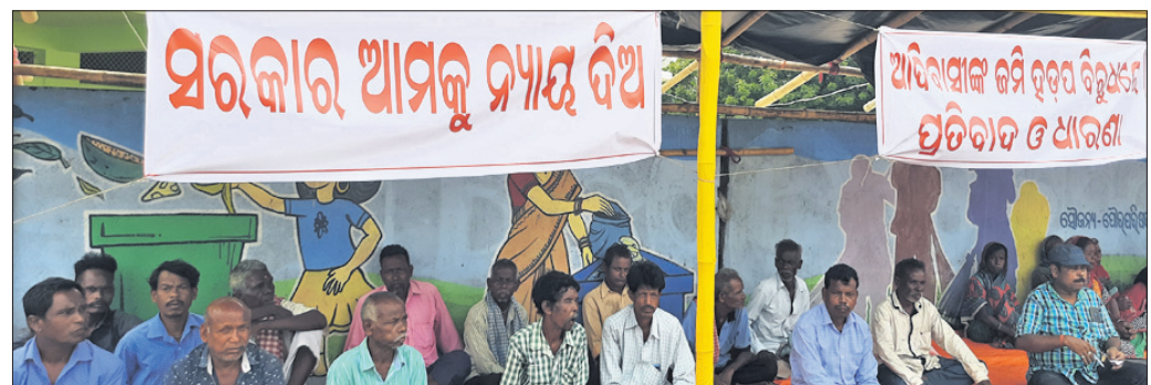
ଜିଲାପାଳଙ୍କ କାର୍ଯ୍ୟାଳୟ ସମ୍ମୁଖରେ ଧାରଣା ଦିଆଯାଇଛି।

ବୋଲଗଡ଼ ବୁକ୍ ଖଜୁରିଆ ମିଳି ଷ୍ଟାଡିୟମରେ ଚାଳିଥିବା ଖଜୁରିଆ ପ୍ରିମିୟର ଲିଗ୍ (କେପିଏଲ) କ୍ରିକେଟ୍ ଚୁନାମେଣ୍ଟର ଦ୍ୱିତୀୟ ଲିଗ୍ ମ୍ୟାଚରେ ଏସ୍ଆର ଓଡ଼ିଶାର ବିଜୟ ହାସଲ ହୋଇଥିଲା। ଏସ୍ଆର ଓଡ଼ିଶା ୧୨୫ ରନରେ ବିଜୟ ହାସଲ କରିଥିଲା। ଏସ୍ଆର ଓଡ଼ିଶା ୧୨୫ ରନରେ ବିଜୟ ହାସଲ କରିଥିଲା। ଏସ୍ଆର ଓଡ଼ିଶା ୧୨୫ ରନରେ ବିଜୟ ହାସଲ କରିଥିଲା।