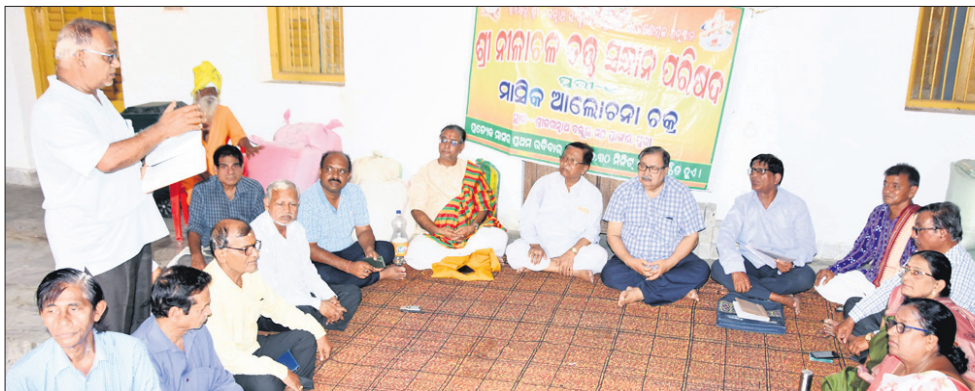
ପୁରୀ ଶ୍ରୀଜଗନ୍ନାଥ ବଲ୍ଲଭ ମଠ ପରିସରରେ ସୋମବାର ଶ୍ରୀନୀଳାଚଳ ଚକ୍ର ସମାଜ ପରିଷଦ ପକ୍ଷରୁ ଆୟୋଜିତ ଆଦିଶକ୍ତୀବାର୍ଷୀ ଏବଂ ଶ୍ରୀଜଗନ୍ନାଥ ସମ୍ପର୍କିତ ଆଲୋଚନାଚକ୍ରରେ ଉପସ୍ଥିତ ଅତିଥି ଓ ସଦସ୍ୟମାନେ ।