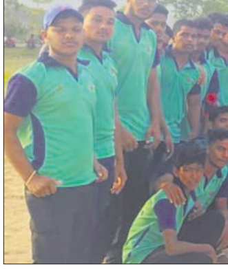
ଅତିଥିଙ୍କ ଗହଣରେ ଭଲ ଧକର ଖେଳାଳିମାନେ।

ବୋଲଗଡ଼, ୬।୬ (ଡି.ଏନ୍.ଏ.): ବୋଲଗଡ଼ ବୁକ୍ ଖଜୁରିଆ ମିଳି ଷ୍ଟାଡିୟମରେ ଚାଳିଥିବା ଖଜୁରିଆ ପ୍ରିମିୟର ଲିଗ୍ (କେପିଏଲ) କ୍ରିକେଟ୍ ଚୁନାମେଣ୍ଟର ଦ୍ୱିତୀୟ ଲିଗ୍ ମ୍ୟାଚରେ ଏସ୍ଆର ଓଡ଼ିଶାର ବିଜୟ ହାସଲ ହୋଇଥିଲା। ଏସ୍ଆର ଓଡ଼ିଶା ୧୨୫ ରନରେ ବିଜୟ ହାସଲ କରିଥିଲା। ଏସ୍ଆର ଓଡ଼ିଶା ୧୨୫ ରନରେ ବିଜୟ ହାସଲ କରିଥିଲା। ଏସ୍ଆର ଓଡ଼ିଶା ୧୨୫ ରନରେ ବିଜୟ ହାସଲ କରିଥିଲା।