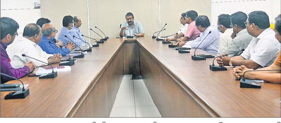
ସ୍ଥଳ ଓ ରାଣଶିକ୍ଷା ମନ୍ତ୍ରୀ ସମୀର ରଞ୍ଜନ ଦାଶଙ୍କୁ ବିଭାଗୀୟ ସର୍ବତ୍ର ପ୍ରତିପଦ ସେଠାରେ ପୁଲଗୋଡ଼ା ବେଳେ ସ୍ୱାଗତ କରାଗଲା ।

ସେମାନଙ୍କ ବିଭାଗ ଓ କାର୍ଯ୍ୟାଳୟର କର୍ମଚାରୀମାନେ ପୁଲଗୋଡ଼ା ବେଳେ ସ୍ୱାଗତ କରିଛନ୍ତି । ନବୀନଙ୍କ ନୂଆ ଚିମ୍ପରେ ୧୩ ଜଣ କ୍ୟାବିନେଟ୍ ମନ୍ତ୍ରୀ, ୮ ଜଣ ରାଷ୍ଟ୍ରମନ୍ତ୍ରୀ ସ୍ଥାନ ପାଇଛନ୍ତି । ଲିଙ୍ଗା ଓ ବୁଦ୍ଧପୁରକୁ ଗଠ୍ୟ କରି ଲୋକଙ୍କ ସମସ୍ୟା ସହ ଅବଗତ ହେବାକୁ ପରାମର୍ଶ ଦେଇଛନ୍ତି ପୁଣ୍ୟମନ୍ତ୍ରୀ । ଲୋକଙ୍କ ବିକାଶ ପାଇଁ ଯତ୍ନଶୀଳ ହେବା ସହ