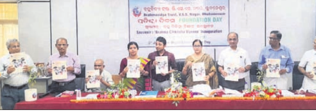
ବ୍ରହ୍ମବିଦ୍ୟା ଗ୍ରନ୍ଥର ପୁସ୍ତକ ପତ୍ର 'ବ୍ରହ୍ମ ବିଦ୍ୟା ବିଜ୍ଞାନ'କୁ ଅତିଥିମାନେ ଉନ୍ନତ କରିଛନ୍ତି।