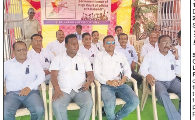
ଜିଲ୍ଲା ବୋରାରୁ କୋର୍ଟ ସମ୍ମୁଖରେ ଜିଲ୍ଲା ଆଇନଜୀବୀ ସଂଘର ଧାରଣା ।