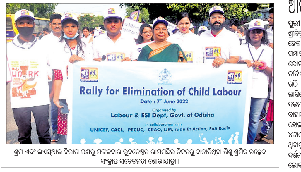
ଶ୍ରମ ଏବଂ ଇସ୍ତୀଲାହ ବିଭାଗ ପକ୍ଷରୁ ପଞ୍ଜାବର ଭୁବନେଶ୍ୱର ରାମମିର ନିକଟରୁ ବାହାରିଥିବା ଶିଶୁ ଶ୍ରମିକ ଉଦ୍ଧେବ ସଂଗ୍ରାହ ସମେତକତା ଶୋଭାଯାତ୍ରା।

ନୂଆପଡ଼ା ଅଫିସ, ୭।୬: ନୂଆପଡ଼ା ଜିଲା କୋମନା ବ୍ଲକ ଅନ୍ତର୍ଗତ ସୁନାବେଡ଼ା ଅଭୟାରଣ୍ୟରୁ କୋମନା ଓ ତରବୋଡ଼ ପୋଲିସ ମିଳିତ ଭାବେ ଏକ ନରକଳ୍ପାଳ ଠାରୁ କଳ୍ପାଳର ହାତରେ ରୁଟି ଥିବା ବେଳେ ମୁଣ୍ଡରେ ଲମ୍ବା ରୁଟି ରହିଥିବା ବେଶୁ ଏହା ଜଣେ ମହିଳାଙ୍କର କଳ୍ପାଳ ବୋଲି ଅନୁମାନ କରାଯାଇଛି।