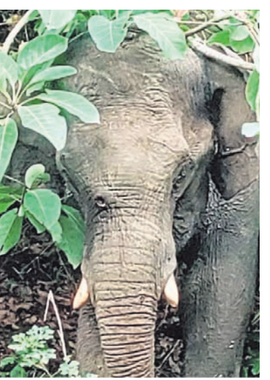
ପଦାରେ ପକାଉଛି ଏ ନେଇ ପିସିସିଏଫ୍ ବନ୍ୟପ୍ରାଣୀ ଶିକା ପକ୍ଷୀ କହିଛନ୍ତି, ହାତୀର ଚିତ୍ରା ପାଇଁ ଏକ ଚିତ୍ର ଗଠନ କରାଯାଇଛି। ତେବେ ବୁଲି ବାଜିଛି କି ନାହିଁ ତାହା ସ୍ଵତନ୍ତ୍ର ଟ୍ରେକ୍‌କିଂ ଦଳ ଦ୍ଵାରା ପଞ୍ଜୀକୃତ ହେବ।

ଭୁବନେଶ୍ଵର, ୭୬(ବୁଧବାର) ଆଠଗଡ଼ ତିନିଜନରେ ସିଦ୍ଧିହ ପ୍ରାଣୀ ହାତୀ ଯେ ସମ୍ପୂର୍ଣ୍ଣ ଭାବେ ଅସୁରକ୍ଷିତ ତାହା ବାରମ୍ବାର ପ୍ରମାଣିତ ହୋଇଆସୁଛି। ଆଠଗଡ଼ ବନଖଣ୍ଡ ଅଧୀନସ୍ଥ ବଡ଼ମ୍ବା ରେଞ୍ଜରେ ବୁଲିବିନ୍ଧ ଦଳରେ ୨ ଓ ୩ ଡାରିଖରେ ଲଗାତର ବୁଲିବିନ୍ଧରେ ବୁଲିବିନ୍ଧ ବାଳିକାକୁ ଗ୍ରାହଣକାରୀ ସ୍ଵତନ୍ତ୍ର ଚାପୁଟା ଫାଟିବିନ୍ଧ ଭାବେ ଗଣ୍ୟ କରାଯାଉଛି।