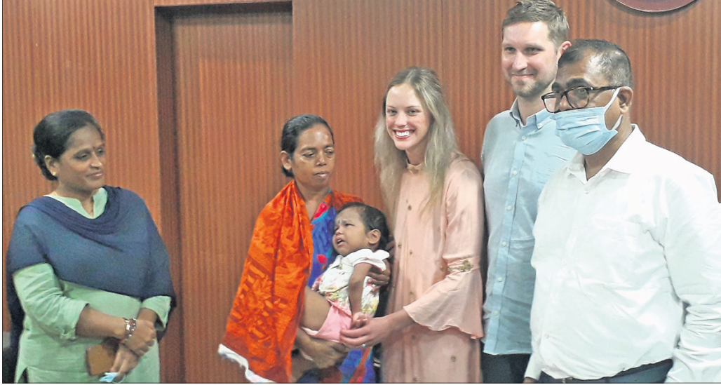
ଜିଲାପାଳଙ୍କ କାର୍ଯ୍ୟାଳୟରେ ହେଉଥିବା ଏମ୍ବିଏର ପୁନ୍ୟାଙ୍କୁ ପୋଷ୍ୟ ସନ୍ତାନ ଭାବେ ଗ୍ରହଣ କରୁଛନ୍ତି।