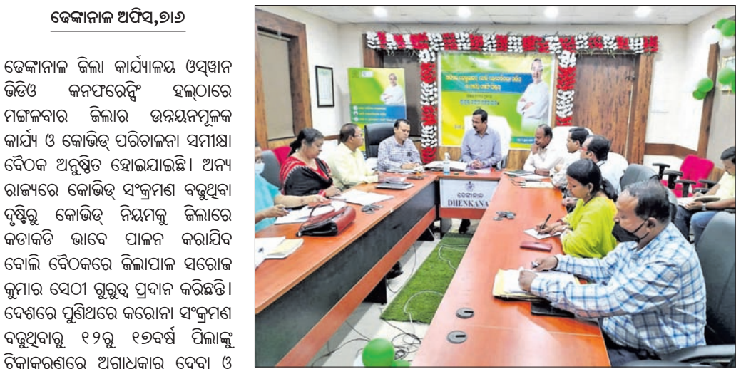
ଉତ୍ତମବିଧି କାର୍ଯ୍ୟ ଓ କୋଭିଡ୍ ପରିଚାଳନା ସମୀକ୍ଷା ବୈଠକରେ ଅଧିକାରୀମାନେ।

ଦେଓଗାଁ ରଥ ନିର୍ମାଣ କାର୍ଯ୍ୟ ଚାଲୁ ରହିଛି। ଦେଓଗାଁ ରଥ ନିର୍ମାଣ କାର୍ଯ୍ୟ ଚାଲୁ ରହିଛି।