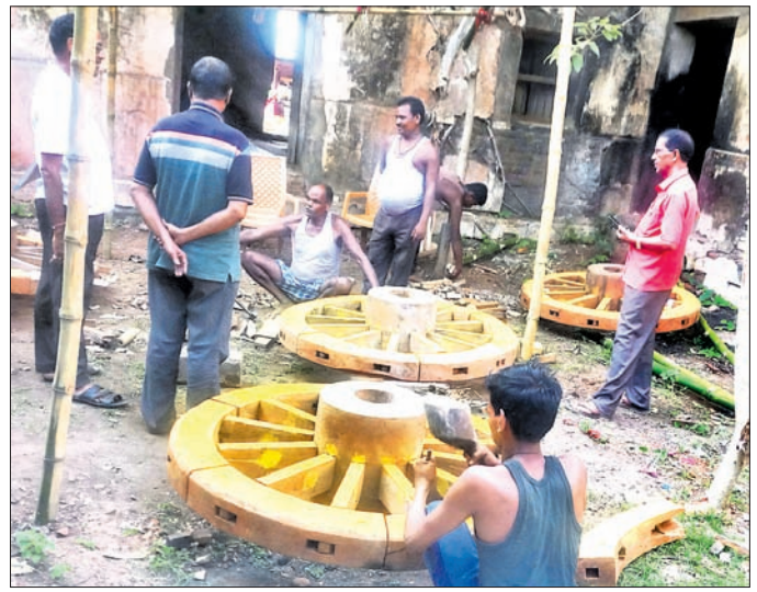
ଦେଓଗାଁ ରଥ ନିର୍ମାଣ କାର୍ଯ୍ୟ ଚାଲୁ ରହିଛି।

ଦେଓଗାଁ ରଥ ନିର୍ମାଣ କାର୍ଯ୍ୟ ଚାଲୁ ରହିଛି। ଦେଓଗାଁ ରଥ ନିର୍ମାଣ କାର୍ଯ୍ୟ ଚାଲୁ ରହିଛି।