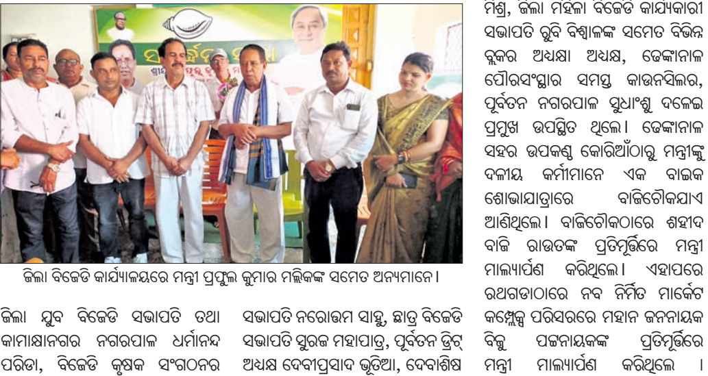
ଜିଲା ବିଜେଡି କାର୍ଯ୍ୟାଳୟରେ ମନ୍ତ୍ରୀ ପ୍ରଫୁଲ୍ଲ କୁମାର ମଲିକଙ୍କ ସମେତ ଅନ୍ୟମାନେ।