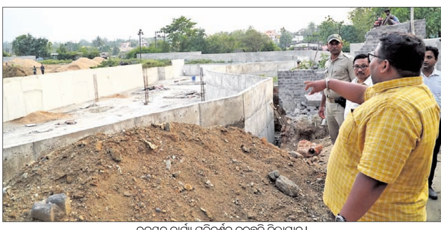
ଉନ୍ନୟନ କାର୍ଯ୍ୟ ପରିଦର୍ଶନ କରୁଛନ୍ତି ଜିଲାପାଳ।