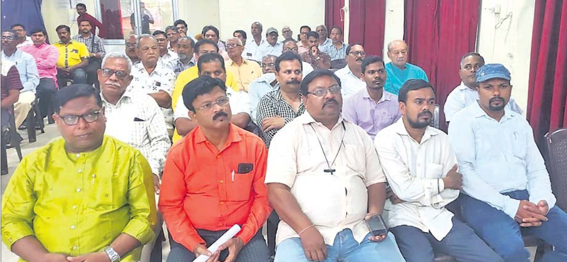
ବଲାଙ୍ଗୀର ସାମ୍ବାଦିକ ଭବନରେ ଆୟୋଜିତ ଆଲୋଚନାଚକ୍ରରେ ଯୋଗ ଦେଇଥିବା ଅତିଥି ଓ ବୁଦ୍ଧିକାମୀ ।