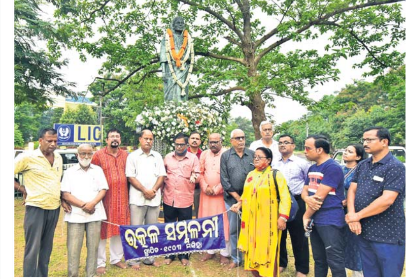
ଉତ୍କଳ ସମ୍ମିଳନୀ ପକ୍ଷରୁ ଶ୍ରଦ୍ଧାଞ୍ଜଳି ଅର୍ପଣ କରାଯାଉଛି ।