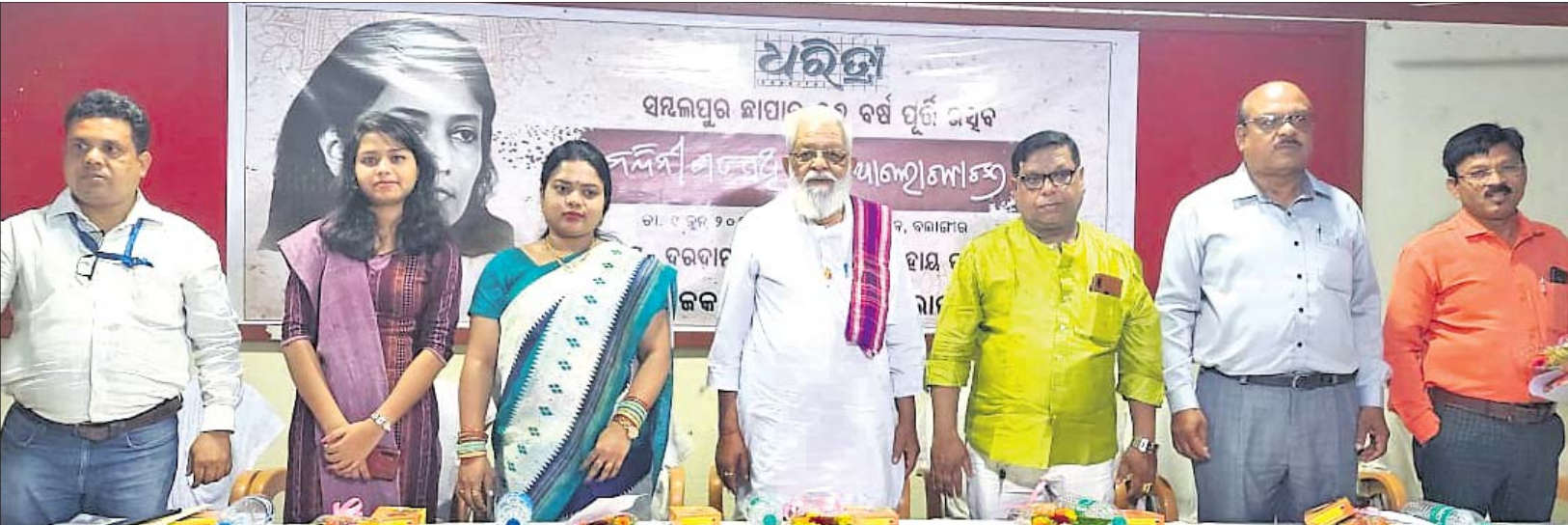
ଧରିତ୍ରୀ ସମ୍ମାନପୁର ଛାପାର ୧୨ବର୍ଷ ପୂର୍ତ୍ତି ଏବଂ ପୂର୍ବତନ ମୁଖ୍ୟମନ୍ତ୍ରୀ ନନ୍ଦିନୀ ଶତପଥୀଙ୍କ ୯୧ତମ ଜୟନ୍ତୀ ଅବସରରେ ଗୁରୁବାର ବଲାଙ୍ଗୀର ସାମ୍ବାଦିକ ଭବନରେ ଆୟୋଜିତ ନନ୍ଦିନୀ ଶତପଥୀ ସ୍ମୃତି ଆଲୋଚନାଚକ୍ରରେ ଅତିଥି ଭାବେ ଯୋଗଦେଇଥିବା ବିଶିଷ୍ଟ ବ୍ୟକ୍ତିତ୍ୱ (ବାମ) । ମାଲ୍ୟାପର୍ଗଣା ଅବସରରେ ଉପସ୍ଥିତ ଅତିଥି ।