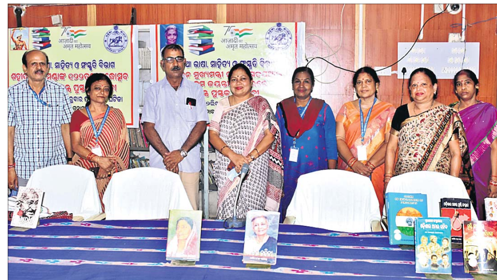
ନନ୍ଦିନୀ ଶତପଥୀଙ୍କ ଜୟନ୍ତୀରେ ରାଜ୍ୟ ଅଭିଲେଖାଗାରଠାରେ ଆୟୋଜିତ ଶ୍ରଦ୍ଧାଞ୍ଜଳି ସଭା ।