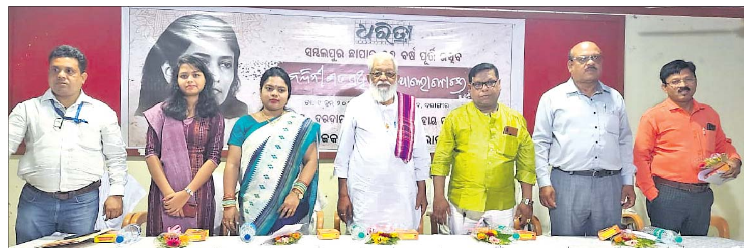
ଧରତ୍ରୀ ସମ୍ବଲପୁର ଛାପାରେ ୧୭ବର୍ଷ ପୂର୍ଣ୍ଣ ଏବଂ ପୂର୍ବତନ ମୁଖ୍ୟମନ୍ତ୍ରୀ ନନ୍ଦିନୀ ଶତପଥୀଙ୍କ ୯୧ତମ ଜୟନ୍ତୀ ଅବସରରେ ଗୁରୁବାର ବଲାଙ୍ଗୀର ସାମାଜିକ ଭବନଠାରେ ଆୟୋଜିତ ନନ୍ଦିନୀ ଶତପଥୀ ସ୍ମୃତି ଆଲୋଚନାଚକ୍ରରେ ଅତିଥି ଭାବେ ଯୋଗଦେଇଥିବା ବିଶିଷ୍ଟ ବ୍ୟକ୍ତି ।