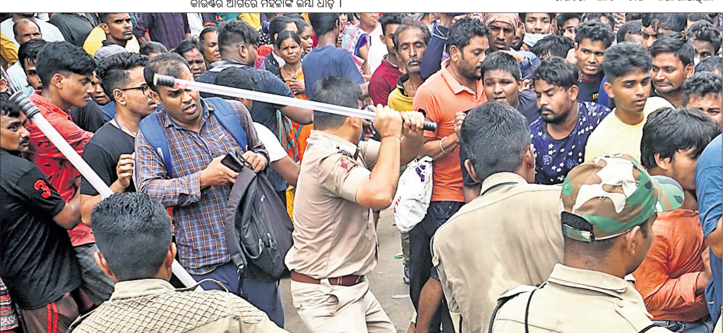
ଭିଡ଼ ଓ ଠେଲାପେଲା ନିୟନ୍ତ୍ରଣ ପାଇଁ ପୋଲିସର ଲାଠି ଚାଳି ।

ଟିକେଟ ନେଇ ମହିଳାଙ୍କ ମଧ୍ୟରେ ଧସାଧସି ୨୯ର୍ଷ ପରେ ବାରବାଟୀରେ ଖେଳ ହେଉଥିବାରୁ କ୍ରିକେଟପ୍ରେମୀଙ୍କ ମଧ୍ୟରେ ବେଶ୍ ଉତ୍ସାହ ଦେଖିବାକୁ ମିଳିଛି । ଟିକେଟ କିଣିବା ପାଇଁ ବେଶ୍ ଭିଡ଼ ପରିଲକ୍ଷିତ ହୋଇଥିଲା । ସେହିପରି ଧାଡ଼ିରେ ଛିଡ଼ା ହେବାକୁ ନେଇ କେତେକଙ୍କ ମୁହଁତା ହାତାହାତି ମଧ୍ୟ ହୋଇଥିଲା । ଠେଲାପେଲା, ପାଟିଚୁଷ୍ଟ ସହ ଲୋକଙ୍କ ମଧ୍ୟରେ ହାତାହାତି ପରିସ୍ଥିତି ମଧ୍ୟ ସୃଷ୍ଟି ହୋଇଥିଲା । ଏଥିପାଇଁ ପୋଲିସ୍ କୁ ନାକେଦମ୍ ହେବାକୁ ପଡ଼ିଥିଲା । ଉପସ୍ଥିତ ମହିଳା ପୋଲିସ୍ କର୍ମୀ ସେମାନଙ୍କୁ ବୁଝାଇ ଛିଡ଼ା କରାଯାଇଥିଲା । ତେବେ ପରିସ୍ଥିତି ଜଟିଳ ହେବାକୁ ମହିଳାଙ୍କ ଉପରେ ଲାଠି ଚାଳି କରାଯାଇଥିଲା ।