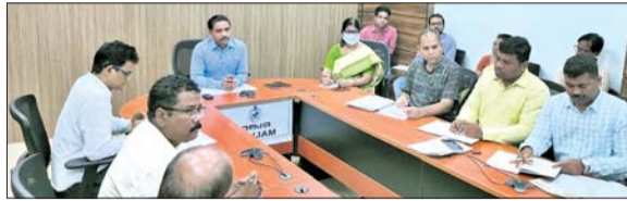
ବୈଠକରେ ଉପସ୍ଥିତ ଜିଲ୍ଲାପାଳ ଓ ଅନ୍ୟମାନେ ।