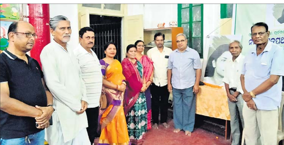
ସୁନ୍ଦରଗଡ଼ ସାହିତ୍ୟ ଅନୁଷ୍ଠାନ ଅରଣ୍ୟ ଓ ଧରତ୍ରୀର ମିଳିତ ଆନୁକୁଲ୍ୟରେ ଗୁରୁବାର ସୁନ୍ଦରଗଡ଼ ବୀରମିତ୍ର କୁଳ ପ୍ରାଙ୍ଗଣରେ ପୂର୍ବତନ ମୁଖ୍ୟମନ୍ତ୍ରୀ ନନ୍ଦିନୀ ଶତପଥୀଙ୍କ ଜୟନ୍ତୀ କାର୍ଯ୍ୟକ୍ରମରେ ଫଟୋଟିଭ୍ରରେ ମାଲ୍ୟାପର୍ଚ୍ଚା ଅବସରରେ ଅତିଥିମାନେ ।