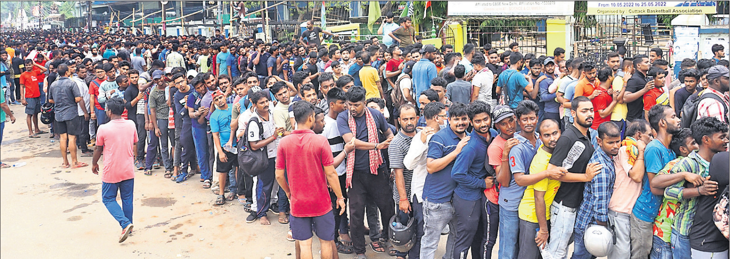
ଟିକେଟ କାଉଣ୍ଟର ଆଗରେ ଲୋକଙ୍କ ପ୍ରବଳ ଭିଡ଼ ।