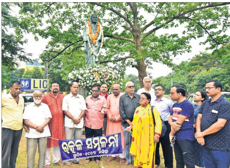
ଭକ୍ତ ସମ୍ମିଳନୀ ପକ୍ଷରୁ ଶ୍ରଦ୍ଧାଞ୍ଜଳି ଅର୍ପଣ କରାଯାଇଛି ।