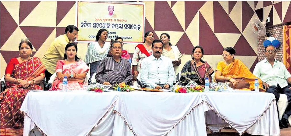
ଜେଜୀବାଳା ନନ୍ଦିନୀ ଦେବୀ ଜୟନ୍ତୀ କମିଟି ପକ୍ଷରୁ ଘାଣ୍ଟିଆ ଗୋପବନ୍ଧୁ ଗାଉଁନ୍ ହଲରେ ଗୁରୁବାର ଅନୁଷ୍ଠିତ ନନ୍ଦିନୀ ଶତପଥୀଙ୍କ ୯୧ତମ ଜୟନ୍ତୀ ସମାବେଶରେ ଉପସ୍ଥିତ ଅତିଥିମାନେ ।