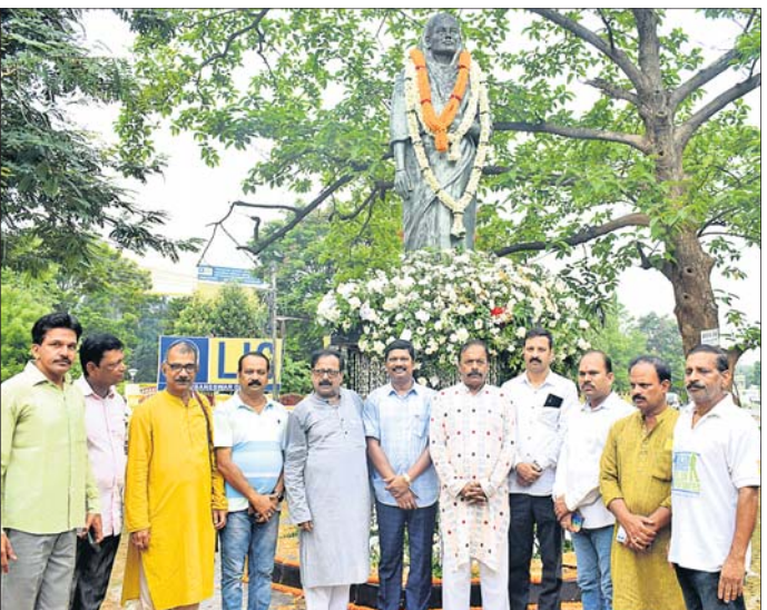
ଓଡ଼ିଆ ଭାଷା, ସାହିତ୍ୟ ଓ ସଂସ୍କୃତି ବିଭାଗ ଏବଂ ବିଜେଡି ଭାଷା, ସାହିତ୍ୟ ଓ ସଂସ୍କୃତି ସେଲ ପକ୍ଷରୁ ପୂଷ୍ପମାଲ୍ୟ ଅର୍ପଣ ଅବସରରେ ।