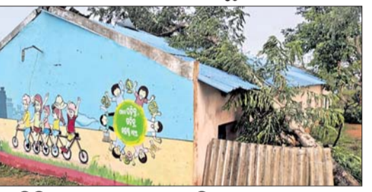
ଗଛ ପତି ବିଦ୍ୟାଳୟର ଛପର ନଷ୍ଟ ହୋଇଛି।

କାଳବୈଶାଖୀ ପ୍ରଭାବରେ ଛପର ନଷ୍ଟ ହୋଇଛି। ଆର.ଉଦୟଗିରି, ୯୬(ଡି.ଏନ୍.ଏ.)