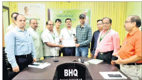
ବିଦେଶୀୟ ଉପଜିଲାପାଳ ମାନପତ୍ର ପ୍ରଦାନ କରୁଛନ୍ତି ।