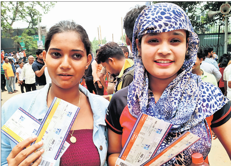
ଟିକେଟ ପାଇବା ପରେ ଖୁସିବ୍ୟକ୍ତ କରୁଛନ୍ତି ଦୁଇ ଯୁବତୀ ।

ଅସମ୍ଭବ ଭିଡ଼ ଦେଖିବାକୁ ମିଳିଥିଲା । ମଧ୍ୟାହ୍ନରେ ମହିଳାଙ୍କ ପାଇଁ ହୋଇଥିବା ଧାଡ଼ିରେ ଠେଲାପେଲା ସହ ମାଡ଼ ମରାମତି ସ୍ଥିତି ରପୂର୍ଣ୍ଣିକାକୁ ପୋଲିସ୍ କିଛି ସମୟ ପାଇଁ ଲାଠି ଚାଳି କରିଥିଲା । ଘଣ୍ଟା ଘଣ୍ଟା ଧରି ଟିକେଟ ପାଇଁ ଅପେକ୍ଷା କରିଥିଲେ ମଧ୍ୟ ଅନେକଙ୍କୁ ଖାଲି ହାତରେ ନିରାଶ ହୋଇ ଫେରିଥିବା ଦେଖିବା ମିଳିଥିଲା । ଗୁରୁବାର ଟିକେଟ ବିକ୍ରି ପାଇଁ କାଉଣ୍ଟର ଆଗରେ ବ୍ୟାରିକେଡର ବ୍ୟବସ୍ଥା କରାଯାଇଥିଲା । ୧୨ହଜାର ଟିକେଟ ବିକ୍ରି ହେବାକୁ ଥିବାବେଳେ ପ୍ରାୟ ୩୫ହଜାର ଲୋକଙ୍କ ଭିଡ଼ ଦେଖିବାକୁ ମିଳିଥିଲା । ପ୍ରବଳ