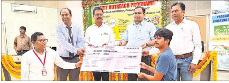
ଜଣେ ହିତାଧିକାରୀଙ୍କୁ ରାଣ ଦିଆଯାଉଛି ।

ପାରଳାଖେମୁଣ୍ଡି ଗ୍ରାମ ପଞ୍ଚାୟତ ବ୍ୟାଙ୍କର ଗ୍ରାମୀଣ ଆର୍ଥିକ ସୁଧା ପ୍ରସାରଣ କେନ୍ଦ୍ର ସମ୍ବଳନ କ୍ରମରେ ଲିଡ ବ୍ୟାଙ୍କ ପକ୍ଷରୁ ରାଣ ବନ୍ଧନ ମେଳା ଅନୁଷ୍ଠିତ ହୋଇଯାଇଛି।