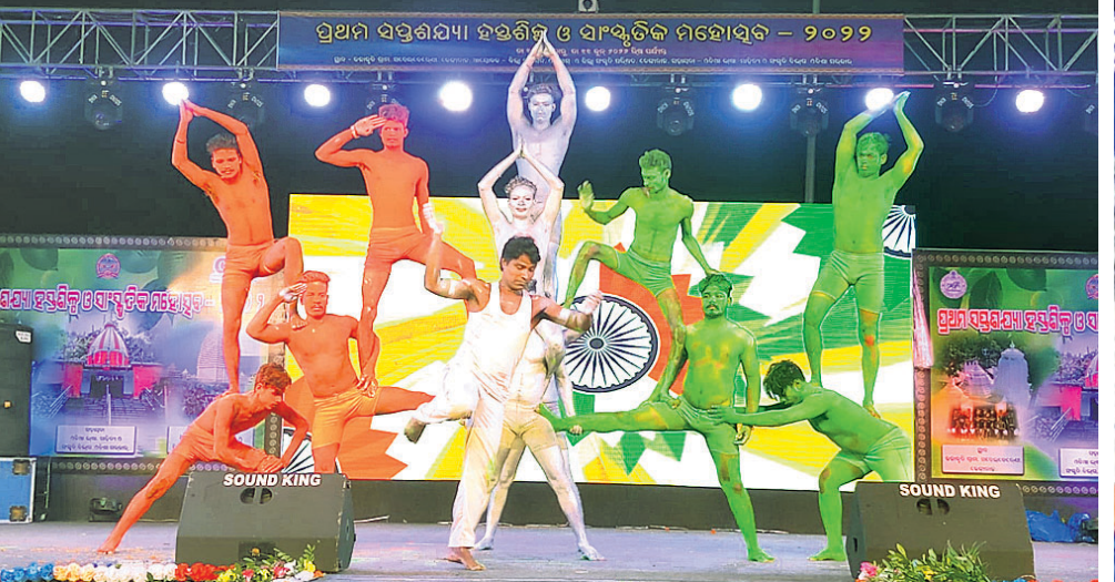
ଗଞ୍ଜାମର ପ୍ରିୟା ଡାଃ ଗୁପ୍ତାଙ୍କ କଳାକାରଙ୍କ ଦ୍ୱାରା ପରିବେଷିତ ରଙ୍ଗୀରଙ୍ଗ ନୃତ୍ୟ।

ପାହୋସବରେ ମମ୍ତା କଲେ କଳାକାରଙ୍କୁ ସମର୍ଥନ କରୁଛନ୍ତି।