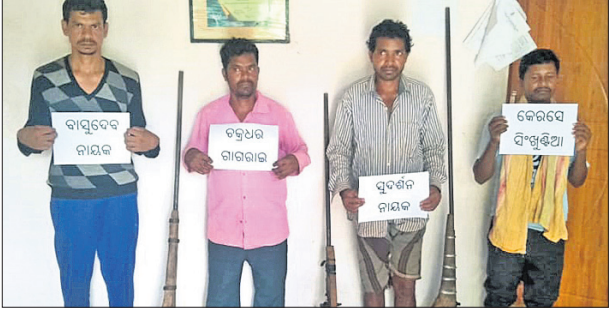
ଗିରଫ ୪ ଶିକାରୀ ।