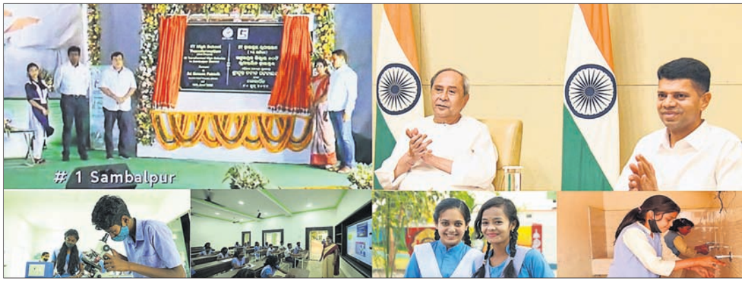
ଦ୍ୱିତୀୟ ପର୍ଯ୍ୟାୟର ସ୍କୁଲ ରୂପାନ୍ତରଣ କାର୍ଯ୍ୟକ୍ରମର ଶେଷ ଦିବସରେ ମୁଖ୍ୟମନ୍ତ୍ରୀ ନବୀନ ପଟ୍ଟନାୟକ ଓ ୫-ଟି ସଭ୍ୟ ଉ.କେ. ପାଠିଆନ ।