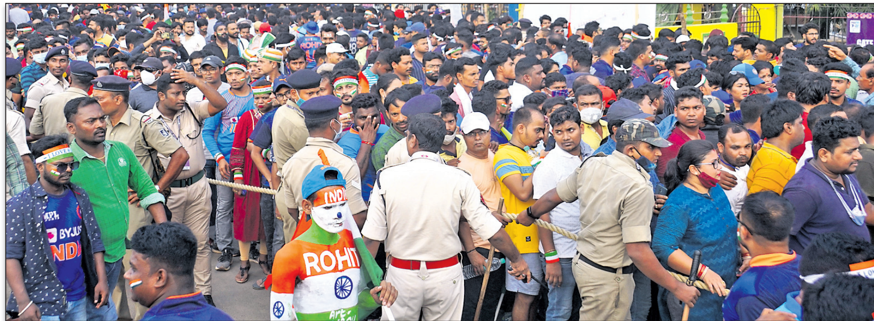
ଷ୍ଟାଡ଼ିୟମ ଭିତରକୁ ପ୍ରବେଶ ପାଇଁ ଭିଡ଼ ।