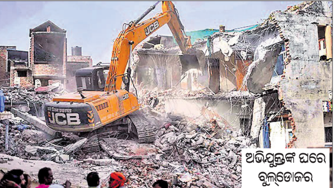
ନିଆଯିବ ବୋଲି ମୁଖ୍ୟମନ୍ତ୍ରୀ ଯୋଗା ଆଦିତ୍ୟନାଥ ଚେତାବନୀ ଦେବା ପରେ ବିତାଡ଼ି ଦିନ ପାଇଁ ବୁଲିତୋକର ହାରା ଅଭିଯୁକ୍ତଙ୍କ ଘର ଭଙ୍ଗାଯାଇଛି।

ପ୍ରଫେଟ୍ ମହମ୍ମଦଙ୍କ ଉପରେ ଭାଙ୍ଗିପା ପୂର୍ବତନ ମୁଖ୍ୟମନ୍ତ୍ରୀ ନୁସରତ୍ ଶର୍ମା ଓ ନବାଜ୍ ଇଜ୍ଜତ୍ ବିବାଦୀ ମତବ୍ୟକୁ କେନ୍ଦ୍ର କରି ହିଂସା ଘଟାଇଥିବା ବ୍ୟକ୍ତିମାନେ ଜନସାଧାରଣଙ୍କ ସମ୍ପତ୍ତି ନଷ୍ଟ ବାବଦ ଦେୟ ଭରିବେ ବୋଲି ଉଚ୍ଚତମାଦେଶ ପୋଲିସ୍ କହିଛି।