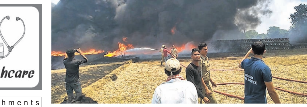
ଅଗ୍ନିଶମ ବିଭାଗ କର୍ମଚାରୀମାନେ ନିଆଁ ଲିଭାଇବାକୁ ଉଦ୍ୟମ କରୁଛନ୍ତି।

ସୋନପୁର/ଭୁବନେଶ୍ୱର, ୧୨।୬ (ନି.ପ୍ର.) ସୁବର୍ଣ୍ଣପୁର ଜିଲ୍ଲା ଭୁବନେଶ୍ୱର ଜିଲ୍ଲା ଲାଲକଟା ଛକରେ ଏକ ଠିକାସମ୍ପା ପକ୍ଷରୁ ଗଠିତ ରଖାଯାଇଥିବା ପାଇପରେ ରବିବାର ନିଆଁ ଲାଗି ଯାଇଥିଲା। ଏଥିଯୋଗୁଁ ପାନାୟ ଜଳ ଯୋଗାଣ କାର୍ଯ୍ୟରେ ବ୍ୟବହୃତ ହେବାକୁ ଥିବା ଲକ୍ଷ୍ମଣ ଚକ୍କାର ପୁଷ୍ଟିକ ପାଇପ୍ ପୋଡ଼ି ପାଉଁଶ ହୋଇଯାଇଛି।