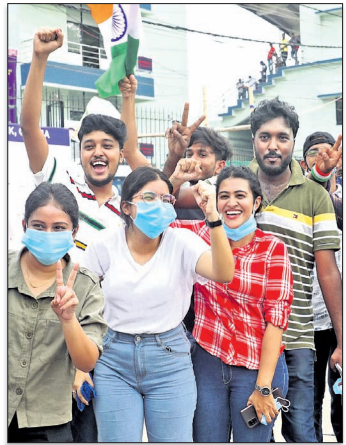
ଟିମ୍ ଜଣ୍ଡିଆ ସପକ୍ଷରେ ସ୍ଵୋଗାର୍ ।