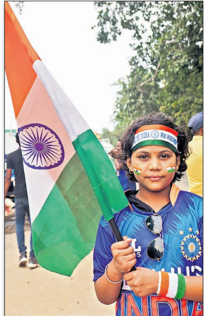
ମ୍ୟାଚ ଦେଖିବାକୁ ଆସିଥିବା ଜଣେ ବାଳିକା ।