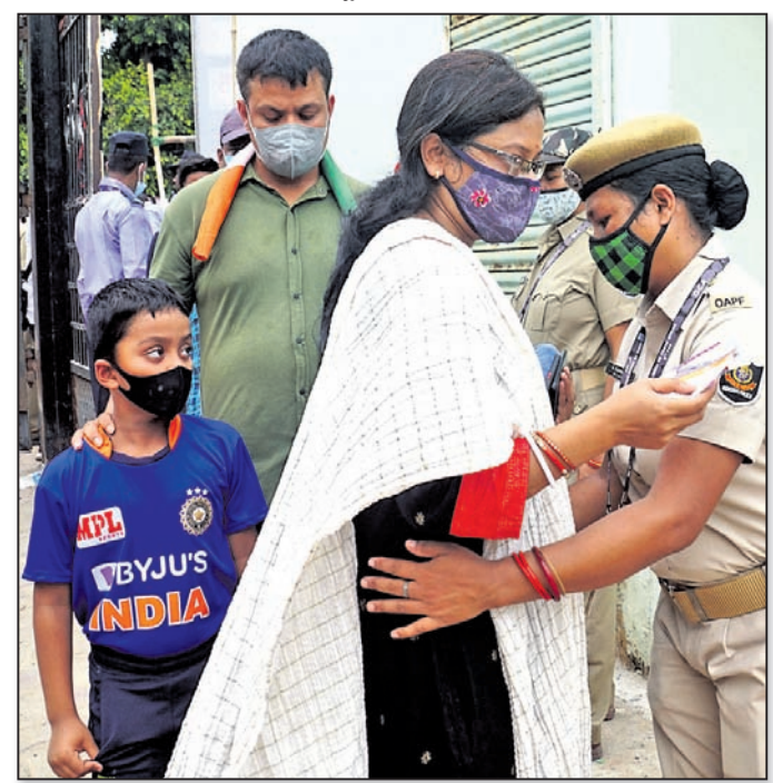
ପୁରସ୍କାବର୍ତ୍ତୀଙ୍କ ଦ୍ଵାରା ଯାତ୍ରା ।