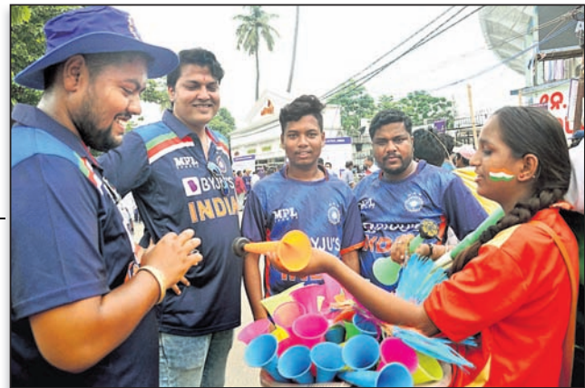
ଖେଳପ୍ରେମୀଙ୍କୁ ପୈକାଳି ବିକ୍ରି ।