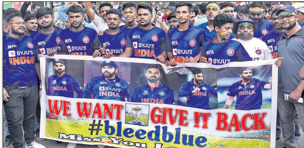
ଟିମ୍ ଜଣ୍ଡିଆ ପୋଷାକରେ ଭାରତୀୟ ଦଳର ସମର୍ଥକ ।