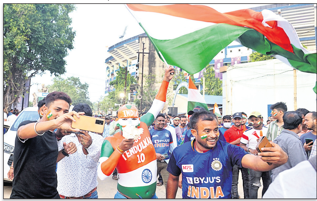
ସେଲଫିର ମନା ।