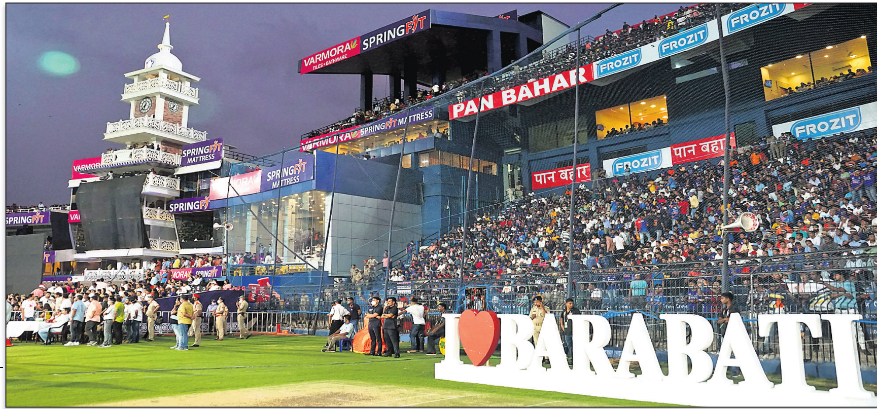
ଦର୍ଶକଭରା ବାରବାଟୀ ଷ୍ଟାଡ଼ିୟମ ।