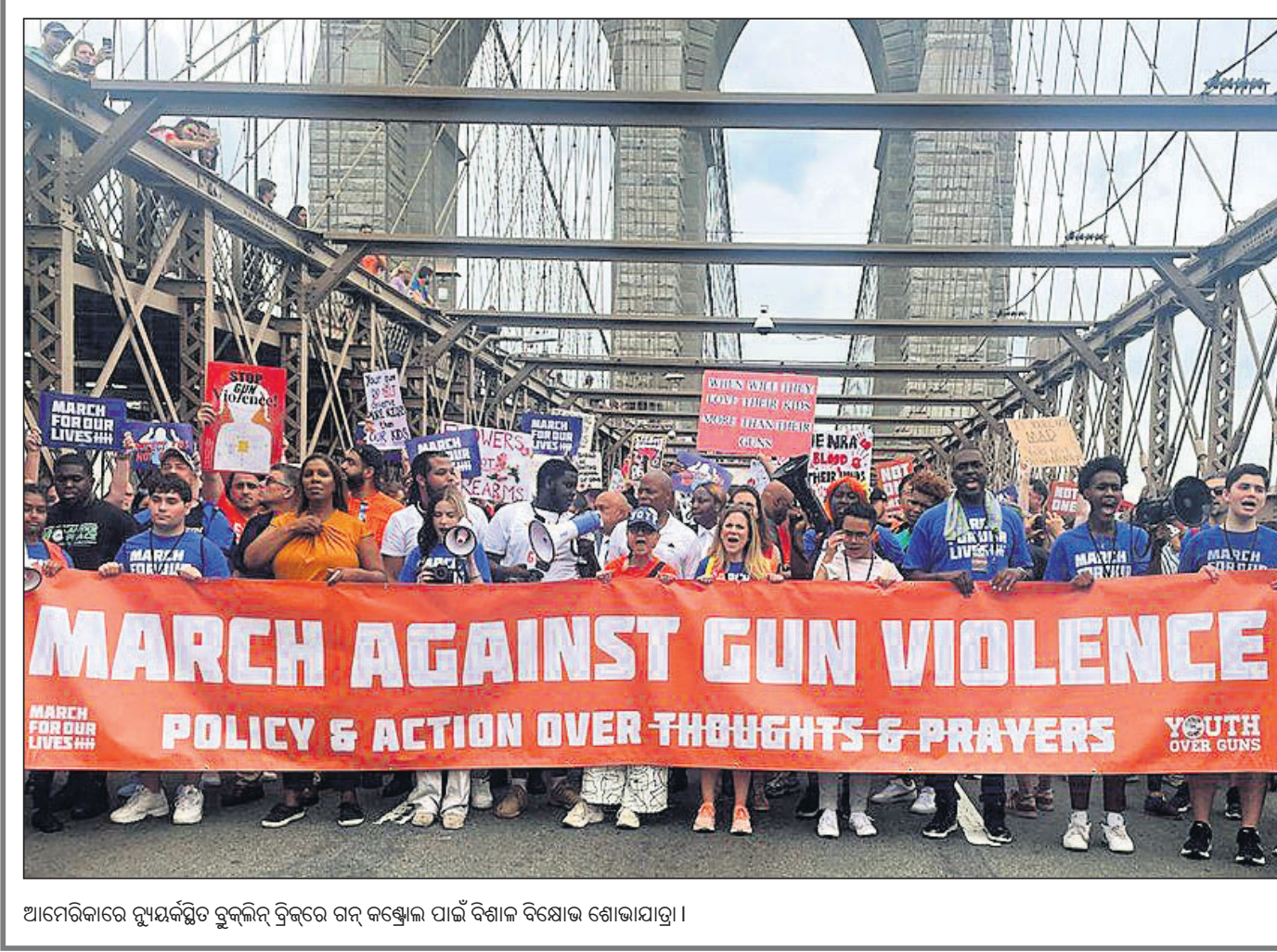
ଆମେରିକାରେ ବ୍ୟୁୟର୍ସ୍ ଟ୍ରକ୍ରେ ଗନ୍ କଣ୍ଟ୍ରୋଲ ପାଇଁ ବିଶାଳ ବିକ୍ଷୋଭ ଶୋଭାଯାତ୍ରା।