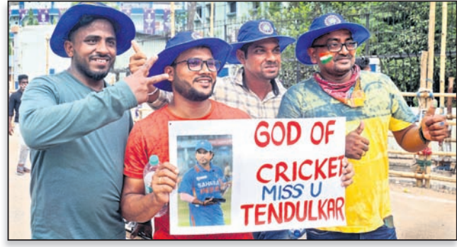
ଡେହୁଲକରଙ୍କୁ ସ୍ମରଣ ।