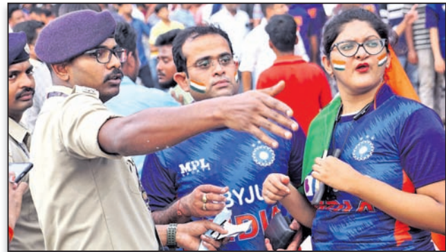
ପୋଲିସ୍ ସହାୟତା ।