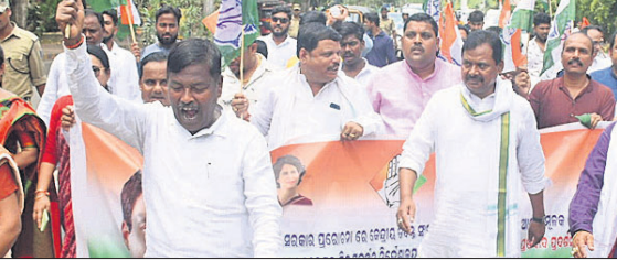
ଭୁବନେଶ୍ୱର ଇଡି କାର୍ଯ୍ୟାଳୟ ସମ୍ମୁଖରେ କଂଗ୍ରେସର ପ୍ରତିବାଦ।

ଆଇଯୋଗ କରାଯାଇଛି। ଯୋଗଦାନ ରାହୁଲଙ୍କୁ ଇଡିର ତାକରା ନେଇ ପ୍ରଦେଶ କଂଗ୍ରେସ କମିଟି(ପିସିସି) ପକ୍ଷରୁ ଭୁବନେଶ୍ୱର ଇଡି କାର୍ଯ୍ୟାଳୟ ସମ୍ମୁଖରେ ପିସିସି ସଭାପତି ଶରତ ପଟ୍ଟନାୟକଙ୍କ ନେତୃତ୍ୱରେ ପ୍ରତିବାଦ ଶୋଭାଯାତ୍ରା, ସଭା ଓ ଘେରାଉ କରାଯାଇଛି।