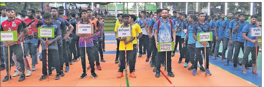
ଉତ୍ସାବୀୟ ସମାବେଶରେ ଅଂଶଗ୍ରହଣକାରୀ ଦଳ ଗୁଡ଼ିକର ପ୍ରତିଯୋଗୀମାନେ ।