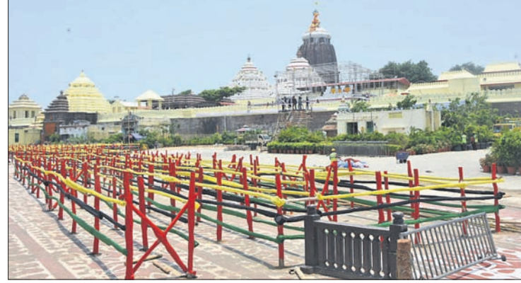
ପୁରୀ ଅଫିସ, ୧୩୬

ହୁଇ ବର୍ଷ ପରେ ଭକ୍ତଙ୍କ ମେଳରେ ହେବ ସ୍ନାନଯାତ୍ରା । ସ୍ନାନବେଦୀରେ ସ୍ନାନ କରି ମଙ୍ଗଳବାର ହାତୀବେଶରେ ଦର୍ଶନ ଦେବେ ଦାରୁଦିଆଁ । ଏଥିପାଇଁ ସଞ୍ଚନ ନାଟିକାଳି ନିର୍ଦ୍ଦେଶ ଦେଇଛି । ରକ୍ତ ସିଂହାସନରେ ଚାରମାଳ ବନ୍ଧା ସହ ଶ୍ରୀଅଙ୍ଗରେ ସେନାପତି ଓ ବାହୁଡ଼ା