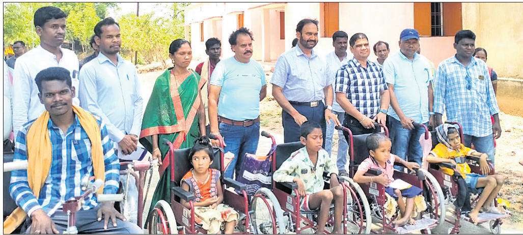
ଜିଲ୍ଲାପାଳଙ୍କ ଅଭିଯୋଗ ଶୁଣାଣି ସମୟରେ ଉପସ୍ଥିତ ବ୍ୟକ୍ତିମାନଙ୍କ ସମ୍ମୁଖରେ ସମାଧାନ କରାଯାଇଛି।

ନବରଙ୍ଗପୁର ଜିଲ୍ଲା ଚାନ୍ଦିନୀ ବ୍ଲକ୍ରେ ସୋମବାର ଜିଲ୍ଲାପାଳଙ୍କ ଅଭିଯୋଗ ଶୁଣାଣି ଅନୁଷ୍ଠିତ ହୋଇଛି।