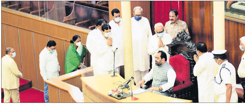
ବ୍ରଜରାଜନଗର ବିଧାନସଭାରେ ବିକ୍ରମ କେଶରୀ ଆରୁଖ ନିର୍ବାଚିତ ହେବା ପରେ ପୁଣ୍ୟମନ୍ତ୍ରୀ ନବୀନ ପଟ୍ଟନାୟକ, ବିରୋଧୀ ଦଳ ନେତା ନରସିଂହ ମିଶ୍ର ଓ ଅନ୍ୟମାନେ ତାଙ୍କୁ ସ୍ୱାଗତ କରୁଛନ୍ତି।

ଓଡ଼ିଶା ବିଧାନସଭାରେ ନୂଆ ବାଚସ୍ପତି ଭାବେ ବିକ୍ରମ କେଶରୀ ଆରୁଖ ସର୍ବସମ୍ମତରେ ନିର୍ବାଚିତ ହୋଇଛନ୍ତି। ବାଚସ୍ପତି ଭାବେ ଆରୁଖଙ୍କୁ ଉପବାଚସ୍ପତି ରକ୍ଷାକାନ୍ତ ସିଂହ ବାଚସ୍ପତି ଭାବେ ଘୋଷଣା କରିଛନ୍ତି।