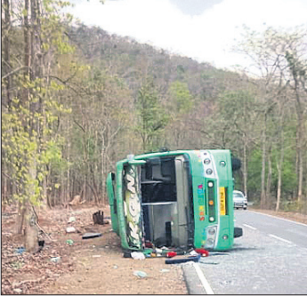
ରାସ୍ତା ପାର୍ଶ୍ୱକୁ ଓଲଟି ପଡ଼ିଥିବା ବସ୍ ।

କଳାହାଣ୍ଡି ଜିଲ୍ଲା ଭବାନୀପାଟଣାରୁ ହାଲଡ୍ରାବାଦ ଅଭିମୁଖେ ଯାଉଥିବା କେଲିଏନ୍ ନାମକ ଘରୋଇ ଯାତ୍ରାବାହୀ ବସ୍ ରବିବାର ରାତି ପ୍ରାୟ ସାଢ଼େ ଗୋଟାଏ ବେଳେ ମାଲକାନଗିରି ସୀମାନ୍ତ ଆନ୍ଧ୍ରପ୍ରଦେଶର ବୋଡୁରୁଡ଼ପଠାରେ ଦୁର୍ଘଟଣାଗ୍ରସ୍ତ ହୋଇଛି । ଏଥିରେ ୬ଜଣଙ୍କ ମୃତ୍ୟୁ ହୋଇଥିବା ବେଳେ ୩୦ରୁ ଊର୍ଦ୍ଧ୍ୱ ଯାତ୍ରୀ ଆହତ ହୋଇଛନ୍ତି । ସେମାନଙ୍କ ମଧ୍ୟରେ ୬ଜଣଙ୍କ ଅବସ୍ଥା ସଙ୍କଟାପନ୍ନ ରହିଛି । ମୃତକମାନେ ହେଲେ କଳାହାଣ୍ଡି ଜିଲ୍ଲା