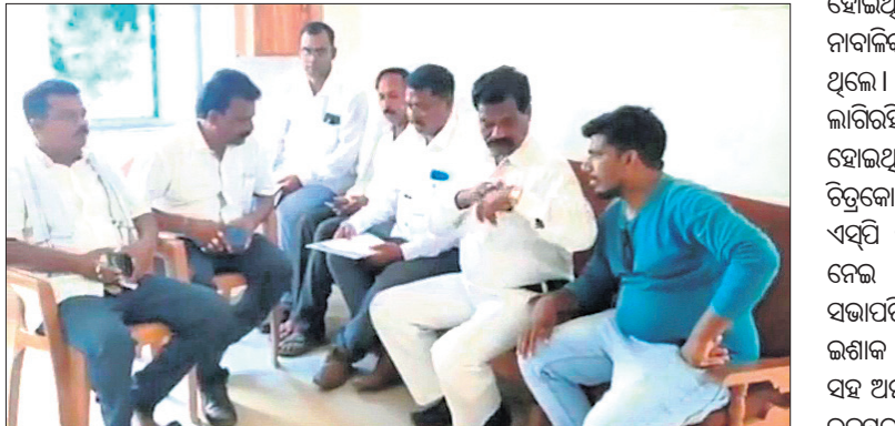
ଏସ୍ପିଙ୍କୁ ଭେଟିବାକୁ ଆସିଥିବା କଂଗ୍ରେସ କର୍ମକର୍ତ୍ତା।