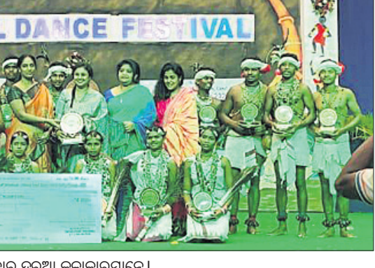
ମହୋତ୍ସବରେ ସାମିଲ ହୋଇଥିବା ବୈପାରିଗୁଡ଼ାର ଦୁରୁଆ କଳାକାରମାନେ।

ପୁରସ୍କାର ବାବଦରେ ୧ ଲକ୍ଷ ଟଙ୍କା ଦ୍ୱିତୀୟ ପୁରସ୍କାର ବାବଦରେ ୭୫ ହଜାର ଟଙ୍କା ଓ ତୃତୀୟ ପୁରସ୍କାର ୫୦ ହଜାର ଟଙ୍କା ପ୍ରଦାନ କରାଯାଇ କୃତା ଦଳକୁ ବିଜୁ ପୁରସ୍କୃତ କରାଯାଇଥିଲା।