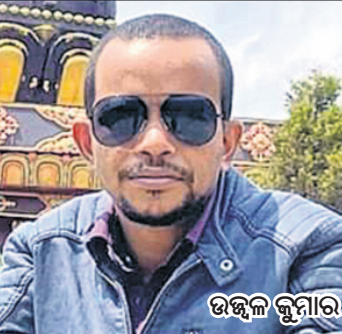
ସୁନ୍ଦରଗଡ଼, ୧୩୬ (ଡି.ଏନ୍.ଏ.)

୬ ମାସର ଦରମା ବିଲ୍ କରିଦେବାକୁ ୫ ହଜାର ଲାଞ୍ଚ ନେଉଥିଲେ