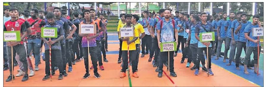
ଉତ୍ସାବୀ ସମାବେଶରେ ଅଂଶଗ୍ରହଣକାରୀ ଦଳ ଗୁଡ଼ିକର ପ୍ରତିଯୋଗୀମାନେ ।