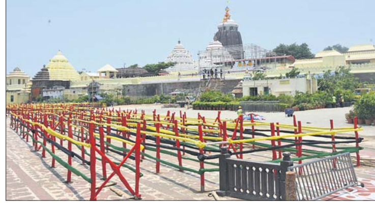
ପୁରୀ ଅଫିସ୍, ୧୩।୬

ହେବ ସ୍ନାନଯାତ୍ରା । ସ୍ନାନବେଦୀରେ ସ୍ନାନ କରି ମଙ୍ଗଳବାର ହାତୀବେଶରେ ଦର୍ଶନ ଦେବେ ଦାରୁଦିଆଁ । ଏଥିପାଇଁ ସଞ୍ଜ ନାଟିକାଳି ନିର୍ଦ୍ଦେଶ ହୋଇଛି । ରକ୍ତ ସିଂହାସନରେ ଚାରମାନ ବନ୍ଧା ସହ ଶ୍ରୀଅଙ୍ଗରେ ସେନାପତି ଓ ବାହୁଡ଼ା