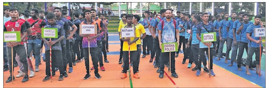
ଉଦ୍‌ଘାଟନୀ ସମାବେଶରେ ଅଂଶଗ୍ରହଣକାରୀ ଦଳ ଗୁଡ଼ିକର ପ୍ରତିଯୋଗୀମାନେ ।

ରଘୁଲପୁର, ୧୩୬ (ଡି.ଏନ.ଏ.): ଯାଜପୁର ଜିଲ୍ଲା ରଘୁଲପୁର ବ୍ଲକର ଖଣ୍ଡିତରଠାରେ ଯାଜପୁର କବାଡ଼ି ଆୟୋଜିତ ୬୭ତମ ସର୍ବଭାରତୀୟ କବାଡ଼ି ପ୍ରତିଯୋଗିତା ସୋମବାର ସଞ୍ଚାଳନାରେ ଉଦ୍‌ଘାଟିତ ହୋଇଯାଇଛି । ଯାଜପୁର ଏସ୍‌ପି ରାଘୁଲ ପି.ଆର୍. ପୁସ୍ତକାଳୟ ଆବେଦନ ଯୋଗଦେଇ