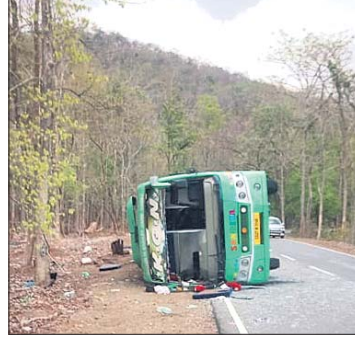
ରାସ୍ତା ପାର୍ଶ୍ୱକୁ ଓଲଟି ପଡ଼ିଥିବା ବସ୍