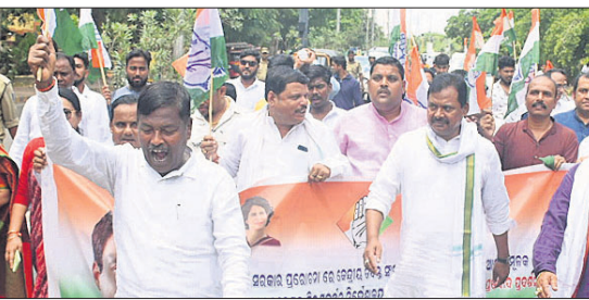
ଭୁବନେଶ୍ୱର ଇଡି କାର୍ଯ୍ୟାଳୟ ସମ୍ମୁଖରେ କଂଗ୍ରେସର ପ୍ରତିବାଦ।

ଆନ୍ଦୋଳନ କରାଯାଇଛି। ଯୋଗ୍ୟତା ବିଜୁ ମ କେଶରୀ ଆରୁଖ ନିର୍ବାଚିତ ହେବା ପରେ ପୁଣ୍ୟମନ୍ତ୍ରୀ ନରସିଂହ ମିଶ୍ର ଓ ଅନ୍ୟମାନେ ତାଙ୍କୁ ସ୍ୱାଗତ କରୁଛନ୍ତି। ଆନ୍ଦୋଳନ କରାଯାଇଛି। ଯୋଗ୍ୟତା ବିଜୁ ମ କେଶରୀ ଆରୁଖ ନିର୍ବାଚିତ ହେବା ପରେ ପୁଣ୍ୟମନ୍ତ୍ରୀ ନରସିଂହ ମିଶ୍ର ଓ ଅନ୍ୟମାନେ ତାଙ୍କୁ ସ୍ୱାଗତ କରୁଛନ୍ତି।