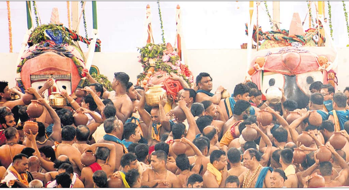
ମଙ୍ଗଳବାର ଦେବସ୍ନାନ ପୂର୍ଣ୍ଣିମା ଅବସରରେ ପୁରୀ ଶ୍ରୀମନ୍ଦିର ସ୍ନାନବେଦୀରେ ବାବୁଦିଆଁଙ୍କ ଦିବ୍ୟସ୍ନାନ । (ଲିପୋଟ: ପୃଷ୍ଠା-୩)