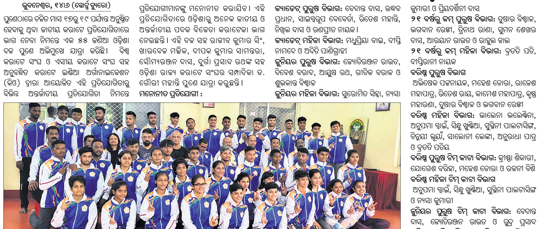
ଓଡ଼ିଶା କରାଟେ ଦଳ।