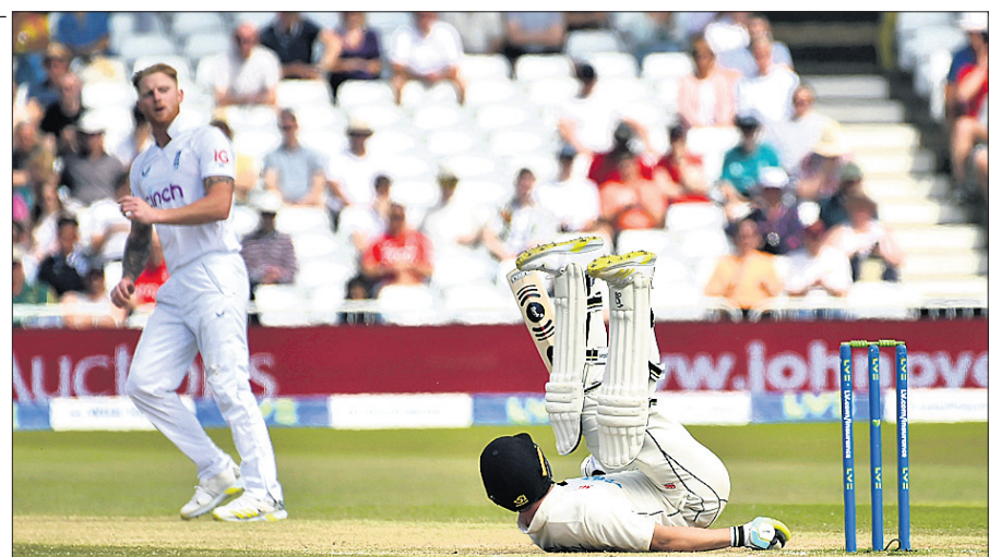
ଟ୍ରେଣ୍ଡିଂ ଟ୍ରିପ୍ରେ ଅନୁଷ୍ଠିତ ଦ୍ୱିତୀୟ ଦିନରେ ଇଂଲଣ୍ଡ ଅଧିନାୟକ ବେନ୍ ଷ୍ଟୋକ୍ସଙ୍କ ଏକ ରାଇଟ୍ ଟେଲିକାମ୍ରେ ଏହା ଘଟଣା ଘଟିଥିଲା।

କ୍ୟାରିୟରର ପ୍ରଥମ ଅର୍ଦ୍ଧଶତକ। ଏହା ପାଇଁ ଟାଇମ୍ ଅଟକିବା ଯୋଗୁ ୨୦ ମ୍ୟାଚ୍ରେ ଟିମ୍ ଲଢ଼ିଆ ଚ୍ୟାଲେଞ୍ଜିଂ ଚାରିଠି ଛିଡ଼ା କରିପାରିବ।