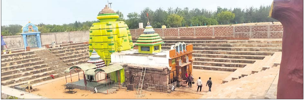
ବାବା ବଟେଶ୍ୱର ଶୈବପୀଠ।