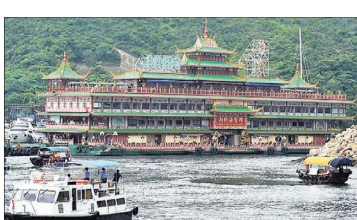
କିରୋନା ମହାମାରୀର ଶିକାର