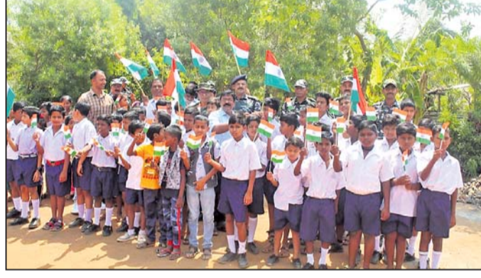
ଛାତ୍ରମାନଙ୍କ ତ୍ରିରଙ୍ଗା ପ୍ରଦର୍ଶନ।