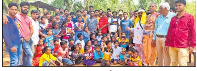
ଛାତ୍ରା ଛାତ୍ରୀଙ୍କୁ ପାଠ୍ୟ ଉପକରଣ ପ୍ରଦାନ କରାଯାଇଛି।