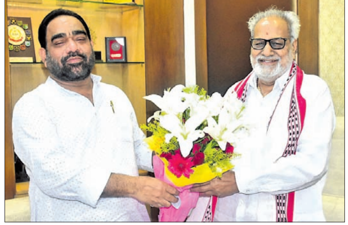
ରାଜଭବନରେ ରୁଧିରା ରାଜ୍ୟପାଳ ପ୍ରଫେସର ଗଣେଶୀ ଲାଲଙ୍କୁ ସାକ୍ଷାତ କରୁଛନ୍ତି ନବନିର୍ବାଚିତ ବାଚସ୍ପତି ବିକ୍ରମ କେଶରୀ ଆରୁଖ।

ମନ୍ତ୍ରୀ ଅଧିକ ଶାହାଙ୍କୁ ସାକ୍ଷାତ କରିଥିଲେ। ତେବେ ସେ ସମୟରେ ରାଷ୍ଟ୍ରପତି ନିର୍ବାଚନ ସମ୍ପର୍କରେ କୌଣସି ଆଲୋଚନା ହୋଇ ନ ଥିବା ନବୀନ ରାମନାଥଙ୍କୁ କହିଥିଲେ। ବିଜେଡି ରାଷ୍ଟ୍ରପତି ନିର୍ବାଚନରେ ପ୍ରତ୍ୟେକ ଦଳଠାରୁ ସମ୍ପର୍କରେ ବକାୟ ରଖି ଆସିଛି। ନିର୍ବାଚନ ଆସିଲେ ପ୍ରାର୍ଥୀଙ୍କୁ ବେଶ୍ ନିଷ୍ପତ୍ତି ନିଆଯିବ ବୋଲି ବିଜେଡି ସଭାପତି ରାମନାଥଙ୍କୁ ପୂର୍ବରୁ କହି ଆସିଛନ୍ତି। ଅନ୍ୟପକ୍ଷରେ ବିଜେଡିକୁ ବିରୋଧୀ ଦଳ ବିଜେଡି ସୁପ୍ରିମୋ ନବୀନ ନୁଆଦିଲ୍ଲୀଠାରେ ନ ଥିବା ଜଣାପଡ଼ିଛି। ଏନ୍ଡିଏ ପକ୍ଷରୁ