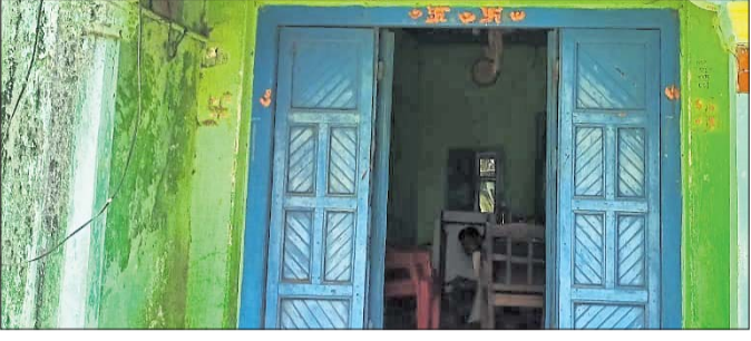
ଭଡ଼ାରେ ଚାଲିଥିବା ଛତ୍ରପୁର କାର୍ଯ୍ୟାଳୟ।

ବଟକରାରେ ମାପ ଓ ଓଜନ ବିଭାଗର ସିଲ୍ ରହିବା ବ୍ୟତୀତ ଯାଞ୍ଚ ହୋଇଥିଲେ ବି ବ୍ୟବସାୟୀମାନେ ଏହା ମାନ୍ୟତା ଦେଇ ନାହାନ୍ତି।