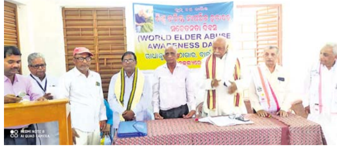
ବୈଠକରେ ଉପସ୍ଥିତ କର୍ମକର୍ତ୍ତା।