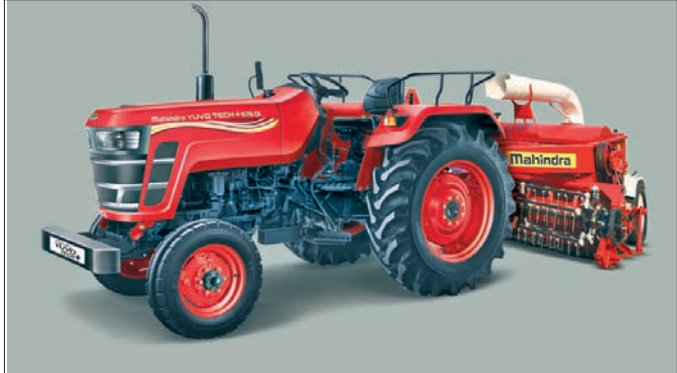
ପ୍ରମୁଖ ପିଟର ଯଥା ୪-ସିଲିଣ୍ଡର ଟ୍ରାକ୍ଟର, ଟୁଆଇଲ୍ କ୍ଲବ୍, ସ୍ପ୍ରିଙ୍ଗ୍, ଅର୍ବିକ୍ସ ଆରି ଭାଇକ୍ ଓ ୨-ସିଲିଣ୍ଡର ପିଟିଓ ସହ ଆସୁଛି ଯାହା ଏହାକୁ ୩୦ରୁ ଅଧିକ କୃଷି ପରିଚାଳନା ପାଇଁ ଉପଯୁକ୍ତ କରୁଛି।

ମହିନ୍ଦ୍ରା ଟ୍ରାକ୍ଟର ପକ୍ଷରୁ ନିକଟରେ ଶୁଭାରମ୍ଭ କରାଯାଇଥିବା ଯୁକ୍ତ ଟେକ୍-ଟ୍ରାକ୍ଟର ଅଧୀନରେ ୬ ନୂଆ ଟ୍ରାକ୍ଟର ମଡେଲର ଉନ୍ମୋଚନ କରାଯାଇଛି। ଫଳରେ କମ୍ପାନୀ ଗତବର୍ଷ ଉନ୍ମୋଚନ କରିଥିବା ଟ୍ରାକ୍ଟର ପୁରୁଷକୁ ଅଧିକ ସୁଦୃଢ଼ କରୁଛି।