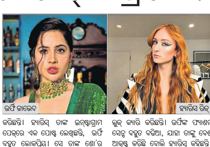
ଉର୍ପି ଜାଭେଦ ହ୍ୟାରିସ୍କ

ମୁମ୍ବାଇ: ଭାରତୀୟ ଚଳିତ ଅଭିନେତ୍ରୀ ଉର୍ପି ଜାଭେଦ ତାଙ୍କ ଡ୍ରେସିଂ ସେକ୍ସୁଆଲ ନେଇ ଅନେକ ସମୟରେ ଟ୍ରୋଲ ହୋଇଆସିଛି। ତାଙ୍କର ଫ୍ୟାଶନ୍ ସେକ୍ସୁଆଲ ଅନେକେ ଅକ୍ଷୟ ବୋଲି ବିବେଚନା କରିଆସିଛି।