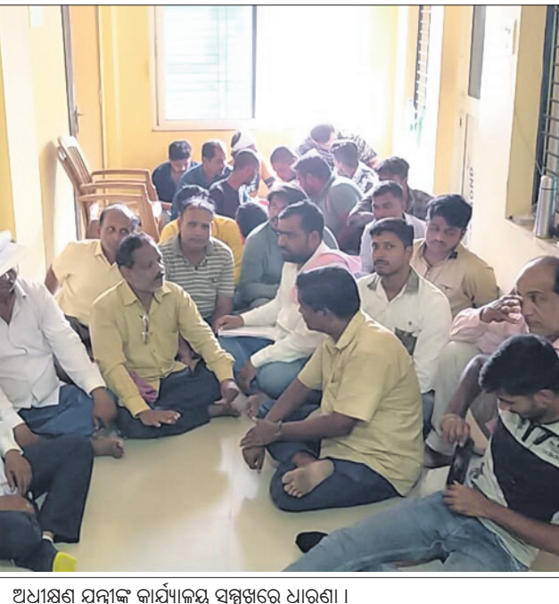
ଅଧ୍ୟକ୍ଷ ଯନ୍ତ୍ରୀଙ୍କ କାର୍ଯ୍ୟକ୍ରମ ସମ୍ମୁଖରେ ଧାରଣା।

ଗୋଷ୍ଠୀଗୀନୁଆଁ ମୁଖ୍ୟ ରାସ୍ତା ମରାମତି ଦାବିରେ ଉପରୋକ୍ତ ବିଭାଗ ପରିଦର୍ଶନ କରି ତଥ୍ୟ ସଂଗ୍ରହ କରିବା ପାଇଁ ବିଭାଗ ସ୍ତରୀୟ ସମୀକ୍ଷା କମିଟି ଗଠନ କରାଯାଇଛି।