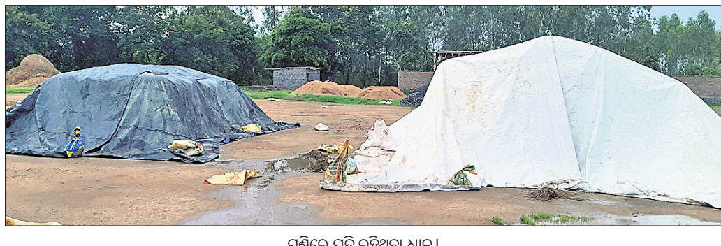
ମଞ୍ଜିରେ ପଡ଼ି ରହିଥିବା ଧାନ ।

କୋରାପୁଟ ଜିଲ୍ଲା କୁନ୍ଦୁରା ବ୍ଲକ୍ରେ ରହିଥିବା ବିକ୍ରି କରିବା ନେଇ ମଞ୍ଜି ଆରମ୍ଭ ହୋଇଛି। ଅଧିକ ଧାନ ବିକ୍ରିରେ ବାଧ୍ୟକ ମିଲର୍ସ ଏବଂ ପ୍ରଶାସନ ସରକାରୀ ନିୟମ ଅନୁସାରେ