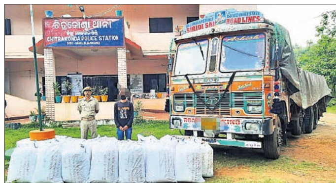
ଜବତ ହୋଇଥିବା ଲୁଣ ବୋଝେଇ ଗଞ୍ଜେଇ ଟ୍ରକ୍ ।