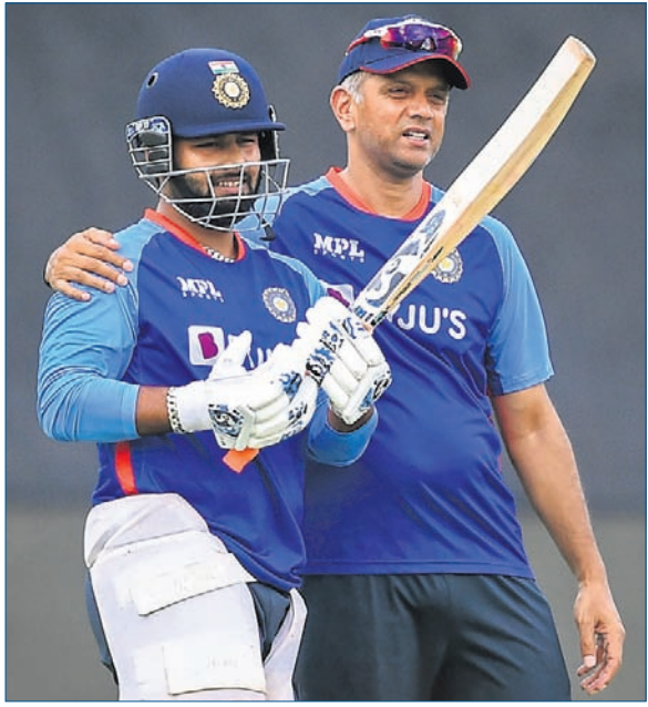
କୋର୍ ରାହୁଲ ଦ୍ରାଭିଡ଼ଙ୍କ ସହ ରିଷଭ ପନ୍ତ (ବାମ)।

କରିଥିଲେ। ଫଳରେ ଅଷ୍ଟ୍ରେଲିଆରେ ଆସିବାପର୍ଯ୍ୟନ୍ତ ହେବାକୁଥିବା ଟି-୨୦ ବିଶ୍ୱକପ ସମେତ ଦୀର୍ଘକାଳୀନ ଭିତ୍ତିରେ ଭାରତର ରିଜର୍ଭ ଓପନର ପାଇଁ ଏ ଦୁହେଁ ଦାବିଦାର ହୋଇଛନ୍ତି। ନିୟମିତ ଓପନମାନେ ଦଳକୁ ଫେରିବା ପୂର୍ବରୁ ଏ ଦୁହେଁ ପରବର୍ତ୍ତୀ ୨ଟି ମ୍ୟାଚ ଏବଂ ଆୟତ୍ତର ଗ୍ରହଣ