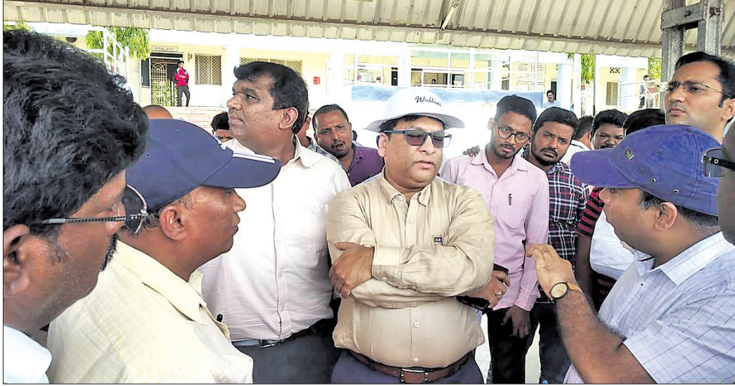
ଡିଆର୍ଏମ୍ ସହ ଉପକ୍ରମାପାଳ ଆଲୋଚନା କରୁଛନ୍ତି ।

ବହୁ ପ୍ରକାଶିତ କନ୍ଧପୁର-ନବରଙ୍ଗପୁର ଏବଂ କନ୍ଧପୁର-ମାଲକାନଗିରିରେ ଲମ୍ବ ପ୍ରକଳ୍ପ ହେବା ନେଇ ଆଶା ରଖାଯାଇଛି। ଏହି ଦୁଇ ରେଳ ପ୍ରକଳ୍ପ ପାଇଁ ରାଜ୍ୟ ସରକାର ସମସ୍ତ ଭିତ୍ତିଭୂମି ଯୋଗାଇବାକୁ ଯୋଷଣା କରିବା ପରେ ଜମି ଅଧିଗ୍ରହଣ କାର୍ଯ୍ୟ ଆରମ୍ଭ ହୋଇଛି।