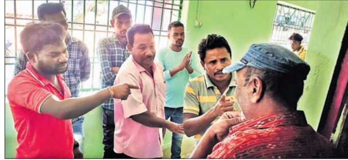
ଗ୍ରାମବାସୀ ପଞ୍ଚାୟତ କାର୍ଯ୍ୟାଳୟ ଘେରାଇ କରୁଛନ୍ତି ।