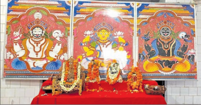
ପୂଜା ପାଉଥିବା ପଞ୍ଚରତ୍ନ ।

ଜଳରେ ସ୍ନାନକରି କ୍ରମେ ଆକ୍ରାନ୍ତ ହୋଇ ଏବେ ଅଣସର ଘରେ ଅଛନ୍ତି ତିନିଠାକୁର। କୋରାପୁଟ ଶାବର