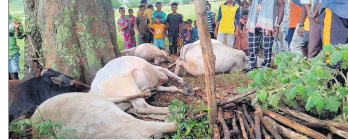
ବଜ୍ରପାତରେ ମୃତ ବଳଦ ଓ ଗାଈ।

ଆର.ଉଦୟଗିରି, ୧୬୬୬ (ଡି.ଏନ.ଏ.): ଆର.ଉଦୟଗିରି ବୁକ୍ ଅନ୍ତରାଳ ପଞ୍ଚାୟତ ଅନ୍ତର୍ଗତ ହାଟିପଲ୍ଲୀ ଗ୍ରାମ ନିକଟରେ