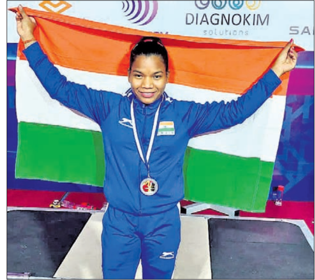
ନାଗୋଡ଼ା ବାଗୁଝାନ (ହିମାଚଳ ପ୍ରଦେଶ), ୧୬।୬ (ପି.ଟି.)

ବୋଲିଂରେ ବିବିଧତା ଆଣି ୪ ଉଇକେଟ୍ ସଫଳତା ପାଇଥିଲେ। ଅନ୍ୟପକ୍ଷରେ ଦକ୍ଷିଣ ଆଫ୍ରିକା ଆଗାମୀ ମ୍ୟାଚ ଜିତି ସିରିଜ ବିଜୟ ଲାଭ୍ୟରେ ରହିଛି। ତାରକା ବ୍ୟାଟର କ୍ୱିଣ୍ଟନ ଡି'କକ୍ ଆହତ ସମସ୍ୟାରୁ ମୁକ୍ତଲିଲେ ଅଧିନାୟକ ଚେମ୍ସ ବକ୍ସିଂଗ୍ ସହ ଇନିଂସ ଓପନ କରିବେ। ପ୍ରଥମ ୨ଟି ମ୍ୟାଚରେ ଆଧିପତ୍ୟ ବିସ୍ତାର କରି ଖେଳିବା ପରେ ତୃତୀୟ ମ୍ୟାଚରେ ଏହି ଦଳ ଖୁସିଥିଲା। ବଲ୍ରେ ମିଶ୍ରିତ ପ୍ରଦର୍ଶନ ଦେଇଥିବାବେଳେ ବ୍ୟାଟିଂରେ ବିଫଳ ହୋଇଥିଲା। ଦୁଇ ସ୍କିନର ଚାକ୍ରାକର୍ ଶାମ୍ସି ଓ କେଶବ ମହାରାଜ ଓଭରପିଛା ୧୦ରୁ ଅଧିକ ରନ ବ୍ୟୟ କରିଥିଲେ। କାରିଶୋ ରାବାଡ଼ା ସବୁଠାରୁ ପ୍ରଭାବୀ ରହିଛନ୍ତି। ତେଣୁ ଘରୋଇ ଦଳର ବ୍ୟାଟରମାନେ ତାଙ୍କୁ ସମ୍ମାନ ଦେବା ସହ ରିସ୍ ଦେବାକୁ ଚାହୁଁନାହାନ୍ତି। ତାଙ୍କୁ ଛାଡ଼ିଦେଇ ଅନ୍ୟ ବୋଲରଙ୍କୁ ଚାରେଟ୍ କରୁଛନ୍ତି।