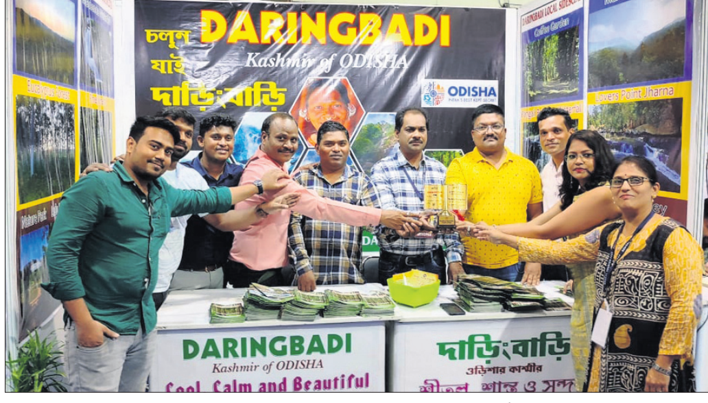
ମେଳାରେ ଯୋଗଦେଇଥିବା ହୋଟେଲ ସଂଘ ସଦସ୍ୟମାନେ।

କନ୍ୟାମାଳ ଜିଲ୍ଲା ଦାରିଙ୍ଗବାଡ଼ି ହୋଟେଲ ସଂଘ କୋଲକାତାଠାରେ ଆୟୋଜିତ ୩ ଦିନିଆ ପର୍ଯ୍ୟଟନ ମେଳାରେ ଯୋଗଦେଇ ପୋଲିସ୍ ଉପସ୍ଥାପନ କରାଯାଇଛି।