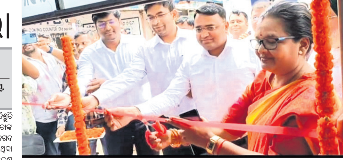
ଅଭିଯୁକ୍ତ ଦ୍ଵାରା ଉଦ୍ଘାଟିତ ମେଣିନ।

କବିସୂର୍ଯ୍ୟନଗରରୁ ପ୍ରଦୀପ ଗିରଫ କରିବା ପାଇଁ ଉପରୋକ୍ତ ବିଭାଗ ପରିଦର୍ଶନ କରି ତଥ୍ୟ ସଂଗ୍ରହ କରିବା ପାଇଁ ବିଭାଗ ସ୍ତରୀୟ ସମୀକ୍ଷା କମିଟି ଗଠନ କରାଯାଇଛି।