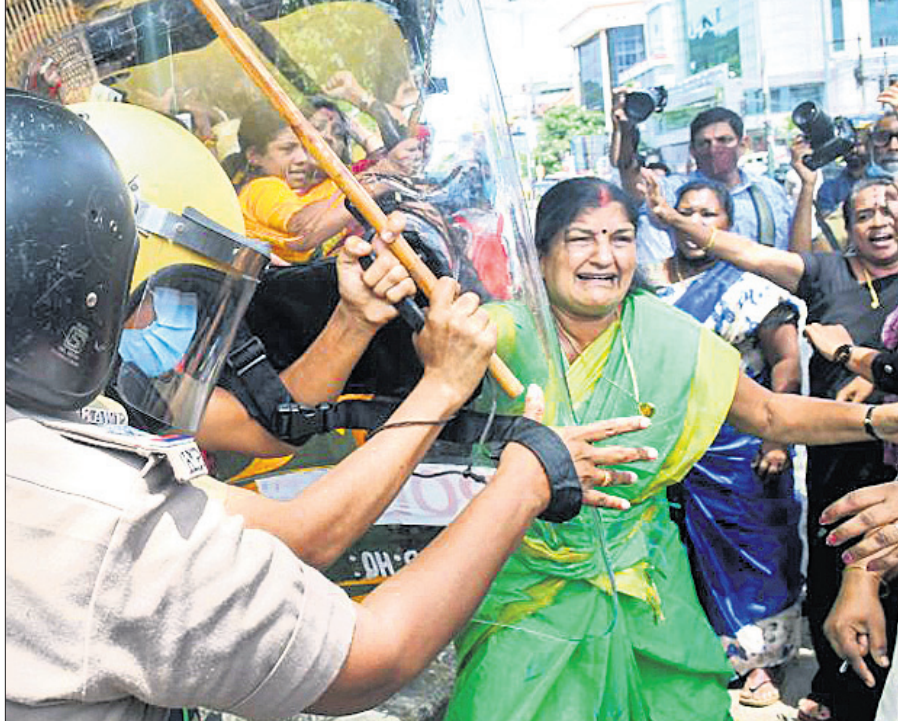
କେବଳ ସୁନା ଚାଲାଇ ମାମଲାରେ ପୁଞ୍ଜୀମନ୍ତ୍ରୀ ପିନାରାୟୀ ବିକାଶନକ ଉତ୍ସାହୀ ଦାବିରେ ଥିଲୁ ଭାନୁଜୟରାଜୁ ମାତ୍ର। ବିରୋଧକରିବା ଭାଜପା ମହିଳା ମୋକ୍ତା ଜଣେ କର୍ମୀଙ୍କୁ ଲାଠିମାର କରି ଉଠାଇ ନେଇଛି ପୋଲିସ୍ ।

ରାଷ୍ଟ୍ରପତି ନିର୍ବାଚନକୁ ନେଇ ଦେଶର ରାଜନୀତି ସରଗରମ ରହିଛି। ଭାଜପା ପ୍ରାର୍ଥୀ ଦେବାକୁ ଏକ ପ୍ରକାର ପ୍ରଭୃତ ଥିବାବେଳେ ବିରୋଧୀ ମିଳିତ ଭାବେ ପ୍ରାର୍ଥୀ ଦେବାକୁ ସଜବାଜ ହେଉଛି। ବିରୋଧୀଙ୍କ ପକ୍ଷରୁ ଏମ୍ପି ପୁପ୍ରିମୋ ଶରଦ ପାଣ୍ଡାର ପ୍ରାର୍ଥୀ ହେବେ ବୋଲି ଚର୍ଚ୍ଚା ହେଉଛି। ଯଦି ଶରଦ ପ୍ରାର୍ଥୀ ହେବାକୁ ରୋକାକୋକ ମନା କରିଦେଇଛନ୍ତି, କିନ୍ତୁ ତାଙ୍କୁ ବୁଝାଇବା ପାଇଁ ତେଣୁ ଚାଲିଛି। ତେବେ ଏସବୁ ଭିତରେ ଭାଜପା ଏମ୍ପି ଦିଲୀପ ଘୋଷ ଶରଦ ପାଣ୍ଡାରଙ୍କ ପାଞ୍ଚାରି ଘୋଷ ଦେଇଥିଲେ।