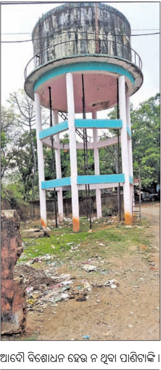
ଆବୈ ବିଶେଷଣ ହେଉ ନ ଥିବା ପାଣିଟାଙ୍କି ।

୧୦ହଜାରରୁ ଊର୍ଦ୍ଧ୍ୱ ଲୋକ ବସବାସ କରୁଥିବା ବୈପାରିଗୁଡ଼ା ବ୍ଲକ୍ ସଦର ମହକୁମାର ପରିବେଶ ପ୍ରତି ଆକ୍ରମଣ କରାଯାଇନାହିଁ।