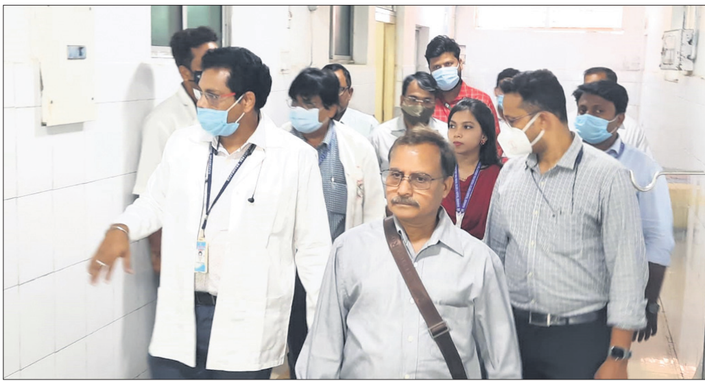
ଏମକେସିଜି ପରିଦର୍ଶନ କରୁଥିବା ସତ୍ତା ସୁରକ୍ଷା ଟିମ୍।

ସୁପ୍ରିମକୋର୍ଟଙ୍କ ଦ୍ଵାରା ନିୟୁତ୍ତି ସତ୍ତା ଲାଭ କରିବା ପାଇଁ ଉପରୋକ୍ତ ବିଭାଗ ପରିଦର୍ଶନ କରି ତଥ୍ୟ ସଂଗ୍ରହ କରିବା ପାଇଁ ବିଭାଗ ସ୍ତରୀୟ ସମୀକ୍ଷା କମିଟି ଗଠନ କରାଯାଇଛି।