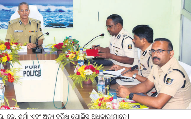
ବୈଠକରେ ଅତିରିକ୍ତ ପୋଲିସ ମହାନିର୍ଦ୍ଦେଶକ ଆର୍. କେ. ଶର୍ମା ଏବଂ ଅନ୍ୟ ବରିଷ୍ଠ ପୋଲିସ ଅଧିକାରୀମାନେ।