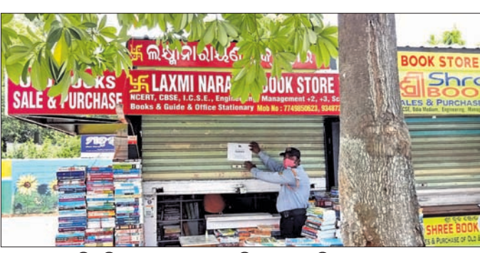
ଭୁବନେଶ୍ୱର ମାଷ୍ଟରକ୍ୟାଣ୍ଟିନ ନିକଟରେ ଥିବା ବୁକ୍‌ସ୍ଟୋରକୁ ସିଲ୍ କରାଯାଇଛି।

ଭୁବନେଶ୍ୱର, ୧୬।୬ (ବୁଧବୋ): ନିୟମ ଭଙ୍ଗଘଟଣା ନେଇ ଭୁବନେଶ୍ୱର ସ୍ଥାନୀୟ ଲିମିଟେଡ୍ (ବିଏସ୍‌ସିଏଲ୍) ପକ୍ଷରୁ ୧୦ କିଓସ୍କ ଉପରେ ଗୁରୁବାର କାର୍ଯ୍ୟାନୁଷ୍ଠାନ ହୋଇଛି। ମାଷ୍ଟରକ୍ୟାଣ୍ଟିନ ଛକଠାରୁ ପଞ୍ଚାଳୟ ବୁକ୍‌ସ୍ଟୋର ପର୍ଯ୍ୟନ୍ତ ୭ଟି ଏବଂ କେନ୍ଦ୍ରୀୟ ବିଦ୍ୟାଳୟ ନିକଟରେ ଥିବା ୩ଟି ବୁକ୍ ଷ୍ଟୋରକୁ ଅନିର୍ଦ୍ଧିଷ୍ଟକାଳ ପାଇଁ ସିଲ୍ କରାଯାଇଛି। ସମ୍ପୃକ୍ତ ଦୋକାନୀମାନେ ପୂର୍ବରୁ ଛୋଟ ଛୋଟ କ୍ୟାବିନରେ ବହି ବିକ୍ରୟ କରି ଆସୁଥିଲେ। ବିଏସ୍‌ସିଏଲ୍ ପକ୍ଷରୁ ସେମାନଙ୍କ ପାଇଁ କିଓସ୍କ ସହ ଆନୁଷ୍ଠାନିକ ସେବା ଚଳାଇଛି।