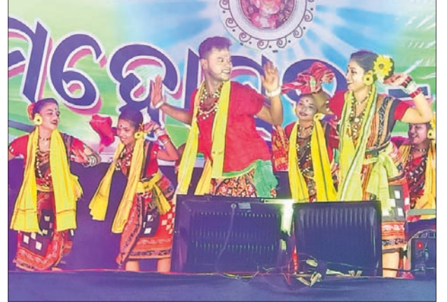
ରଜ ମହୋତ୍ସବରେ କଳାକାରମାନେ ନୃତ୍ୟ ପରିବେଷଣ କରୁଛନ୍ତି।