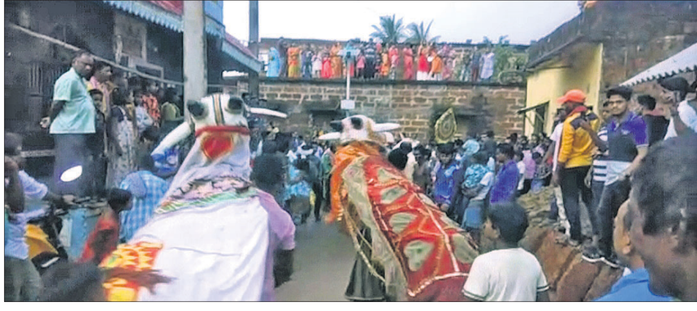
କୋଶଳାଶୁଣୀ ପୀଠରେ ରଜ ମହୋତ୍ସବରେ ଯୋଡ଼ାନାଚ ପରିବେଷଣ ହେଉଛି।

କୋଶଳାଶୁଣୀ ପୀଠରେ ରଜ ମହୋତ୍ସବରେ ଯୋଡ଼ାନାଚ ପରିବେଷଣ ହେଉଛି। ଖୋର୍ଦ୍ଧା ଜିଲ୍ଲା ବୋଲିଗଡ଼ ବ୍ଲକ୍ ବୋଲିଗଡ଼, ଆରିକମା, ସଂପୁର, କପାସିଆ ଅଧରଳା ଆଦି ଗ୍ରାମରେ ଯାତ୍ରା, ନାଚକ ଓ ବିଭିନ୍ନ ଖେଳ ପ୍ରତିଯୋଗିତା ସହ ସାଂସ୍କୃତିକ ଦୋଳିର ବ୍ୟବସ୍ଥା କରାଯାଇଛି। ତେବେ ଆରିକମା ନିକଟ ଘଣ୍ଟ ଶାଳ ଜଙ୍ଗଲ ମଧ୍ୟରେ ଅବସ୍ଥିତ ମା' କୋଶଳାଶୁଣୀ ପୀଠରେ ରଜ ଯାତ୍ରା ଭିକ୍ଷୁରଣରେ ପାଳିତ ହୋଇଯାଇଛି। ସାଧାରଣତଃ ସଂକ୍ରାନ୍ତି ଦିନରେ ଆମିଷ ଭକ୍ଷଣ ବାରଣ ହୋଇଥିବାବେଳେ ଏଠାରେ କିଛି ରଜ ଉତ୍ସବ ପାଳିତ ହୋଇଥିଲା।