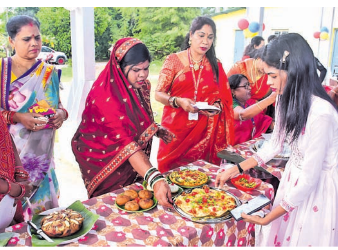
ଭୁବନେଶ୍ୱରର ସତ୍ୟନଗର କେଡିଏ ଫୋରମ୍ ପକ୍ଷରୁ ଗୁରୁବାର ଶେଷ ରକରେ ଆୟୋଜିତ ରକ ପ୍ରତିଯୋଗିତାରେ ଭାଗ ନେଇଥିବା ମହିଳାମାନେ।