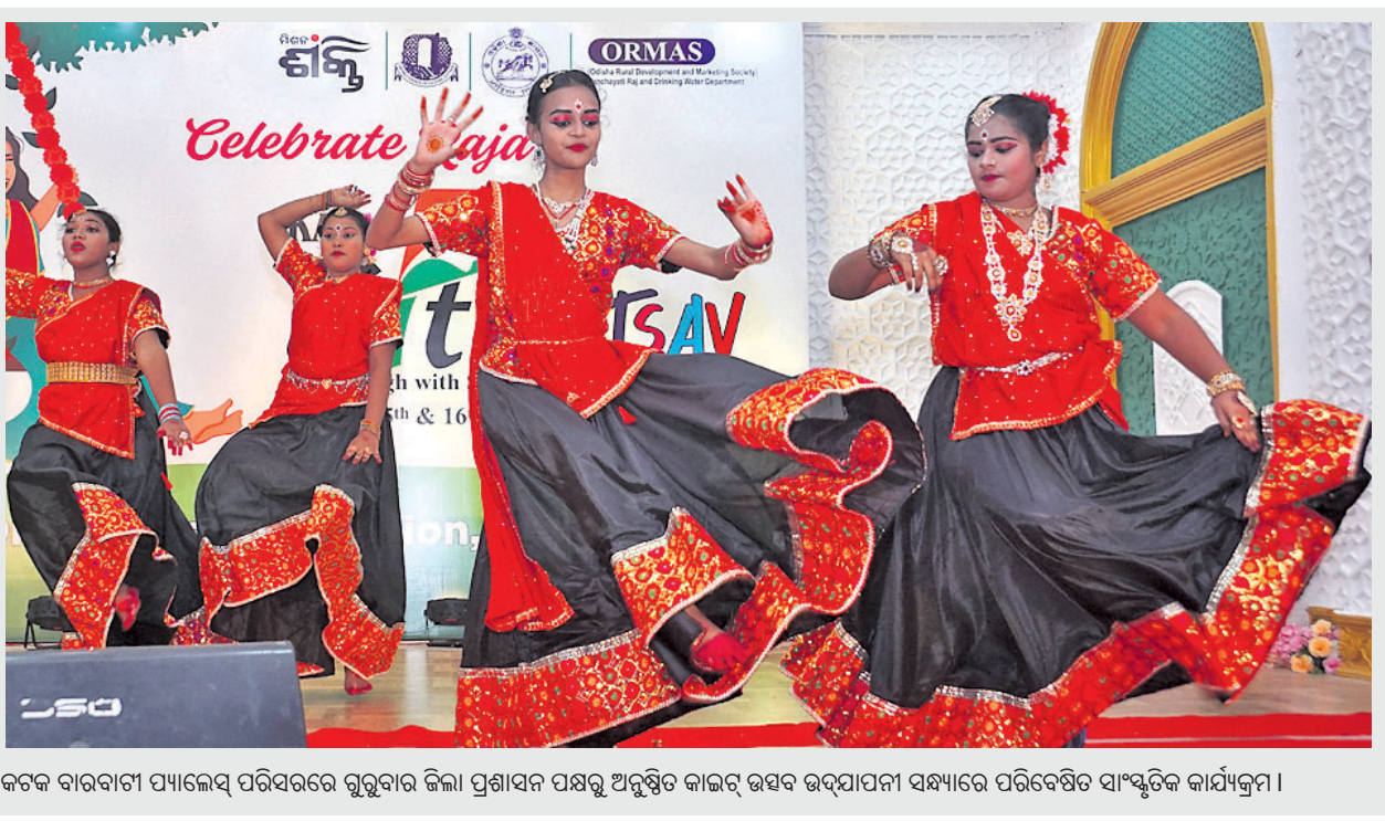
କଟକ ବାରବାଟୀ ପ୍ୟାଲେସ ପରିସରରେ ଗୁରୁବାର ଜିଲା ପ୍ରଶାସନ ପକ୍ଷରୁ ଅନୁଷ୍ଠିତ କାଇଟ୍ ଉତ୍ସବ ଉତ୍ସାହପୂର୍ଣ୍ଣ ସନ୍ଧ୍ୟାରେ ପରିବେଷିତ ସାଂସ୍କୃତିକ କାର୍ଯ୍ୟକ୍ରମ।