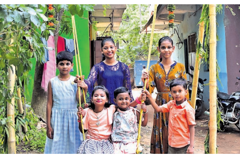
ରସୁଲଗଡ଼ ବିଜିପି କଲୋନୀରେ ଛୋଟ ପିଲାମାନେ ରକ ବୋଲିର ମଜା ନେଉଛନ୍ତି।