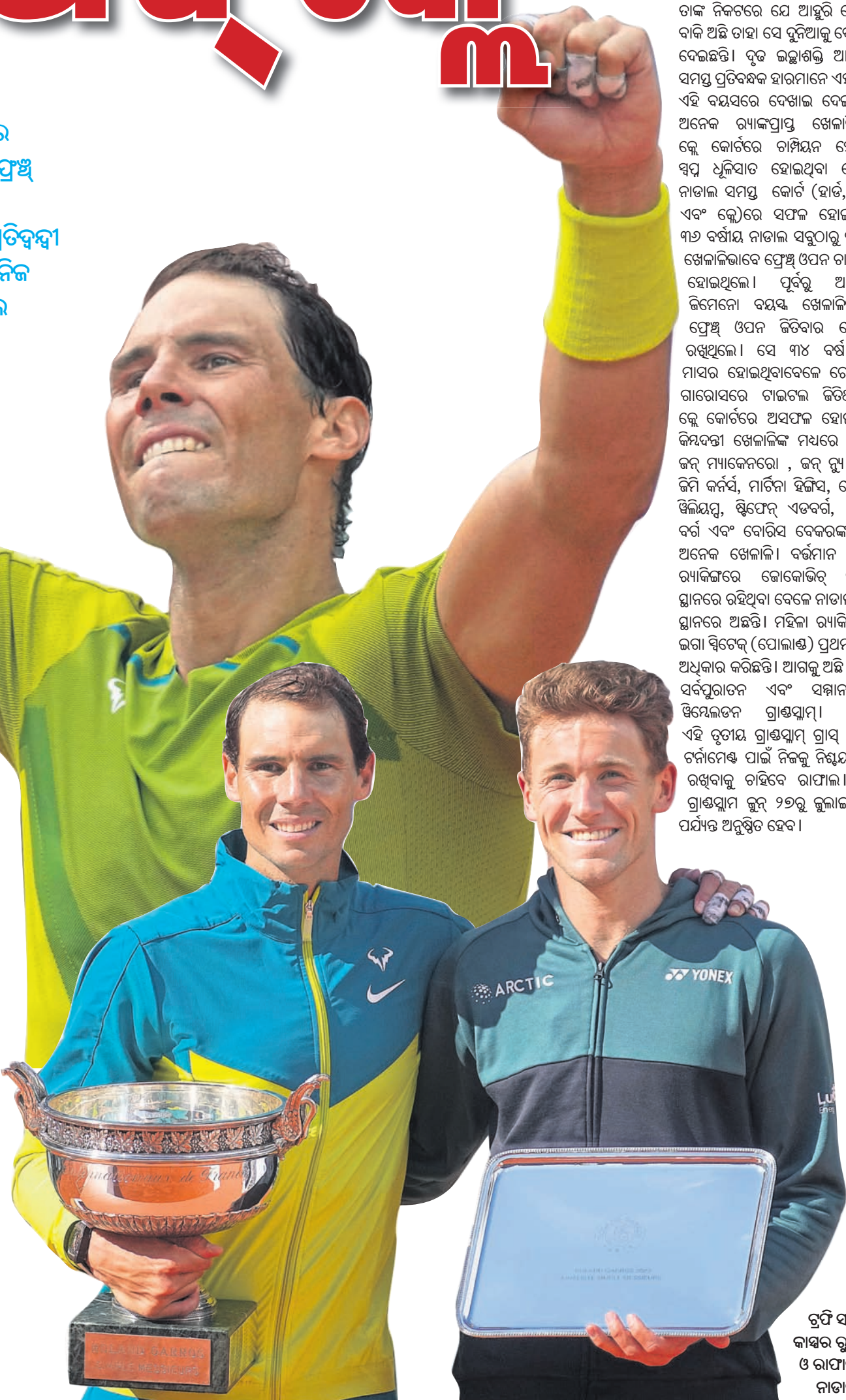
ଟ୍ରଫି ସହ କାସ୍ପର ରୁଡ୍ ଓ ରାଫାଲ ନାଡାଲ

ରେକର୍ଡ ସହ ସମକକ୍ଷ ହୋଇଛନ୍ତି ଏବଂ କ୍ରମାନ୍ୱୟରେ ୬ଷ୍ଠ ଡବ୍ଲୁଡବ୍ଲୁ ଟାଇଟଲ ହାସଲ କରିଛନ୍ତି। ସମ୍ପୂର୍ଣ୍ଣ କ୍ୟାରିୟରରେ ଆଧିପତ୍ୟ ବିସ୍ତାର କରିଥିବା ସ୍ୱିଡେନ ମାଡ୍ର ୬୮ ମିନିଟ୍ରେ ଫାଇନାଲ ଜିତିଥିଲେ। ଅନ୍ୟ ପକ୍ଷରେ ନାଡାଲ ୩୬ବର୍ଷ ବୟସରେ ନରୱେର କାସ୍ପର ରୁଡ୍‌କ୍ଲ୍ ହରାଇ ଲାଇମାଟିର ବାଦଶାହା ରୁପେ ନିଜର ଅପ୍ରତିଦ୍ୱନ୍ଦ୍ୱୀ ପ୍ରତିଷ୍ଠାକୁ ବଜାୟ ରଖିଛନ୍ତି। କ୍ୟାରିୟର ୧୪ ତମ ଫ୍ରେଞ୍ଚ୍ ଓପନ ସହ ଗ୍ରାଣ୍ଡସ୍ଲାମ ଟାଇଟଲ ସଂଖ୍ୟାକୁ ୨୨କୁ ବୃଦ୍ଧି କରି ରେକର୍ଡ କରିଛନ୍ତି। ଫ୍ରେଞ୍ଚ୍ ଓପନ ଆରମ୍ଭ ପୂର୍ବରୁ ବେଶ୍ ଭାଙ୍ଗିପଡିଥିଲେ ନାଡାଲ। କାରଣ ଏକାଧିକ ଆଘାତ ସମସ୍ୟା ଯୋଗୁ ହତୋତ୍ସାହିତ ହୋଇପଡିଥିଲେ। ଆଶା କରୁଥିଲେ ଫାଇନାଲରେ ନୋଭାକ ଜୋକୋଭିଚ୍ ସହ ମୁକାବିଲା ହେବ। ମାତ୍ର ଏଥର କ୍ୱାର୍ଟର ଫାଇନାଲରେ ଜୋକୋଭିଚ୍ ସହ ମୁକାବିଲା ହୋଇଥିଲା ଏବଂ ସର୍ବାଧିକ ପ୍ରତିଦ୍ୱନ୍ଦ୍ୱୀ ହରାଇ ନିଜର ଆଭିମୁଖ୍ୟ ସ୍ପଷ୍ଟ କରିଥିଲେ କିଙ୍ଗ୍ ଅଫ୍ କ୍ଲେ। ୨୦୦୫, ୨୦୦୬, ୨୦୦୭, ୨୦୦୮ କ୍ରମାଗତ ଭାବେ ଗାମ୍ବିୟନ ହେବା ସହ ୨୦୧୦ରୁ ୨୦୧୪ କ୍ରମାଗତ ୫ବର୍ଷ ଧରି ନିଜର ଆଧିପତ୍ୟ ବିସ୍ତାର କରିଥିଲେ। ସେହିପରି ୨୦୧୭ରୁ ୨୦୨୦ ଏବଂ ୨୦୨୨ରେ ଗାମ୍ବିୟନ ହେବା ତାଙ୍କ ପାଇଁ ସହଜ କାର୍ଯ୍ୟ ନ ଥିଲା। ବର୍ଷର ପ୍ରଥମ ଗ୍ରାଣ୍ଡସ୍ଲାମ ଅଷ୍ଟ୍ରେଲିଆ