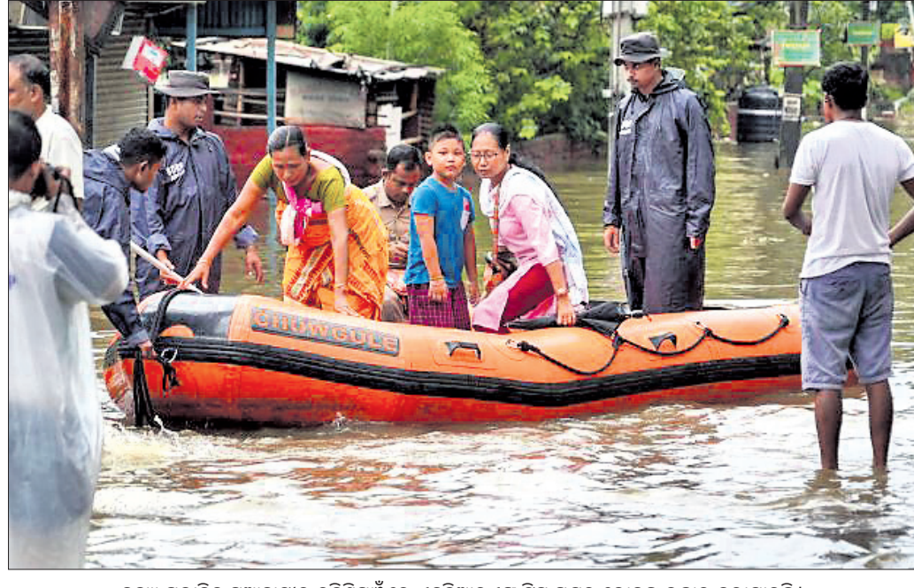
ବନ୍ୟା ପ୍ରଭାବିତ ଗୁଆହାଟୀର ବୁଲ୍‌ଡୋଜରରେ ଏଡିଆରଏଫ୍ ଟିମ୍ ପକ୍ଷରୁ ଲୋକଙ୍କୁ ଉଦ୍ଧାର କରାଯାଇଛି ।