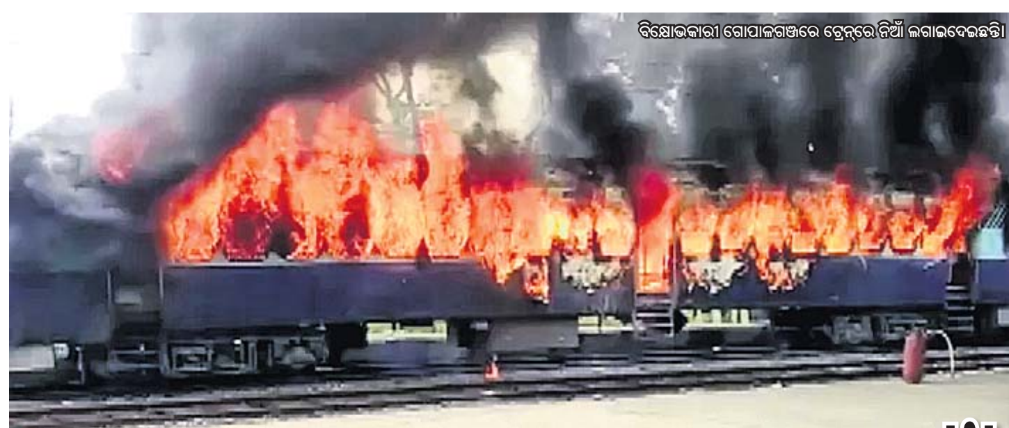
ବିସ୍ଫୋଡ଼କାରୀ ଗୋପାଳଗଞ୍ଜରେ ଟ୍ରେନ୍‌ରେ ନିଆଁ ଲାଗାଇଦେଇଛନ୍ତି।