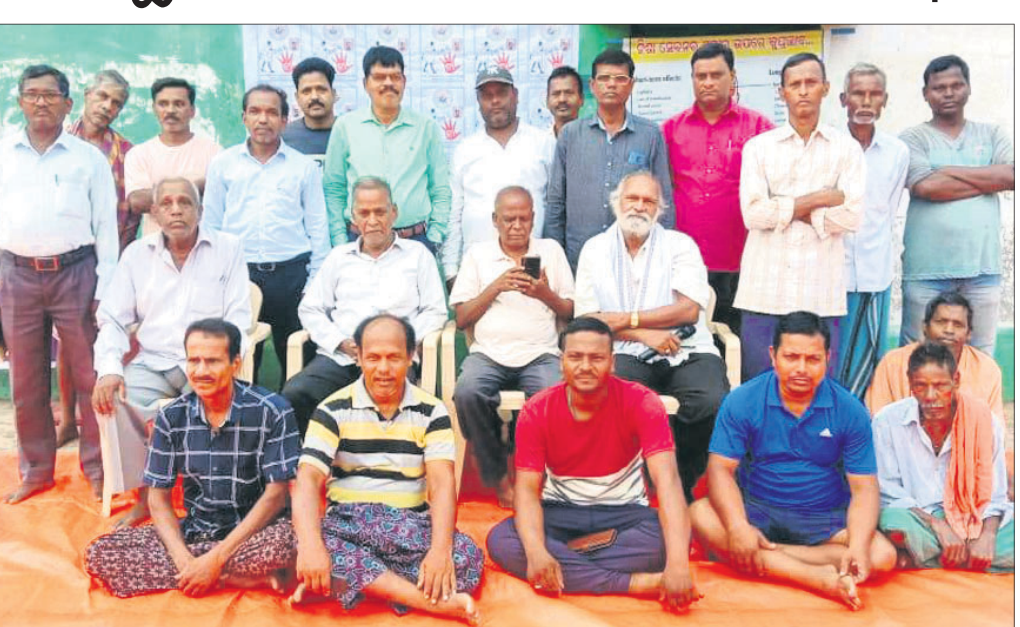
ଛତ୍ରପୁର ଗ୍ରାମରେ ବିଶ୍ୱାସିତ୍ର କନସେବା ଗ୍ରନ୍ଥ ଆନୁକୂଲ୍ୟରେ 'ନିଶା କୁ ନା' କାର୍ଯ୍ୟକ୍ରମରେ ଉପସ୍ଥିତ ଅତିଥି ଓ ଗ୍ରନ୍ଥର ସଦସ୍ୟ।