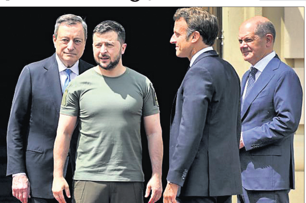
ସୁକ୍ରେନ୍ ରାଷ୍ଟ୍ରପତି ଭୋଲୋଡିମିର ଜେଲେନ୍ସ୍କି(ବାମରୁ ଦ୍ୱିତୀୟ)ଙ୍କ ସହ ଇଟାଲୀ ପ୍ରଧାନମନ୍ତ୍ରୀ ମାରିଓ ଡ୍ରାସି, ଫ୍ରାନ୍ସ ରାଷ୍ଟ୍ରପତି ଜମାନ୍‌ସ୍କିଙ୍କ ମାକ୍‌ର ଏବଂ ଜର୍ମାନୀ ଚାନ୍‌ସେଲର ଓଲାଫ୍ ସ୍କୋଲ୍‌ଜ୍ ।

ରୁଷିଆ ଆକ୍ରମଣ ବିରୋଧରେ ସୁକ୍ରେନ୍‌କୁ ସମର୍ଥନ ଜଣାଇବା ପାଇଁ ଜର୍ମାନୀ ଚାନ୍‌ସେଲର ଓଲାଫ୍ ସ୍କୋଲ୍‌ଜ୍, ଫ୍ରାନ୍ସ ରାଷ୍ଟ୍ରପତି ଜମାନ୍‌ସ୍କିଙ୍କ ମାକ୍‌ର ଏବଂ ଇଟାଲୀ ପ୍ରଧାନମନ୍ତ୍ରୀ ମାରିଓ ଡ୍ରାସି ଗୁରୁବାର କିଭରେ ପହଞ୍ଚିଛନ୍ତି । ସୁକ୍ରେନ୍‌ର ଏହି ୩ ନେତା ସୁକ୍ରେନ୍ ରାଷ୍ଟ୍ରପତି ଭୋଲୋଡିମିର ଜେଲେନ୍ସ୍କିଙ୍କୁ ଭେଟିଛନ୍ତି । ରୁଷିଆ ସହ ଲଢ଼ିବା ପାଇଁ ସୁକ୍ରେନ୍ ପାଶ୍ଚାତ୍ୟ ଦେଶଗୁଡ଼ିକ ପକ୍ଷରୁ ଅଧିକ ସହାୟତା ଦାବି କରୁଥିବାବେଳେ ସମର୍ଥନ ଦେବାକୁ ୩ ପ୍ରମୁଖ ରାଷ୍ଟ୍ରର ମୁଖ୍ୟ ସୁକ୍ରେନ୍ ଗସ୍ତ କରିଛନ୍ତି । ରୋମାନିଆ ରାଷ୍ଟ୍ରପତି କ୍ଲୁସ୍ ଇଓହାନିସ୍କୁ ମଧ୍ୟ ସେମାନଙ୍କ ସହ ସାମିଲ ହୋଇଛନ୍ତି । ଇୟୁ ଲିଡରମାନେ ସୁକ୍ରେନ୍ ବିଧିସ୍ତ ସୁକ୍ରେନ୍‌ର ସହର ଇଉପିନ୍ ବୁଲି ରୁଷିଆ ଆକ୍ରମଣ ପରବର୍ତ୍ତୀ ଦୁଶ୍ମା ଦେଖିବା ସହ ମଞ୍ଚୋର ଏଭଳି ବର୍ବରତାକୁ ନିନ୍ଦା