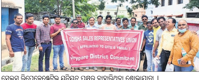
ସେଲ୍ସ ରିପ୍ରେଜେଣ୍ଟେଟିଭ୍ ୟୁନିୟନ ପକ୍ଷରୁ ବାହାରିଥିବା ଶୋଭାଯାତ୍ରା।

ଓଡ଼ିଶାର ସେଲ୍ସ ରିପ୍ରେଜେଣ୍ଟେଟିଭ୍ ୟୁନିୟନ ଜୟପୁର ଶାଖା ପକ୍ଷରୁ ବିଭିନ୍ନ ଦାବି ନେଇ ରବିବାର ଏକ ବିଶେଷ ଶୋଭାଯାତ୍ରା ଅନୁଷ୍ଠିତ ହୋଇଛି। ଏହି ଶୋଭାଯାତ୍ରା ମହିଳା ମହାବିଦ୍ୟାଳୟରୁ ବାହାରି ରଜାନହର ଛକରେ ପହଞ୍ଚିଥିଲା। ୬୦ରୁ ଊର୍ଦ୍ଧ୍ୱ ସଦସ୍ୟ ବାଳକ ଶୋଭାଯାତ୍ରାରେ ସହର ପରିକ୍ରମା କରି ସେମାନଙ୍କ ଦାବି କେନ୍ଦ୍ର ଓ ରାଜ୍ୟ ସରକାର କାର୍ଯ୍ୟକାରୀ କରିବାକୁ ଦାବି କରିଥିଲେ। ସେମାନଙ୍କ ଦାବିକୁ ନିମନ୍ତ୍ରଣ କରିବା ପାଇଁ ଅନୁରୋଧ କରିବା, ଅନ୍ତର୍ଜାତୀୟ ଶାନ୍ତି ଅନୁରୋଧ କରିବା, ଓଡ଼ିଶାକୁ ଉନ୍ନତ କରିବା, ବନ୍ଦ ହୋଇଯାଇଥିବା ସରକାରୀ