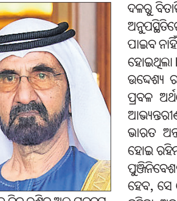
ମହମ୍ମଦ ବିନ୍ ରଶିଦ୍ ଅଲ୍ ମକତୁମ୍

୨୦୧୨ରେ ମୁଖ୍ୟମନ୍ତ୍ରୀ ବିଦେଶ ଗସ୍ତରେ ଲଣ୍ଡନ ଲଣ୍ଡନରେ ବସି ଟେଲିଫୋନ୍ ଯୋଗେ ସମର୍ଥକମାନଙ୍କୁ ଯାଇଥିଲେ। ତେବେ ତତ୍କାଳୀନ ଘନିଷ୍ଠ ସହଯୋଗୀ କାର୍ଯ୍ୟରେ ଲାଗାଉ ପ୍ୟାରାକ୍ ସଡ଼ଯନ୍ତ୍ରକୁ ବିଫଳ କରାଇ ଦେଇଥିଲେ। ଏଥିସହିତ ଗସ୍ତ କାର୍ଯ୍ୟକ୍ରମକୁ କାର୍ତ୍ତବ୍ୟ ମିତ୍ତନାକର୍ କୁ ବିଷୟରେ ଜାଣିବାକୁ ପାଇଥିଲେ।