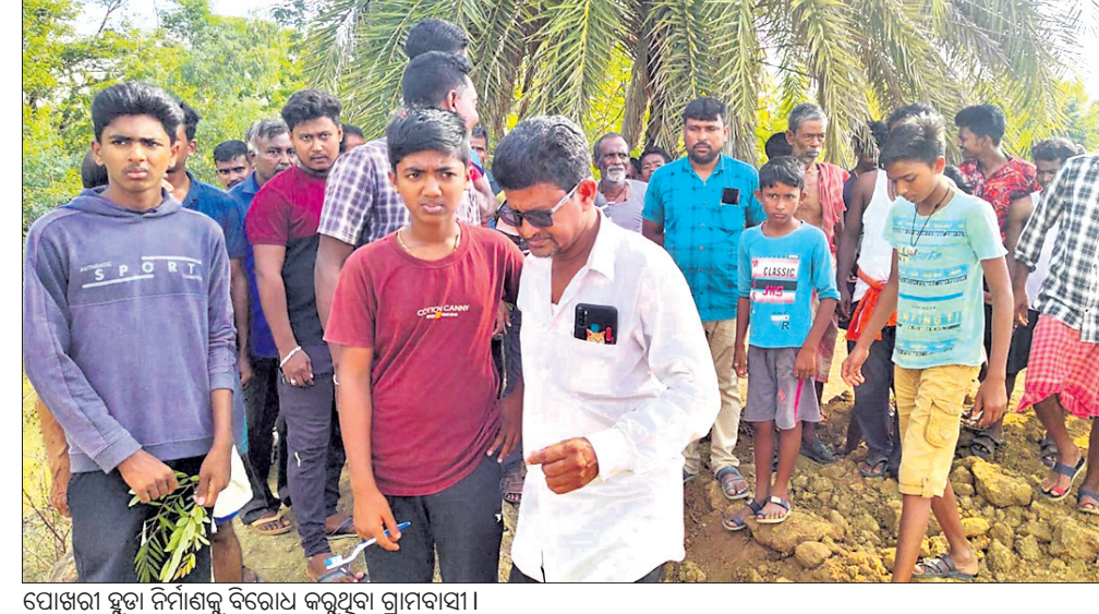
ପୋଖରୀ ହୁଡ଼ା ନିର୍ମାଣକୁ ବିରୋଧ କରୁଥିବା ଗ୍ରାମବାସୀ ।

ଅଗାମୀ ଦିନରେ ଉଭୟ ଗୋଷ୍ଠୀକୁ ନେଇ ରାଜ୍ୟ ବିଭାଗ ଅଧିକାରୀଙ୍କ ଉପସ୍ଥିତିରେ ଏକ ବୈଠକ କରାଯାଇ ଏହାର ସମାଧାନ କରାଯିବ ବୋଲି କିଛି କହିଛନ୍ତି।