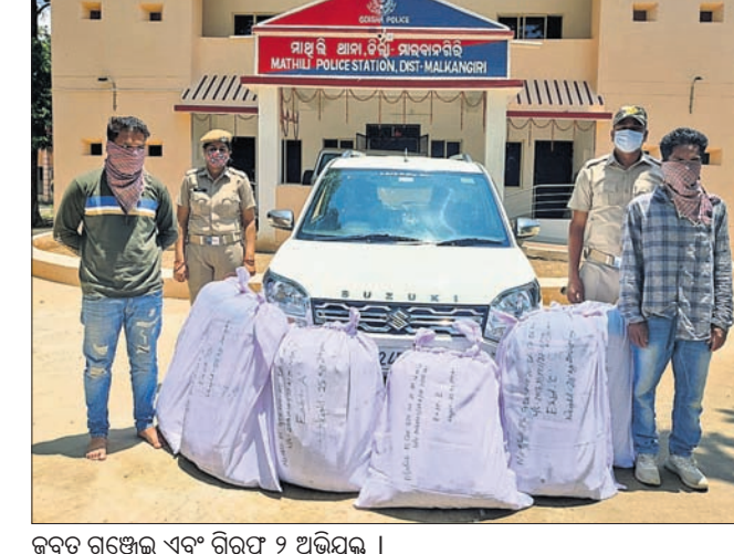
ଜବତ ଗଞ୍ଜେଇ ଏବଂ ଗିରଫ ୨ ଅଭିଯୁକ୍ତ ।