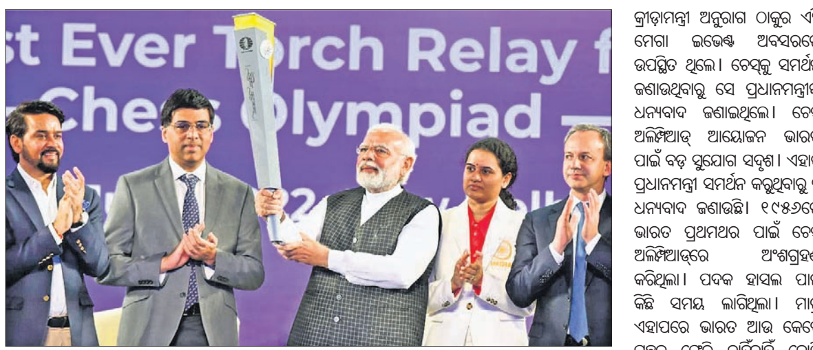
ପ୍ରଧାନମନ୍ତ୍ରୀ ନରେନ୍ଦ୍ର ମୋଦି ରବିବାର ଚେସ୍ ଅଲିମ୍ପିଆଡ଼ ମଣ୍ଡଳୀ ରିଲେ ଶୁଭାରମ୍ଭ କରୁଛନ୍ତି।

ପ୍ରଧାନମନ୍ତ୍ରୀ ନରେନ୍ଦ୍ର ମୋଦି ରବିବାର ଚେସ୍ ଅଲିମ୍ପିଆଡ଼ର ସର୍ବପ୍ରଥମ ମଣ୍ଡଳୀ ରିଲେ ଶୁଭାରମ୍ଭ କରିଛନ୍ତି। ଅଲିମ୍ପିଆଡ଼ର ୪୪ତମ ସଂସ୍କରଣ ମହାବଳିପୁରମଠାରେ ଜୁଲାଇ ୨୮ରୁ ଅଗଷ୍ଟ ୧୦ ପର୍ଯ୍ୟନ୍ତ ଅନୁଷ୍ଠିତ ହେବ। ଅଲିମ୍ପିଆଡ଼ ଚେସ୍ ସଂଘ ପ୍ରତି ପ୍ରଥମଥର ପାଇଁ ଅଲିମ୍ପିଆଡ଼ ପରମ୍ପରା ଅନୁସାରେ ଚେସ୍ ଅଲିମ୍ପିଆଡ଼ ଲାଗି ମଣ୍ଡଳୀ ରିଲେ ଆରମ୍ଭ କରିଛନ୍ତି। ପ୍ରତି ପ୍ରଥମଥର ପାଇଁ ଚେସ୍ ଅଲିମ୍ପିଆଡ଼ର ପ୍ରଥମ ମଣ୍ଡଳୀ ରିଲେ ଶୁଭାରମ୍ଭ କରିଛନ୍ତି। ପ୍ରଧାନମନ୍ତ୍ରୀ ଚାହାଣୀ କମିଟିର ଚେସ୍ ଖେଳାଳି ବିଶ୍ୱନାଥନ ଆନନ୍ଦଙ୍କୁ ପ୍ରଦାନ କରିଥିଲେ। ଏହି ମଣ୍ଡଳୀ ଆଗାମୀ ୪୦ ଦିନ ମଧ୍ୟରେ ଦେଶର ୨୫ଟି ସହର ପରିକ୍ରମା କରିବା କାର୍ଯ୍ୟକ୍ରମ ରହିଛି। ଶେଷରେ ଏହା ଚେନ୍ନାଇ ନିକଟସ୍ଥ ମହାବଳିପୁରମଠାରେ ପହଞ୍ଚିବ। ପ୍ରତିଯୋଗିତା ଆରମ୍ଭ ହେବ। ପ୍ରତି ରାଜ୍ୟର ଚେସ୍ ଗ୍ରାଣ୍ଟମାଷ୍ଟରମାନେ ମଣ୍ଡଳୀ ଗ୍ରହଣ କରିବେ। ଲୋକ, ଶ୍ରୀମନ୍ତ୍ରୀ, କର୍ମଚାରୀ, ପୁରୁଷ, ମୂଲ୍ୟ, ଭୋପାଳ, ପାଟଣା, କୋଲକାତା, ଗାନ୍ଧିନଗର, ହାଇଦ୍ରାବାଦ, ଚୋରଙ୍ଗପୁର, ପୋର୍ଟବ୍ଲେୟାର ଓ