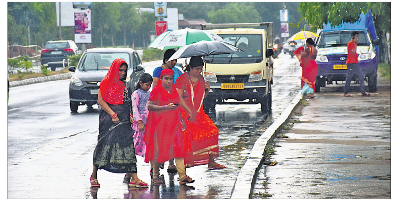
ଭୁବନେଶ୍ଵରରେ ରବିବାର ଅପରାହ୍ନକୁ ହୋଇଥିବା ମୌସୁମୀ ବର୍ଷାରେ ଜୟଦେବ ବିହାର-ନନ୍ଦନକାନନ ରୋଡ଼ସ୍ଥିତ ଜାଭିୟର ଛକର ଦୃଶ୍ୟ।