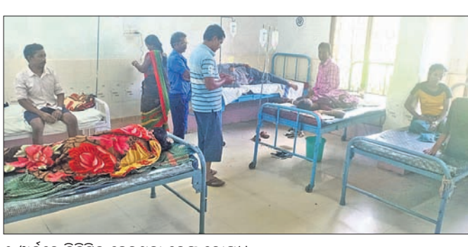
୨ ଖୁର୍ଚ୍ଚରେ ଚିକିତ୍ସିତ ହେଉଥିବା ତେଜୁ ରୋଗୀ।

କୋରାପୁଟ ଜିଲ୍ଲାରେ ଏବେ ତେଜୁ କୁର ବ୍ୟାପିବାରେ ଲାଗିଛି। ବହୁ ସଂଖ୍ୟାରେ ଆକ୍ରାନ୍ତ ଡାକ୍ତରଖାନାରେ ଭିଡ଼ ଲାଗିରହିଛି। ଲକ୍ଷ୍ମୀପୁର ବ୍ଲକରେ ଏହି ସଂଖ୍ୟା ସର୍ବାଧିକ ଥିବା ଜଣାପଡ଼ିଛି। ଇତିମଧ୍ୟରେ ତେଜୁରେ ୨ ଜଣଙ୍କ ମୃତ୍ୟୁ ହୋଇଛି। ସେମାନଙ୍କ କୋରାପୁଟ ମେଡିକାଲ କଲେଜରେ ପରୀକ୍ଷା ହୋଇଥିଲା। ରିପୋର୍ଟରୁ ଉଭୟଙ୍କୁ ତେଜୁ ହୋଇଥିବା ଜଣାପଡ଼ିଥିଲା। ମାତ୍ର ତେଜୁରେ ସେମାନଙ୍କ ମୃତ୍ୟୁ ହୋଇଥିବା ସ୍ୱାସ୍ଥ୍ୟ ବିଭାଗ ପକ୍ଷରୁ ସ୍ୱୀକୃତି କରାଯାଇନାହିଁ। ଏହାକୁ ନିରାକୃତ କରିବାର ପ୍ରଶ୍ନାସନ ପକ୍ଷରୁ ପ୍ରଧାନ ଚାରି ରହିଥିଲେ ସୁଦ୍ଧା ତାହା ଯଥେଷ୍ଟ ହୋଇନାହିଁ। ଖବରରୁ ଜଣାପଡ଼ିଛି, ଛିଦ୍ରି ଦିନ ତଳେ କେତେକ ଲୋକ କୁରରେ ଆକ୍ରାନ୍ତ ହୋଇଥିଲେ। ସେମାନଙ୍କ ମଧ୍ୟରୁ ଜଣେ ଯୁବକ ଓ ଜଣେ ମହିଳାଙ୍କ ମୃତ୍ୟୁ ଘଟିଥିଲା। ଫଳରେ ସେମାନେ ରହୁଥିବା ସାହିର ସାହିବାସିନ୍ଦା ଉଭୟ ଯୁବକାୟତ୍ର ତେଜୁରେ ଆକ୍ରାନ୍ତ ହୋଇ ମୃତ୍ୟୁ ଘଟିଥିବା ସନ୍ଦେହ କରିଥିଲେ। ତେବେ ଖବର ପାଇ ଜିଲ୍ଲାସ୍ତରୀୟ ଏକ ଡାକ୍ତରୀ ଟିମ୍ ସହ ଭ୍ରାମ୍ୟମାଣ ଟିମ୍ ସାହିଗୁଡ଼ିକର ପ୍ରତି ଘର ବୁଲି ପିଇବା ପାଣି ଓ ରକ୍ତ ନମୁନା ସଂଗ୍ରହ କରି ନେଇଥିଲେ। ଏହା ଏକ ଭୃତାଣୁ ଜନିତ କୁର, ଭୟଭୀତ ନ ହେବାକୁ ଲୋକଙ୍କୁ ପରାମର୍ଶ ଦେଇଥିଲେ।