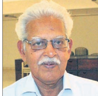
ଓଡ଼ିଆ ଓ ଗୋନା