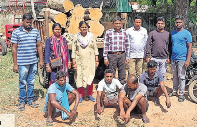
ବନବିଭାଗ ପକ୍ଷରୁ ଜବତ ହୋଇଥିବା କାଠଗଣ୍ଡି।

ମାଲକାନଗିରି ଜିଲ୍ଲା କାଲିମେଳା ବନଖଣ୍ଡ ଅଧୀନ ତଥା ପଡ଼ିଆ ବ୍ଲକ ବଜାଗୁଡ଼ା