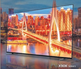
ଆମ ମୁଣ୍ଡର ପରି ଏହି ନୂଆ ପ୍ରୋସେସର୍ ଅଧିକରେ ଏକ ଆରେକ୍ସ୍ ଟ୍ରାସ୍ ବିଶ୍ଳେଷଣ କରିପାରିବ। ସୋନିର ଏହି ଏକ୍ସ୍ ଆର୍-୫୫ଏକ୍ସ୍ ୦କେ, ଏକ୍ସ୍ ଆର୍-୬୫ଏକ୍ସ୍ ୦କେର ମୂଲ୍ୟ ୧,୨୯,୯୯୦ ଟଙ୍କା ଓ ୧,୭୯,୯୯୦ ଟଙ୍କା ରହିଛି। ବିଶେଷ କରି ଏହା ସୋନି ସେଣ୍ଡର, ଟିପ୍ଟୁ ଉପାଦାନଗୁଡ଼ିକୁ ବ୍ୟକ୍ତିଗତ ଭାବେ ବିହ୍ୱଳ ଏବଂ ବିଶ୍ଳେଷଣ କରିପାରେ, ଇ-କମର୍ସ ପୋର୍ଟାଲରେ ପାଇପାରିବେ।

ସୋନି ଇଣ୍ଡିଆ ପକ୍ଷରୁ ଏହାର ନୂତନ ବ୍ରାଉଥ୍ ଆ ଏକ୍ସ୍ ଆର ଏକ୍ସ୍ ୦କେ ସିରିଜ୍ ଶୁଭାରମ୍ଭ ସମ୍ପର୍କରେ ଘୋଷଣା କରାଯାଇଛି। ଏହି ସିରିଜ୍ ସରଳ କମ୍ପ୍ୟୁଟିଙ୍ଗ୍ ପ୍ରୋସେସର୍ ଏକ୍ସ୍ ଆର୍ ସହ ଭିଜନ୍ ଓ ସାଉଣ୍ଡର ବିଶେଷ ଧ୍ୟାନ ଦିଆଯାଇଛି। ଶ୍ରେଷ୍ଠ ଶ୍ରେଣୀରେ ଅଲ୍ଟ୍ରା ବାସ୍ତବବାଦୀ ଟିପ୍ଟୁ ନୁହଁ ସହ ଲାଇଫ୍ ଲାଇଫ୍ ଗ୍ରାହକଙ୍କ ପରିପୂର୍ଣ୍ଣ ରହିଛି। ନୂତନ କମ୍ପ୍ୟୁଟିଙ୍ଗ୍ ପ୍ରୋସେସର୍ ଏକ୍ସ୍ ଆର ପ୍ରଦାନ କରିଥାଏ। ପାରମ୍ପରିକ ଆର୍ଡିଫିସିଆଲ୍ ଇଣ୍ଟେଲିଜେନ୍ସ୍ (ଏଆଇ) କେବଳ ରଜ୍, ଟ୍ରାଣ୍ସ୍ ଏବଂ ବିବରଣୀ ପରି ଟିପ୍ଟୁ ଉପାଦାନଗୁଡ଼ିକୁ ବ୍ୟକ୍ତିଗତ ଭାବେ ବିହ୍ୱଳ ଏବଂ ବିଶ୍ଳେଷଣ କରିପାରେ,