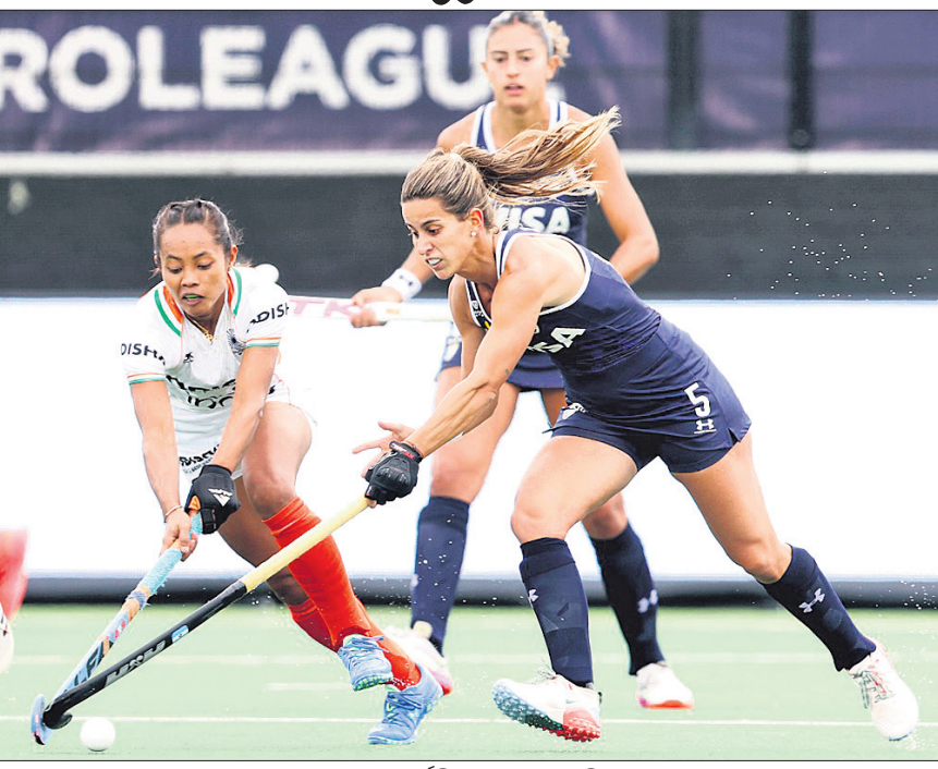
ଭାରତ ଓ ଆର୍ଜେଣ୍ଟିନା ମଧ୍ୟରେ ଅନୁଷ୍ଠିତ ମ୍ୟାଚ।