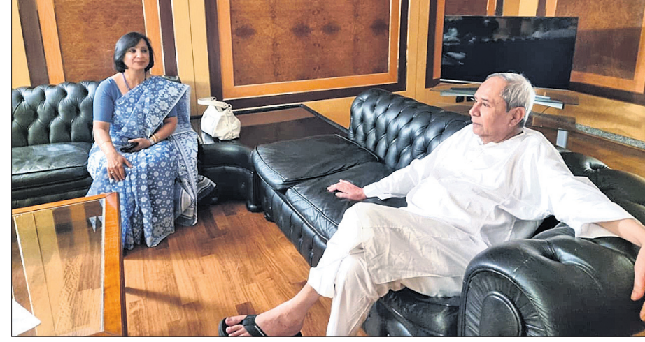
ମୁଖ୍ୟମନ୍ତ୍ରୀ ନବୀନ ପଟ୍ଟନାୟକ ଇଟାଲାରେ ଥିବା ଭାରତୀୟ ରାଷ୍ଟ୍ରପତିଙ୍କୁ ସ୍ୱାଗତ କରିଥିଲେ।