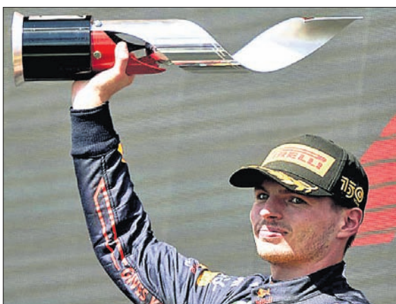
ଗ୍ରାଁ ପ୍ରି ସହ ମ୍ୟାକ୍ ଭର୍ଷ୍ଟାପେନ।

ଫୋର୍ମୁଲାରେ ଭିଜିତ ହେବେ। ରେଡ୍ ବୁଲ୍ସର ମ୍ୟାକ୍ ଭର୍ଷ୍ଟାପେନ କାନାଡିଆନ ଫର୍ମୁଲା-୧ ଗ୍ରାଁ ପ୍ରି ଫୋର୍ମୁଲାରେ ଭିଜିତ ହେବେ।