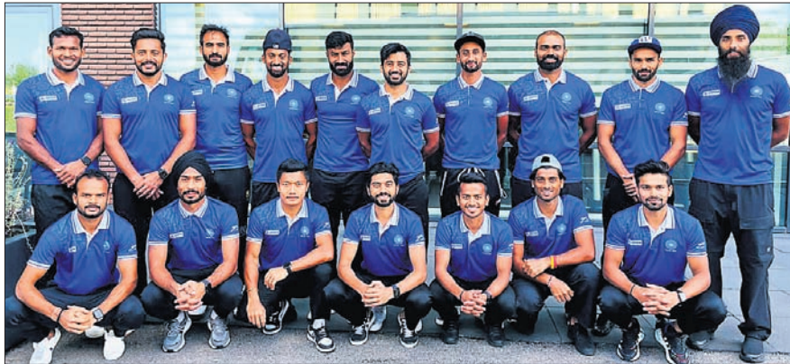
ରାଜ୍ୟଗୋଷ୍ଠୀ କ୍ରୀଡ଼ା ପାଇଁ ମନୋନୀତ ଭାରତୀୟ ପୁରୁଷ ହକି ଦଳ।

ଏସିପି ରାଜ୍ୟଗୋଷ୍ଠୀ: ଶୀର୍ଷରେ ରହିଲେ ମେଡ଼ଭେଡେଭ ପ୍ୟାରିସ୍, ୨୦୧୬: ରୁଷିଆର ତାଲିକା ମେଡ଼ଭେଡେଭ ଏସିପି ପୁରୁଷ ସିନିୟର ରାଜ୍ୟଗୋଷ୍ଠୀରେ ଶୀର୍ଷ ସ୍ଥାନ ବଜାୟ ରଖିଛନ୍ତି। ରବିବାର ହାଲେ ଓପନ୍ ଫାଇନାଲରେ ସେ ପୋଲଣ୍ଡର ହର୍ବର୍ଟ ହରକାଜକଠାରୁ ସିଧାସଳଖ ସେଟ୍ରେ ପରାସ୍ତ ହୋଇଥିଲେ। ଏହି ପରାଜୟ ସତ୍ତ୍ୱେ ସେ ତାଙ୍କ ଶୀର୍ଷ ସ୍ଥାନ ବଜାୟ ରଖିଥିବା ସଦ୍ୟ ପ୍ରକାଶିତ ଏସିପି ରାଜ୍ୟଗୋଷ୍ଠୀ ଦର୍ଶାଇଛି। ଅନ୍ୟପକ୍ଷରେ ହାଲେ ଓପନ୍ ଫାଇନାଲ ହାସଲ କରିଥିବା ହରକାଜ ଟପ୍ ୧୦ରେ ପ୍ରବେଶ କରିଛନ୍ତି। କୁଇନ୍ସ କ୍ଲବ୍ ଚାମ୍ପିୟନସିପ୍ ବିଜେତା ମାଡେଓ କରେଟିନି ଏକାଦଶ ସ୍ଥାନକୁ ଖସିଛନ୍ତି। ମେଡ଼ଭେଡେଭ ପଛକୁ ଜର୍ମାନୀର ଆଲେକ୍ସାଣ୍ଡର ଜେଭେରୋଭ, ସର୍ବିଆର ନୋଭାକ ଡୋଲିଡେଭିଚ, ହେନ୍ଦର ରାଫାଲ ନାଡୋଲ, ନରଓୱେ କାସପର ରୁଡ୍ ସାଧୁକ୍ରମେ ଟପ୍-୫ରେ ରହିଛନ୍ତି।