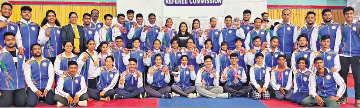
ପୁଣେରେ ଅନୁଷ୍ଠିତ ଜାତୀୟ କରାଟେ ଚାମ୍ପିୟନସିପ୍ରେ ବିତାଣି ସ୍ଥାନ ଅଧିକାର କରିଥିବା ଓଡ଼ିଶା ଦଳ।

(କିଓ) ଆୟୋଜନ କରିଥିଲା। ଓଡ଼ିଶା ଦଳ ଓ ବିଜୟା ପ୍ରତିଯୋଗୀ ମାନଙ୍କୁ ଓଡ଼ିଶା ରାଜ୍ୟ କରାଟେ ତୋ ସଂଘର ସଦସ୍ୟମାନେ ଅଭିନନ୍ଦନ ଜଣାଇଛନ୍ତି। ଆସନ୍ତା ୨୨ ତାରିଖରେ ଓଡ଼ିଶା ପ୍ରତିଯୋଗୀ ମାନେ ଭୁବନେଶ୍ଵର ଫେରିବେ।