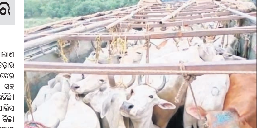
ଟ୍ରକ୍‌ରେ ବୋଝେଇ ହୋଇଥିବା ଗୋରୁ ।

ଓଡ଼ିଶାରୁ ପଶୁମବଳୀକୁ ଗୋରୁ ଚୋରାଚାଲାଣ ବେଳେ ପୋଲିସ୍ ପକ୍ଷରୁ ଡକାୟତ କରାଯାଇଛି । ଏକ ଗୋରୁ ବୋଝେ ୧୦ଟିଆ ଟ୍ରକ୍ ଜବତ କରାଯିବା ସହ ଡ୍ରାଇଭରଙ୍କୁ ଅଟକ ରଖି ତଦନ୍ତ ଜାରି ରହିଛି । ଟ୍ରକ୍‌ରୁ ୬୦ରୁ ଅଧିକ ଗୋରୁକୁ ପୋଲିସ୍ ଉଦ୍ଧାର କରିଛି । ବାଲେଶ୍ୱର ଜିଲ୍ଲା ୬୦୦୦. ଜାତୀୟ ରାଜପଥ ଦେଇ ପ୍ରତ୍ୟେକ ଦିନ ବିପୁଳ ପରିମାଣରେ ଗୋରୁ ଟ୍ରକ୍‌ରେ ଲୋଡ଼ି କରି ଓଡ଼ିଶାରୁ ପଶୁମବଳୀକୁ ଚାଲାଣ ହେଉଛି । ରାଜସ୍ୱାଧିକାରରେ ପୋଲିସ୍‌ର ନାକା ପଏଣ୍ଟ ଆଇ ନ୍ୟୁ ପୋଲିସ୍ ରୋକ୍ ଲଗାଇ ପାଉ ନ ଥିବା ଦେଖିବାକୁ ମିଳିଛି । ସୋମବୀର ଭୋଇ ସମୟରେ ଏକ ୧୦ଟିଆ ଟ୍ରକ୍