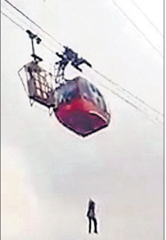
ମଧ୍ୟ ଘଟଣାସ୍ଥଳରେ ଉପସ୍ଥିତ ଥିଲେ। ଡିଏମ୍ ଟ୍ରେଲ୍ ଘରୋଇ ରିସର୍ଚର କେନ୍ଦୁଲ କାର୍ ବେଶ୍ ଲୋକପ୍ରିୟ।

ବୈଷୟିକ ତ୍ରୁଟି ଯୋଗୁଁ ହିମାଚଳପ୍ରଦେଶର ପରଫ୍ଲୁରେ ଯୋଗଦାନ ଅପରାହ୍ଣରେ ଏକ କେନ୍ଦୁଲ କାର୍ ରୋପ୍‌ୱେରେ ବନ୍ଦ ହୋଇଯାଇଥିଲା। ଫଳରେ ୧୧ ଜଣ ଯାତ୍ରୀ ଓ ଘଣ୍ଟାକୁ ଉର୍ଦ୍ଧ୍ୱ ସମୟ ହୁଏ ରହିଥିଲେ।