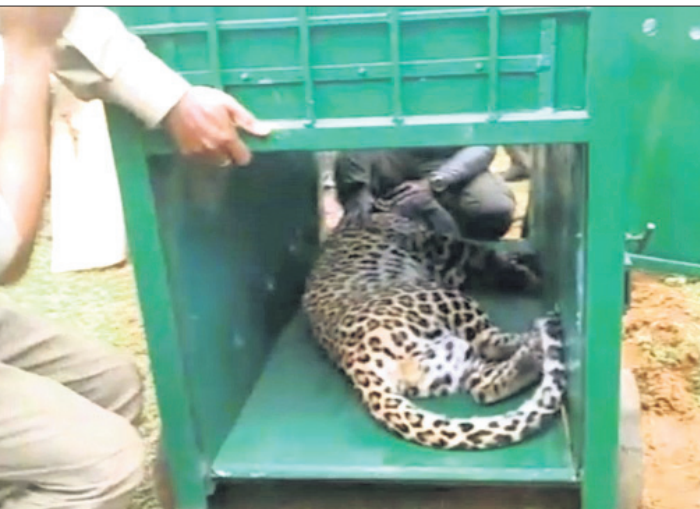
ଉଦ୍ଧାର ପରେ ବାଘକୁ ଯତ୍ନରେ ଭର୍ତ୍ତି କରାଯାଇଛି ।

ଅନୁଗୋଳ ଅଫିସ୍/ ବନ୍ଦଳା, ୨୦।୬ ଅନୁଗୋଳ ଜିଲ୍ଲା ସାତକୋଶିଆ ଅଭୟାରଣ୍ୟରେ କୋର୍ଦ୍ଦାର ଚାଲିଛି ବନ୍ୟପ୍ରାଣୀ ଶିକାର । ୨୦୧୮ ନଭେମ୍ବର ୧୪ରେ ଶିକାରୀଙ୍କ ଫାଶରେ ପଡ଼ି ମହାବଳ ବାଘ 'ମହାବୀର'ର ମୃତ୍ୟୁ ଘଟଣା ଲୋକଙ୍କ ମନରୁ ଲିଭି ନ ଥିବାବେଳେ ସୋମବାର ଏକ କଲରାପତରିଆ ବାଘ ଶିକାରୀଙ୍କ ଫାଶରେ ପଡ଼ିବା ବନ ବିଭାଗର କାର୍ଯ୍ୟଦକ୍ଷତା ଉପରେ ପ୍ରଶଂସା ଦର୍ଶାଇଛି । ତେବେ ଖବରପାଇକବା ପରେ ବନ ବିଭାଗ ରୁଚି ଘଟଣାସ୍ଥଳରେ ପହଞ୍ଚି ବାଘଟିକୁ ସୁରକ୍ଷିତ ଭାବେ ଉଦ୍ଧାର କରିବା ସହ ଜଙ୍ଗଲରେ ନେଇ କୋର୍ ଜଙ୍ଗଲ ମଧ୍ୟରେ ଛାଡ଼ିଦେଇଥିବା ଜଣାପଡ଼ିଛି । ସୂଚନା ଅନୁଯାୟୀ, ସାତକୋଶିଆ ଅଭୟାରଣ୍ୟ ପ୍ରଭୁରାଜକୋଟ ବନଞ୍ଚଳ ଗୋପାଳପୁର ଗ୍ରାମ ନିକଟରେ ଭୋର ସମୟରେ ଏକ କଲରାପତରିଆ ବାଘ ଶିକାରୀ ବସାଇଥିବା ଫାସରେ ପଡ଼ିଯାଇଥିବା ସ୍ଥାନୀୟ ଯୁବକମାନେ ଦେଖିବାକୁ ପାଇଥିଲେ । ସେମାନଙ୍କଠାରୁ