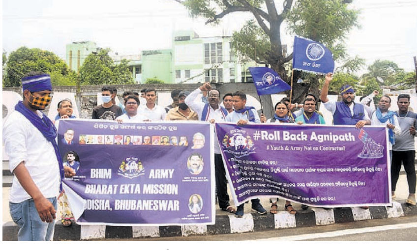
ଭାରତରାଜ ସେନାରେ ୪ ବର୍ଷିଆ ଠିକା ନିୟୁତ୍ତି ଯୋଜନା 'ଅଗ୍ନିପଥ'କୁ ବିରୋଧ କରି ସୋମବାର ଭୀମ ଆର୍ମି ଭାରତ ଏକାମ୍ର ମିଶନ ପକ୍ଷରୁ ମାଷ୍ଟରକ୍ୟାଣ୍ଡିନ ଛକରେ ବିକ୍ଷୋଭ।