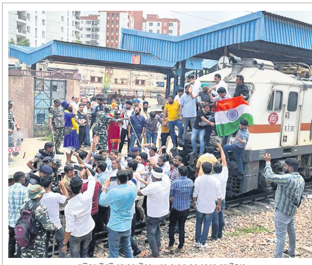
ଅଗ୍ରପଥ ନିୟୁତ୍ତି ଯୋଜନା ବିରୋଧରେ ଭାରତ ବନ୍ଦ ବେଳେ ନୂଆଦିଲ୍ଲୀର ଶିବାଜୀ ବ୍ରିଜ୍ ରେଳଷ୍ଟେସନରେ ମୁକ୍ତ କଂଗ୍ରେସ କର୍ମୀଙ୍କ ରେଳଚୋରାଣା।

ସହ ଅନେକ ପରିବର୍ତ୍ତନ ପାଇଁ ପ୍ରତିଷ୍ଠିତ ହୋଇଥିଲେ। କିନ୍ତୁ ନିମ୍ନସଦନରେ ସଂଖ୍ୟା ଗରିଷ୍ଠତା ହରାଇଥିବାରୁ ଏହା ତାଙ୍କ ପକ୍ଷେ ସହଜ ହେବନାହିଁ।