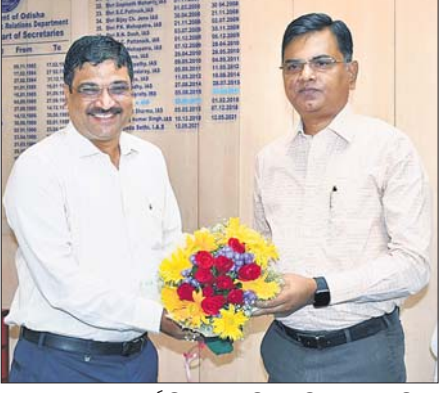
ସୂଚନା ଓ ଲୋକସମ୍ପର୍କ ବିଭାଗର ସଚିବ ଦାୟିତ୍ୱ ଗ୍ରହଣ କରିବା ଅବସରରେ ସଞ୍ଚୟ ସିଂଙ୍କୁ ପୁଷ୍ପଗୁଚ୍ଛ ଦେଇ ସାଗତ କରାଯାଇଛି।

ପ୍ରମୁଖ ଶାସନ ସଚିବ ସଞ୍ଚୟ କୁମାର ସିଂ ସୋମବାର ସୂଚନା ଓ ଲୋକସମ୍ପର୍କ ବିଭାଗ ଦାୟିତ୍ୱ ଗ୍ରହଣ କରିଛନ୍ତି।