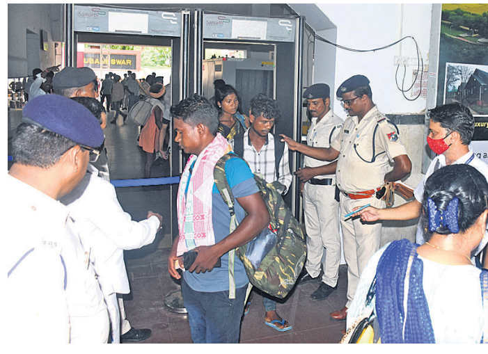
ଅଗ୍ନିପଥ ଯୋଜନାକୁ ନେଇ ଅପ୍ରାତିକର ପରିସ୍ଥିତି ଏଡ଼ାଇବାକୁ ଭୁବନେଶ୍ୱର ରେଳ ଷ୍ଟେସନରେ ହାଇ ଆଲର୍ଟ ଜାରି କରାଯିବା ସହ ପ୍ରବେଶ ପଥରେ ଯାତ୍ରୀମାନଙ୍କୁ କଡ଼ାକଡ଼ି ଯାଞ୍ଚ କରି ଛଡ଼ାଯାଇଛି।