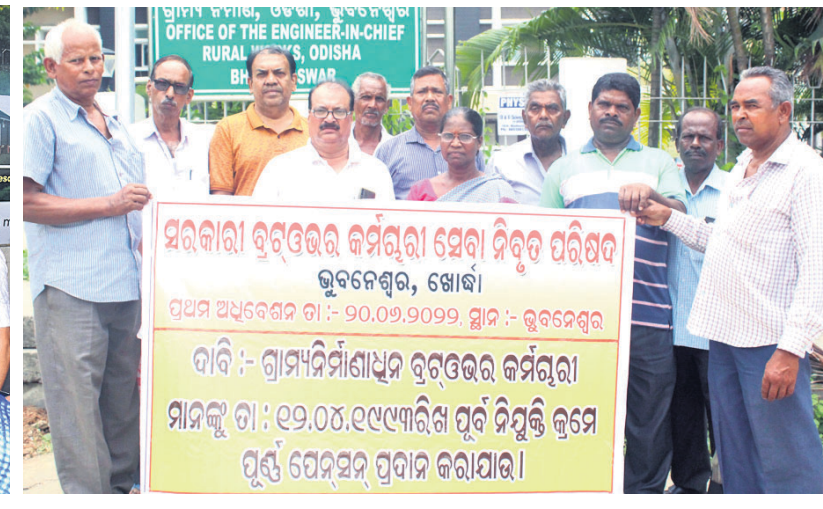
ପୂର୍ବ ନିୟୁତ୍ତିକ୍ରମେ ପୂର୍ଣ୍ଣ ପେନ୍‌ସନ୍ ପ୍ରଦାନ ଦାବିରେ ସରକାରୀ ବ୍ରହ୍‌ଓଭର କର୍ମଚାରୀ ସେବା ନିବୃତ୍ତ ପରିସଭ ପକ୍ଷରୁ ଭୁବନେଶ୍ୱର ଯୁନିଟ୍ ୪ ଦ୍ୱିତୀୟ ସର୍ବୋଚ୍ଚ ଯନ୍ତ୍ରଣା କାର୍ଯ୍ୟାଳୟ ଆଗରେ ବିକ୍ଷୋଭ।