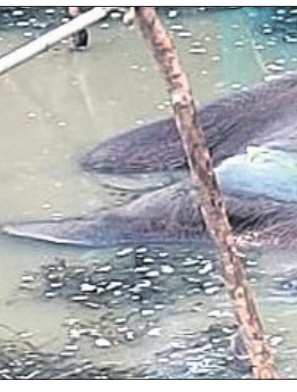
ପୋଖୀରୀ ଭିତରେ ଗୁରୁତର ଦନ୍ତା ।