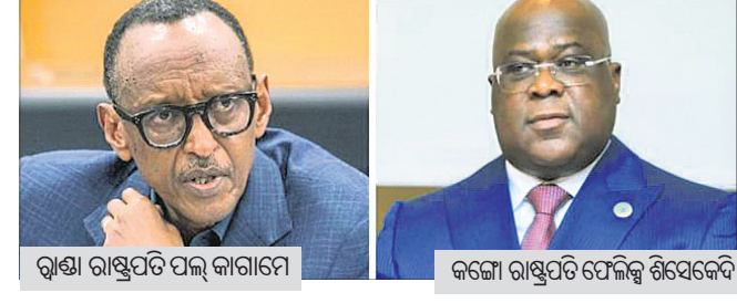
ଭାଷା ରାଷ୍ଟ୍ରପତି ପଲ୍ କାଗାମେ କଲୋ ରାଷ୍ଟ୍ରପତି ଫେଲିକ୍ସ ଶିସେକେଦି

ଭାଷା ଏବଂ କଲୋ ମଧ୍ୟରେ ଉତ୍ତେଜନା ବୃଦ୍ଧିକୁ ଦୃଷ୍ଟିରେ ରଖି ଇଏସି ଆଫ୍ରିକୀୟ କମ୍ୟୁନିଟି (ଇଏସି)ର ୭ ଦେଶ ବୁରୁଣ୍ଡି, କଲୋ, କେନିୟା, ଭାଷା, ଉଗାଣ୍ଡା, ସାଉଦି ଆରବ ଏବଂ ତାଞ୍ଜାନିଆ ଚଳିତ ବର୍ଷ ଏକ ଆଞ୍ଚଳିକ ଫୋର୍ସ ଗଠନ କରିଛନ୍ତି।