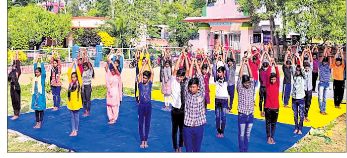
ରାଜନଗର ନେହେରୁ ଯୁବ କେନ୍ଦ୍ର ପକ୍ଷରୁ ଅନୁଷ୍ଠିତ ଶିବିରରେ ପିଲାମାନେ ଯୋଗ କରୁଛନ୍ତି।