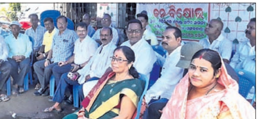
କେନ୍ଦ୍ର ସରକାରଙ୍କ ଉପକୂଳର ଡାକଘର ସମ୍ପୂର୍ଣ୍ଣରେ କଂଗ୍ରେସର ଗଣଧାରଣା ଦେଖାଯାଇଛି ।