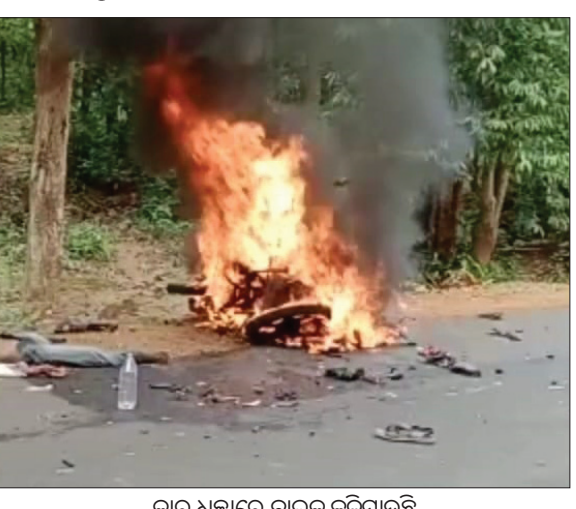
କାର୍ ଧକ୍କାରେ ବାଇକ୍ ଜଳିଯାଇଛି

ଭେଙ୍ଗା ନାଳ ଅଫିସ୍, ୨୧।୬ ଭେଙ୍ଗା ନାଳ ଜିଲ୍ଲା ଗିଫ୍ଟା ଥାନା ପୋଡ଼ିଆପଦା ନିକଟରେ ମଙ୍ଗଳବାର ଅପରାହ୍ନରେ ଏକ ଦୁର୍ଘଟଣା ଘଟିଛି।