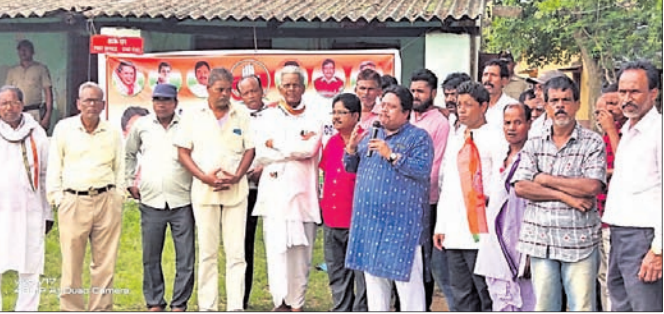
କଂଗ୍ରେସ ପକ୍ଷରୁ ଗରବପୁର ଉପପାଳକର ସମ୍ମୁଖରେ ବିଶୋଭ।

ସ୍ୱାଇଁ ପ୍ରମୁଖ ଯୋଗଦେଉଥିଲେ। ସେହିପରି ଡେରାବିଶ ବ୍ଲକ ଚାନ୍ଦୋଳସ୍ଥିତ ହୃଦୟାନନ୍ଦ ନାୟକ ସ୍ମାରକୀ ମହାବିଦ୍ୟାଳୟରେ ଯୋଗ ଦିବସ ପାଳିତ ହୋଇଯାଇଛି।