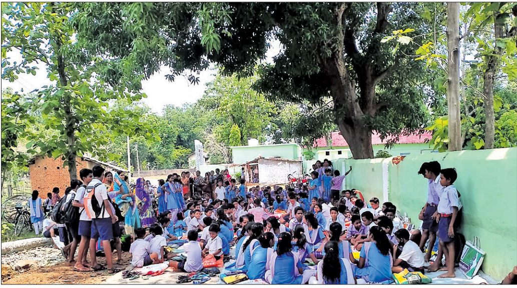
ବିଦ୍ୟାଳୟ ସମ୍ମୁଖରେ ଧାରଣା ଦିଆଯାଇଛି ।

ନିମ୍ନମାନର ନିର୍ମାଣ କାର୍ଯ୍ୟ ଯୋଗୁଁ କାଳଦୈନିକାରେ ଉଡିଗଲା ୫-ଟି ଯୋଜନାରେ ନିର୍ମିତ ବିଆମାଳ ବ୍ଲକ ନ୍ୟୁଟ୍ରିସାଣ୍ଡିଟ ପଞ୍ଚପାଲି ସରକାରୀ ଉଚ୍ଚ ବିଦ୍ୟାଳୟର ଚିଶ ଛାତ୍ର । ମାତ୍ର ବିତମ୍ବର ଦିନ ୧୫ ଯାଏଁ, ଛାତ୍ରମାନଙ୍କ ୨୦୦୦ ଦିନ ବିତିଯାଇଥିଲେ ମଧ୍ୟ ଏହାର ମରାମତି କରାଯାଇ ନ ଥିବାରୁ ଛାତ୍ରାଛାତ୍ରୀଙ୍କ ବସିବା ପାଇଁ ଦେଖାଦେଇଛି ସ୍ଥାନାଭାବ । ଏନେଇ ବିଦ୍ୟାଳୟ କର୍ତ୍ତୃପକ୍ଷ, ବିଦ୍ୟାଳୟ ପରିଚାଳନା କମିଟି ଏବଂ ଅଭିଭାବକଙ୍କ ଦ୍ଵାରା ବିଭାଗୀୟ କର୍ତ୍ତୃପକ୍ଷଙ୍କ ବାରମ୍ବାର ଦାବି କଲେ ମଧ୍ୟ କୌଣସି ପୁଫକ ମିଳୁନାହିଁ । ଅନ୍ୟପକ୍ଷରେ ସ୍ଥାନାଭାବ ଯୋଗୁ ପାଠପଢ଼ାରେ ବ୍ୟାଧାତ ସୃଷ୍ଟି ହେଉଥିବାରୁ ରୁଧିରୀର ବାଧ୍ୟ ହୋଇ ବିଦ୍ୟାଳୟ ଫାଟକରେ ତାଲା ପକାଇଛନ୍ତି ଅଭିଭାବକ, ଗ୍ରାମବାସୀ ଏବଂ ବିଦ୍ୟାଳୟ ପରିଚାଳନା କମିଟି କର୍ମକର୍ତ୍ତା । ଏହା ସତ୍ତ୍ୱେ ଶିକ୍ଷା ବିଭାଗର କୌଣସି କର୍ମଚାରୀ କିମ୍ବା ଅଧିକାରୀ ସେଠାକୁ ଆସିବାକୁ ଯାଉନାହାନ୍ତି । ଫଳରେ ଗୁରୁବାର ମଧ୍ୟ ବିଦ୍ୟାଳୟରୁ ତାଲା ଖୋଲିବା ନେଇ ସନ୍ଦେହ ସୃଷ୍ଟି ହୋଇଛି । ସୂଚନା ଅନୁଯାୟୀ ଛିନ୍ନମୟ ପୂର୍ବେ ସରକାରୀ ୫-ଟି ଯୋଜନାରେ ନ୍ୟୁଟ୍ରିସାଣ୍ଡିଟ ପଞ୍ଚପାଲି ସରକାରୀ ଉଚ୍ଚ ବିଦ୍ୟାଳୟର