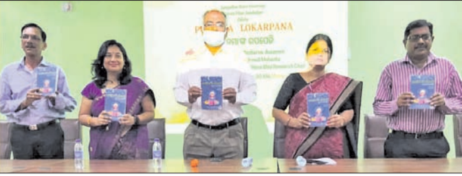
ଅତିଥିମାନେ ପୁସ୍ତକ ଉଦ୍ଘାଟନ କରୁଛନ୍ତି।

ଗଙ୍ଗାଧର ମେହେରା ବିଶ୍ୱବିଦ୍ୟାଳୟ (କିଏମ୍‌ସି) ପକ୍ଷରୁ ଓଡ଼ିଆରେ ଅନୁବାଦିତ ଯୋଗାଭ୍ୟାସ ପ୍ରସ୍ତୁତ କରାଯାଇଛି।