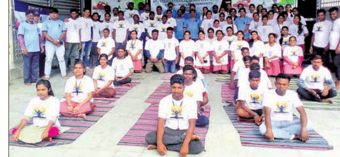
ହୋମିଓପାଥୀ କଲେଜ ପଡ଼ିଆଠାରେ ବିଶ୍ୱ ଯୋଗ ଦିବସ।

ଯୋଗ ଜୀବନକୁ ଶୁଙ୍ଖଳିତ କରିଥାଏ। ଏହି କାର୍ଯ୍ୟକ୍ରମରେ ୧୮୦ ଜଣଙ୍କୁ ଯୋଗ ପ୍ରଶିକ୍ଷଣ ଦିଆଯାଇଥିଲା।