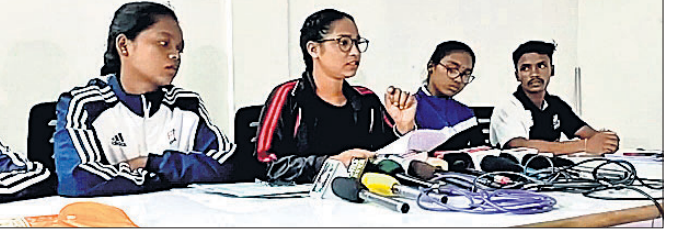
ଖବରଦାତା ସମ୍ପର୍କରେ ଉପସ୍ଥିତ ଖୋଳାଳି ।

ଆସନ୍ତା ୨୩ ତାରିଖ ରୁକୁରୀ ପୁରୀଠାରେ ହେବାକୁ ଥିବା ରାଜ୍ୟସ୍ତରୀୟ ବକ୍ସି ଚୟନ ପ୍ରତିଯୋଗିତାକୁ ସୁନ୍ଦରଗଡ଼ର ବହୁ ଖୋଳାଳି ବଞ୍ଚିତ ହେବେ । ନିର୍ଦ୍ଧାରିତ ସମୟସୀମା ପୂର୍ବରୁ ସୁନ୍ଦରଗଡ଼ର ବକ୍ସି ଖୋଳାଳିମାନଙ୍କୁ ଆରୁଆ ସୂଚନା ଦିଆ ନ ଯିବା ଓ ଲିଲାସ୍ତରୀୟ ଚୟନ ପ୍ରତିଯୋଗିତା କରାଯାଇ ନ ଥିବାରୁ ଖୋଳାଳିମାନେ ରାଜ୍ୟସ୍ତରୀୟ ଚୟନ ପ୍ରତିଯୋଗିତାରେ ଭାଗନେବାରୁ ବଞ୍ଚିତ ହେବେ ବୋଲି ରୁଧିରୀର ଲିଲା ବକ୍ସି ଖୋଳାଳିମାନଙ୍କୁ ପକ୍ଷରୁ ସ୍ଥାନୀୟ ଲିଲା ପ୍ରେସ କ୍ଲବରେ ଆୟୋଜିତ ଏକ ଖବରଦାତା ମିଳିଥିଲା । ଏହି ଅବସରରେ ଉଚ୍ଚ ରାସ୍ତା ଦେଇ ଯାତାୟତ କରୁଥିବା ଜନସାଧାରଣଙ୍କୁ ଦଳ ପକ୍ଷରୁ ମିଶ୍ରାଜ୍ୟ ବନ୍ଧନ କରାଯାଇଥିଲା ।