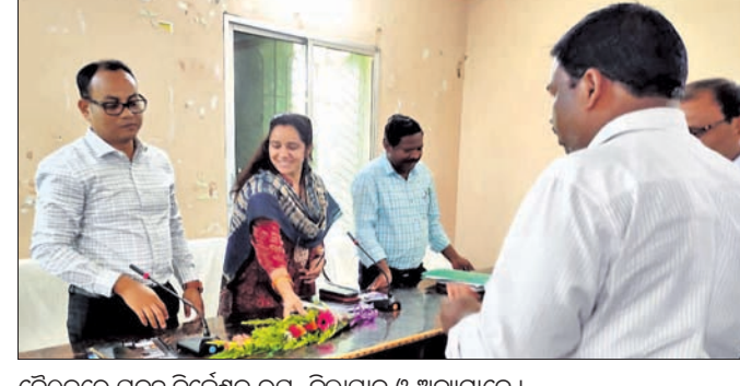
ବୈଠକରେ ପ୍ରକଳ୍ପ ନିର୍ଦ୍ଦେଶକ, ଉପ-ଜିଲ୍ଲାପାଳ ଓ ଅନ୍ୟମାନେ ।