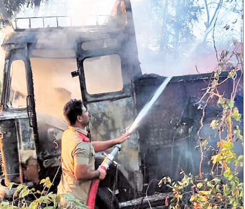
ନିଆଁକୁ ଆୟତ୍ତ କରୁଥିବା ଅଗ୍ନିଶମ କର୍ମଚାରୀ।