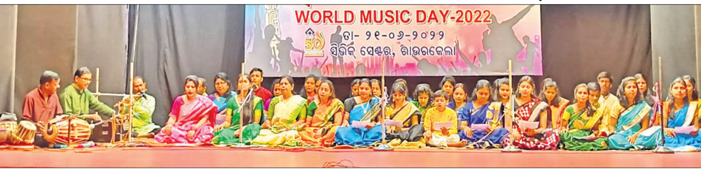
ଉତ୍ସବରେ ସଙ୍ଗୀତ ପରିବେଷଣ କରାଯାଇଛି ।