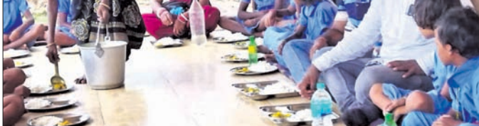
ପିଲାଙ୍କ ସହ ମଧ୍ୟାହ୍ନଭୋଜନ କରୁଛନ୍ତି ଜିଲା ପରିଷଦ ସଭ୍ୟ।