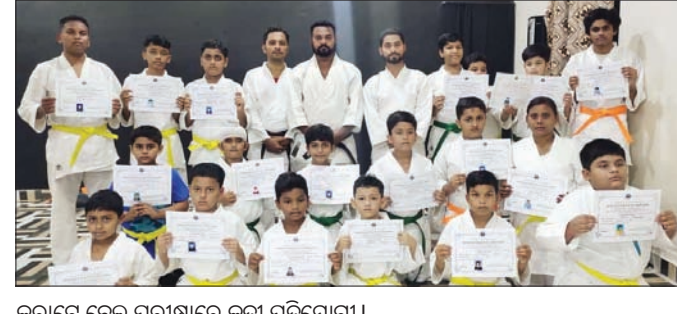
କରାଟେ ବେଲ୍ ପରୀକ୍ଷାରେ କୃତୀ ପ୍ରତିଯୋଗୀ ।