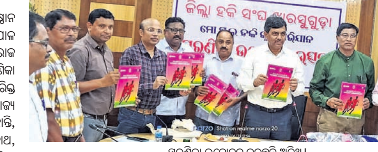
ସ୍ୱରଶିକା ଉଦ୍ଘାଟନ କରୁଛନ୍ତି ଅତିଥି।