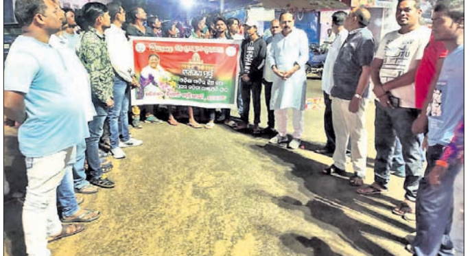
ଭାଜପା ଏସ୍‌ସି ମୋର୍ଚ୍ଚା ପକ୍ଷରୁ ଖୁସି ମନା ଯାଉଛି ।