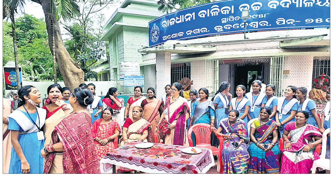
ତ୍ରୌପଦୀ ପୂର୍ଣ୍ଣିମା ଏବଂ ଚିତ୍ର ଗାୟନ ପ୍ରାର୍ଥନା ଯୋଗଣା କରିବା ପରେ ସେ ପିଲାବେଳେ ପଢୁଥିବା ରାଜଧାନୀ ବାଳିକା ଉଚ୍ଚବିଦ୍ୟାଳୟରେ ବୁଧବାର ଖୁସିର ମାହୋଳ।

ଭୁବନେଶ୍ୱର, ୨୨।୬(ସ୍ୱାଭୋ) ଏନ୍‌ଡିଏର ରାଷ୍ଟ୍ରପତି ପ୍ରାର୍ଥନା ଯୋଗଣା କରିବା ପରେ ସେ ପିଲାବେଳେ ପଢୁଥିବା ରାଜଧାନୀ ବାଳିକା ଉଚ୍ଚବିଦ୍ୟାଳୟରେ ବୁଧବାର ଖୁସିର ମାହୋଳ ସୃଷ୍ଟି କରିଥିଲେ। ଏହି ଖୁସିକୁ କାହିଁକି କରିବା ପାଇଁ ବୁଧବାର ସ୍କୁଲ ପରିସରରେ ଛାତ୍ରା ଓ ଶିକ୍ଷକ ଏବଂ କର୍ମଚାରୀ ଏକତ୍ର ହୋଇଥିଲେ।