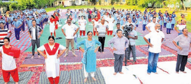
କ୍ରୀଡ଼ାକ୍ରମେ ସମେତ ଅନ୍ୟମାନେ ଯୋଗାଭ୍ୟାସ କରୁଛନ୍ତି।