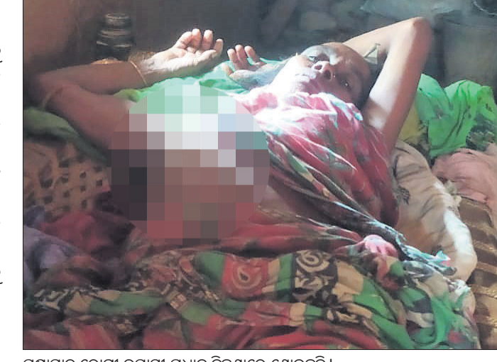
ପକ୍ଷାଘାତ ରୋଗୀ ଉପାସୀ ପ୍ରଧାନ ବିଶ୍ୱାସରେ ଶୋଇଛନ୍ତି ।

ସମାଜର ଅସୁଖ୍ୟତା ଭଳି କୁସଂସ୍କାରକୁ ଦୂରକରାକୁ ସରକାର ଯେତେ ଆଇନ କିମ୍ବା ସୁବିଧା ସୁଯୋଗ ସୃଷ୍ଟି କଲେ ମଧ୍ୟ ସଭ୍ୟ ସମାଜରେ ତାହାର ପ୍ରଭାବ ପଡ଼ିପାରୁନାହିଁ । ଯଦିଓ ସରକାରୀ ଅନୁଷ୍ଠାନ କିମ୍ବା ସହାୟକରେ ଲୋକଙ୍କ ମଧ୍ୟରେ ଅସୁଖ୍ୟତାକୁ ନେଇ ସଚେତନତା ସୃଷ୍ଟି ହୋଇଛି, ଗ୍ରାମାଞ୍ଚଳ ଲୋକମାନେ ଏବେ ମଧ୍ୟ ଏହି କୁସଂସ୍କାର ଶିକାର ହୋଇ ରହିଛନ୍ତି । ପ୍ରତ୍ୟେକ ଗ୍ରାମକୁ ଗଲେ ହରିଜନ ବସ୍ତି ଅନ୍ୟ ବର୍ଗର ଲୋକଙ୍କଠାରୁ ଅଲଗା । ଏହିସବୁ ବସ୍ତିର ଲୋକମାନେ କୌଣସି ସମସ୍ୟାର ସମ୍ମୁଖିନ ହେଲେ ସହଜରେ ତାହାର ସମାଧାନ ହୋଇ ନ ଥାଏ । ବୌଦ୍ଧ ଜିଲ୍ଲା ହରଭଙ୍ଗା ରୁକ୍ଷ ଅନ୍ତର୍ଗତ ବାମଣ୍ଡା ପଞ୍ଚାୟତର ଖଣ୍ଡବର ଗ୍ରାମର ଏହିଭଳି ଏକ ଘଟଣା ଏବେ ସାଧାରଣରେ ଚର୍ଚ୍ଚାର ବିଷୟ ପାଲଟିଛି । ସୂଚନା ମୁତାବକ ଖଣ୍ଡବର ଗ୍ରାମର ଉପାସୀ