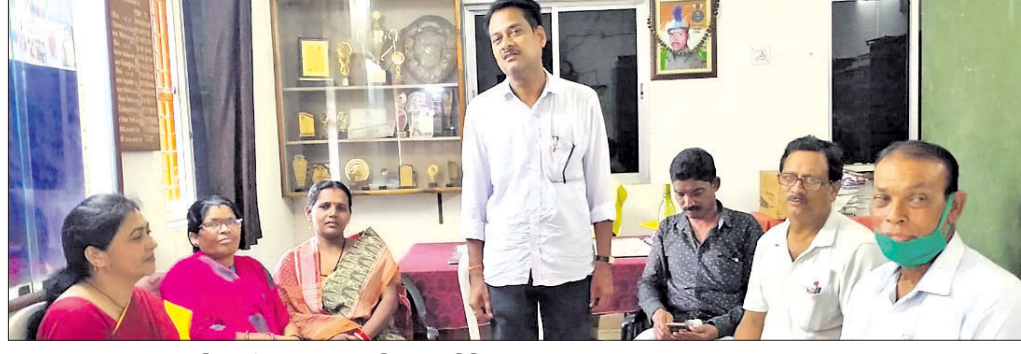
ସ୍କୁଲ ସୁରକ୍ଷାକୁ ନେଇ ଅନୁଷ୍ଠିତ ବୈଠକରେ ପ୍ରଧାନଶିକ୍ଷକ, କମିଟି ସଭ୍ୟସଭ୍ୟ ।