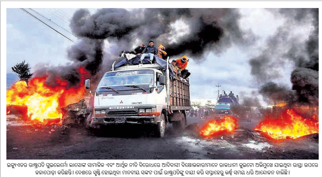
ଜମ୍ମୁ ଏବଂ କାଶ୍ମୀରରେ ଗୁଲଜେମେଂ ଲାସୋଙ୍କ ସାମାଜିକ ଏବଂ ଆର୍ଥିକ ନୀତି ବିରୋଧରେ ଆଦିବାସୀ ବିରୋଧକାରୀମାନେ ରାଜଧାନୀ କୁଳଗେ ଅଭିମୁଖେ ଯାଇଥିବା ରାସ୍ତା ଉପରେ ଜଳାପୋତା କରିଛନ୍ତି। ଦେଶରେ ସୁଷ୍ଟ ହୋଇଥିବା ମାନବୀୟ ସଙ୍କଟ ପାଇଁ ରାଷ୍ଟ୍ରପତିଙ୍କୁ ଦାୟୀ କରି ସପ୍ତାହକୁ ଉର୍ଦ୍ଧ୍ୱ ସମୟ ଧରି ଆନ୍ଦୋଳନ ଚାଲିଛି।

ସଂକ୍ଷେପରେ ଯୁଦ୍ଧରେ ବୁଲୁଡ଼ୋଜର ଆକ୍ରମଣ ବେଆଇନ ସିଦ୍ଧେଆଇଙ୍କୁ ଚିଠି ଲେଖିଲେ ପୂର୍ବତନ ଅଧିକାରୀ