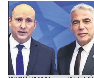
ନେଫଟାଲି ବେନେଟ ଯେରୁଜେଲମ

ଜେରୁଜେଲମ, ୨୨: ଇସ୍ରାଏଲରେ ପ୍ରଧାନମନ୍ତ୍ରୀ ନାଫଟାଲି ବେନେଟଙ୍କ ସରକାର ସଂଖ୍ୟାଲଘୁ ହେବା ପରେ ସେଠାରେ ପୁଣି ରାଜନୈତିକ ସଙ୍କଟ ଦେଖାଦେଇଛି। ବେନେଟଙ୍କ ମେଣ୍ଟ ଦେଖାଦେଇଛି।