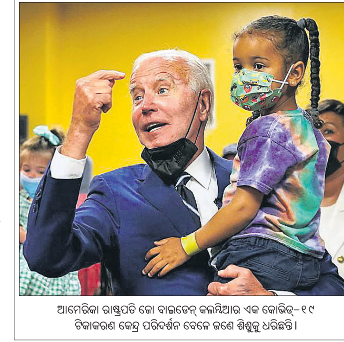
ଆମେରିକା ରାଷ୍ଟ୍ରପତି ଜୋ ବାଇଡେନ୍ କଲମ୍ବିଆର ଏକ କୋଭିଡ୍-୧୯ ଚିକିତ୍ସା କେନ୍ଦ୍ର ପରିଦର୍ଶନ ବେଳେ ଜଣେ ଶିଶୁକୁ ଧରିଛନ୍ତି।

ଖର୍ଚ୍ଚ, ୨୨: ୟୁକ୍ରେନ୍ ବିତାଣ ବୃହତ୍ତମ ସହର ଖର୍ଚ୍ଚିକ ଏବଂ ଏହାର ଆଖପାଖ ଅଞ୍ଚଳରେ ରୁଷିଆ ଏକାଧିକ ରକେଟ ମାଡ଼ କରିଛି। ଏଥିରେ ଅନୁମିତ ୨୦ ଜଣଙ୍କ ମୃତ୍ୟୁ ଘଟିଥିବା କିଛି ପକ୍ଷରୁ ଜଣାଯାଇଛି।