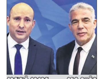
ନେଫଟାଲି ବେନେଟ ଏବଂ ଯେରୁଜେଲମ

ଜେରୁଜେଲମ, ୨୨: ଇସ୍ରାଏଲରେ ପ୍ରଧାନମନ୍ତ୍ରୀ ନାଫଟାଲି ବେନେଟଙ୍କ ସରକାର ସଂଖ୍ୟାଲଘୁ ହେବା ପରେ ସେଠାରେ ପୁଣି ରାଜନୈତିକ ସଙ୍କଟ ଦେଖାଦେଇଛି। ବେନେଟଙ୍କ ମେଣ୍ଟ ସରକାର ଭାଙ୍ଗିବା ନିମନ୍ତେ ରୁଧିର ଉଦ୍ଦେଶ୍ୟ ପାଇଁ ଚାଲିଥିବା ନିର୍ବାଚନରେ ଏକ ବିଲ୍ ପାରିତ ହୋଇଛି।