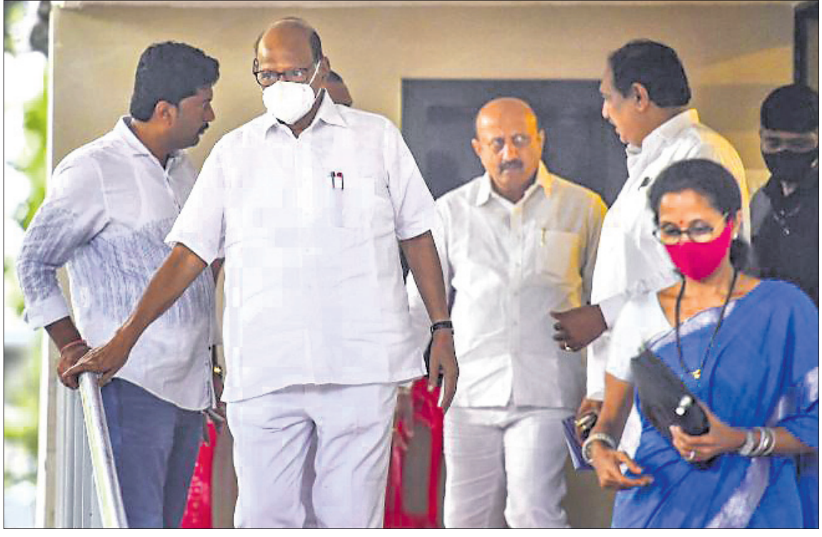
ମୁଖ୍ୟମନ୍ତ୍ରୀ ନରୀନ ସିଂହଙ୍କ ସମେତ ବିଧାନମଣ୍ଡଳର ବିଧାନ ସଭା ସଭ୍ୟମାନଙ୍କ ସହ ବିଧାନ ସଭାରେ ମୁଖ୍ୟମନ୍ତ୍ରୀଙ୍କ ସମ୍ମାନାର୍ଥେ ପ୍ରାର୍ଥନା କରୁଥିବା ଦୃଶ୍ୟ।