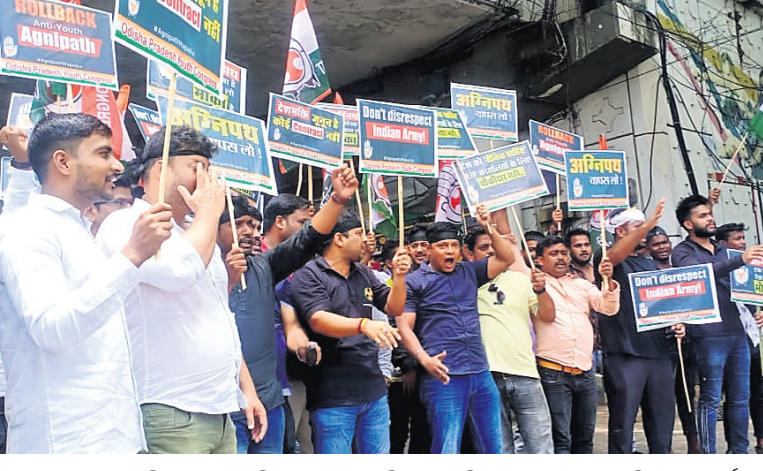
ଭୁବନେଶ୍ୱର ଜୟଦେବ ବିହାରୀରେ ଅଗ୍ନିପଥ ଯୋଜନାକୁ ବିରୋଧ କରି ଯୁବ କଂଗ୍ରେସ ପକ୍ଷରୁ ବିରୋଧ ପ୍ରଦର୍ଶନ।

ଭୁବନେଶ୍ୱର, ୨୨(ବ୍ୟବସାୟ): ପ୍ରତି ଥିବା ଉତ୍ସର୍ଗାତ୍ମକ ସେବା ମନୋଭାବ ପ୍ରଦର୍ଶନ କରିଆସିଛନ୍ତି। ମାତ୍ର ମୋଦି ସରକାର ଏହି ସୈନିକମାନଙ୍କ ରମିନା ଓ ପରମ୍ପରାକୁ ସ୍ତବ୍ଧ କରିବାକୁ ଉଦ୍ଦେଶ୍ୟ କରିଥିବା ଯୁବ କଂଗ୍ରେସ ପକ୍ଷରୁ ଅଭିଯୋଗ କରାଯାଇଛି।