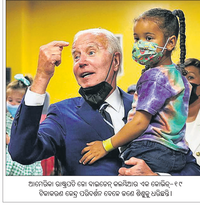
ଆମେରିକା ରାଷ୍ଟ୍ରପତି ଜୋ ବାଇଡେନ୍ କଲମ୍ବିଆର ଏକ କୋଭିଡ୍-୧୯ ଚିକାକରଣ କେନ୍ଦ୍ର ପରିଦର୍ଶନ ବେଳେ ଜଣେ ଶିଶୁକୁ ଧରିଛନ୍ତି।

ଖର୍ଚ୍ଚରେ ୨୨: ୟୁକ୍ରେନ୍ ବିତାଣ ବୃହତ୍ ସହର ଖର୍ଚ୍ଚିକ ଏବଂ ଏହାର ଆଖପାଖ ଅଞ୍ଚଳରେ ରୁଷିଆ ଏକାଧିକ ରକେଟ ମାଡ଼ କରିଛି। ଏଥିରେ ଅନୁମିତ ୨୦ ଜଣଙ୍କ ମୃତ୍ୟୁ ଘଟିଥିବା କିଛି ପକ୍ଷରୁ ଜଣାଯାଇଛି।