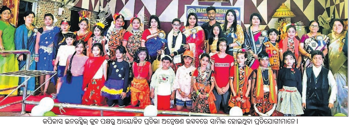
କପିଳାସ ଲନରହିଲ୍ କୁଳ ପକ୍ଷରୁ ଆୟୋଜିତ ପ୍ରତିଭା ଅବେଷଣ ଉତ୍ସବରେ ସାମିଲ ହୋଇଥିବା ପ୍ରତିଯୋଗୀମାନେ।