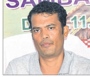
ଖବରଦାତା ସମ୍ମିଳନୀରେ ତିଏପ୍‌ଓ ସୂଚନା ଦେଇଛନ୍ତି।