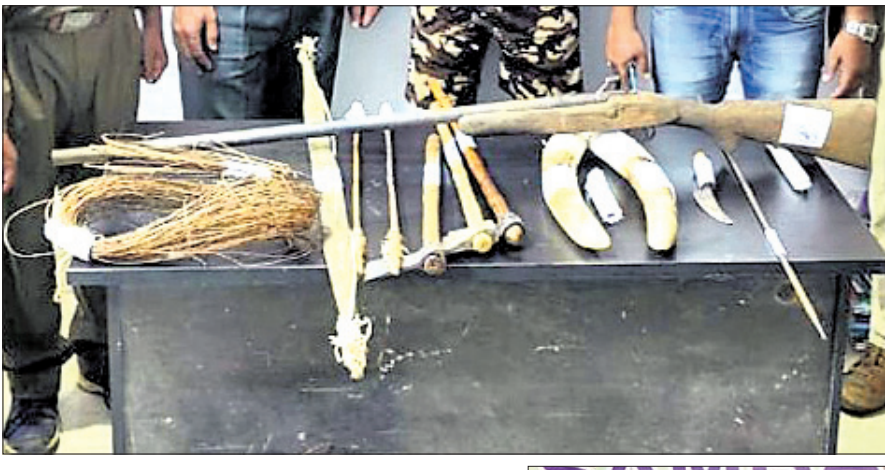
ଜବତ ହୋଇଥିବା ସାମଗ୍ରୀ।