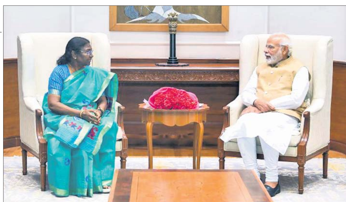
ନୂଆଦିଲ୍ଲୀରେ ଗୁରୁବାର ପ୍ରଧାନମନ୍ତ୍ରୀ ନରେନ୍ଦ୍ର ମୋଦିଙ୍କୁ ସାକ୍ଷାତ୍ କରୁଛନ୍ତି ଏନ୍ଡିଏର ରାଷ୍ଟ୍ରପତି ପ୍ରାର୍ଥୀ ଦ୍ରୌପଦୀ ମୁର୍ମୁ।