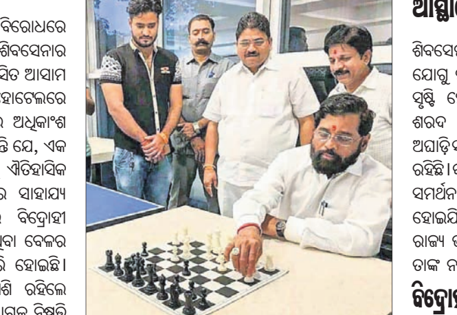
କୁଆହାଟୀରେ ରେଡିସିଅର୍ ଲୁକ୍ଷ ହୋଟେଲରେ ଏକନାଥ ସିନ୍ଧେ ଚେଷ୍ଟା କରୁଛନ୍ତି।

ମୁମ୍ବାଇ/କୁଆହାଟୀ, ୨୩।୬ ମହାରାଷ୍ଟ୍ର ମୁଖ୍ୟମନ୍ତ୍ରୀ ଉଦ୍ଧବ ଠାକରେଙ୍କ ବିରୋଧରେ ସବୁଠୁ ବଡ଼ ଚ୍ୟାଲେଞ୍ଜର ସାଜିଥିବା ଶିବସେନାର ବିଦ୍ରୋହୀ ନେତା ଏକନାଥ ସିନ୍ଧେ ଭାଜପା ଶାସିତ ଆସାମ ରାଜଧାନୀ କୁଆହାଟୀରେ ରେଡିସିଅର୍ ଲୁକ୍ଷ ହୋଟେଲରେ ଅବସ୍ଥାନ କରୁଛନ୍ତି। ତାଙ୍କ ସହ ଶିବସେନାର ଅଧିକାଂଶ ବିଧାୟକ ଅଛନ୍ତି। ସିନ୍ଧେ ସେମାନଙ୍କୁ ବୁଝାଇଥିବା ବେଳେ ଭିତ୍ତିପୁ ମୁଖ୍ୟମନ୍ତ୍ରୀ ତାଙ୍କ ବାସଭବନକୁ ଜାରି ହୋଇଛି। ଭିତ୍ତିପୁରେ ସିନ୍ଧେ ଆହୁରି କହିଛନ୍ତି, ମିଳିମିଶି ରହିଲେ ଆମର ବିଜୟ ସୁନିଶ୍ଚିତ। ସର୍ବସମ୍ପର୍କରେ ଆଗକୁ ନିଷ୍ପତ୍ତି ନେବା। ପ୍ରକାଶ ଯେ, ସିନ୍ଧେଙ୍କ ଶିବସେନା ୩୬ ଶିବସେନା ବିଦ୍ରୋହୀଙ୍କ ସହ ୯ ସ୍ୱାଧୀନ ବିଧାୟକ ତେରା ପକାଇଛନ୍ତି।