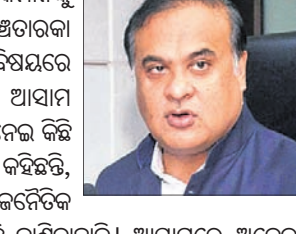
ଶିବସେନା ବିଦ୍ରୋହୀ ବିଧାୟକମାନଙ୍କୁ କୁଆହାଟୀରେ ଏକ ପଞ୍ଚତାରକା ହୋଟେଲରେ ରଖାଯାଇଥିବା ବିଷୟରେ ଦେଖାଯାଏ ଅବଗତ। କିନ୍ତୁ ଆସାମ ମୁଖ୍ୟମନ୍ତ୍ରୀ ହିମନ୍ତ ବିଶ୍ୱଶର୍ମା ଏନେଇ କିଛି କାଣି ନ ଥିବା କହିଛନ୍ତି। ହିମନ୍ତ କହିଛନ୍ତି, ମହାରାଷ୍ଟ୍ରରେ ରାଜିଥିବା ରାଜନୈତିକ ଉଠାପକା ସମ୍ପର୍କରେ ସେ କିଛି ଜାଣିନାହାନ୍ତି। ଆସାମରେ ଅନେକ ଭଲ ହୋଟେଲ ଅଛି। କିନ୍ତୁ କୌଣସି ହୋଟେଲରେ ମହାରାଷ୍ଟ୍ର ବିଧାୟକମାନେ ରହୁଥିବା ନେଇ ସେ କିଛି ଜାଣିନାହାନ୍ତି। ଅନ୍ୟ ରାଜ୍ୟର ବିଧାୟକମାନେ ମଧ୍ୟ ଆସି ରହିପାରିବେ ବୋଲି ବିଶ୍ୱଶର୍ମା କହିଛନ୍ତି।

ଯୋଷା ପାଇଁ ଶିବସେନା ଦାବି କରିବ। ମହାରାଷ୍ଟ୍ର ବିଧାନସଭା ଉପବାଚସ୍ପତିକ ନିକଟରେ ୧୫ ବିଧାୟକଙ୍କ ସଦସ୍ୟତା ରଦ୍ଦ ପାଇଁ ଆବେଦନ କରିବାକୁ ନିଷ୍ପତ୍ତି ହୋଇଥିବା ଜଣାପଡ଼ିଛି। ଘୋଡେ କିଛି ଜଣାଦାହିଁ: ବିଶ୍ୱଶର୍ମା ଶିବସେନାର ବିଦ୍ରୋହୀ ବିଧାୟକମାନଙ୍କୁ କୁଆହାଟୀରେ ଏକ ପଞ୍ଚତାରକା ହୋଟେଲରେ ରଖାଯାଇଥିବା ବିଷୟରେ ଦେଖାଯାଏ ଅବଗତ। କିନ୍ତୁ ଆସାମ ମୁଖ୍ୟମନ୍ତ୍ରୀ ହିମନ୍ତ ବିଶ୍ୱଶର୍ମା ଏନେଇ କିଛି କାଣି ନ ଥିବା କହିଛନ୍ତି। ହିମନ୍ତ କହିଛନ୍ତି, ମହାରାଷ୍ଟ୍ରରେ ରାଜିଥିବା ରାଜନୈତିକ ଉଠାପକା ସମ୍ପର୍କରେ ସେ କିଛି ଜାଣିନାହାନ୍ତି। ଆସାମରେ ଅନେକ ଭଲ ହୋଟେଲ ଅଛି। କିନ୍ତୁ କୌଣସି ହୋଟେଲରେ ମହାରାଷ୍ଟ୍ର ବିଧାୟକମାନେ ରହୁଥିବା ନେଇ ସେ କିଛି ଜାଣିନାହାନ୍ତି। ଅନ୍ୟ ରାଜ୍ୟର ବିଧାୟକମାନେ ମଧ୍ୟ ଆସି ରହିପାରିବେ ବୋଲି ବିଶ୍ୱଶର୍ମା କହିଛନ୍ତି।