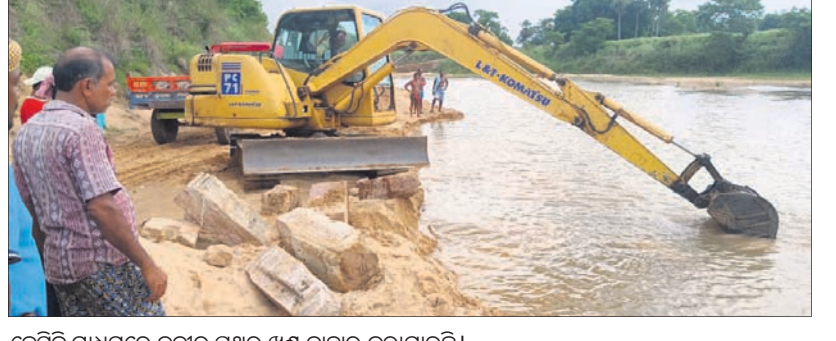
କେସିବି ମାଧ୍ୟମରେ ନଦୀରୁ ପଥର ଖଣ୍ଡ ବାହାର କରାଯାଇଛି।

ଧାମନଗର, ୨୩୬ (ଡି.ଏ.ଏ.) ଉତ୍ତର ଓଡ଼ିଶା ଉପତ୍ୟକାରେ ଥିବା ଧାମନଗର ବ୍ଲକ୍ ଅନ୍ତର୍ଭୁକ୍ତ ପଞ୍ଚାୟତ ବାଲିପାଟଣା ଗ୍ରାମ ନିକଟ ବୈତରଣୀ ନଦୀରୁ ଗୁରୁବାର ମଧ୍ୟାହ୍ନରେ ପ୍ରାଚୀନ ମନ୍ଦିର ପଥରଖଣ୍ଡ ଉଦ୍ଧାର କରାଯାଇଛି। ଏଠାରେ ଥିବା ବାସୁଦେବ ପୀଠରୁ ନଦୀରୁ କେସିବି ଦ୍ୱାରା ବାଲି ଉଦ୍ଧାରଣ ବେଳେ ଏହି ପଥର ଖଣ୍ଡ ମିଳିଛି। ପ୍ରକାଶ ଯେ, ନିଳାମରେ ନେଇଥିବା ବ୍ୟକ୍ତି ଏହି ଘାଟରୁ ବାଲି ଉଦ୍ଧାରଣ କରାଉଥିବା ବେଳେ କେସିବିର ଅନୁରୋଧ ପଥରରେ ବାଜିଥିଲା। ଖୋଳାଯିବାରୁ ପ୍ରାଚୀନ ମନ୍ଦିରର ଭଗ୍ନାବଶେଷ ଭଳି ପ୍ରାଚୀନ ପ୍ରସ୍ତର ଖଣ୍ଡ ଦେଖିବାକୁ ମିଳିଥିଲା। ଏଠାରେ ପ୍ରାଚୀନ ମନ୍ଦିର ଥିବା ଅନୁମାନ କରି ଖୋଳାଯାଇଥିଲା। ବହୁ ପ୍ରାଚୀନ ପଥର ସହ ମନ୍ଦିରର ଗମ୍ଭୁଜ, ବୁଲି, ଦଧିନିଭିତ୍ତରେ ବ୍ୟବହୃତ ପଥର ଖଣ୍ଡ ବାହାର ହେଲା। ଏ ବିଷୟରେ ପ୍ରାଚୀନ ହେବା ମାତ୍ରେ ଦେଖିବା ପାଇଁ ଲୋକଙ୍କ ଭିଡ଼ ଜମିଥିଲା। ରାଜ୍ୟ ସରକାର ଓ ପ୍ରକୃତ ବିଭାଗ ଏହି ପୀଠ ପ୍ରତି ଦୃଷ୍ଟି ଦେବା ସହ ଗବେଷଣା କଲେ ପ୍ରାଚୀନ କାର୍ତ୍ତିକ ଉଦ୍ଧାର ସହ ନଦୀର ଉଦ୍ଧାର ବାହାରୁଥିବା ପ୍ରାଚୀନ ମନ୍ଦିର ଅଂଶବିଶେଷ ଉଦ୍ଧାର କରାଯାଇଛି।