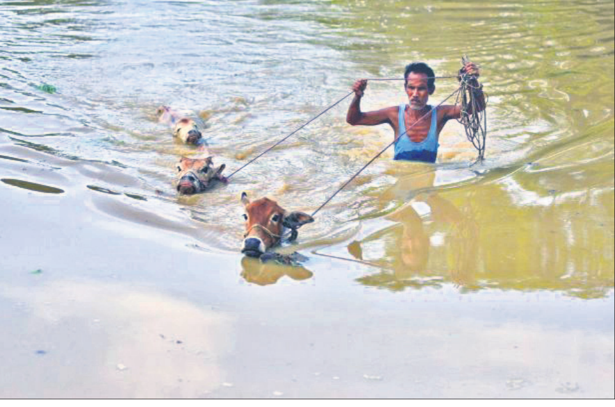
ଆସାମର ନଗାଓ ଜିଲାର ଜଣେ ବ୍ୟକ୍ତି ତାଙ୍କ ଗୃହପାଳିତ ପ୍ରାଣୀକୁ ଉଦ୍ଧାର କରୁଛନ୍ତି।