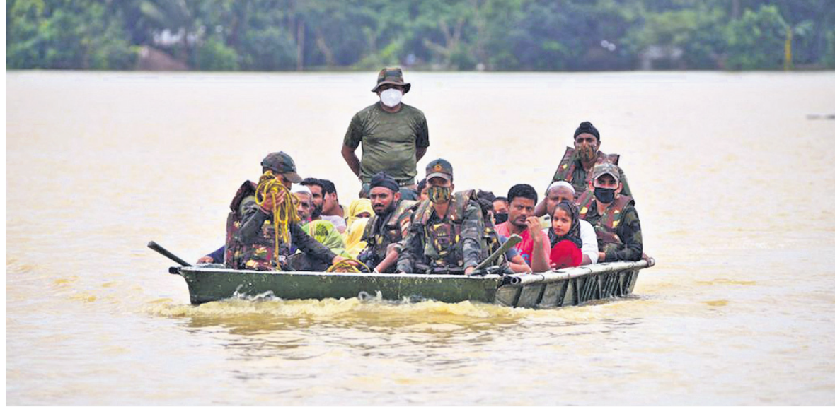
ଆସାମର ହୋକାଲ ଜିଲାର ବନ୍ୟା ପ୍ରଭାବିତକୁ ଭାରତୀୟ ସେନା ପକ୍ଷରୁ ଉଦ୍ଧାର କରାଯାଇ ସୁରକ୍ଷିତ ସ୍ଥାନକୁ ନିଆଯାଇଛି।