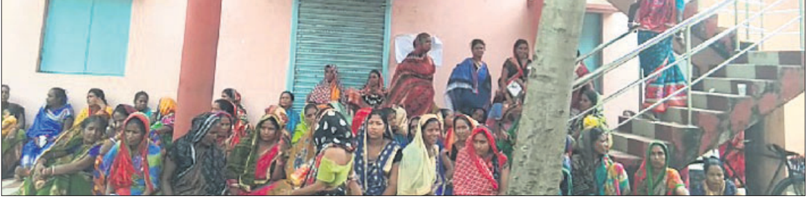
ଧାମନଗର ସେବା ସମବାୟ ସମିତି ସଭ୍ୟମାନେ ଧାରଣାରେ ଚାଷୀ ଓ ମହିଳା।

ଧାମନଗର, ୨୩୬(ଏ.ପ୍ର.) ଉତ୍ତମ ଲିମ୍ବା ଧାମନଗର ସେବା ସମବାୟ ସମିତିରେ ବିବାଦ ସିଧା ହୋଇଛି। ଏହି ବିବାଦ ଯୋଗୁ ୧୫ ଦିନ ହେଲା କାର୍ଯ୍ୟାଳୟରେ ତାଲା ଛୁଇଁଛି। ଏନେଇ ବାରମ୍ବାର ପ୍ରଶାସନକୁ ଜଣାଇବା ପରେ ସୁଧାକ ନିଳିକାକୁ ଏହାର ପ୍ରତିବାଦରେ ଗୁରୁବାର ପୂର୍ବାହ୍ନରେ ଚାଷୀ ଓ ମହିଳାମାନେ ସମିତିକାର୍ଯ୍ୟାଳୟ ସମ୍ମୁଖରେ ଧାରଣା ଦେଇଥିଲେ। ଯଥାଶୀଘ୍ର ସମିତି କାର୍ଯ୍ୟାଳୟ ଖୋଲିବା ଏବଂ ନିର୍ବାଚନ ଦାୟିତ୍ୱରେ ଥିବା ସମ୍ପାଦକଙ୍କୁ ପରିବର୍ତ୍ତନ କରି ରଖିବା ନିର୍ବାଚନ ପରିଚାଳନା ଦାୟିତ୍ୱରେ ଥିବା ନବନିଯୁକ୍ତ ସମ୍ପାଦକ ସେବେଠାରୁ ସମିତିକୁ ନ ଆସିବାକୁ କାର୍ଯ୍ୟାଳୟରେ ତାଲା ଛୁଇଁଛି। ଚାଷୀମାନେ ଧାରଣାରେ ବସିବା ସହ ଲିମ୍ବାପାଳ, ଲିମ୍ବା ନିର୍ବାଚନ ଅଧିକାରୀ ଓ ଏଆର୍ସିଏସ୍‌ସ୍‌ ନିକଟରେ ଲିଖିତ ଅଭିଯୋଗ କରି ସମସ୍ୟା ସମାଧାନ ପାଇଁ ଦାବି କରିଛନ୍ତି। ଏ ସମ୍ପର୍କରେ ନବନିଯୁକ୍ତ ସମ୍ପାଦକ ଅଭିଯୋଗ ପତ୍ରକୁ ପଚାରିବାକୁ ପୂର୍ବରୁ ସମ୍ପାଦକ ତାଙ୍କୁ ସମ୍ପୂର୍ଣ୍ଣ ଭାବେ ଦାୟିତ୍ୱ ହସ୍ତାନ୍ତର କରି ନ ଥିବା ଯୋଗୁ ସେ ସମିତିକୁ ଆସୁ ନ ଥିବା କହିଛନ୍ତି।