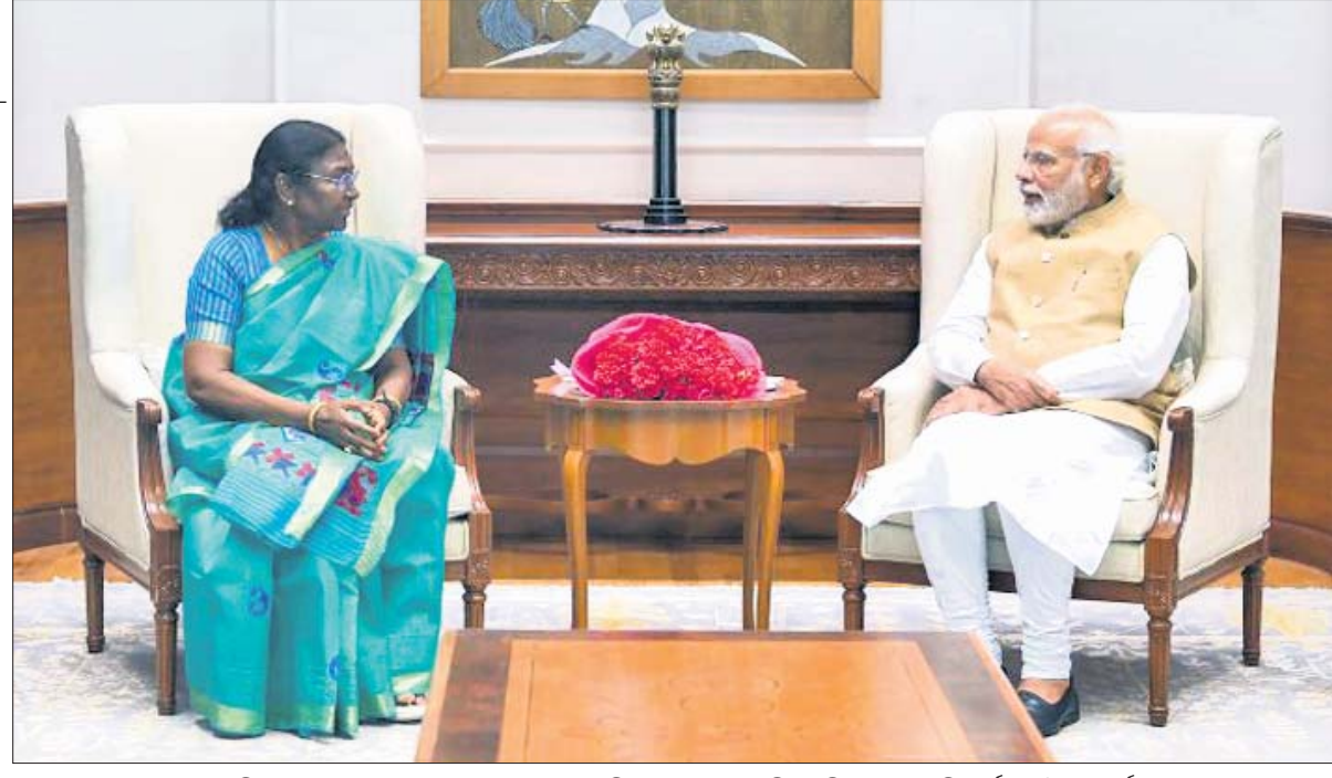
ନୂଆଦିଲ୍ଲୀରେ ଗୁରୁବାର ପ୍ରଧାନମନ୍ତ୍ରୀ ନରେନ୍ଦ୍ର ମୋଦିଙ୍କୁ ସାକ୍ଷାତ୍ କରୁଛନ୍ତି ଏନ୍ସିପିର ରାଷ୍ଟ୍ରପତି ପ୍ରାର୍ଥୀ ଦ୍ରୌପଦୀ ମୁର୍ମୁ।