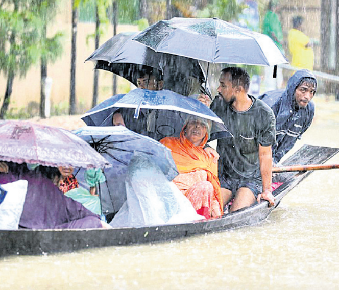
ବାଂଲାଦେଶର ସିଲହେଟ୍ରେ ବନ୍ୟା ପ୍ରପାତ୍ତିତ ଜଣା ଯୋଗେ ସୁରକ୍ଷିତ ସ୍ଥାନକୁ ଯାଇଛନ୍ତି।