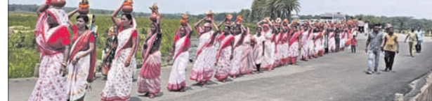
ମହିଳାମାନେ କଳସ ଶୋଭାଯାତ୍ରାରେ ଯାଉଛନ୍ତି।

ମୃତ୍ୟୁରୁଦ୍ଧା ଜିଲ୍ଲା ମୋରଡ଼ା ବ୍ଲକ୍ ଅଧୀନ ହଳଦୀପାଳ ଗ୍ରାମସ୍ଥିତ ମା' ଶୀତଳାଙ୍କ ପୀଠର ପ୍ରତିଷ୍ଠା ଉତ୍ସବ ଅନୁଷ୍ଠିତ ହୋଇଯାଇଛି। ବୁଧବାର ପୀଠରେ ଉପସ୍ଥିତ ହୋଇଥିଲେ। ପୂର୍ବାହ୍ନ ୧୦ଟାରେ ନିକଟସ୍ଥ ରାଜାବନ୍ଧୁ ୧୦୮ ଭକ୍ତ କଳସ ଶୋଭାଯାତ୍ରାରେ ଆସି ମା'ଙ୍କ ପୀଠରେ ପହଞ୍ଚିଥିଲେ। ପୂଜାରୀ ଓ ୭ଜଣ ବେହୁରୀ ମା'ଙ୍କ ସହଯୋଗ କରିଥିଲେ।