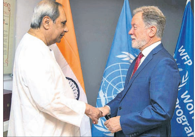
ଡବ୍ଲୁଏସ୍ପି ଏକ୍ସିକ୍ୟୁଟିଭ ଡାଇରେକ୍ଟର ଡେଭିଡ୍ ବିସ୍ୱଲେଙ୍କ ସହ ମୁଖ୍ୟମନ୍ତ୍ରୀ ନବୀନ ପଟ୍ଟନାୟକଙ୍କ କରମର୍ଦ୍ଦନ କରୁଛନ୍ତି।

ଭୁବନେଶ୍ୱର, ୨୪।୬(ବୁଧବୋ) ମୁଖ୍ୟମନ୍ତ୍ରୀ ନବୀନ ପଟ୍ଟନାୟକ ଶୁକ୍ରବାର ରୋମ୍ବିଡ଼ି ବିଶ୍ୱ ଖାଦ୍ୟ କାର୍ଯ୍ୟକ୍ରମ (ଡବ୍ଲୁଏସ୍ପି) ମୁଖ୍ୟାଳୟରେ ଅନୁଷ୍ଠିତ ଏକ କାର୍ଯ୍ୟକ୍ରମରେ ଯୋଗ ଦେଇଛନ୍ତି। ଓଡ଼ିଶାରେ ଗରିବ, ମହିଳାଙ୍କ ଜୀବନକାବିକା, ଖାଦ୍ୟ ସୁରକ୍ଷା କାର୍ଯ୍ୟକ୍ରମକୁ କିଛି ସୁଦୃଢ଼ କରାଯାଇପାରିଛି, ସେ ସମ୍ପର୍କରେ ମୁଖ୍ୟମନ୍ତ୍ରୀ ସୂଚନା ଦେବାସହ ପ୍ରାକୃତିକ ବିପର୍ଯ୍ୟୟ ପରିଚାଳନା ସଫଳତା ବୃଦ୍ଧି ପାଇଥିଲା। ଓଡ଼ିଶା ସରକାରଙ୍କ ବିପର୍ଯ୍ୟୟ ପରିଚାଳନା, ଖାଦ୍ୟ ସୁରକ୍ଷା, ଖାଦ୍ୟ ଉତ୍ପାଦନ କ୍ଷେତ୍ରରେ ହେଉଥିବା ରୂପାନ୍ତରଣକୁ ଡବ୍ଲୁଏସ୍ପି ପକ୍ଷରୁ ଉଚ୍ଚ ପ୍ରଶଂସା କରାଯାଇଛି। ଡବ୍ଲୁଏସ୍ପି ଏକ୍ସିକ୍ୟୁଟିଭ ଡାଇରେକ୍ଟର ଡେଭିଡ୍ ବିସ୍ୱଲେ ଏବଂ ତାଙ୍କ ଟିମ୍ ସଦସ୍ୟଙ୍କ ଉପସ୍ଥିତିରେ ମୁଖ୍ୟମନ୍ତ୍ରୀ ଅଭିଭାଷଣ ଦେଇ କହିଲେ, ଗତ ଦୁଇଦଶନ୍ଧି ଧରି ଖାଦ୍ୟ ଉତ୍ପାଦନ,