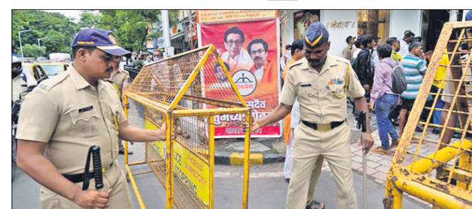
କରିଛନ୍ତି। ମୁଖ୍ୟମନ୍ତ୍ରୀ ଉତ୍ତର ଠାକୁରେଙ୍କୁ ସମର୍ଥନ କରି ଦଳର କ୍ଷୁଦ୍ର ସଂଖ୍ୟାରେ ମନ୍ତ୍ରଣା ହୋଇଛି। ପାଠାଙ୍କ ସହ ଚଳ ପୁରୁତା ତଥା ମହାରାଷ୍ଟ୍ର ଉପମୁଖ୍ୟମନ୍ତ୍ରୀ ଅଜିତ୍ ପାଠା, କ୍ୟାବିନେଟ ମନ୍ତ୍ରୀ ଜୟନ୍ତ ପାଟିଲ ଏବଂ ଏନ୍.ସି.ପି. ନେତା ପ୍ରଫୁଲ୍ଲ ପଟେଲ ଉତ୍ତର ଠାକୁରେଙ୍କୁ 'ମାତୋଗ୍ରୀ'ରେ ଭେଟିଛନ୍ତି। ତେବେ ସେମାନଙ୍କ ମଧ୍ୟରେ ନିର୍ଦ୍ଦେଶ ଭାବେ କ'ଣ ଆଲୋଚନା ହୋଇଥିଲା ତାହା ଜଣାପଡ଼ି ନାହିଁ।

ମହାରାଷ୍ଟ୍ରରେ ଶିବସେନା ବିଦ୍ରୋହୀଙ୍କ ବିରୋଧରେ ଏବଂ ମୁଖ୍ୟମନ୍ତ୍ରୀ ଉତ୍ତର ଠାକୁରେଙ୍କୁ ସମର୍ଥନ କରି ଦଳର କ୍ଷୁଦ୍ର ସଂଖ୍ୟାରେ ମନ୍ତ୍ରଣା ହୋଇଛି। ପାଠାଙ୍କ ସହ ଚଳ ପୁରୁତା ତଥା ମହାରାଷ୍ଟ୍ର ଉପମୁଖ୍ୟମନ୍ତ୍ରୀ ଅଜିତ୍ ପାଠା, କ୍ୟାବିନେଟ ମନ୍ତ୍ରୀ ଜୟନ୍ତ ପାଟିଲ ଏବଂ ଏନ୍.ସି.ପି. ନେତା ପ୍ରଫୁଲ୍ଲ ପଟେଲ ଉତ୍ତର ଠାକୁରେଙ୍କୁ 'ମାତୋଗ୍ରୀ'ରେ ଭେଟିଛନ୍ତି। ତେବେ ସେମାନଙ୍କ ମଧ୍ୟରେ ନିର୍ଦ୍ଦେଶ ଭାବେ କ'ଣ ଆଲୋଚନା ହୋଇଥିଲା ତାହା ଜଣାପଡ଼ି ନାହିଁ।