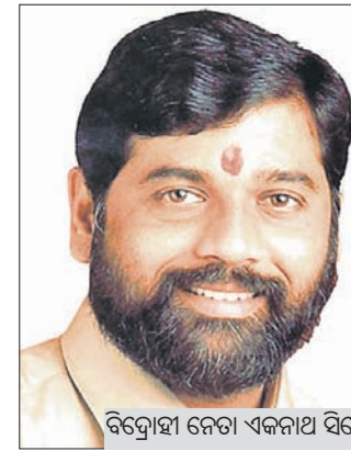
ବିଦ୍ରୋହୀ ନେତା ଏକନାଥ ସିଂହେ