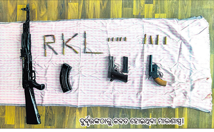
ଦୁର୍ଭିକ୍ଷତାରୁ ଜବତ ହୋଇଥିବା ମାରଣାସ୍ତ୍ର।

ସହ ଆପରାଧୀକାରୀଙ୍କୁ ଧରିବାରେ ବ୍ୟବହାର କରୁଥିବା ଆଲୋଚନା ହେଉଛି। ପୋଲିସ୍ ସୂଚନା ଅନୁସାରେ, ଶନିବାର ସକାଳ ସାଢ଼େ ୧୦ଟାରେ ଖାଡ଼ଖଣ୍ଡ ରାଜ୍ୟ ଗୁମାସ୍ତା ଜିଲାର ବସିଆ ଗ୍ରାମର ବିଶ୍ୱାଳ ଓ ତୁରୁ ଏକ କାର୍ (ନଂ.କେଏସ୍୦୨ଏଚ୍/୫୩୧୧) ଯୋଗେ ରାଉରକେଲା ଆସୁଥିଲେ। ଉକ୍ତ କାରରେ ବହୁ ମାରଣାସ୍ତ୍ର ଥିବା ରାଉରକେଲା ଚାନ୍ଦିପୋଷ ପୋଲିସ୍ କୋଣସି ବିଶେଷ ପୁସ୍ତକ ସୂଚନା ପାଇ ଉକ୍ତ ଗାଡ଼ିକୁ ପଛା କରିଥିଲା।