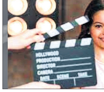
ନୂଆଦିଲ୍ଲୀ, ୨୫: ଶିଶୁ କଳାକାରମାନଙ୍କ ପୁରୁଣା ମାନକକୁ ଅଧିକ କାମ କରିବାକୁ ଅନୁମତି ଜରୁରୀ