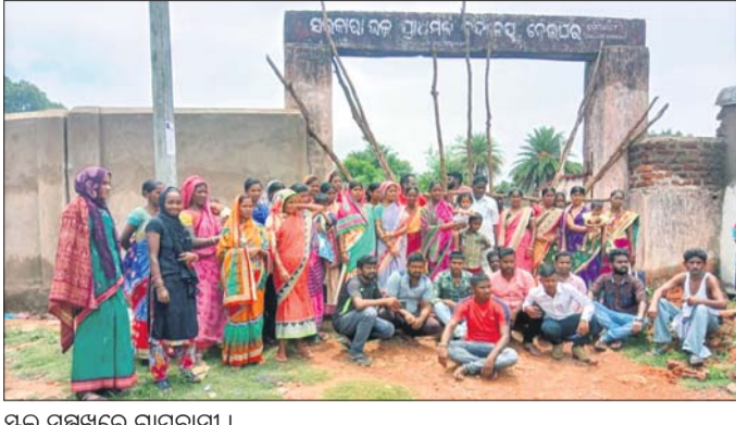
ସ୍କୁଲ ସମ୍ମୁଖରେ ଗ୍ରାମବାସୀ।

ପୁଲବାଣୀ ଅଫିସ୍/ବୁଦ୍ଧପୁର, ୨୫୬୬ ଚୁଡ଼ିବନ୍ଧ ଲୁକ ବେଲଘର ପଞ୍ଚାୟତ ବେଲଘର ଉକ୍ତ ପ୍ରାଥମିକ ବିଦ୍ୟାଳୟରେ ଗ୍ରାମବାସୀ ଶନିବାର ଶିକ୍ଷୟିତ୍ରୀ ଶିକ୍ଷକଙ୍କୁ ମନମୁଖ କାର୍ଯ୍ୟକଳାପ, ବିଦ୍ୟାଳୟରେ ପିଲାମାନଙ୍କୁ ପାଠ ନ ପଢ଼ାଇବା, ବିଦ୍ୟାଳୟକୁ ଠିକ ଭାବେ ନ ଯିବା ଆଦିକୁ ବିରୋଧ କରି ଗ୍ରାମବାସୀ ଏପରି କରିଛନ୍ତି। ପୁରୀୟ ୧୦୭ରୁ ସନ୍ଧ୍ୟା ୬ଟା ଯାଏ ଗ୍ରାମବାସୀ ତାଲା ଖୋଲି ନ ଥିଲେ। କୁଳ ଶିକ୍ଷାଧିକାରୀ ଘଟଣାସ୍ଥଳରେ ପହଞ୍ଚି ସମସ୍ୟାର ସମାଧାନ କରାଯିବ ବୋଲି ପ୍ରତିଶ୍ରୁତି ଦେବା ପରେ ଗ୍ରାମବାସୀ ସେମାନଙ୍କୁ ଛାଡ଼ିଥିଲେ। ଏହି ବିଦ୍ୟାଳୟରେ ପ୍ରଥମରୁ ୮ମ ପର୍ଯ୍ୟନ୍ତ ଶ୍ରେଣୀ ରହିଛି। ପାଠ ପଢ଼ିବା