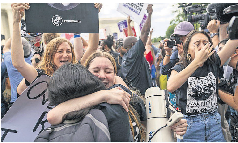
ସୁପ୍ରିମକୋର୍ଟ ରାୟ ପରେ ଉତ୍ସବ ମନାଉଛନ୍ତି ଗର୍ଭପାତ ବିରୋଧୀ ମହିଳା।