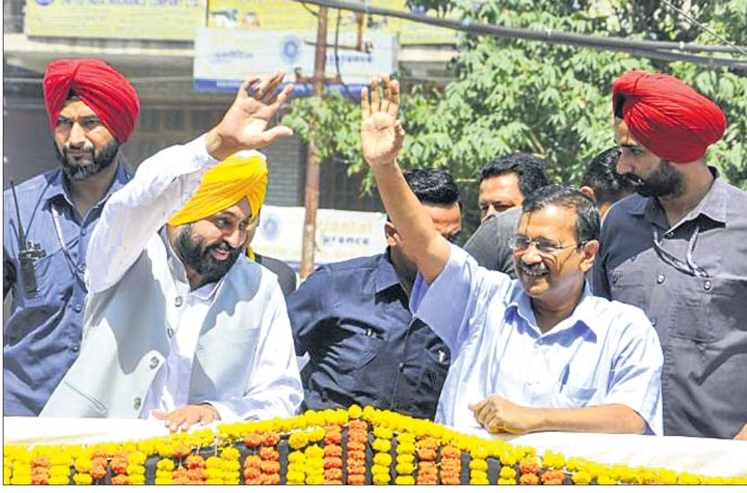
ଡିରଂଗା ଯାତ୍ରା ଅବସରରେ କୁଲୁଠାରେ ରୋଡ ଶୋ' କରୁଛନ୍ତି ଦିଲ୍ଲୀ ମୁଖ୍ୟମନ୍ତ୍ରୀ ଅରବିନ୍ଦ କେନ୍ଦ୍ରୀୟ ଓ ପଞ୍ଜାବ ମୁଖ୍ୟମନ୍ତ୍ରୀ ଭଗତ ସିଂହ।

ଦିଲ୍ଲୀ ମୁଖ୍ୟମନ୍ତ୍ରୀ ଅରବିନ୍ଦ କେନ୍ଦ୍ରୀୟ ଶନିବାର ହିମାଚଳ ପ୍ରଦେଶର କୁଲୁରେ ରୋଡ ଶୋ' କରୁଛନ୍ତି।