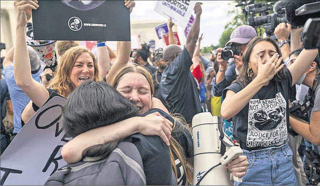
ସୁପ୍ରିମକୋର୍ଟ ରାୟ ପରେ ଉତ୍ସବ ମନାଉଛନ୍ତି ଗର୍ଭପାତ ବିରୋଧୀ ମହିଳା।

ଆମେରିକା ସୁପ୍ରିମକୋର୍ଟ ଏକ ରୁଦ୍ଧବିପ୍ଳବ ରାୟରେ ଗର୍ଭପାତକୁ ଆଇନଗତ ମାନ୍ୟତା ପ୍ରଦାନକାରୀ ଅର୍ଦ୍ଧଶତାବ୍ଦୀ ପୁରୁଣା ନିଷ୍ପତ୍ତିକୁ ପଲଟିକା ଦେଇଛନ୍ତି। ଫଳରେ ଏଗିନ୍ଦି ଗର୍ଭପାତ କରାଇବା ମହିଳାଙ୍କ ଆଇନଗତ ଅଧିକାର ରହିବ କି ନାହିଁ ସେନେଇ ରାଜ୍ୟଗୁଡ଼ିକ ନିଜସ୍ୱ ସ୍ୱତନ୍ତ୍ର ଆଇନ ପ୍ରଣୟନ କରିପାରିବେ। ସତ୍ୟ ରାୟକୁ କେତେକ ରାଜ୍ୟରେ ସ୍ୱାଗତ କରାଯାଇଥିବାବେଳେ ଅନ୍ୟ କିଛି ରାଜ୍ୟରେ ଏହାକୁ ବିରୋଧ କରି ମହିଳାମାନେ ରାସ୍ତାକୁ ଉଲ୍ଲାଇଛନ୍ତି। ଆମେରିକା ରାଷ୍ଟ୍ରପତି ଜୋ ବାଇଡେନ୍ ରାୟକୁ ବିରୋଧ କରିଥିବାବେଳେ ପୂର୍ବତନ ରାଷ୍ଟ୍ରପତି ଡୋନାଲ୍ଡ୍ ଟ୍ରମ୍ ଏହାକୁ ପ୍ରଶଂସା କରିଛନ୍ତି। କେନ୍ଦ୍ର ରୋ ନାମରେ ପରିଚିତ ମହିଳାଙ୍କ ପୂଜା ନାମ ହେଉଛି ମେକ୍‌କୋର୍ଡି। ସେ ହୁଇ ସନ୍ତାନର ଜନନୀୟ ହୋଇଥିବାବେଳେ ୧୯୬୯ରେ ଧାରଣ କରିଥିବା ବୃତ୍ତାତ୍ମକ ଭୂମିକୁ ଗର୍ଭପାତ କରାଇବାକୁ ଚାହୁଁଥିଲେ। କିନ୍ତୁ ସେ ଚେକ୍‌ସ୍‌ପାରେ ରହୁଥିବାକୁ ଏଥିରେ ଅସୁବିଧା ହୋଇଥିଲା। କାରଣ ଚେକ୍‌ସ୍‌ପାରେ କେବଳ ମା'ଙ୍କ ଜୀବନ ରକ୍ଷା ପାଇଁ କରୁଥିବା ହେଲେ ଏହାକୁ ଆଇନଗତ ସ୍ୱୀକୃତି ମିଳୁଥିଲା। ରୋକ୍ ଓଜିଲମାନେ ଫେଡେରାଲ କୋର୍ଟରେ ସାମା ହେନେରି ଷ୍ଟେଡ୍ ବିରୋଧରେ ପିଟିସନ ଦାଖଲ କରିଥିଲେ। ପରେ ଚେକ୍‌ସ୍‌ପା କୋର୍ଟ ଏହି ମାମଲାକୁ