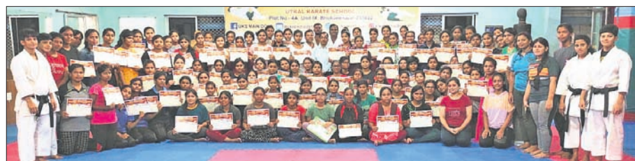
ଉଦ୍‌ଯାପନୀ ଉପସଭାରେ ପ୍ରଶିକ୍ଷକ ସହ ପ୍ରଶିକ୍ଷାପାଳୀମାନେ ।

ଭୁବନେଶ୍ୱର, ୨୫.୬ (କ୍ରୀଡ଼ା ପ୍ରତିନିଧି) ରାଜ୍ୟ ସରକାରଙ୍କ ଉଚ୍ଚଶିକ୍ଷା ବିଭାଗ ଦ୍ୱାରା ଡିଗ୍ରୀ କଲେଜ ଛାତ୍ରୀମାନଙ୍କୁ ଉତ୍ତମ କର୍ମରେ ସ୍ୱୀକୃତି ଦେବା ପାଇଁ ପୁରସ୍କାର ଦିଆଯାଇଥିବା ଆମ୍ଭର କୌଶଳ ରିଆକ୍ଟର ଦଶମ ବ୍ୟାଚ୍ରେ ମୋଟ ୯୬ ଛାତ୍ରୀ ପ୍ରଶିକ୍ଷଣ ମାଲ କରିଛନ୍ତି ।