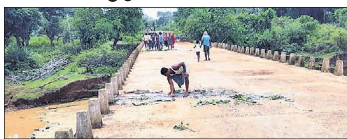
ଜାମୁୟାଟ ପୋଲରେ ହୋଇଥିବା ପାଟ ।

ଉଦ୍‌ଯାପନୀ/କୂଆମରା, ୨୫.୬.୨୨ (ପି.ଏନ.ଏ.) ମୟୂରଭଞ୍ଜ ଜିଲ୍ଲା ଉଦ୍‌ଯାପନୀ କୂଆମରାକୁ ସଂଯୋଗ କରୁଥିବା ଦେଓନଦୀ ଜାମୁୟାଟ ପୋଲରେ ପାଟ ପୂର୍ଣ୍ଣ ହୋଇଛି ।