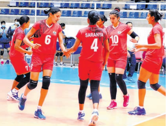
ବିଜୟ ହାସଲରେ ଭଲିବଲ ଭାରତୀୟ ଖେଳାଳି ।

ଆଇଲାଣ୍ଡର ନାଗୋଆରେ ଚାଲିଥିବା ୨୯ତମ ପ୍ରିନ୍ସେସ୍ କପ୍ ମଧ୍ୟ ଏକଦିନ ମହିଳା ଚ୍ୟାଲେଞ୍ଜି କପ ଭଲିବଲ ଚୁନାମଣିରେ ଭାରତ କ୍ରମାଗତ ଦ୍ୱିତୀୟ ବିଜୟ ହାସଲ କରିଛି ।