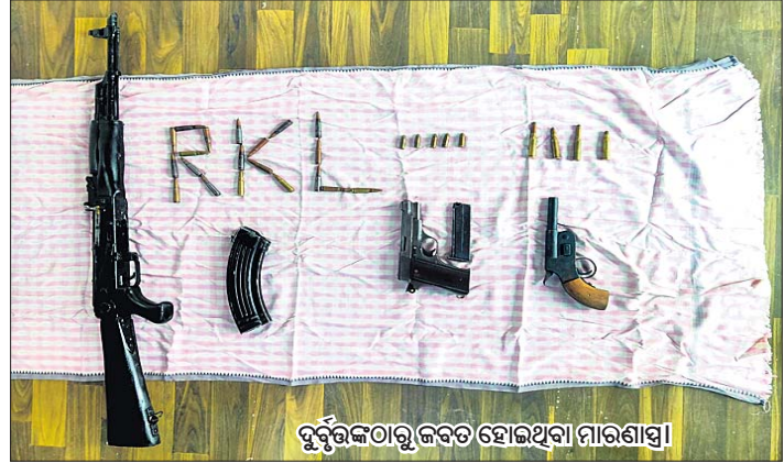
ଦୁର୍ଘଟଣାରେ ଜବତ ହୋଇଥିବା ମାରାଣୀୟା।

କଣେ ଦୁର୍ଘଟ ବୁଲୁ ଲକ୍ଷ୍ମୀଆର(୨୮)ଙ୍କୁ ପୋଲିସ୍ ଅଟକ ରଖି ପଚରାଉଚୁରା କରି ରଖିଛି।