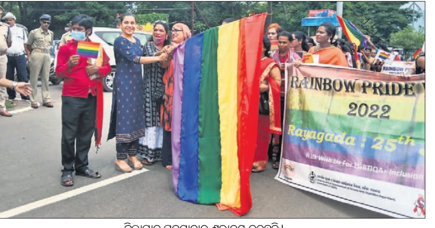
ଜିଲ୍ଲାପାଳ ପଦଯାତ୍ରାର ଶୁଭାରମ୍ଭ କରୁଛନ୍ତି ।

ରାୟଗଡ଼ା ଅପିଏ, ୨୫।୬- ଜିନିଷମାନଙ୍କୁ ସମାଜର ମୁଖ୍ୟସ୍ତ୍ରୋତରେ ସାମିଲ କରିବା ଏବଂ ସରକାରଙ୍କ ପକ୍ଷରୁ ଏମାନଙ୍କ ପାଇଁ ରହିଥିବା ବିଭିନ୍ନ ସୁବିଧା ସୁଯୋଗ ପ୍ରଦାନ କରିବା ଉଦ୍ଦେଶ୍ୟରେ ରାୟଗଡ଼ା ସହର ସ୍ଥିତ ସାଥୀ ସଙ୍ଗଠନ ପକ୍ଷରୁ ଜିନିଷକୁ ନେଇ 'ରେନ୍‌ବୋ' କାର୍ଯ୍ୟକ୍ରମ ଶନିବାର ଅନୁଷ୍ଠିତ ହୋଇଯାଇଛି । ଏହି ଅବସରରେ କୋରାପୁଟ ଛକକୁ କପିଳାସ ଛକ ପର୍ଯ୍ୟନ୍ତ ଏକ ପଦଯାତ୍ରା ଅନୁଷ୍ଠିତ ହୋଇଥିଲା । ଅନେକ ଜିନିଷକୁ