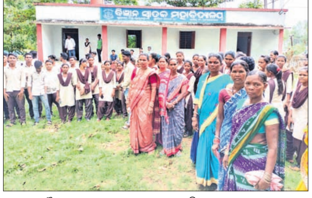
ବୈଠକରେ ଯୋଗ ଦେଇଥିବା ଛାତ୍ରାଛାତ୍ରୀ, ଅଭିଭାବକ ଓ ଗ୍ରାମବାସୀ ।

ଗୁଡ଼ାରି, ୧୫।୬(ଡି.ଏନ୍.ଏ.) ରାୟଗଡ଼ା ଜିଲ୍ଲା ଗୁଡ଼ାରି ସହରରେ ଥିବା ଏକମାତ୍ର ଡିଗ୍ରୀ କଲେଜରେ ଅସନ୍ତୋଷର ପରିବେଶ ଦେଖାଦେଇଛି । ଦୀର୍ଘଦିନ ହେଲା ଏହି କଲେଜର ଅଧ୍ୟାପକ ଓ ଅଧ୍ୟକ୍ଷଙ୍କ ମଧ୍ୟରେ ଟେକି ପାଇଁ ଟଣାଓଟରା ଚାଲିଛି । ଏଥରେ ଛାତ୍ରାଛାତ୍ରୀ ଅସୁବିଧା ଭୋଗୁଥିବା ଅଭିଯୋଗ ହୋଇଛି । ପରିସ୍ଥିତି ଏକଦି ଗମ୍ଭୀର ସ୍ଥିତିରେ ପହଞ୍ଚିଛି ଯେ, କଲେଜର ତୃତୀୟ ସେମିଷ୍ଟର ଫଳାଫଳ ପ୍ରକାଶ ପାଇବା ନେଇ ମଧ୍ୟ ଅନିଶ୍ଚିତତା ଦେଖା ଦେଇଥିବା ଛାତ୍ରାଛାତ୍ରୀମାନେ କହିଛନ୍ତି ।