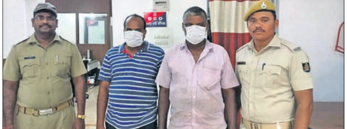
ଗିରଫ ଦୁଇ ଅଭିଯୁକ୍ତ।