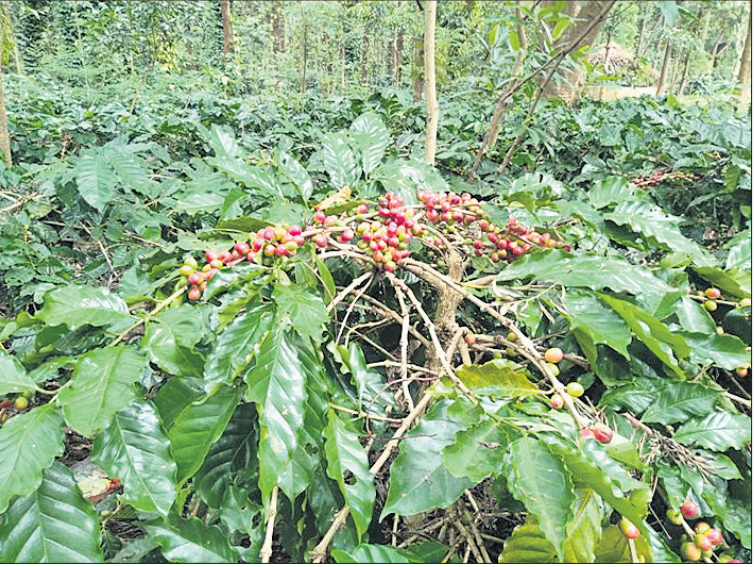
ଚାଷ ହୋଇଥିବା କର୍ପି ।