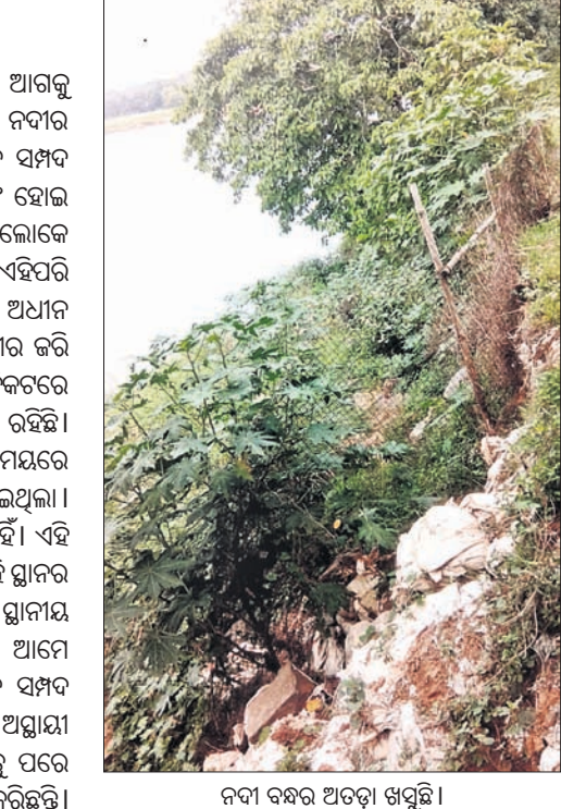
ନଦୀ ବନ୍ଧର ଅତଡା ଖସୁଛି।

ବର୍ଷା ଋତୁ ଆରମ୍ଭ ହୋଇଯାଇଥିବା ବେଳେ ଆଗକୁ ବନ୍ୟା ଆଶଙ୍କା ରହିଛି। ତେବେ ଖରସ୍ତୋଡା ନଦୀର କେତେକ ସ୍ଥାନ ବିପଦ ପୂର୍ଣ୍ଣଥିଲେ ମଧ୍ୟ ଜଳ ସମ୍ପଦ ବିଭାଗର ତତ୍ପରତା ଅଭାବରୁ ପଥର ପ୍ୟାକିଂ ହୋଇ ପାରିନାହିଁ।