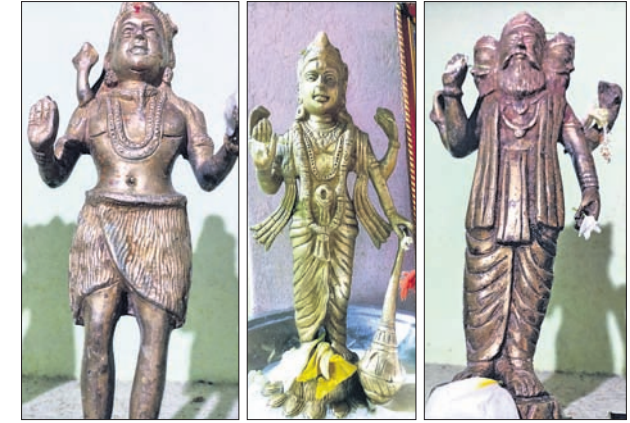
କଟକ ସଦର, ୨୫୬(ଡି.ଏନ୍.ଏ.)