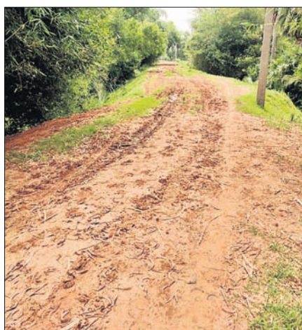
ରାସ୍ତାରେ ଖାଲଖମା ସୃଷ୍ଟି ହୋଇଛି।

ସିଂହପୁର, ୨୫୬(ଡି.ଏନ.ଏ.): ବିଖ୍ୟାତପୁର ଜଳ ସମ୍ପଦ ବିଭାଗ ସିଂହପୁର ଉପଖଣ୍ଡ ଅନ୍ତର୍ଗତ ଖରସ୍ତୋଡା ନଦୀର ଶାଖା ନୂଆମାହାରା ଦକ୍ଷିଣପାର୍ଶ୍ୱ ଜରିଠାରୁ ଛୋଟାଗଡ଼ି ପର୍ଯ୍ୟନ୍ତ ୭କିମି ରାସ୍ତା ଏବେ ମରଣଯନ୍ତ୍ର ପାଇଗିଛି।