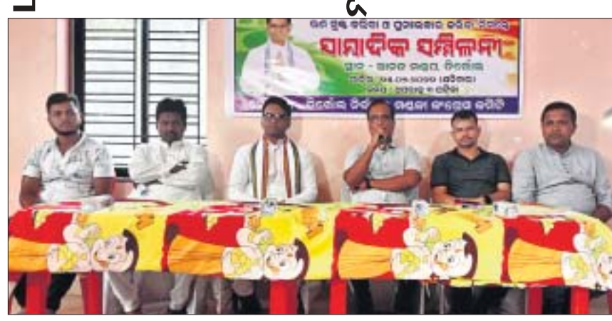
କଂଗ୍ରେସ ପକ୍ଷରୁ ଅନୁଷ୍ଠିତ ଖବରଦାତା ସମ୍ମିଳନୀରେ ନେତୃମଣ୍ଡଳୀ।