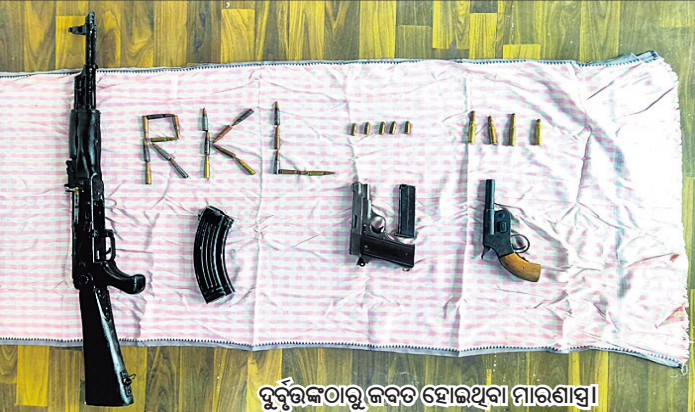
ଦୁର୍ଭିକ୍ଷତାରୁ ଜବତ ହୋଇଥିବା ମାରଣାସ୍ତ୍ର।