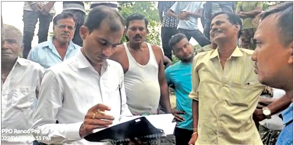
ଜିଲ୍ଲା ପ୍ରଶାସନ ପକ୍ଷରୁ ଚାଷୀଙ୍କୁ ବୁଝାଇ ଦିଆଯାଇଛି।

ଗଜପତି ଜିଲ୍ଲା ଗୋଷାଣୀ ବ୍ଲକ ଅନ୍ତର୍ଗତ ଜଙ୍ଗଲପତ୍ର ଗ୍ରାମର ଆନ୍ଧ୍ର ସାମାଜିକ ସ୍ତ୍ରୀ ଜନସେବକ ପ୍ରକଳ୍ପ ଆନ୍ଧ୍ର ପ୍ରଶାସନର ନିର୍ଦ୍ଦେଶରେ ଆନ୍ଧ୍ର ଠିକାଦାର ଓ ସରପଞ୍ଚ ଉପସ୍ଥିତ ରହି ଲକ୍ଷ୍ମୀ ପୁରୀଙ୍କ ମରାମତି କରୁଥିଲେ। ସେହି କାର୍ଯ୍ୟକୁ ଗଜପତି ଜିଲ୍ଲା ପ୍ରଶାସନ ଓ ଗ୍ରାମବାସୀ ବିରୋଧ କରି ବନ୍ଦ କରିଥିଲେ। ପୁରୀଙ୍କୁ ଘରାଣୀ, ଦୀର୍ଘ ବର୍ଷ ଧରି ଏହି ଚ୍ୟାମ କାର୍ଯ୍ୟ ଓଡ଼ିଶା କଲ୍ୟାଣକର ବେଳେ ଆନ୍ଧ୍ର ସଂଘର ମରାମତି କରୁଥିଲା ଯାହାଦ୍ୱାରା ଓଡ଼ିଶା ଚାଷୀଙ୍କୁ ମଧ୍ୟ ଏହା ସାହାଯ୍ୟ ହେଉଥିଲା। ଏହି ବେଳେ ଚ୍ୟାମ ଦ୍ୱାରା ଶହଶହ ଚାଷୀ ଉପକୃତ ହେଉଥିବା ଯୋଗୁ ଚାଷୀ