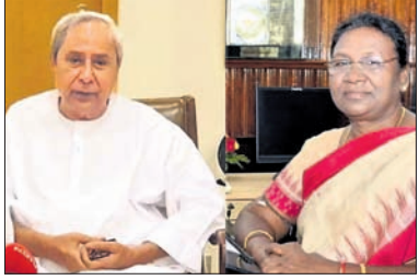
ମୁଖ୍ୟମନ୍ତ୍ରୀ ନବୀନ ପଟ୍ଟନାୟକ ଓ ରାଷ୍ଟ୍ରପତି ପ୍ରାର୍ଥୀ ତ୍ରୌପଦୀ ମୁର୍ମୁ।

ଓଡ଼ିଶାର ଝିଅ ତଥା ଏନ୍ତ୍ରୀ-୧ ରାଷ୍ଟ୍ରପତି ପ୍ରାର୍ଥୀ ତ୍ରୌପଦୀ ମୁର୍ମୁଙ୍କ ସହ ମୁଖ୍ୟମନ୍ତ୍ରୀ ନବୀନ ପଟ୍ଟନାୟକ ରବିବାର ଚେଲିଫୋନ ଯୋଗେ କଥା ହୋଇଛନ୍ତି। ଏହି ଅବସରରେ ରାଷ୍ଟ୍ରପତି ନିର୍ବାଚନ ପାଇଁ ମୁଖ୍ୟମନ୍ତ୍ରୀ ତାଙ୍କୁ ପୁଣି ଥରେ ଶୁଭେଚ୍ଛା ଜଣାଇଛନ୍ତି। ମୁର୍ମୁଙ୍କ ପ୍ରାର୍ଥନା ରାଜ୍ୟବାସୀଙ୍କ ପାଇଁ ଏକ ଗର୍ବର ବିଷୟ ବୋଲି ନବୀନ କହିଛନ୍ତି। ତ୍ରୌପଦୀଙ୍କ ସମ୍ପର୍କରେ ଓଡ଼ିଶାରୁ ପ୍ରତ୍ୟେକ ଭୋଟ୍ ମିଳିବା ଦିଗରେ ଆମେ ଜାମ କରିବୁ ବୋଲି ସେ ତାଙ୍କୁ ସୂଚନା ଦେଇଛନ୍ତି। ସୂଚନାସୁଧାରେ, ତ୍ରୌପଦୀ ମୁର୍ମୁ ଗତ ୨୪ ତାରିଖରେ ଏନ୍ତ୍ରୀ-୧ ସମ୍ପର୍କରେ ରାଷ୍ଟ୍ରପତି ପ୍ରାର୍ଥୀ ଭାବେ ନାମାଙ୍କନ ଦାଖଲ କରିଛନ୍ତି। ତାଙ୍କୁ ଏନ୍ତ୍ରୀ-୧ ପକ୍ଷରୁ ପ୍ରାର୍ଥୀ ଭାବେ ଘୋଷଣା କରାଯିବା ପରଠାରୁ ମୁଖ୍ୟମନ୍ତ୍ରୀ ତାଙ୍କ ସମ୍ପର୍କରେ ଠିକା ହୋଇଛନ୍ତି। ବିଦେଶ ଗସ୍ତରେ ଥାଇ ନବୀନ ଟୁଇଟ୍ କରି ମୁର୍ମୁଙ୍କୁ ଶୁଭେଚ୍ଛା ଜଣାଇବା ସହ ଏ ବିଷୟରେ ପ୍ରଧାନମନ୍ତ୍ରୀ ପୂର୍ବରୁ ତାଙ୍କୁ ସୂଚନା ଦେଇଥିବା ଉଲ୍ଲେଖ କରିଥିଲେ। ସେହିପରି ଦଳମତ ନିର୍ଦ୍ଦେଶରେ ଓଡ଼ିଶାର ଝିଅଙ୍କୁ ସମର୍ଥନ କରିବା ପାଇଁ ରାଜ୍ୟର ସମସ୍ତ ବିଧାୟକଙ୍କୁ ମୁଖ୍ୟମନ୍ତ୍ରୀ ନିବେଦନ ମଧ୍ୟ କରିଥିଲେ। କେବଳ ଏତିକି ନୁହେଁ, ମୁଖ୍ୟମନ୍ତ୍ରୀଙ୍କ ନିର୍ଦ୍ଦେଶରେ ବିଜେଡିର ଦୁଇ କ୍ୟାବିନେଟ୍