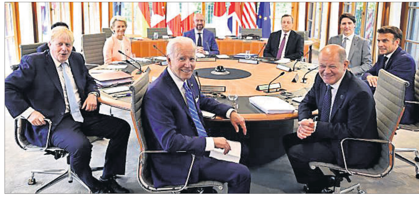
ଜର୍ମାନୀର କ୍ୟାଶେଲ୍ ଏଲ୍‌ମାରେ ଜି ୭ର ରବିବାର ପ୍ରଥମ କାର୍ଯ୍ୟକାରୀ ଅଧିବେଶନ ବେଳେ (କ୍ଲବ୍‌ଝାଲ୍‌ସ୍ ବାମପାର୍ଶ୍ୱ) କାପାନ୍ ପ୍ରଧାନମନ୍ତ୍ରୀ ପୁମ୍ପି କିଶିବା, ସୁରୋପାୟ କମିଶନ ଅଧ୍ୟକ୍ଷା ଉର୍ସୁଲା ଭୋନ୍ ଡେର ଲେୟେନ୍, ସୁରୋପାୟ କାଉନ୍ସିଲ୍ ଅଧ୍ୟକ୍ଷ ଚାର୍ଲ୍ସ୍ ମିଶେଲ୍, ଇଟାଲୀ ପ୍ରଧାନମନ୍ତ୍ରୀ ମାରିଓ ଡ୍ରାୟି, କାନାଡା ପ୍ରଧାନମନ୍ତ୍ରୀ ଜଷ୍ଟିନ୍ ଟ୍ରୁଡୋ, ଫ୍ରାନ୍ସ ରାଷ୍ଟ୍ରପତି ଜମାବ୍‌ସ୍କେଲ୍ ମାକ୍ରନ୍, ଜର୍ମାନୀ ଚାନ୍ସେଲର ଓଲାଫ୍ ଷ୍ଟୋଲ୍ଟେ, ଆମେରିକା ରାଷ୍ଟ୍ରପତି ଜୋ ବାଇଡେନ୍ ଏବଂ ବ୍ରିଟେନ୍ ପ୍ରଧାନମନ୍ତ୍ରୀ ବୋରିସ୍ ଜନ୍ସନ୍।

ରୁଷିଆକୁ ମହଙ୍ଗା ପଡ଼ିବ ଯୁକ୍ତେନ ଆକ୍ରମଣ। ପାଶ୍ଚାତ୍ୟ ରାଷ୍ଟ୍ରଗୁଡ଼ିକ ରୁଷିଆ ଉପରେ ଗୋଟିଏ ପରେ ଗୋଟିଏ କଟକଣା ଜାରି କରୁଥିବାବେଳେ ଆଗକୁ ସେଠାରୁ ସୁନା ଆମଦାନୀ ମଧ୍ୟ ବନ୍ଦ କରାଯିବ ବୋଲି ରବିବାର ଆମେରିକା ରାଷ୍ଟ୍ରପତି ଜୋ ବାଇଡେନ୍ ଘୋଷଣା କରିଛନ୍ତି। ଜର୍ମାନୀର ଏଲ୍‌ମା ସହରରେ ମଙ୍ଗୋଲୀର ହେବାକୁ ଥିବା ଜି ୭ ବାର୍ଷିକ ସମ୍ମିଳନୀରେ ଏନେଇ ଆନୁଷ୍ଠାନିକ ଘୋଷଣା କରାଯାଇପାରେ। କାନାଡା, ଫ୍ରାନ୍ସ, ଜର୍ମାନୀ, ଇଟାଲୀ, କାପାନ୍, ବ୍ରିଟେନ୍ ଓ ଆମେରିକାକୁ ନେଇ ଗଠିତ ଆନ୍ତର୍ଜାତୀୟ ସରକାରୀ ରାଜନୈତିକ ମଞ୍ଚ ଜି ୭ ରୁଷିଆକୁ ସୁନା ଆମଦାନୀ ଉପରେ କଟକଣା ଜାରି କରାଗଲେ ମଧ୍ୟରେ ଆର୍ଥିକ ଛୁଟି ଆହୁରି ଖରାପ ହେବା ଆଶଙ୍କା କରାଯାଇଛି। ଏହାବ୍ୟତୀତ ଯୁକ୍ତେନ ଆକ୍ରମଣ ଯୋଗୁ ପୃଷ୍ଠି ହୋଇଥିବା ଶକ୍ତି ସଙ୍କଟ ଓ ପ୍ରମାଣିତର ମୁକାବିଲା ପାଇଁ