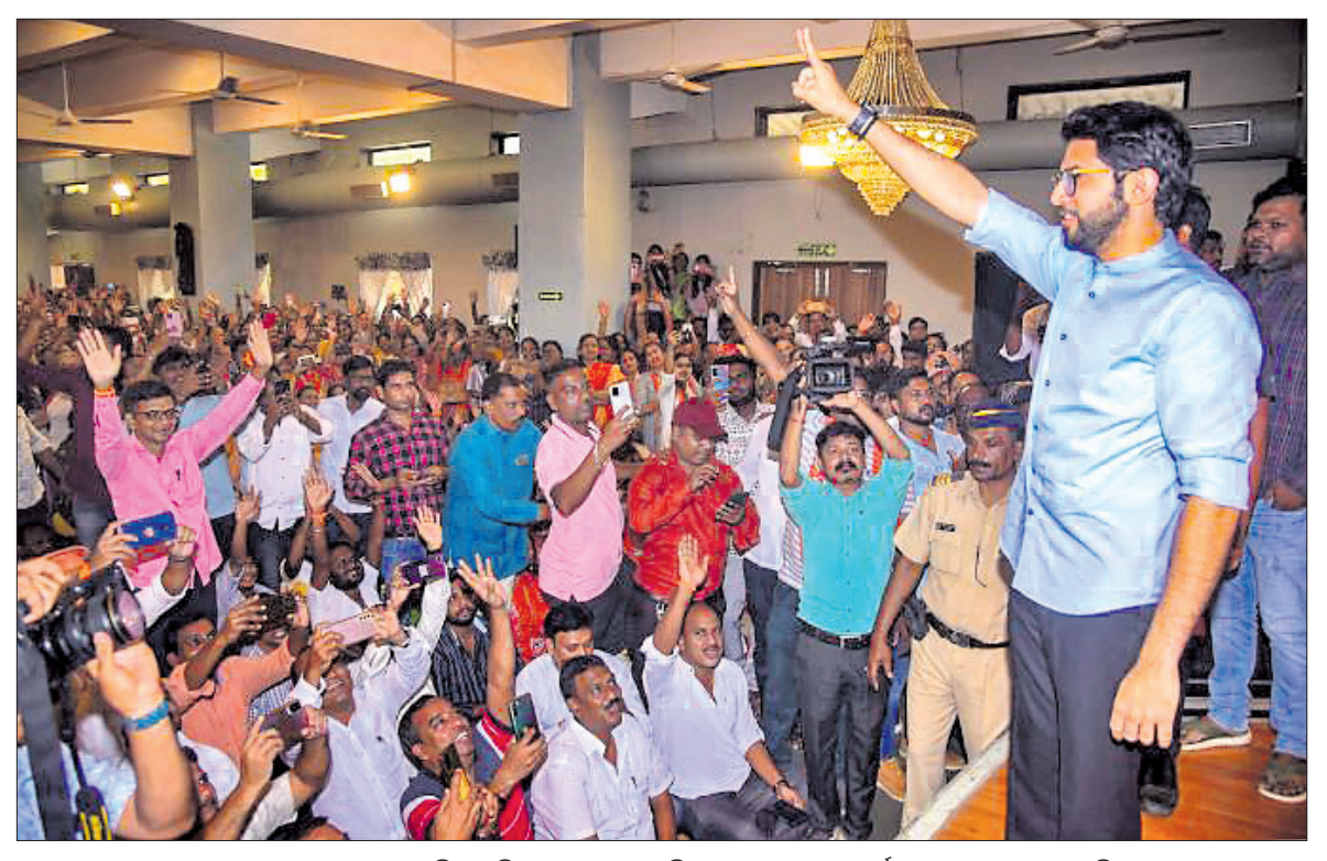
ମୁଖ୍ୟର ସାହାଯ୍ୟରେ ରବିବାର ଶିବସେନା ନେତା ଆଦିତ୍ୟ ଠାକୁରେ ଦକ୍ଷୀଣ କର୍ମୀଙ୍କୁ ଉଦ୍‌ବୋଧନ ଦେଇଛନ୍ତି।