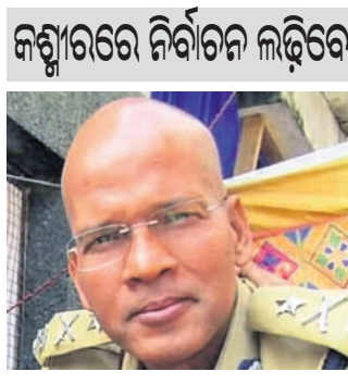
ନିର୍ବାଚନ ଲଢ଼ିବେ। ସେ ୨୦୨୪ ମାର୍ଚ୍ଚ ୬ ପୂର୍ବରୁ ରାଜନୀତିରେ ଯୋଗଦେବେ ବୋଲି ଘୋଷଣା କରିଛନ୍ତି।

ଶ୍ରୀନଗର, ୨୬: ନିର୍ବାଚନ ରାଜନୀତିରେ ଯୋଗଦେବା ପାଇଁ ଉତ୍ସାହୀ ଅଧିକାରୀଙ୍କ ବସନ୍ତ ରଥଙ୍କ ଉତ୍ସାହ।