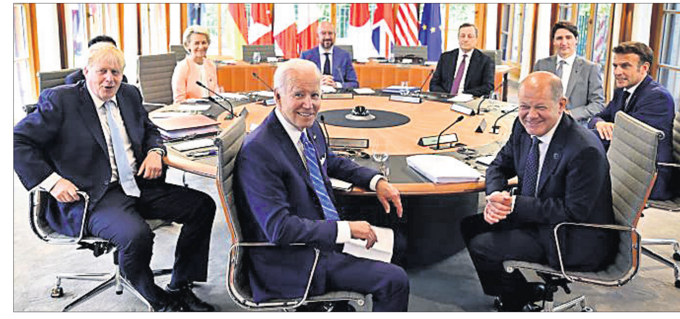
ଜର୍ମାନୀର ବ୍ୟାଣ୍ଡେଲ୍ ଏଲ୍ମା ଉପରେ ପ୍ରଥମ କାର୍ଯ୍ୟକାରୀ ଅଧିବେଶନ ବେଳେ (କ୍ଲବ୍ ସଭା ସଭା) କାନାଡା ପ୍ରଧାନମନ୍ତ୍ରୀ ଫ୍ରାନ୍ସ, ଡେନମାର୍କ, ଟ୍ରିନିଡାଡ୍ ଓ ଆମେରିକା ନେଇ ଗଠିତ ଆନ୍ତର୍ଜାତୀୟ ଗୋଷ୍ଠୀର ମତାମତ ଗ୍ରହଣ କରାଯାଇଛି।

ଏଲ୍ମା, ୨୬: ମଙ୍ଗୋଲୀ ସରକାର ଆନୁଷ୍ଠାନିକ ଘୋଷଣା କରାଯାଇପାରେ। କାନାଡା, ଫ୍ରାନ୍ସ, ଜର୍ମାନୀ, ଇଟାଲୀ, ଡେନମାର୍କ, ଟ୍ରିନିଡାଡ୍ ଓ ଆମେରିକା ନେଇ ଗଠିତ ଆନ୍ତର୍ଜାତୀୟ ଗୋଷ୍ଠୀର ମତାମତ ଗ୍ରହଣ କରାଯାଇଛି।