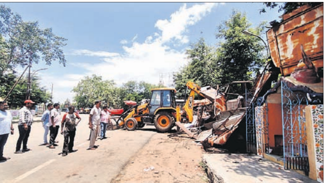
ପ୍ରଶାସନ ପକ୍ଷରୁ ଉଚ୍ଛେଦ କରାଯାଇଛି।