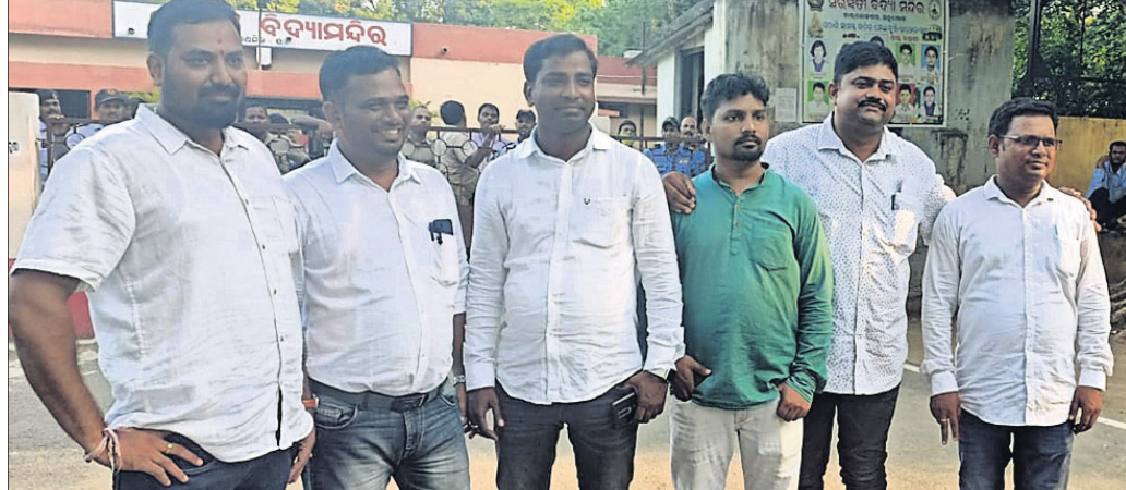
ନାଲକୋ ସମବାୟ ସମିତିରେ ବିଜୟୀ ହୋଇଥିବା ନିର୍ଦ୍ଦେଶକ।

ବଞ୍ଚରପାଳ ବ୍ଲକ ଅନ୍ତର୍ଗତ ତୁରଙ୍ଗ ପ୍ରାଥମିକ କୃଷି ସମବାୟ ସମିତି ଏବଂ ନାଲକୋ ବସୁଥିବା ସମବାୟ ସମିତିରେ ବିଭାଗୀୟ ନିର୍ବାଚନ ଉଦ୍ଦେଶ୍ୟରେ ପ୍ରାର୍ଥୀମାନେ ଭୋଟଗ୍ରହଣ କରିଥିଲେ।