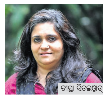
ଡାକ୍ତରୀ ସେବାରେ ଯୋଗଦେବେ।

ପୁରୀ, ୨୬: ରିପର୍ଟ ସାମାଜିକ କର୍ମୀ ଡାକ୍ତରୀ ସେବାରେ ଯୋଗଦେବେ।