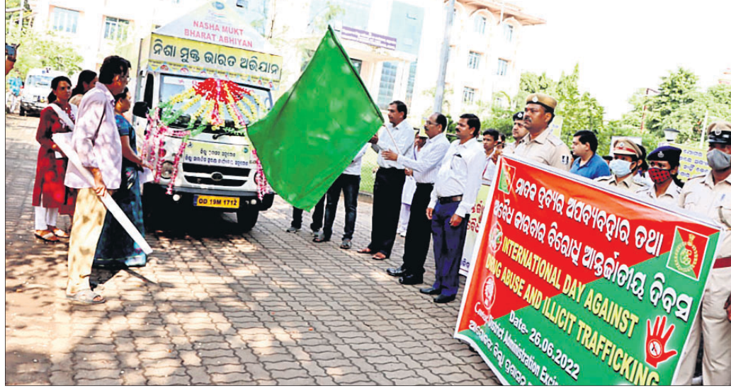
ସଚେତନତା ରଥଙ୍କୁ ସବୁଜ ପତାକା ଦେଖାଯାଇଛି।