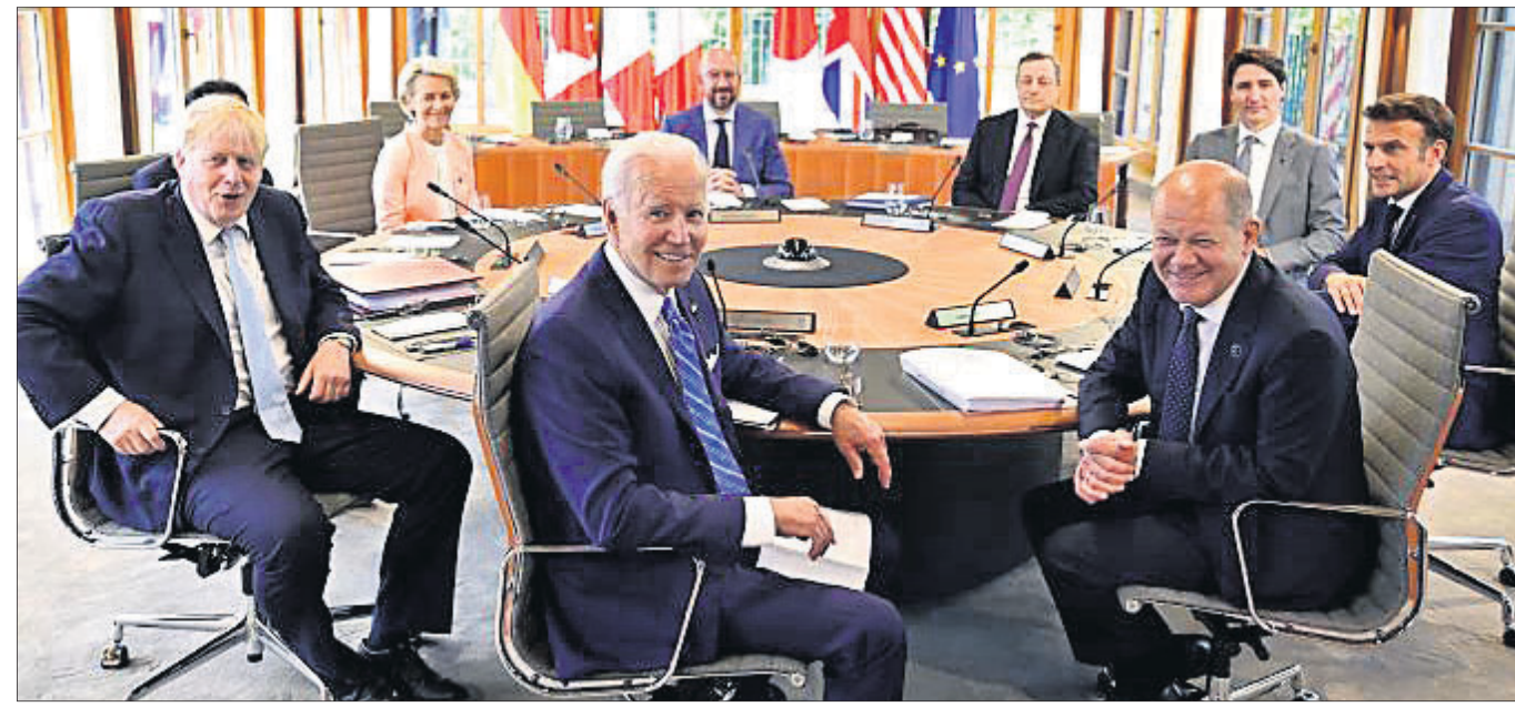
ଜର୍ମାନୀର କ୍ୟାଶେଲ୍ ଏଲ୍‌ମାରେ ଜି ୭ର ରବିବାର ପ୍ରଥମ କାର୍ଯ୍ୟକାରୀ ଅଧିବେଶନ ବେଳେ (କ୍ଲବ୍‌ଝାଲ୍‌ସ୍ ବାମପାର୍ଶ୍ୱ) କାପାନ୍ ପ୍ରଧାନମନ୍ତ୍ରୀ ପୁମ୍ପି କିଶିବା, ସୁରୋପାୟ କମିଶନ ଅଧ୍ୟକ୍ଷା ଉର୍ସୁଲା ଭୋନ୍ ଡେର ଲେୟେନ୍, ସୁରୋପାୟ କାଉନ୍ସିଲ୍ ଅଧ୍ୟକ୍ଷ ଚାର୍ଲ୍ସ୍ ମିଶେଲ୍, ଇଟାଲୀ ପ୍ରଧାନମନ୍ତ୍ରୀ ମାରିଓ ଡ୍ରାୟି, କାନାଡା ପ୍ରଧାନମନ୍ତ୍ରୀ ଜଷ୍ଟିନ୍ ଟ୍ରୁଡୋ, ଫ୍ରାନ୍ସ ରାଷ୍ଟ୍ରପତି ଜମ୍‌ବେଲ୍ ମାକ୍ରନ୍, ଜର୍ମାନୀ ଚାନ୍ସେଲର ଓଲାଫ୍ ଷ୍ଟୋଲ୍ଟେ, ଆମେରିକା ରାଷ୍ଟ୍ରପତି ଜୋ ବାଇଡେନ୍ ଏବଂ ବ୍ରିଟେନ୍ ପ୍ରଧାନମନ୍ତ୍ରୀ ବୋରିସ୍ କନ୍‌ସନ୍।

ରୁଷିଆକୁ ମହଙ୍ଗା ପଡ଼ିବ ଯୁକ୍ତେନ୍ଦ୍ର ଆକ୍ରମଣ। ପାଶ୍ଚାତ୍ୟ ରାଷ୍ଟ୍ରଗୁଡ଼ିକ ରୁଷିଆ ଉପରେ ଗୋଟିଏ ପରେ ଗୋଟିଏ କଟକଣା ଜାରି କରୁଥିବାବେଳେ ଆଗକୁ ସେଠାରୁ ସୁନା ଆମଦାନୀ ମଧ୍ୟ ବନ୍ଦ କରାଯିବ ବୋଲି ରବିବାର ଆମେରିକା ରାଷ୍ଟ୍ରପତି ଜୋ ବାଇଡେନ୍ ଘୋଷଣା କରିଛନ୍ତି। ଜର୍ମାନୀର ଏଲ୍‌ମା ସହରରେ ମଙ୍ଗୋଲୀର ହେବାକୁ ଥିବା ଜି ୭ ବାର୍ଷିକ ସମ୍ମିଳନୀରେ ଏନେଇ ଆନୁଷ୍ଠାନିକ ଘୋଷଣା କରାଯାଇପାରେ। କାନାଡା, ଫ୍ରାନ୍ସ, ଜର୍ମାନୀ, ଇଟାଲୀ, କାପାନ୍, ବ୍ରିଟେନ୍ ଓ ଆମେରିକାକୁ ନେଇ ଗଠିତ ଆନ୍ତର୍ଗ ସରକାରୀ ରାଜନୈତିକ ମଞ୍ଚ ଜି ୭ ରୁଷିଆକୁ ସୁନା ଆମଦାନୀ ଉପରେ କଟକଣା ଜାରି କରାଗଲେ ମଧ୍ୟରେ ଆର୍ଥିକ ଛୁଟି ଆହୁରି ଖରାପ ହେବା ଆଶଙ୍କା କରାଯାଇଛି। ଏହାବ୍ୟତୀତ ଯୁକ୍ତେନ୍ଦ୍ର ଆକ୍ରମଣ ଯୋଗୁ ପୃଷ୍ଠି ହୋଇଥିବା ଶକ୍ତି ସଙ୍କଟ ଓ ପ୍ରମାଣିତର ମୁକାବିଲା ପାଇଁ