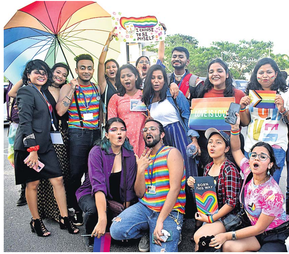
ଭୁବନେଶ୍ୱର ମାଷ୍ଟରକ୍ୟାଣ୍ଟିନଠାରୁ ରାମମନ୍ଦିର ଛକ ଯାଏ ଆୟୋଜିତ ସପ୍ତରଙ୍ଗୀ ସ୍ୱାଧିମାନ ପଦଯାତ୍ରାରେ 'ଏଲଜିବିଟିକ୍ୟୁଏ+' କମ୍ୟୁନିଟି ସଦସ୍ୟ, ସମର୍ଥକ ଓ ସ୍ୱେଚ୍ଛାସେବୀମାନେ।