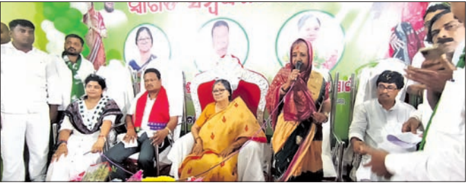
ସମ୍ବର୍ଦ୍ଧନା ସଭାରେ ଉପସ୍ଥିତ ବୁଲ ମନ୍ତ୍ରୀ, ଏମ୍ପି ଓ ଅନ୍ୟ ନେତୃତ୍ୱ।