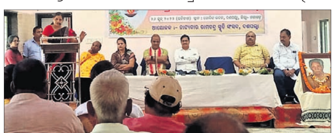
ସଭାରେ ମଞ୍ଚାସୀନ ଅତିଥି ।