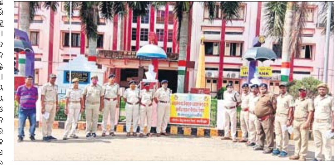
ଜିଲ୍ଲାପାଳଙ୍କ କାର୍ଯ୍ୟାଳୟ ପରିସର ପଡ଼ିଆରେ ଅଧିକାରୀ, ପୋଲିସ ଅଧିକାରୀ ଓ କର୍ମଚାରୀମାନେ ।

ସାମିତ ନ ରଖି ଏହାର କାର୍ଯ୍ୟକାରୀତା କ୍ଷେତ୍ରରେ ଅଧିକ ଯତ୍ନବାନ ହେବାକୁ ପଡ଼ିବ । ସଭା ଓ ସଚେତନତା ଦ୍ୱାରା ଗୁରୁ ଦାୟିତ୍ୱ ନେବାର ଆବଶ୍ୟକତା ରହିଛି । ପରିବାର ଓ ସମାଜକୁ ସୁସ୍ଥ ରଖିବା ପାଇଁ ଯୁବପିଢ଼ିଙ୍କୁ ସତର୍କ ନ କଲେ ପରିସ୍ଥିତି ଅଶାନ୍ତ ହୋଇଯିବ । ତେଣୁ କେବଳ ଦିବସକୁ ପାଳନରେ