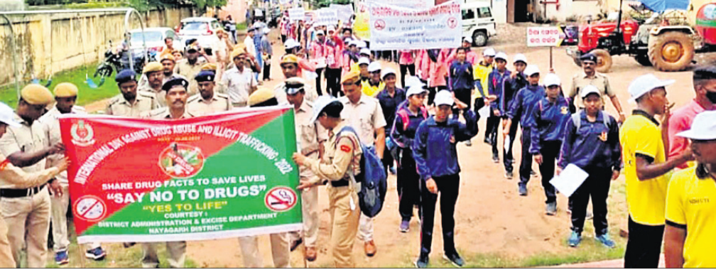
ବାହାରିଥିବା ସତେଜନତା ଶୋଭାଯାତ୍ରା ।

ନୟାଗଡ଼ ଅଫିସ୍, ୨୬.୬.୨୨: ଅତ୍ୟନ୍ତ ଭବନ ପରିସରରେ ଜିଲା ସାମାଜିକ ସୁରକ୍ଷା ବିଭାଗ, ନୟାଗଡ଼ ଦ୍ୱାରା ଆନ୍ତର୍ଜାତିକ ନିଶା ଅପବ୍ୟବହାର ଓ ଅବୈଧ ଚାଲାଣ ନିରୋଧୀ ଦିବସ ପାଳିତ ହୋଇଯାଇଛି ।