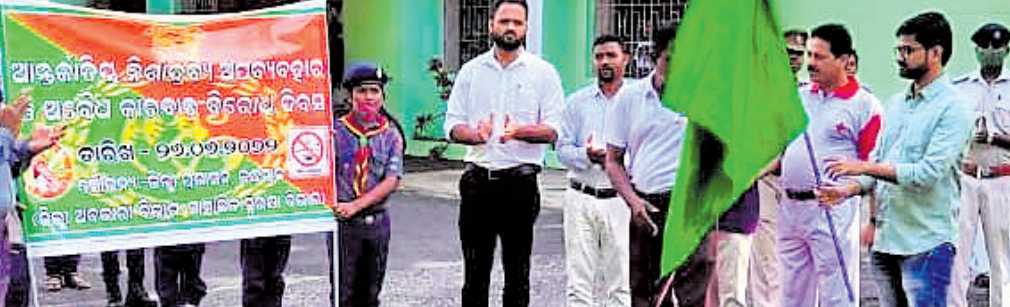
ଜିଲ୍ଲାପାଳ ପଦାଳ ଦେଖାଇ ରାଲିକୁ ଶୁଭାରମ୍ଭ କରୁଛନ୍ତି।