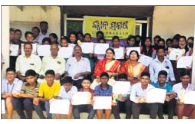
ପ୍ରତିଯୋଗିତାରେ ଭାଗନେଇଥିବା ଛାତ୍ରାଛାତ୍ରୀ ଓ ଅନ୍ୟମାନେ ।