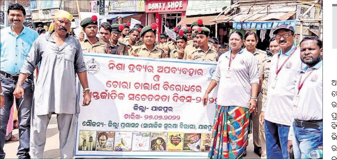
ସଚେତନତା ରାଲି ସହର ପରିକ୍ରମା କରୁଛି।