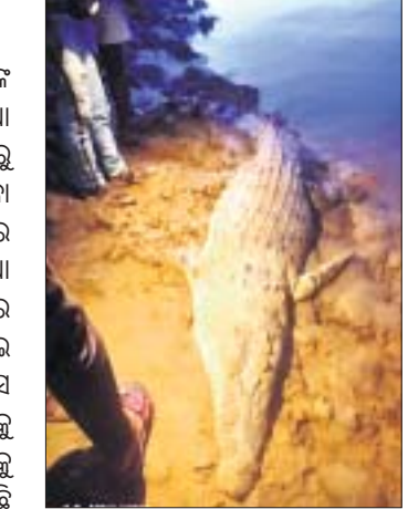
ନଦୀରୁ ଉଦ୍ଧାର ମୃତ କୁମ୍ଭୀର ।

କାଶୀ ନଦୀରେ ଦୀର୍ଘଦିନ ହେବ ଆତଙ୍କ ଖେଳାଇ ଆସିଥିବା ମଣିଷଶ୍ୱାସୀ କୁମ୍ଭୀରର ମୃତଦେହ ରବିବାର ନଦୀରୁ ଉଦ୍ଧାର ହୋଇଛି । ନଦୀରେ ଭାସୁଥିବା ୧୨ ଫୁଟ ଲମ୍ବର ଏହି ବଉଳ କୁମ୍ଭୀର ମୃତଦେହକୁ ପଟ୍ଟାମୁଣ୍ଡା ବ୍ଲକ୍ ବଲୁରିଆ ପଞ୍ଚାୟତ ଅରାଜି ଗ୍ରାମବାସୀ ଉଦ୍ଧାର କରିଛନ୍ତି । କୁମ୍ଭୀରଟି ନଦୀରେ ଚିତ ହୋଇ ମରି ଭାସୁଥିଲା । ଗ୍ରାମବାସୀ ସାହାସ କୁମ୍ଭୀର ଡିଙ୍ଗି ସାହାଯ୍ୟରେ ତା ନିକଟକୁ ଯାଇଥିଲେ । ଏକ ରଶିରେ ଚାଣି ତାକୁ କୁଳକୁ ଆଣିଥିଲେ । ଏହି କୁମ୍ଭୀରଟି କିଛି ଦିନ ତଳେ କାଶୀ ନଦୀରେ ଉପସ୍ରବ