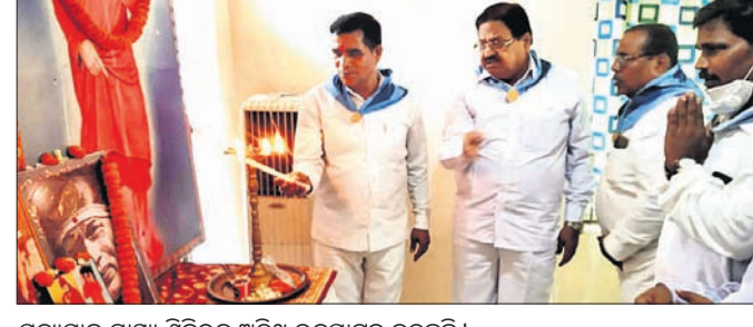
ସତ୍ୟସାଧକ ସ୍ୱାସ୍ଥ୍ୟ ଶିବିରକୁ ଅତିଥି ଉଦ୍‌ଯାତନ କରୁଛନ୍ତି।

ସାଧକ ପୁନର୍ବସତି ପ୍ରତିଷ୍ଠା ତଥା ରାଜ୍ୟ ସତ୍ୟସାଧକ ସେବା ସଂଗଠନ ଟ୍ରଷ୍ଟ ପ୍ରମୁଖ କାର୍ଯ୍ୟକ୍ରମ ପରିଚାଳନା କରିଥିଲେ। ସତ୍ୟସାଧକ ପୁନର୍ବସତି ଶିବିରରେ ଉଭୟ ପୁରୁଷ ବନ୍ଧୁଙ୍କୁ ଚିକିତ୍ସା କରାଯାଇଥିଲା।