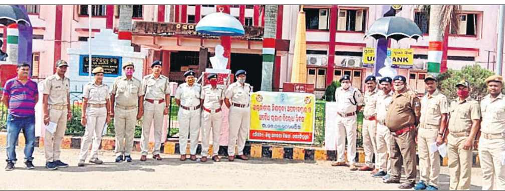
ଜିଲ୍ଲାପାଳଙ୍କ କାର୍ଯ୍ୟାଳୟ ପରିସର ପଡ଼ିଆରେ ଅବକାରୀ, ପୋଲିସ୍ ଅଧିକାରୀ ଓ କର୍ମଚାରୀମାନେ।

ରଖିବା ପାଇଁ ଯୁବପିଢ଼ିଙ୍କୁ ସତର୍କ ନ କଲେ ପରିସ୍ଥିତି ଅଶାନ୍ତ ହୋଇଯିବ। ତେଣୁ କେବଳ ଦିବସକୁ ପାଳନରେ ସୀମିତ ନ ରଖି ଏହାର କାର୍ଯ୍ୟକାରୀତା ଶେଷରେ ଅଧିକ ଯତ୍ନବାନ ହେବାକୁ ପଡ଼ିବ। ସରକାର ଓ ସଚେତନତା ଦ୍ୱାରା ହିଁ ମାନସ ସମାଜକୁ ନିଶା ସେବନରୁ ରୁକ୍ଷ ଦାୟିତ୍ୱ ନେବାର ଆବଶ୍ୟକତା ରହିଛି। ପରିବାର ଓ ସମାଜକୁ ସୁସ୍ଥ