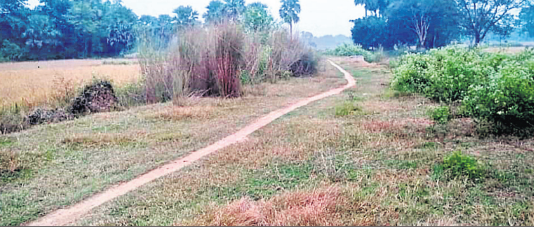
ରାସ୍ତା ନାହିଁ, ମିଥ୍ୟା ବିଲ୍ କରାଯାଇ ଅର୍ଥ ଆତ୍ମସାଦ ହୋଇଥିବା ସ୍ଥାନ ।

ନୟାଗଡ଼ ଜିଲା ଭାପୁର ବୁକର ହୋଇଥିବା ଫଳସ୍ୱରୂପ, ଗାଳ ଦସ୍ତଖତ, ବିଭିନ୍ନ ପ୍ରକାରର ଦୁର୍ନୀତିର ସ୍ୱତନ୍ତ୍ର ଅତିର୍ ୨୭ ଅର୍ଥାତ୍ ସୋମବାର ଉପରେ ହେବ । ରାଜ୍ୟ ପଞ୍ଚାୟତ ରାଜ ବିଭାଗର ସ୍ୱତନ୍ତ୍ର ଟିମ୍ ଏହି ଦୁର୍ନୀତିର ତଦନ୍ତ କରି ଜିଲାପାଳଙ୍କୁ ରିପୋର୍ଟ ଦେବେ ।