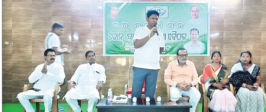
ବୈଠକରେ ଉପସ୍ଥିତ ବିଭିନ୍ନ ନେତାମାନେ।