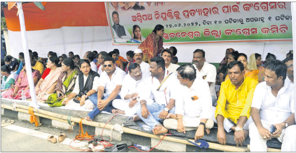
ଭୁବନେଶ୍ୱର ଜିଲ୍ଲା କଂଗ୍ରେସ କମିଟି ପକ୍ଷରୁ ସ୍ଥାନୀୟ ସର୍ବିକ୍ତ ହାଉସ ଛକଠାରେ ଅଗ୍ନିପଥ ଯୋଜନା ବିରୋଧରେ ସତ୍ୟାଗ୍ରହ କରାଯାଇଛି ।