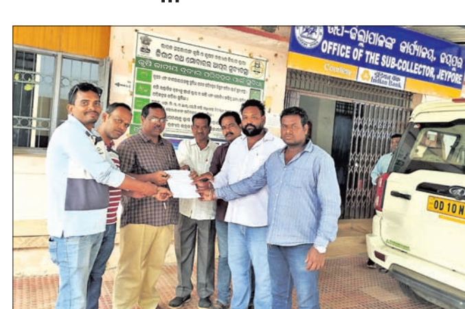
ଅଞ୍ଚଳବାସୀ ଦାବିପତ୍ର ଦେଉଛନ୍ତି।

କନ୍ଦପୁର ରଥଯାତ୍ରା ସମୟରେ ରଥରେ ଅଶ୍ଵୀନ ଗୀତ ବନ୍ଦ କରିବାକୁ ଦାବି ହୋଇଛି। କନ୍ଦପୁରବାସୀ ଉପଜିଲ୍ଲାପାଳ ବେଦବର ପ୍ରଧାନଙ୍କୁ ଏକ ଦାବିପତ୍ର ପ୍ରଦାନ କରିଛନ୍ତି। କନ୍ଦପୁର ରଥଯାତ୍ରା ପ୍ରାୟ ୬ ଶହ ବର୍ଷ ଧରି ଚାଲିଛି। ପୂର୍ବେ ଏହା ସୁନ୍ଦର ଭାବେ ପରମ୍ପରା ଅନୁଯାୟୀ ଚାଲି ଆସୁଥିଲା। କିନ୍ତୁ କିଛି ବର୍ଷ ହେବ ଏହି ଯାତ୍ରା ବେଳେ ଅଶ୍ଵୀନ ଗୀତ ବୋଲାଯାଉଛି। କୋଠା ଉପରେ ଥିବା ସମସ୍ତ ଶ୍ରଦ୍ଧାକୁ ଏହା ଶୁଣିବାକୁ ବାଧ୍ୟ ହେଉଛନ୍ତି। ଏହା ସମସ୍ତଙ୍କ ମନକୁ ଆଘାତ ଦେଉଛି। ବିଶେଷ କରି ସାନ ରଥକୁ ମହିଳାମାନେ ଚାଖୁଥିବାରୁ