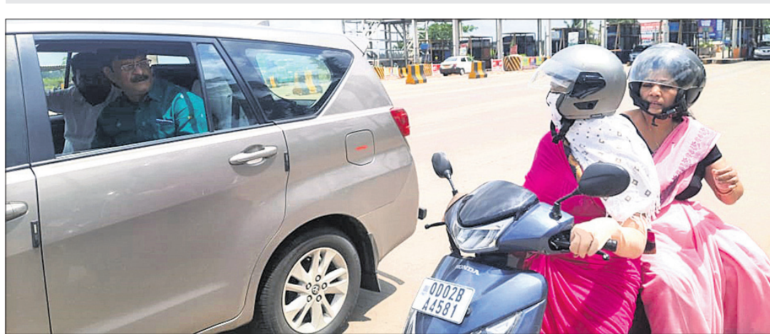
ପିପିଲି ଗୋଲଗେଟ୍ ନିକଟରେ ମନ୍ତ୍ରୀ ସମୀର ରଞ୍ଜନ ଦାଶ ୨ ଶିକ୍ଷୟିତ୍ରୀଙ୍କୁ ଅଟକାଇ ପଟରାଇଛନ୍ତି।

ପିପିଲି, ୨୭।୬ (ଡି.ଏନ.ଏ.) ଗଣଶିକ୍ଷା ମନ୍ତ୍ରୀ ସମୀର ରଞ୍ଜନ ଦାଶ ଗତ କିଛିଦିନ ହେବ ବିଭିନ୍ନ ବିଦ୍ୟାଳୟକୁ ଅତୀତକ ପରିଦର୍ଶନ କରି ଶିକ୍ଷକମାନଙ୍କ କାର୍ଯ୍ୟ ଓ ଛାତ୍ରାଛାତ୍ରୀଙ୍କ ପାଠପଢ଼ାକୁ ନେଇ ଯାଞ୍ଚ କରିଆସୁଛନ୍ତି। ଏହି ପରିପ୍ରେକ୍ଷାରେ