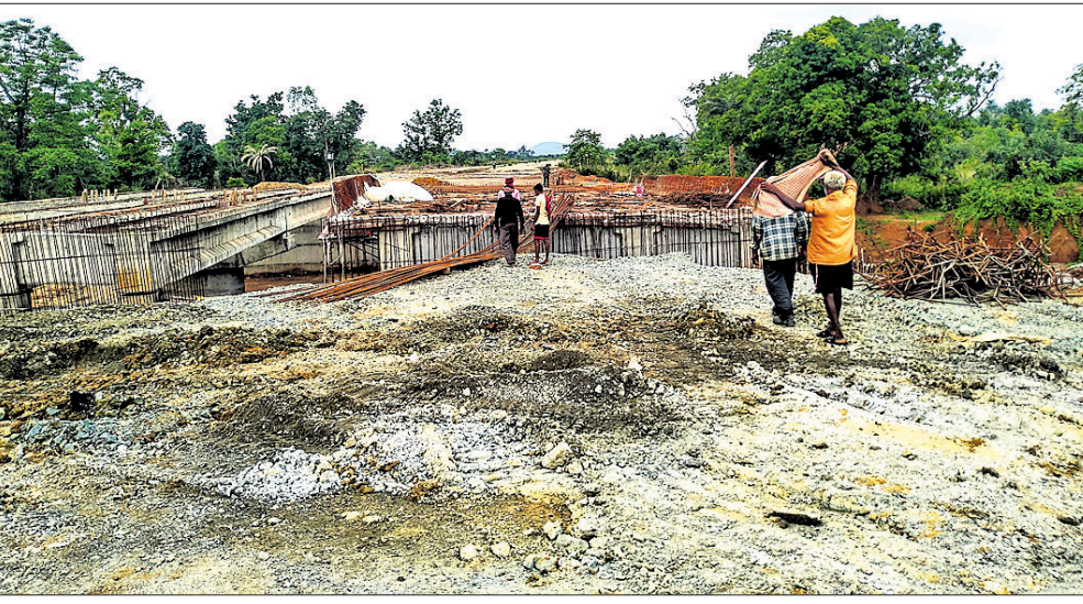
ଅସମ୍ପୂର୍ଣ୍ଣ ରହିଥିବା ରାସ୍ତା।

ଜମିନକିରା ସଦର ମହକୁମାରେ ଏନ୍ଏସଆଇ ପକ୍ଷରୁ ବାଲପାସ୍ ରାସ୍ତା କାମ ଚାଲିଛି। ୫ବର୍ଷ ପରେ ବି ଏହା ଶେଷ ହୋଇ ପାରିନାହିଁ। ଆଗାମୀ ୧ମାସ ମଧ୍ୟରେ କାମ ଶେଷ ନ ହେଲେ ରାଜରାସ୍ତା ଅବରୋଧ କରାଯିବ ବୋଲି ଜମିନକିରା ଆଞ୍ଚଳିକ ବିକାଶ ପରିଷଦ ପକ୍ଷରୁ ଚେତାବନା ଦିଆଯାଇଛି। ଏନ୍ଏସଆଇ ସମ୍ବଲପୁର ଡିଭିଜନ ପକ୍ଷରୁ ୨୦୧୭ରେ ସିନ୍ଦୂରପକ୍ଷଠାରୁ ଗୌଡ଼ପାଲି ଓ ଚିନିମୁଲୁଠାରୁ ଦେବଗଡ଼ ଜିଲ୍ଲା ଗୁଣେଇମୁରା ପର୍ଯ୍ୟନ୍ତ ରାସ୍ତାକୁ ପୁଞ୍ଜିତ ଠିକା ସଂସ୍ଥାକୁ କାର୍ଯ୍ୟଦେଖ ଦିଆଯାଇଥିଲା। ତେବେ ସମ୍ପୂର୍ଣ୍ଣ ସଂସ୍ଥା ଠିକ୍ରେ କାମ ନ କରିବାରୁ ଏନ୍ଏସଆଇ ରାୟପୁରର ଏକ ଠିକା ସଂସ୍ଥାକୁ ୨୦୧୯ରେ କାର୍ଯ୍ୟଭାର ଦେଇଥିଲା। ଏହି ୪ଥାକିଆ ରାସ୍ତା ମଧ୍ୟରେ ଜମିନକିରା ବାଲପାସ୍ ମଧ୍ୟ ରହିଛି। ଏହି ରାସ୍ତା ଶେଷ ହେବାର ଅବଧି ୨ବର୍ଷ ରହିଥିଲା। ଇତିମଧ୍ୟରେ ୫ବର୍ଷରୁ ଅଧିକ ସମୟ ବିତିଯାଇଥିବା