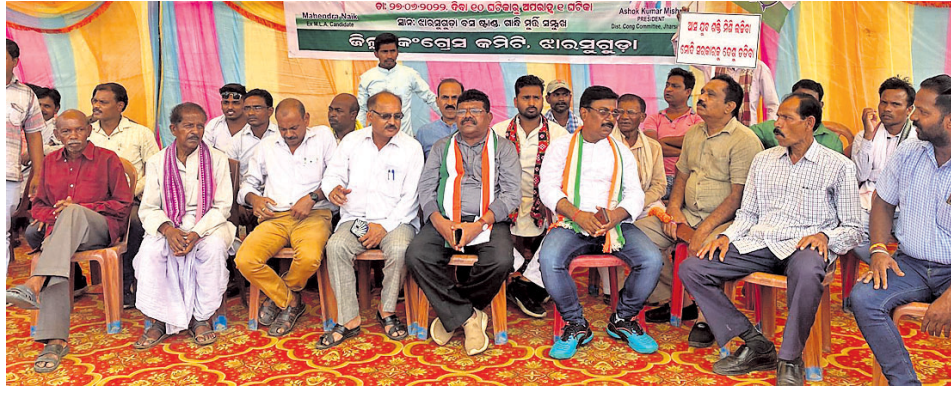
ଝାରସୁଗୁଡ଼ା ଅଫିସ୍, ୨୭/୬

ଦେଶରେ ସୈନ୍ୟବାହିନୀକୁ ଯୋଜନାବଦ୍ଧ ଭାବେ ଦୂରକ କରିବାକୁ କେନ୍ଦ୍ର ଭାଙ୍ଗିବା ସରକାର ପ୍ରଚେଷ୍ଟା ଚଳାଇଛନ୍ତି । ଏହା କରିବାକୁ ଦିଆଯିବ ନାହିଁ । ଏ ନେଇ ସାରା ଦେଶରେ ନିଆଁ ଜଳୁଥିବାବେଳେ ରାଷ୍ଟ୍ରର ସ୍ୱାଧୀନତାକୁ ଏହାକୁ କେନ୍ଦ୍ର ସରକାର ପ୍ରତ୍ୟାହାର