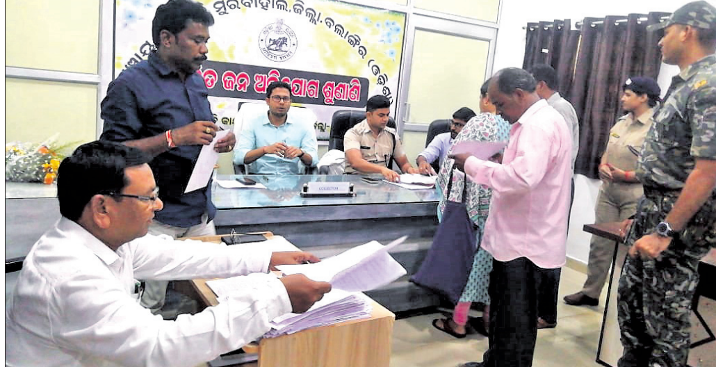
ଜନଶୁଣାଣି କାର୍ଯ୍ୟକ୍ରମରେ ଜନସାଧାରଣ ଆପତ୍ତି, ଅଭିଯୋଗ ଜଣାଇଛନ୍ତି ।

ଥବା, ପୁରୁବାହାଳ ପଞ୍ଚାୟତ ହାଇସ୍କୁଲ ଫୁଲପୁରରେ ବ୍ୟକ୍ତିଗତ ସହାୟତା ଯୋଗାଇ ଦିଆଯାଇଥିଲା। ଏହାଛଡ଼ା ୮ ଜଣଙ୍କର ସମସ୍ୟାର ସମାଧାନ କରାଯାଇଛି ବୋଲି ବ୍ଲକ୍ ପ୍ରଶାସନ ପକ୍ଷରୁ ସୂଚନା ଦିଆଯାଇଛି। ସାମୁହିକ ମଧ୍ୟରେ ମୁଖ୍ୟତଃ ବ୍ଲକ୍ ଶିକ୍ଷା ଅଧିକାରୀଙ୍କ କାର୍ଯ୍ୟାଳୟର ଦୁରାବସ୍ଥା ଯାଞ୍ଚକୁ ଆବଶ୍ୟକ ଅନୁସାରେ ଅଧିକାରୀ ଓ କର୍ମଚାରୀ ନ ଥିବା, ୧୨୧୩ ଧରି ପୁରୁବାହାଳ ପ୍ରାଥମିକ ସ୍କାଲ୍‌କେନ୍ଦ୍ରକୁ ଗୋଷ୍ଠୀ ସାନ୍ଧ୍ୟକେନ୍ଦ୍ର ମାନ୍ୟତା ମିଳିଥିଲେ ହେଁ ଆବଶ୍ୟକ ଡାକ୍ତର ପଦବୀ ଖାଲି ପଡିବା, ପୁରୁବାହାଳ ରେଳଷ୍ଟେସନ୍ ଠାରୁ ବ୍ଲକ୍ ପର୍ଯ୍ୟନ୍ତ ପହଞ୍ଚାଯାଉ ନ