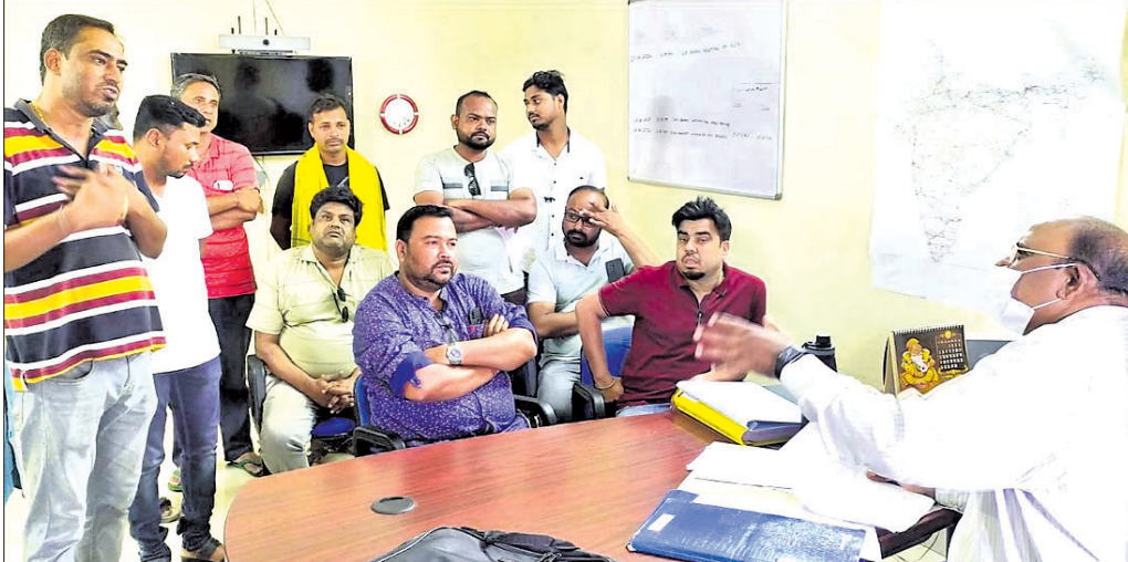
ଏନ୍ଏସଆଇ ପିଡିକୁ ଦାବିପତ୍ର ଦିଆଯାଇଛି।

ରାଷ୍ଟ୍ରାକାମ ନିମ୍ନମାନର ଅଭିଯୋଗକରି ସୋମବାର ପଢ଼ିଆବାହାଲ ଅଞ୍ଚଳବାସୀ ସମ୍ବଲପୁର ସାକ୍ଷାପତାନ୍ତର ଏନ୍ଏସଆଇ ଅଫିସ ଘେରାଉ କରିଛନ୍ତି। ପରେ ଏନ୍ଏସଆଇ ପିଡି ଭେକଟେସର ରାଓଙ୍କୁ ଭେଟି ଅଭିଯୋଗପତ୍ର ପ୍ରଦାନ କରିଛନ୍ତି। ଅଭିଯୋଗକ୍ରମେ ସମ୍ବଲପୁର-ଠିଲେଇବଣି ୫୩ନଂ. ଜାତୀୟ ରାଜପଥ କଡ଼ରେ ପଢ଼ିଆବାହାଲ ଛକ ରହିଛି। ଏବେ ଚାରିଆଡ଼ିଆ ରାସ୍ତା ନିର୍ମାଣ ଚାଲିଛି। ହେଲେ ରାସ୍ତା କାମ ନିମ୍ନମାନର ଓ ଭୁଲରେ ତ୍ରୁଟି ରହିଛି। ଫଳରେ ରାସ୍ତା ଭାଙ୍ଗିବାକୁ ବସିଲାଣି। ରାସ୍ତା ପାର୍ଶ୍ୱରେ ଫୁଲ୍‌ପଥ ଓ ଡ୍ରେନ୍ ନିର୍ମାଣ କରାଯାଇ ନାହିଁ। ସାମାନ୍ୟ ବର୍ଷା ହେଲେ ରାସ୍ତାପାର୍ଶ୍ୱରେ ଥିବା ଦୋକାନ ଓ ଘର ଭିତରକୁ ପାଣି ପଶି ସମସ୍ତା ନଷ୍ଟ ହେଉଛି। ରାସ୍ତା ନିର୍ମାଣ ସମୟରେ ଡ୍ରେନ୍ ନିର୍ମାଣ କରିବାକୁ ଦାବି କରାଯାଇଥିଲା। ହେଲେ ଠିକା ସଂସ୍ଥା କେବଳ ପ୍ରତିଶ୍ରୁତି ଦେଇ ରୁପ୍ ରହିଥିଲା। ପଢ଼ିଆବାହାଲ ଛକ ଅଞ୍ଚଳର ପୁଖ୍ୟ ବ୍ୟବସାୟିକ ପେଣ୍ଡୁଲୁ। ତେଣୁ ପ୍ରତିଦିନ ଭିଡ଼ ଲାଗି ରହିଥାଏ। ରାସ୍ତା କାମ ସମ୍ପୂର୍ଣ୍ଣ ନ ହେବାକୁ ପ୍ରାୟ ସମୟରେ ପ୍ରାଥମିକ କାମ ରହିଛି। ଫଳରେ ଯାତ୍ରା ଓ ଅଞ୍ଚଳବାସୀଙ୍କ ସମସ୍ୟା ହେଉଛି।